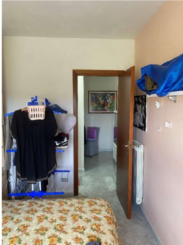
camera da letto singola