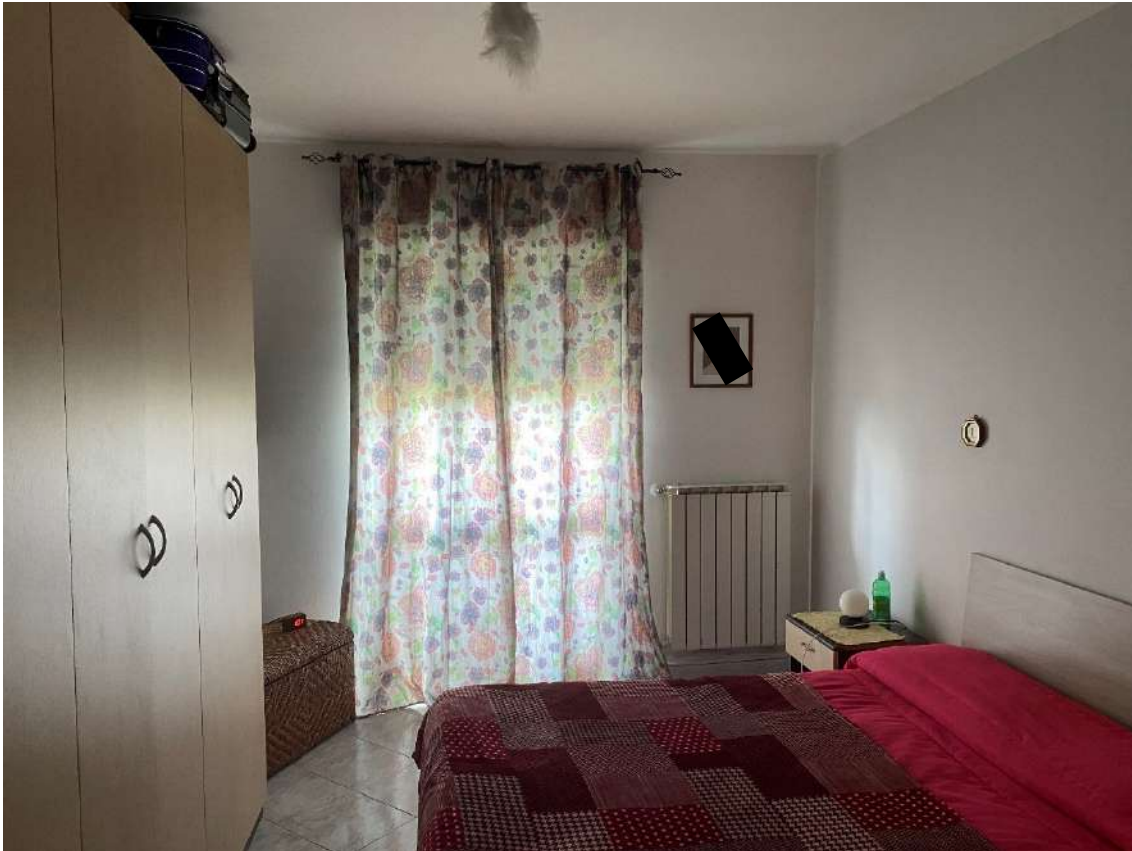
camera da letto matrimoniale