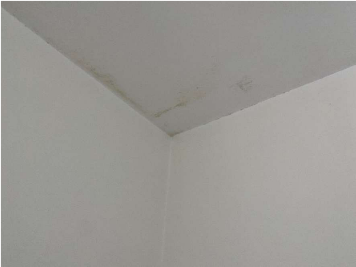
segni di umidità