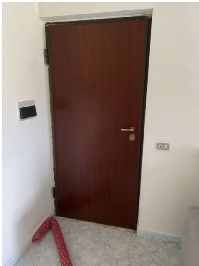
portoncino di ingresso