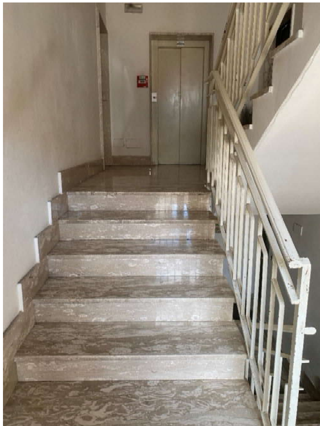
Scala dal piano terra al piano rialzato