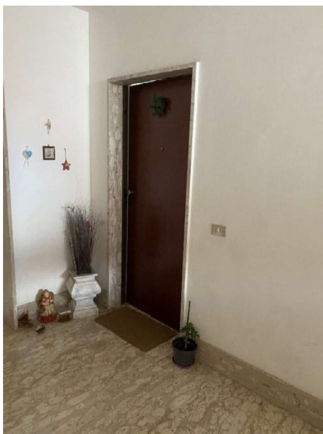
Portone di accesso all'abitazione