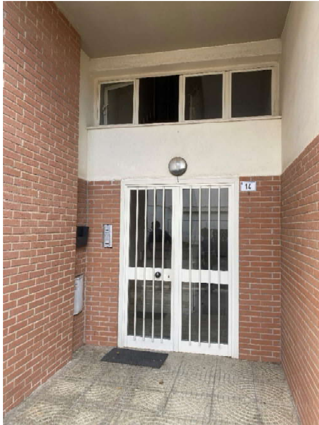
Portone di accesso alla scala condominiale (sud)