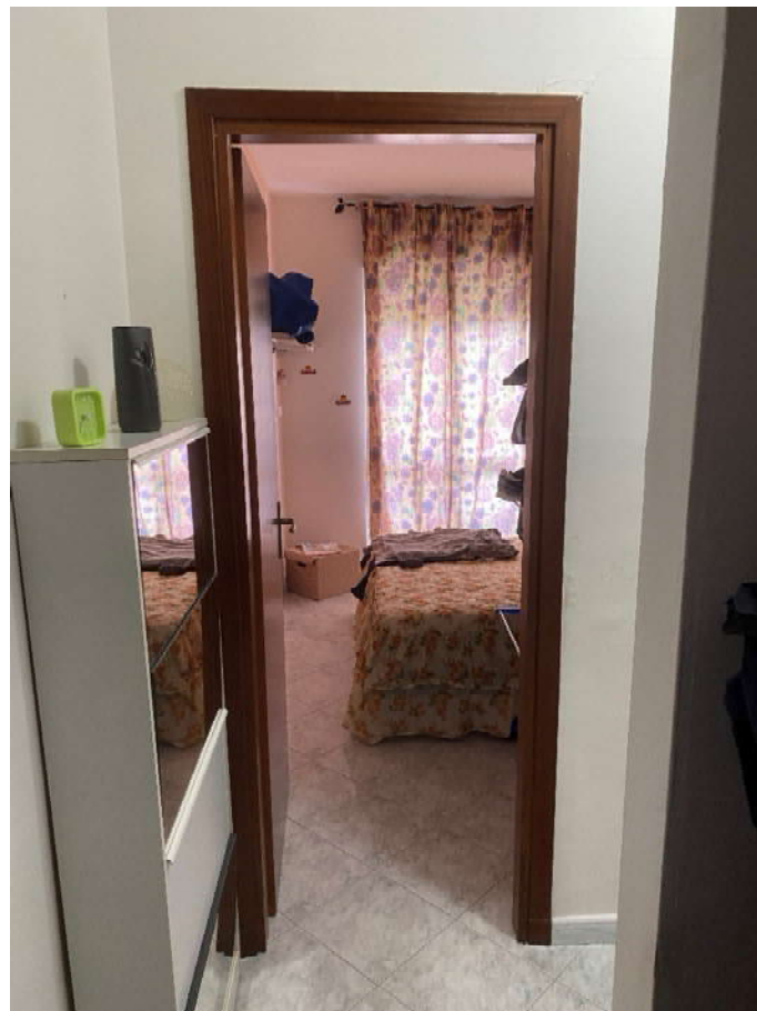
camera da letto singola