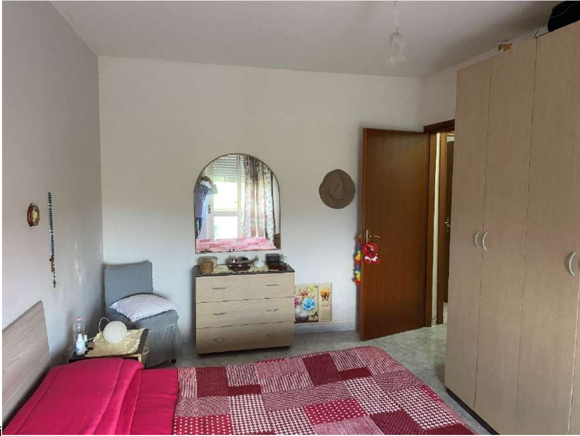
camera da letto matrimoniale