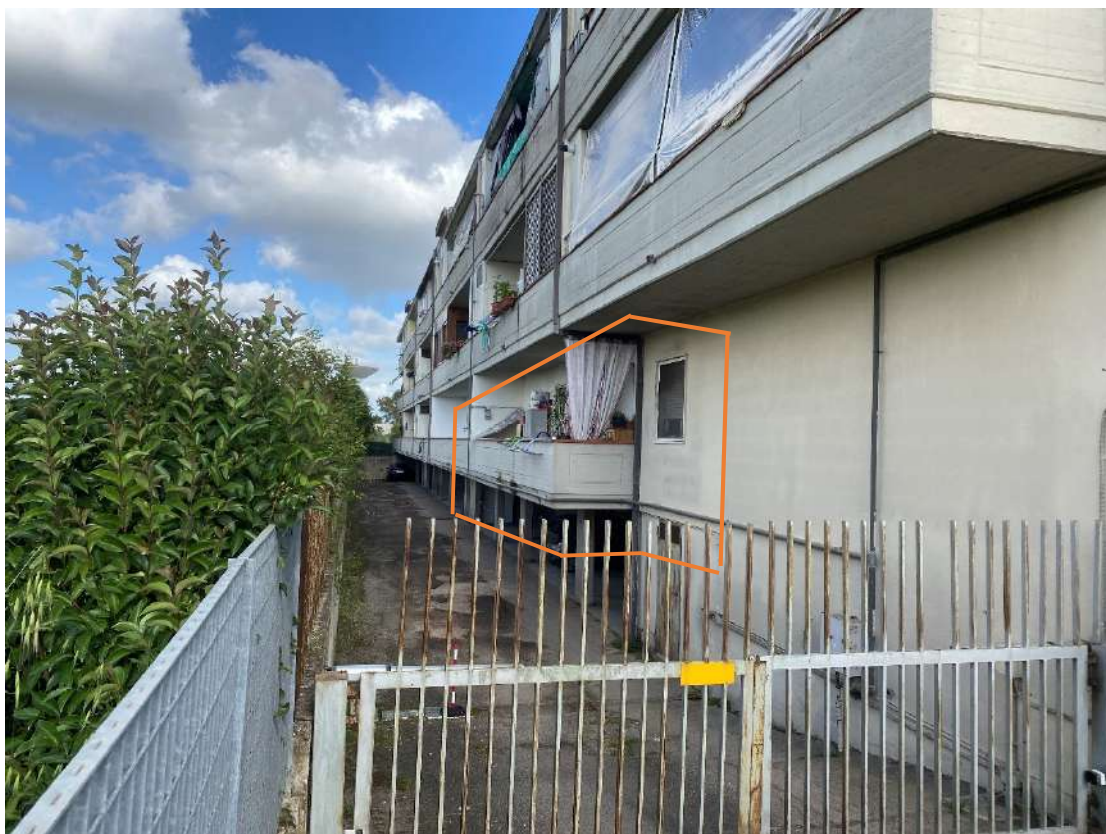
Prospetto lato nord