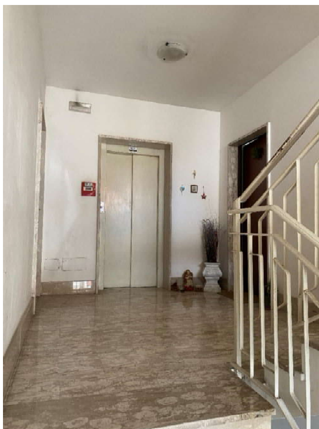
Pianerottolo di accesso all'abitazione