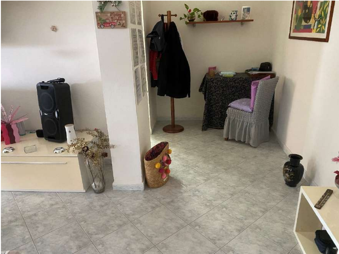
accesso zona notte