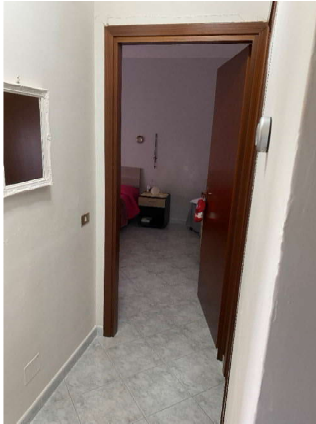
disimpegno zona notte