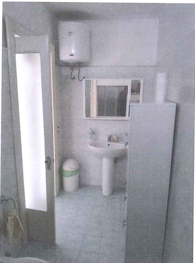
Foto 7 - bagno e antibagno