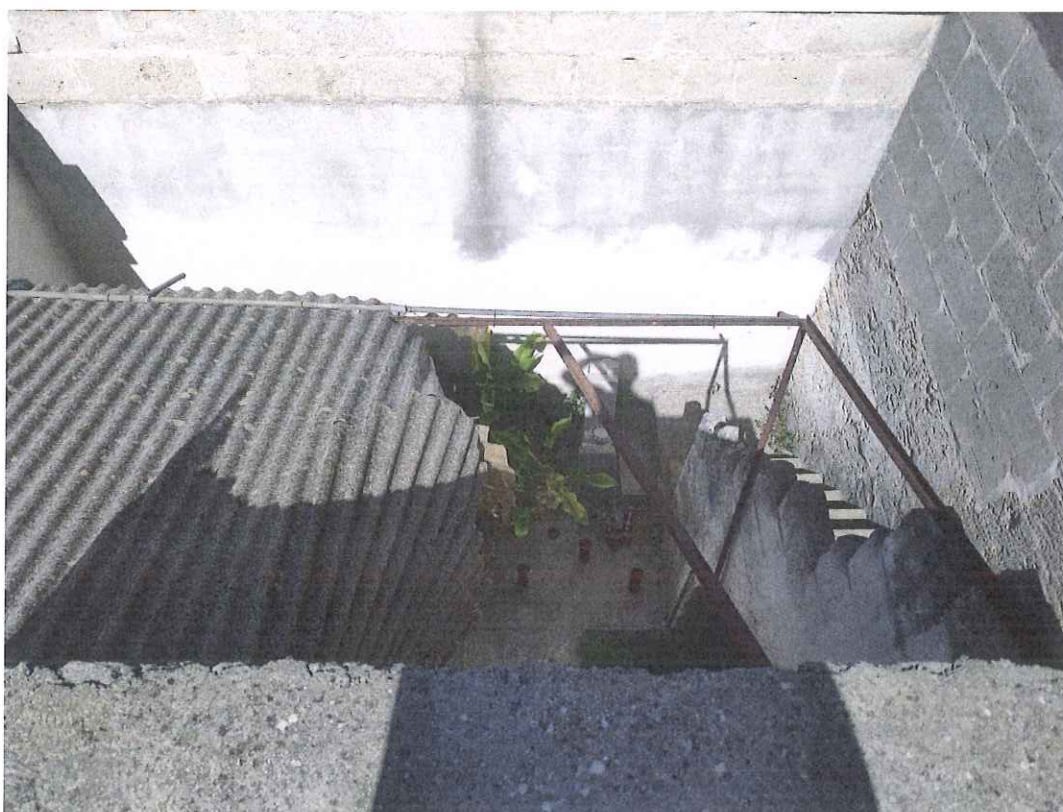
Foto 12 - ortale retrostante