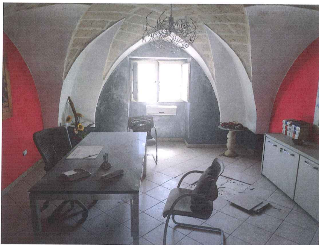
Foto 10 - un vano del piano ammezzato (utilizzato anch'esso come ufficio)