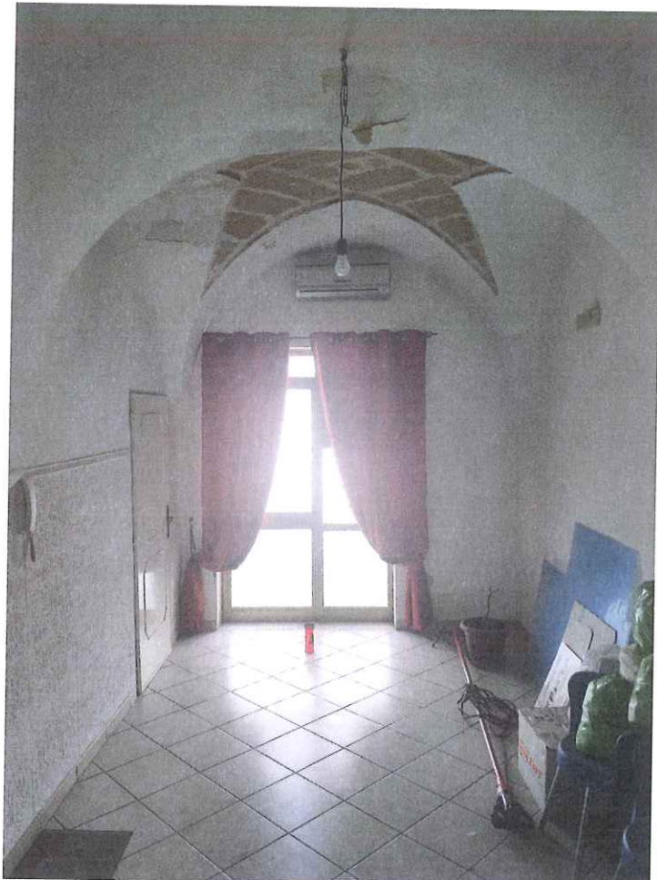
Foto 5 - soggiorno