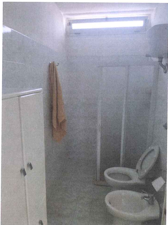
Foto 8 - altra vista del bagno