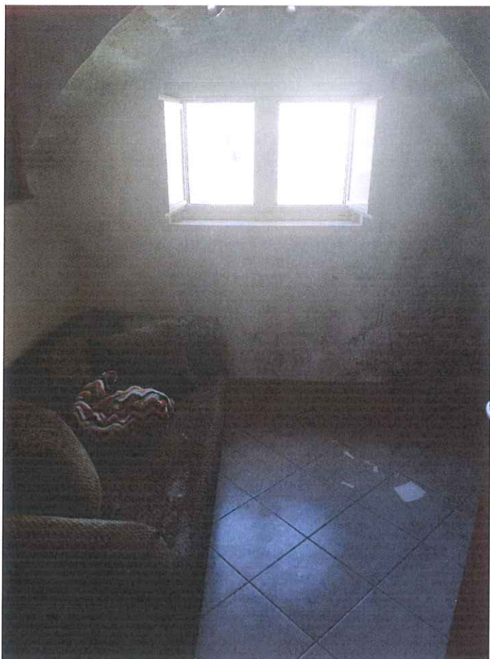
Foto 11 - altro vano al p. ammezzato