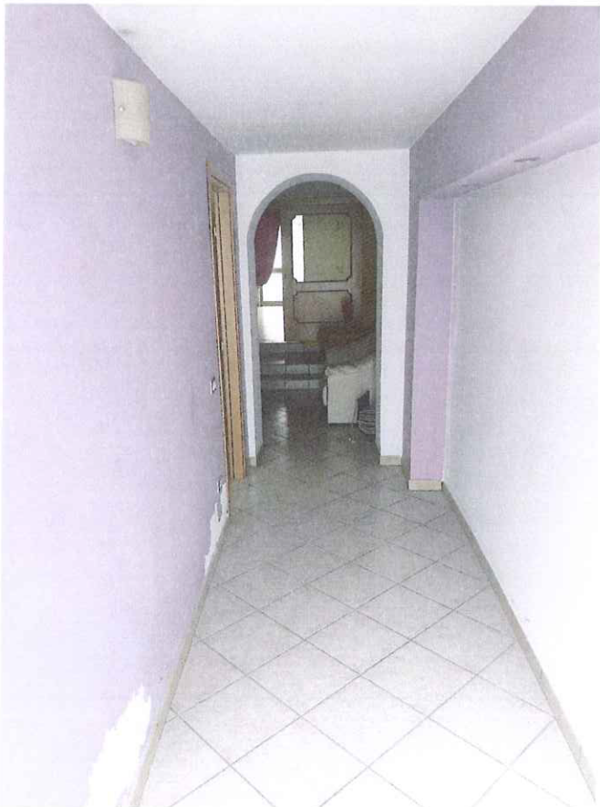
Foto 2 - Ingresso all'immobile esecutato