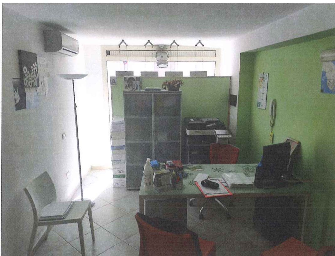
Foto 4 - vano autorizzato garage, ma utilizzato come ufficio