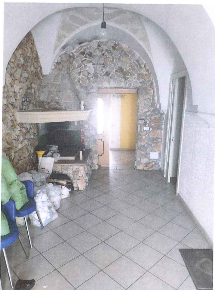
Foto 6 - altra vista del soggiorno