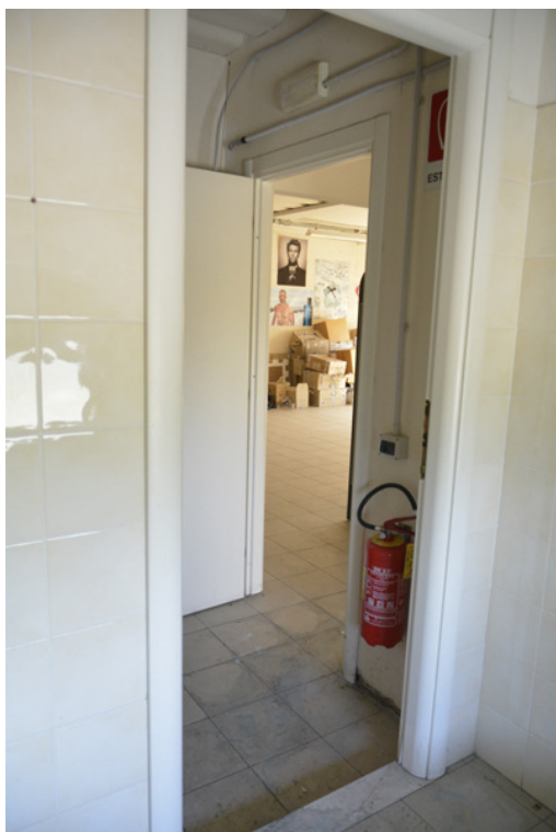
Antibagno e bagno