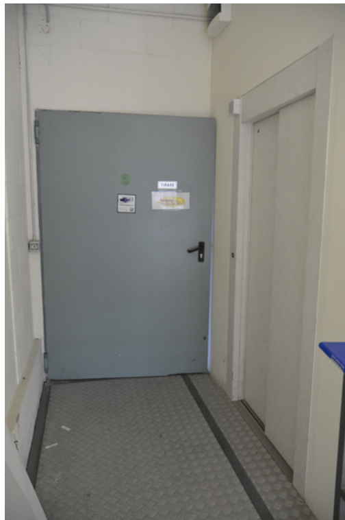
Ingresso al magazzino – sulla dx uscita dell'ascensore