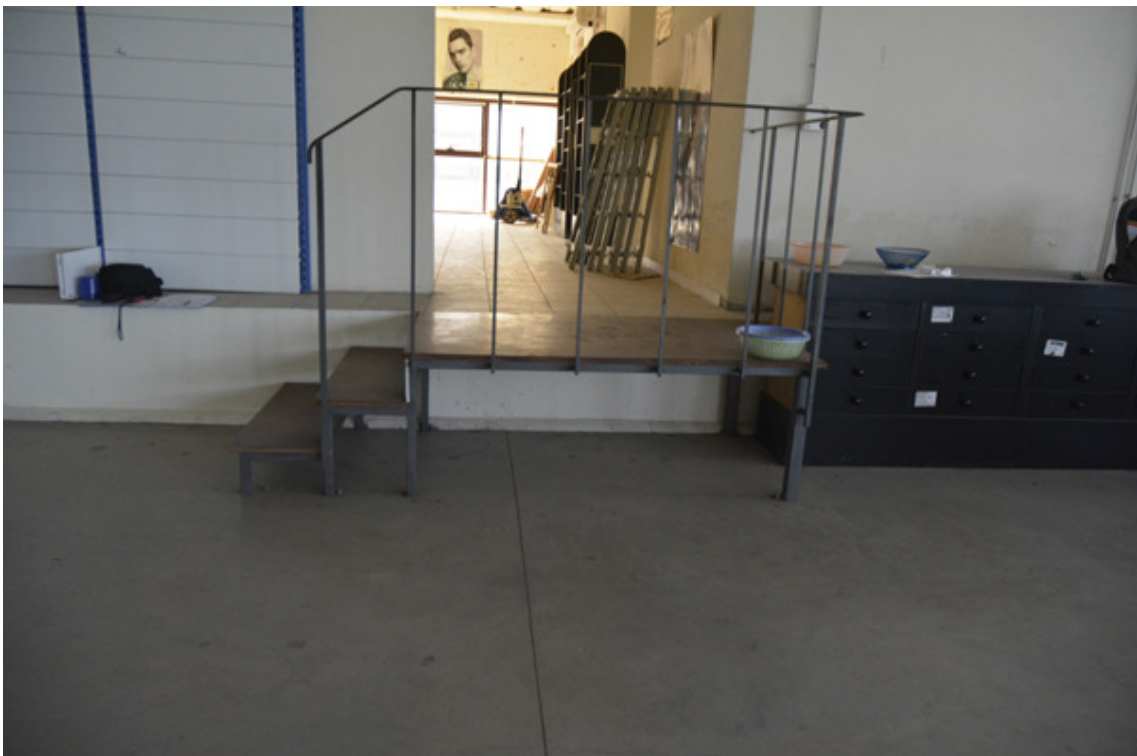
Dettaglio scaletta di accesso agli uffici