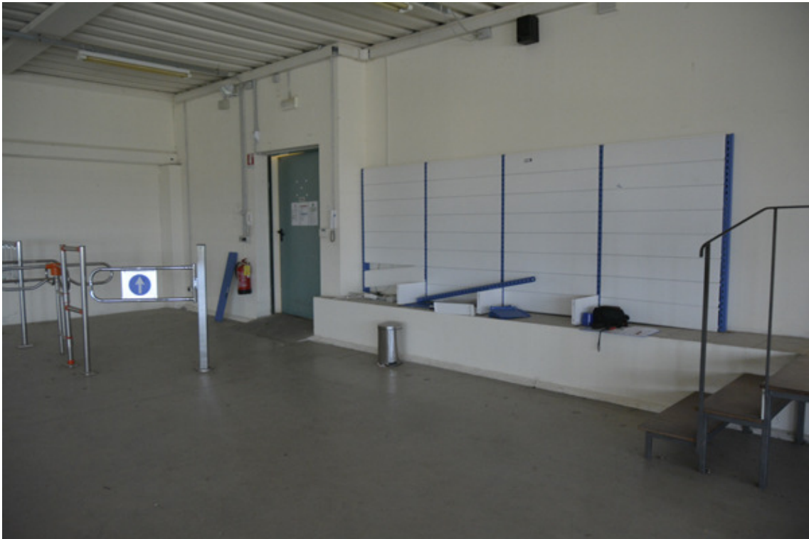
Vista zona di confine tra magazzino e uffici

Piena proprietà per l'intero di una porzione di fabbricato con uffici e magazzino, e piccolo resede esclusivo in Vecchiano, loc. Migliarino, Via del Feo C.F. Vecchiano F. 20 part. 409 sub 50, sub 51m sub 5 e sub 34 (foto giugno 2022)