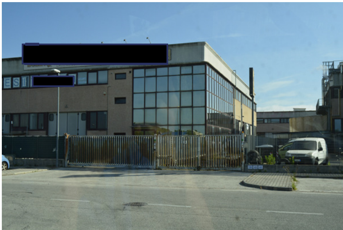
Vista cancello e prospetti sud-est e sud-ovest

Piena proprietà per l'intero di una porzione di fabbricato con uffici e magazzino, e piccolo resede esclusivo in Vecchiano, loc. Migliarino, Via del Feo C.F. Vecchiano F. 20 part. 409 sub 50, sub 51m sub 5 e sub 34 (foto giugno 2022)