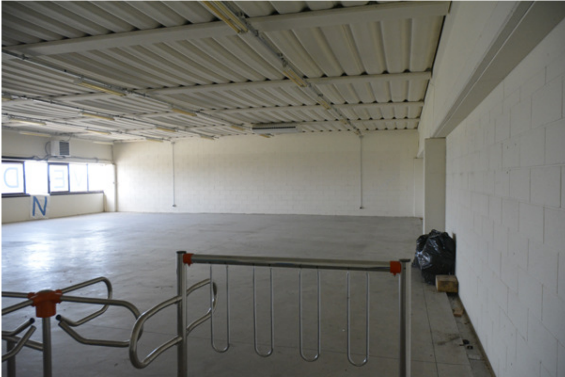
Vista magazzino dalla porta di ingresso

Piena proprietà per l'intero di una porzione di fabbricato con uffici e magazzino, e piccolo resede esclusivo in Vecchiano, loc. Migliarino, Via del Feo C.F. Vecchiano F. 20 part. 409 sub 50, sub 51m sub 5 e sub 34 (foto giugno 2022)