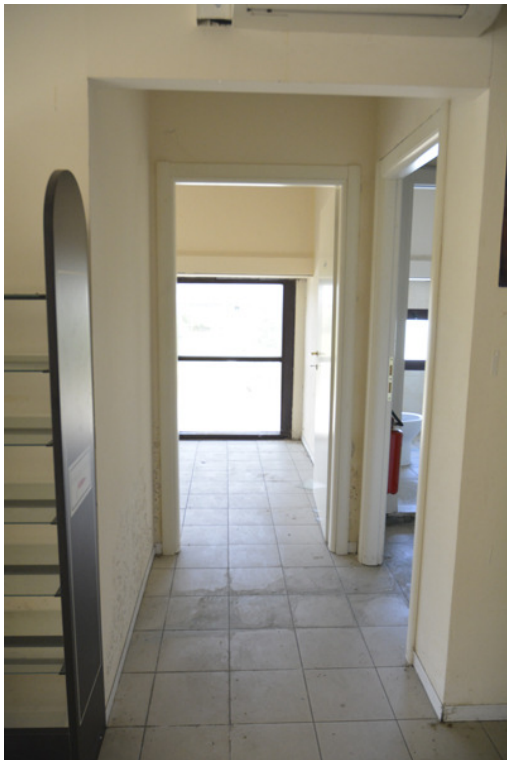
Disimpegno per antibagno e ufficio 3