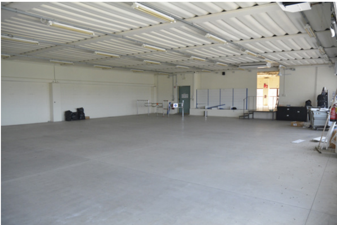
Vista magazzino verso zona uffici