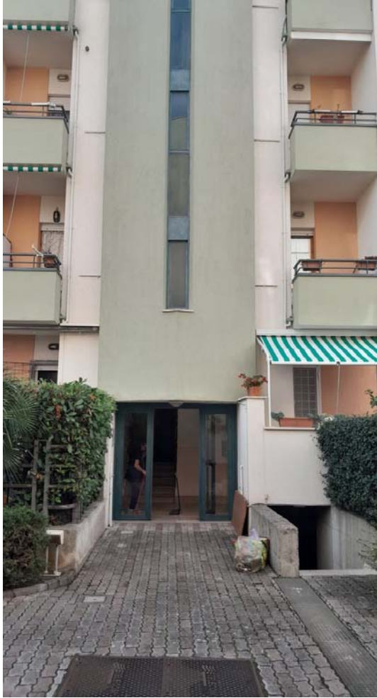
FOTO N. 3 – INGRESSO CONDOMINIALE VIALE DI SPAGNA civ.11, Scala “A”