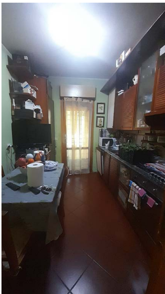
FOTO N. 13 - CUCINA