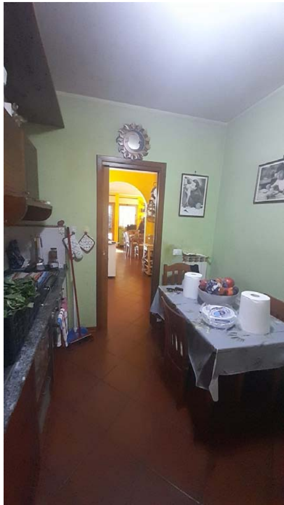
FOTO N. 14 - CUCINA