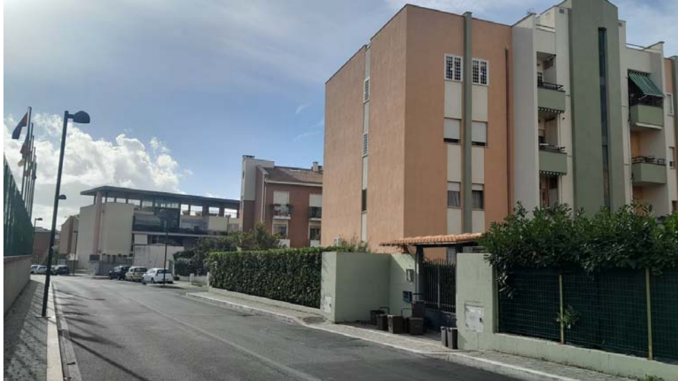
FOTO N. 1 VIALE SPAGNA civ. 11

Viale di Spagna, 11 - scala "A" - int.8 Fg.25, mapp.391, sub.37 e sub.46