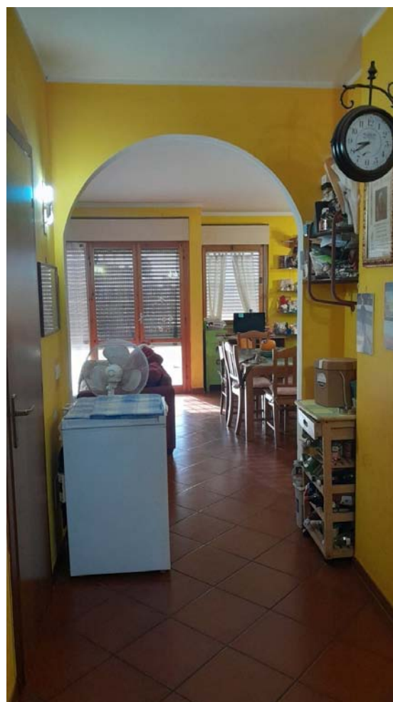
FOTO N. 10 - INGRESSO