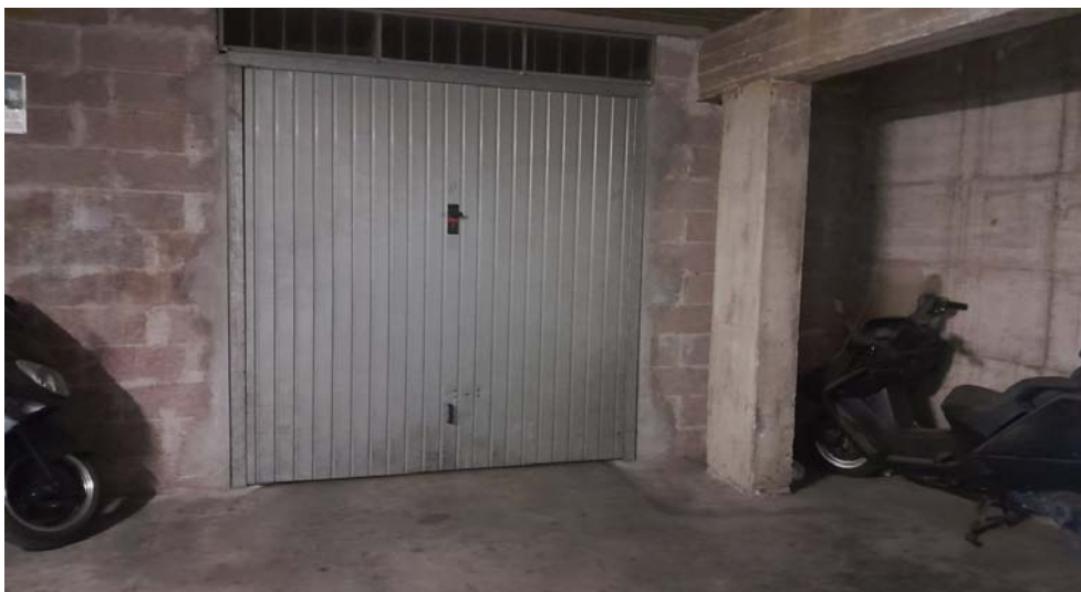
FOTO N. 6 – BOX AUTO, Fg.25, mapp. 391, sub. 46 POSTO AL PIANO S1