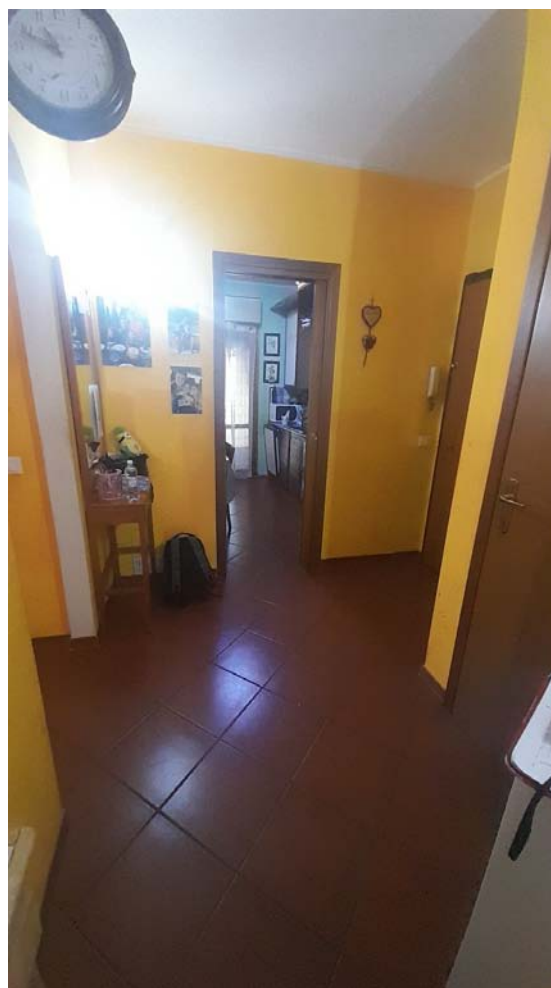
FOTO N. 22 - DISIMPEGNO