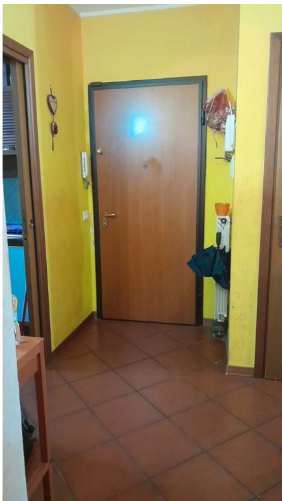
FOTO N. 9 – INGRESSO INTERNO ALLA U.I. POSTA AL PIANO TERZO - scala "A" - int.8 Fig.25, mapp.391, sub.37