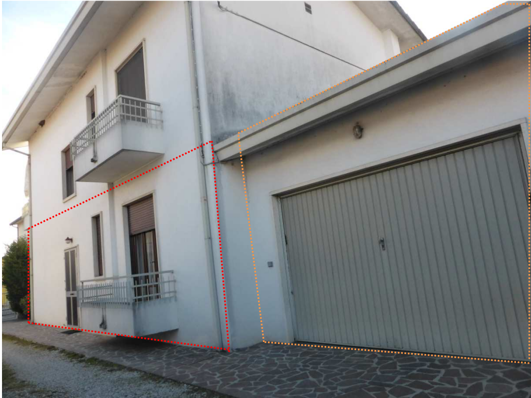
Foto 5: Vista prospettica del fabbricato immobiliare – appartamento ( sub 2 - poligono rosso), garage ( sub 1 - poligono arancione) oggetto di esecuzione.