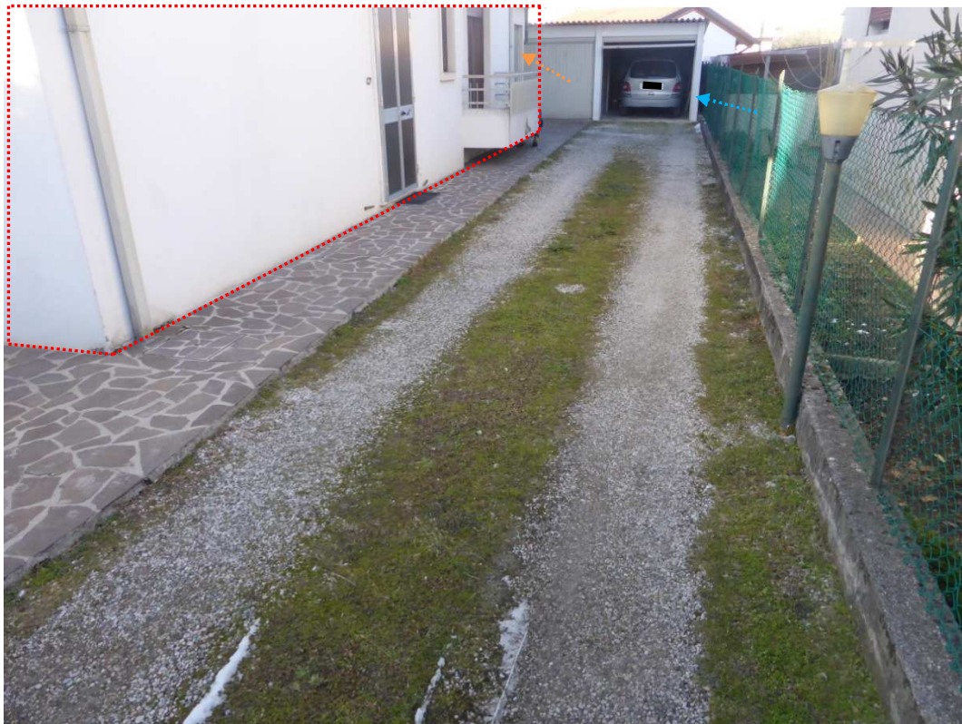
Foto 6: Vista prospettica del fabbricato immobiliare – appartamento ( sub 2 - poligono rosso), garage ( sub 1 - freccia arancione) oggetto di esecuzione, corpi accessori non sanabili (freccia blu).