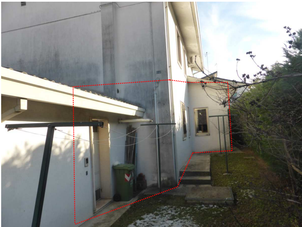
Foto 8: Vista prospettica del fabbricato immobiliare – appartamento (sub 2 - poligono rosso) oggetto di esecuzione.