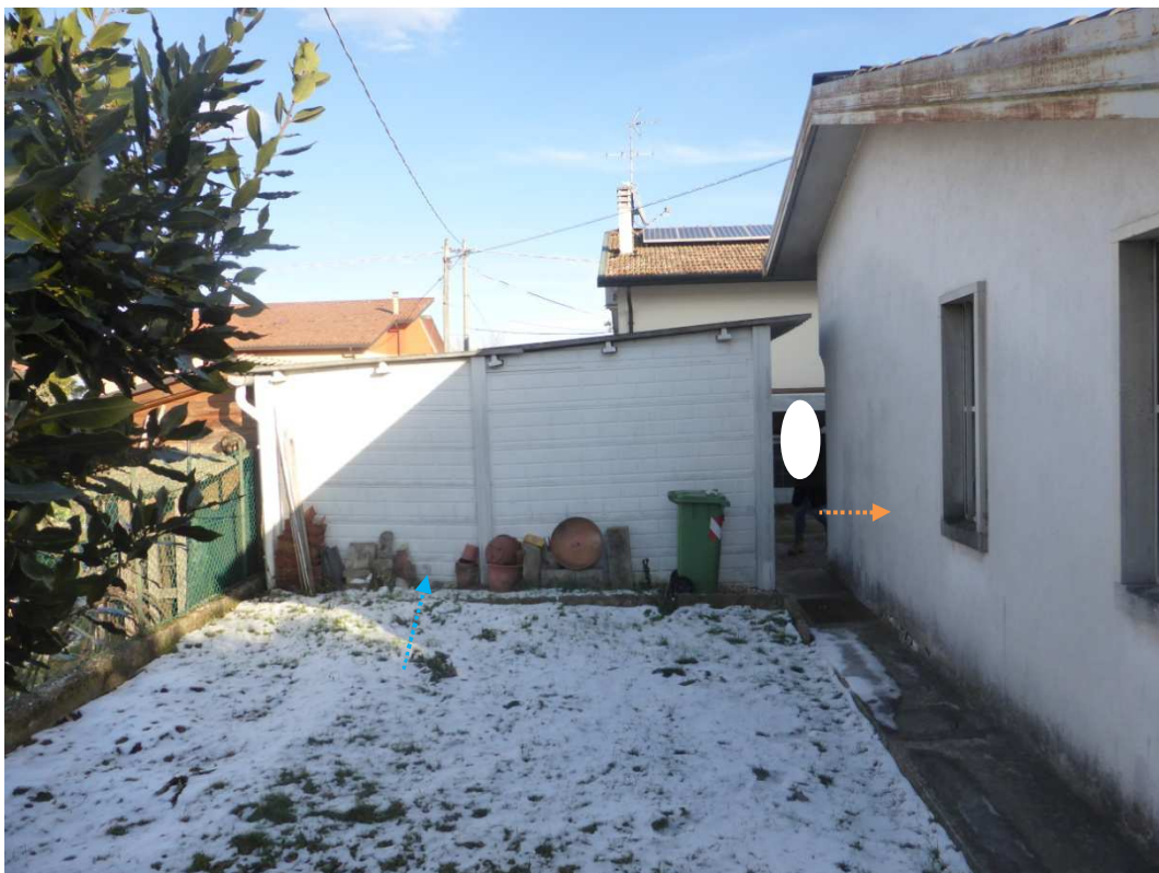
Foto 10: Vista prospettica del fabbricato immobiliare – garage (sub 1 – freccia arancione) ed , corpi accessori non sanabili (freccia blu).