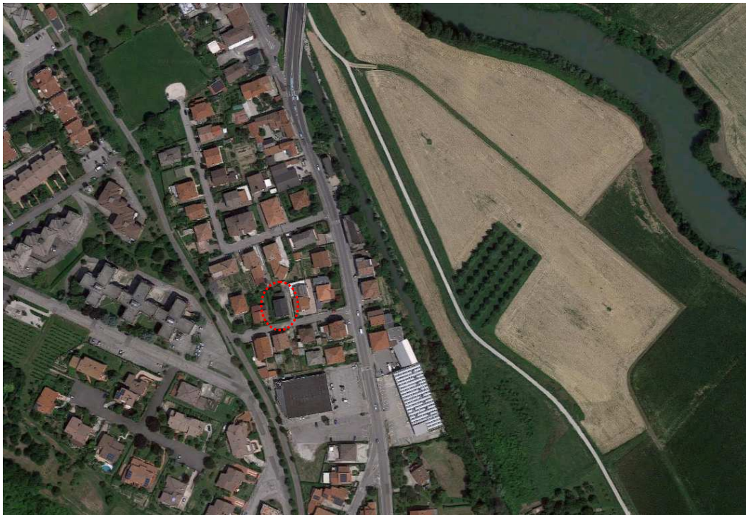
Foto 1: Mappa con individuazione fabbricato immobiliare (poligono rosso).