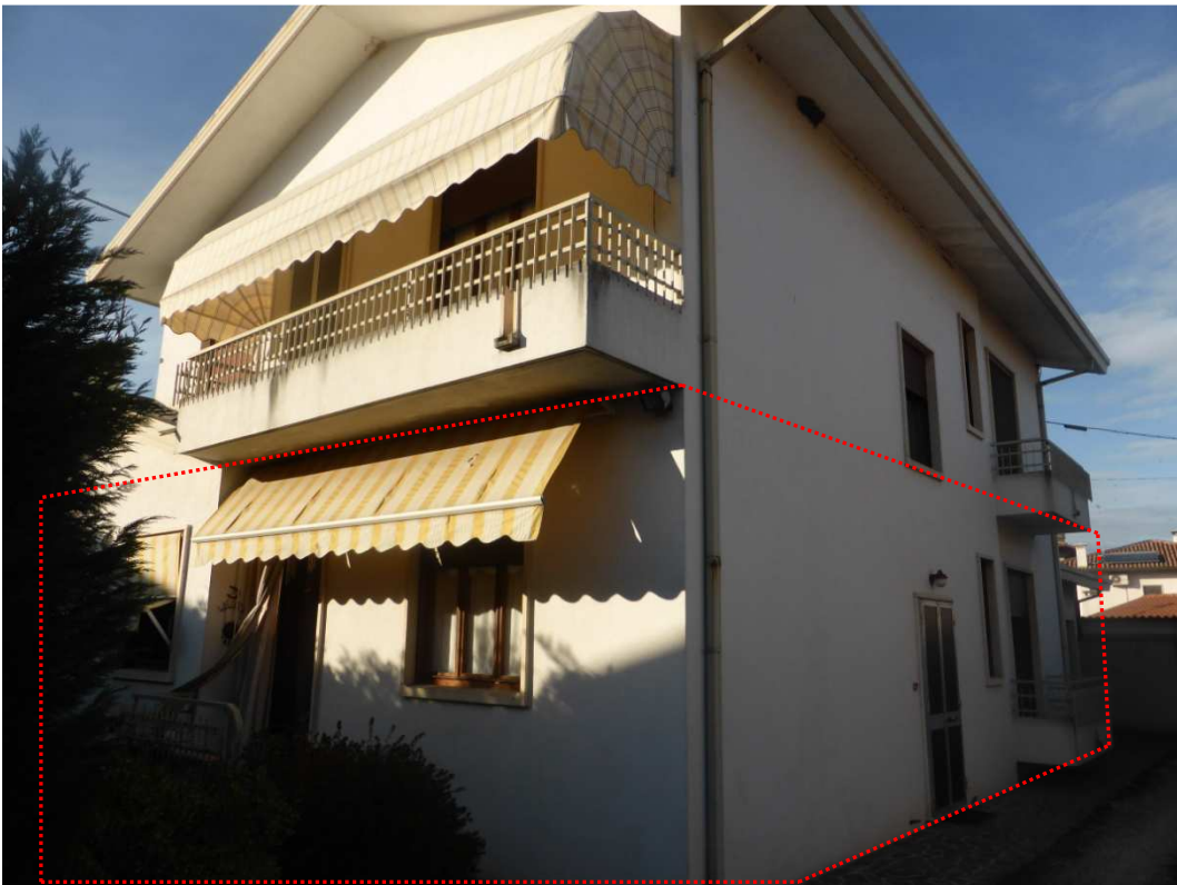
Foto 4: Vista prospettica del fabbricato immobiliare – appartamento oggetto di esecuzione (sub 2 - poligono rosso).