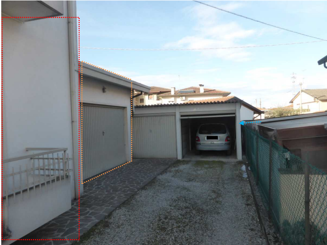
Foto 7: Vista prospettica del fabbricato immobiliare – appartamento (sub 2 - poligono rosso), garage (sub 1 - poligono arancione) oggetto di esecuzione, corpi accessori non sanabili (freccia blu)