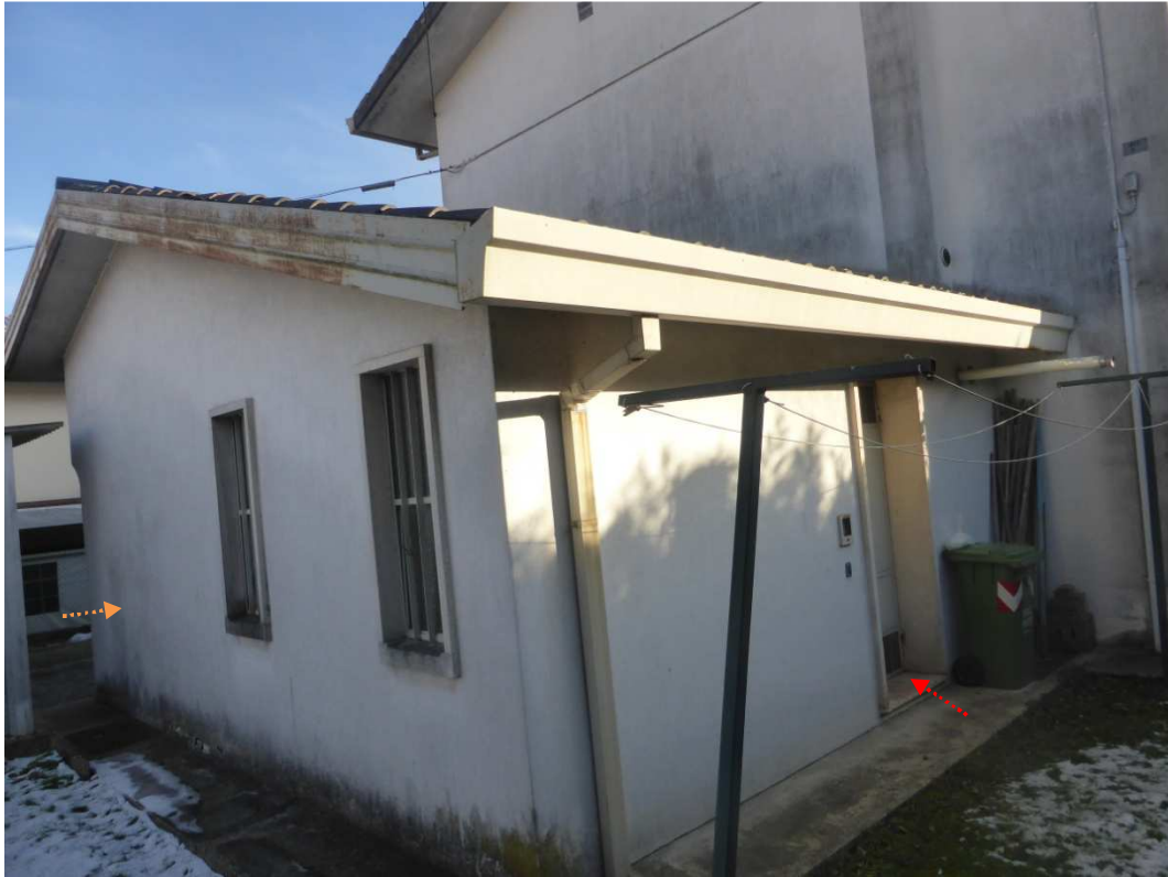
Foto 9: Vista prospettica del fabbricato immobiliare – centrale termica (sub 2 - freccia rossa) ed garage (sub 1 – freccia arancione).