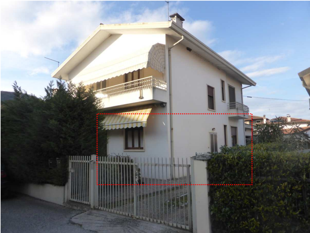
Foto 3: Vista prospettica del fabbricato immobiliare – appartamento oggetto di esecuzione (sub 2 - poligono rosso).