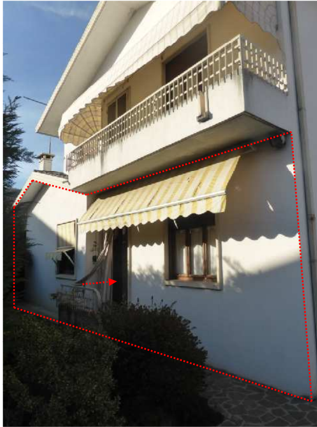
Foto 11: Vista prospettica del fabbricato immobiliare – appartamento oggetto di esecuzione (poligono rosso) – ingresso (freccia rossa).