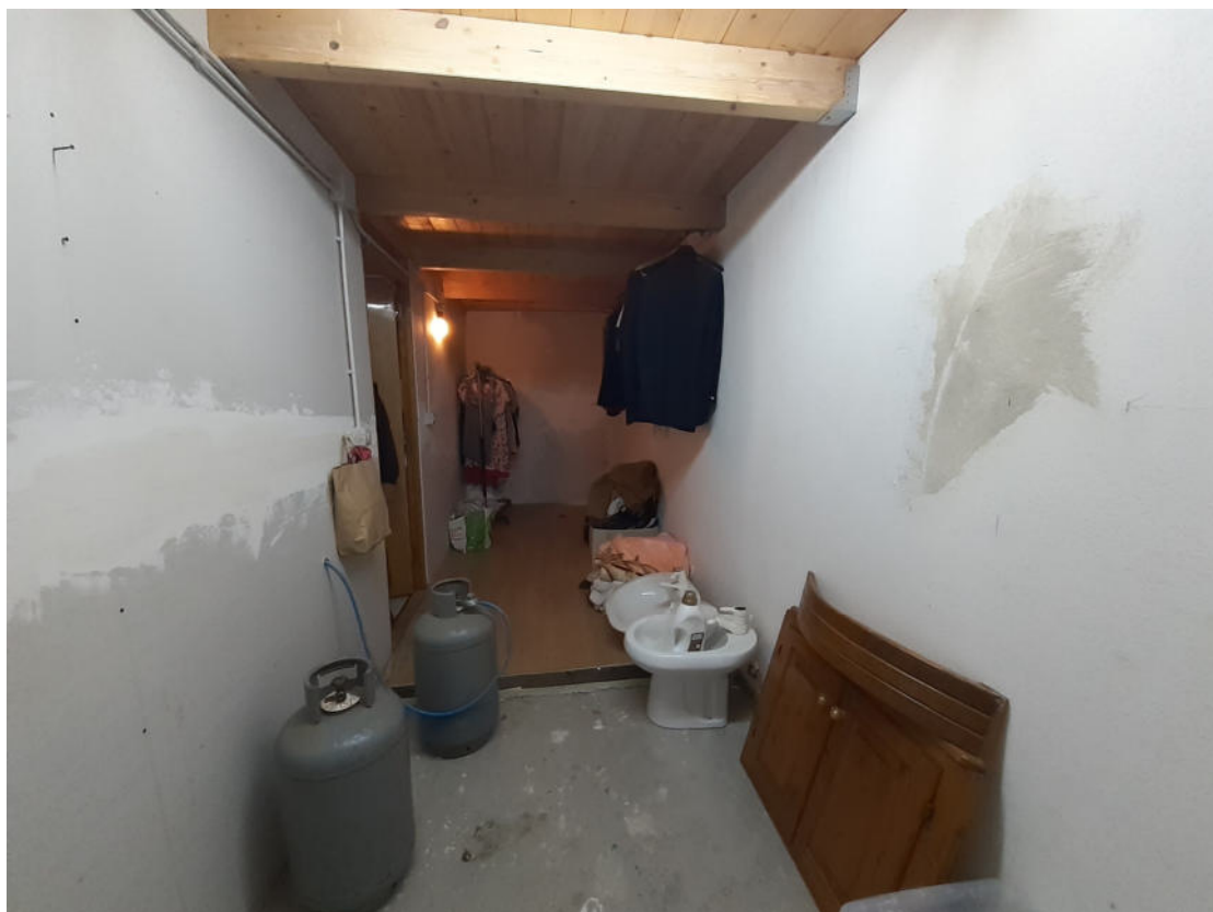
Immobile Fg. 12 Mapp. 1633 Sub 1 Rustico –Piano primo ammezzato