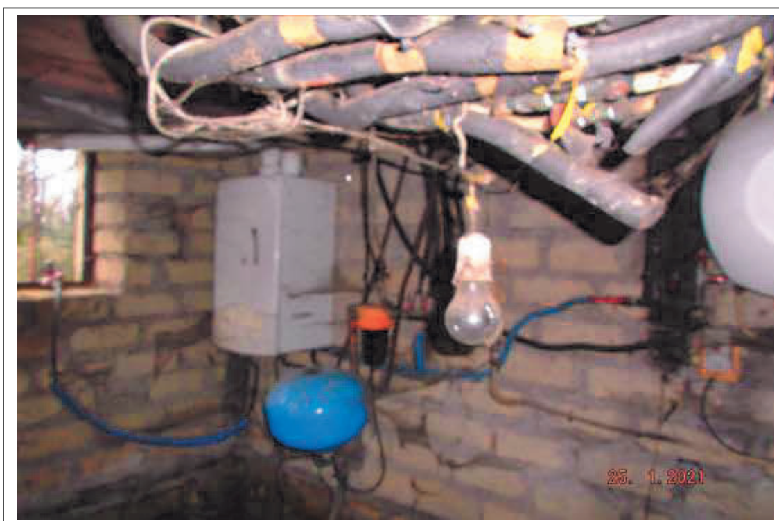
Foto n. 8 – Locali al P.T. del Fabbricato F. 47 p.lla 346 sub 2; Centrale termica non funzionante