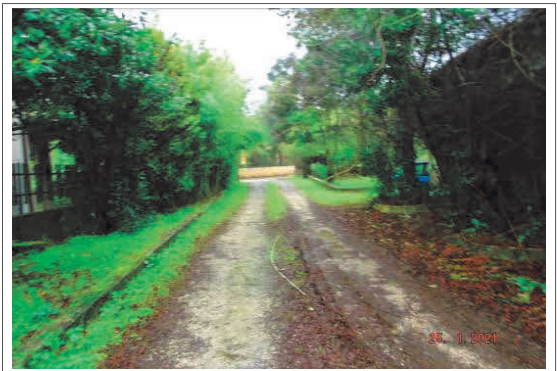
Foto n. 12 – Viale di accesso, visto dal fabbricato – (B.C.N.C.) F. 47 p.lla 346 sub 1