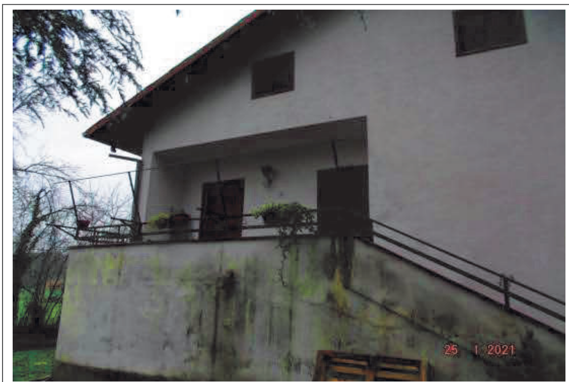
Foto n. 1 – Facciata principale del Fabbricato F. 47 p.lla 346 sub 2