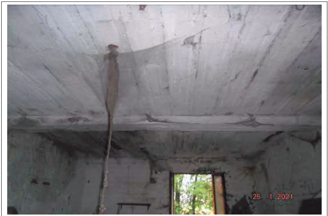
Foto n. 11 – Interno del Corpo accessorio uso deposito F. 47 p.lla 346 sub 3