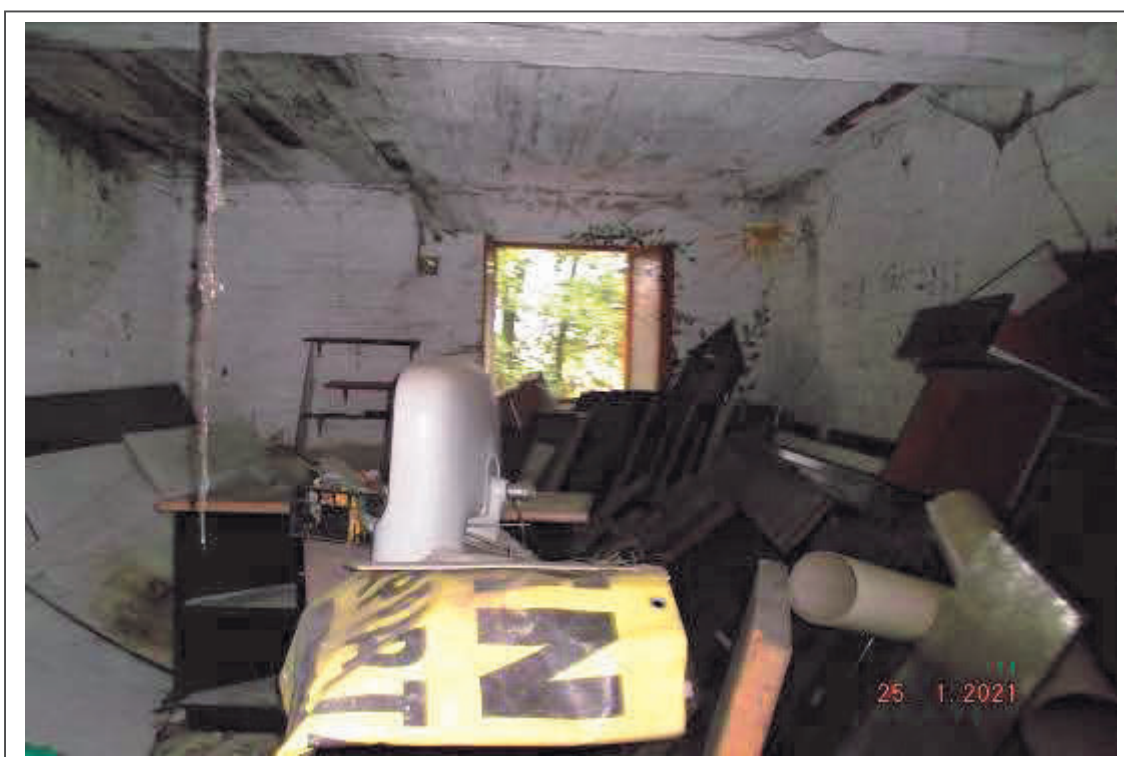
Foto n. 10 – Interno del Corpo accessorio uso deposito F. 47 p.lla 346 sub 3