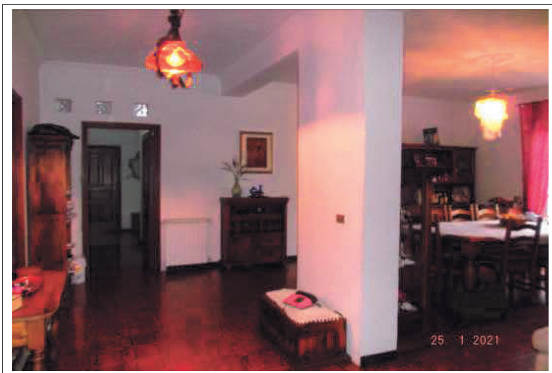
Foto n. 3 – Ingresso-soggiorno del Fabbricato F. 47 p.la 346 sub 2