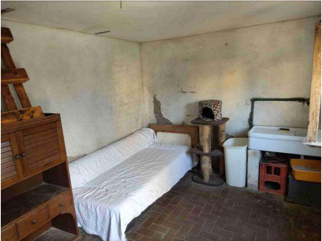
Fabbricato 2 - locale accessorio in cortile