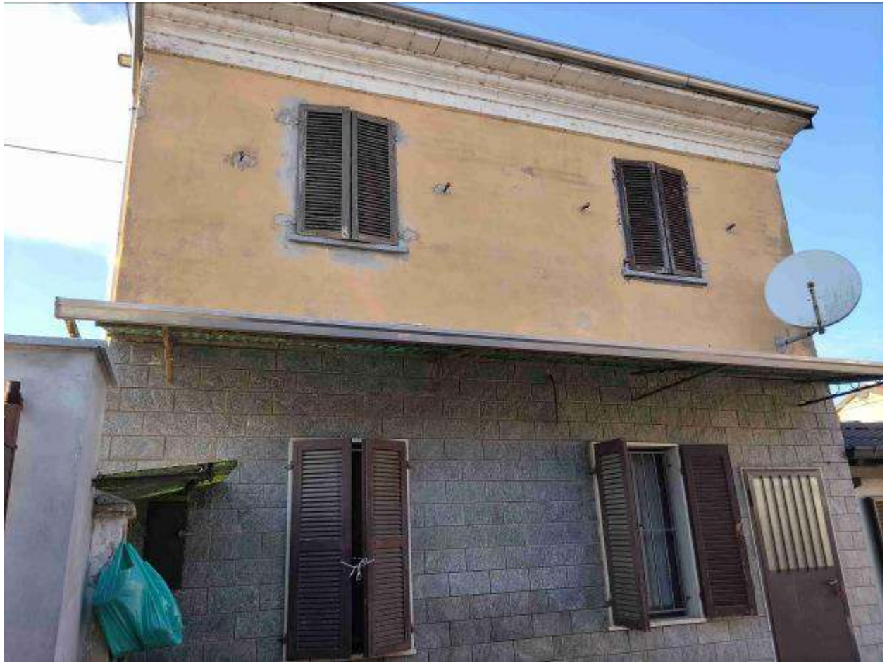
Fabbricato 1 civile abitazione