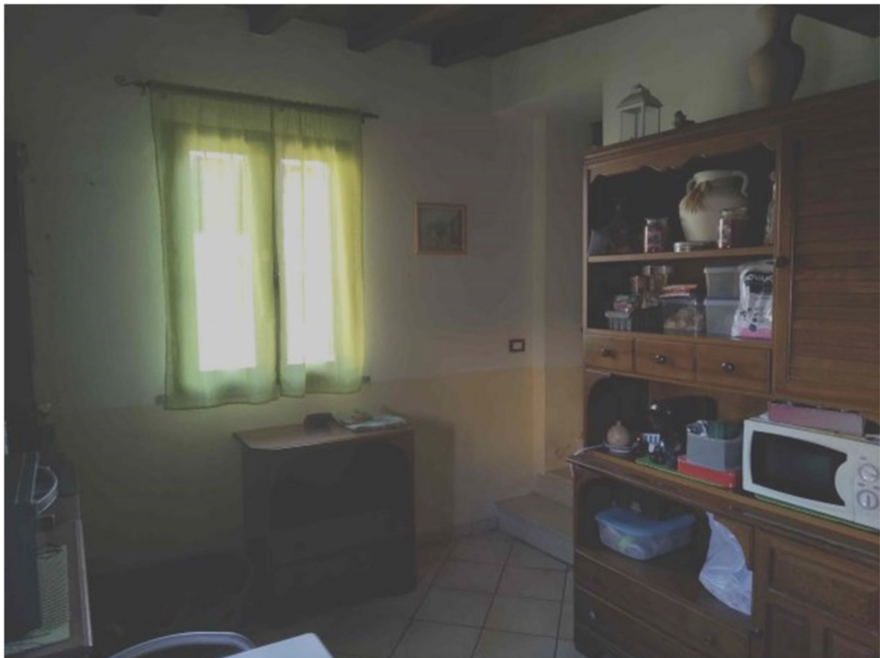
Cucina PT (autorimessa)