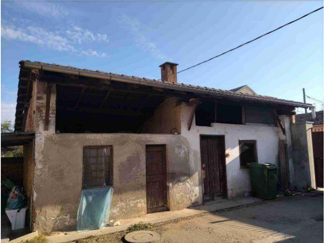
Fabbricato 2 locali accessori