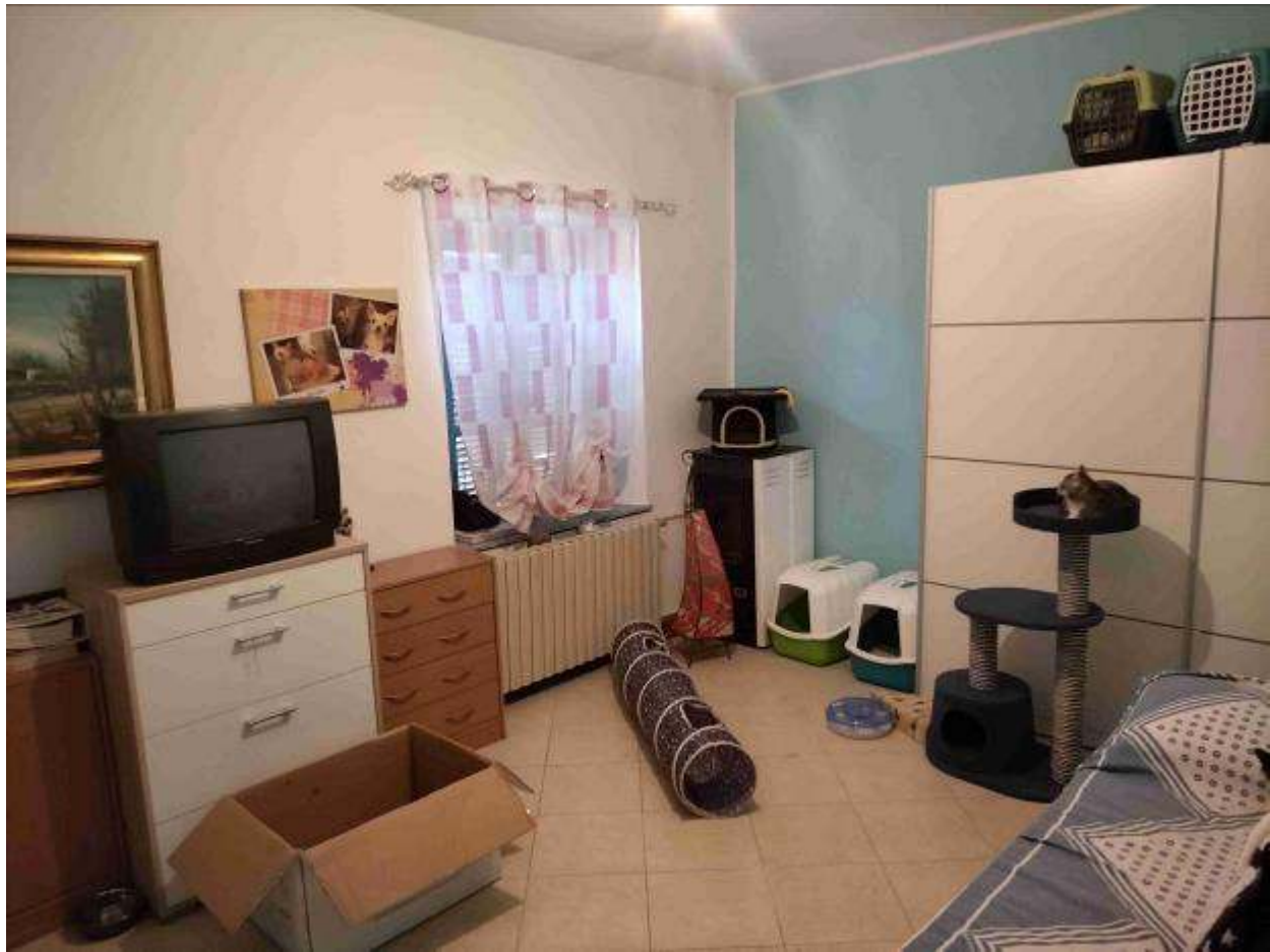
Camera 2 - 1P