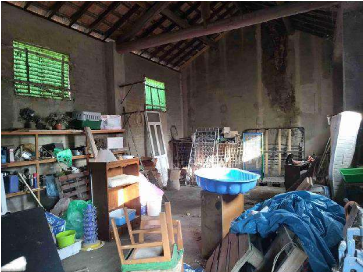
Locale 3 - deposito in cortile