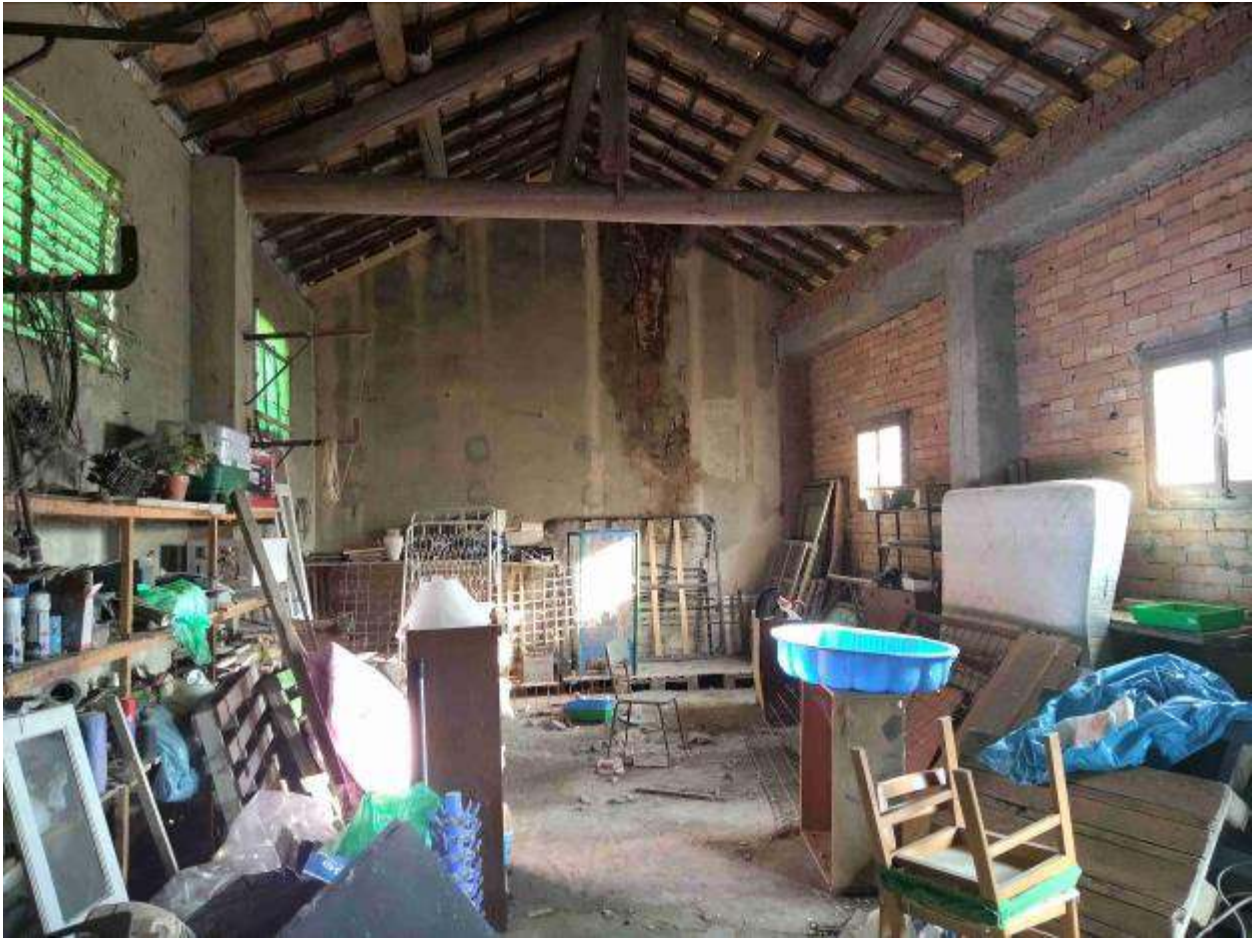
Locale 3 - deposito in cortile