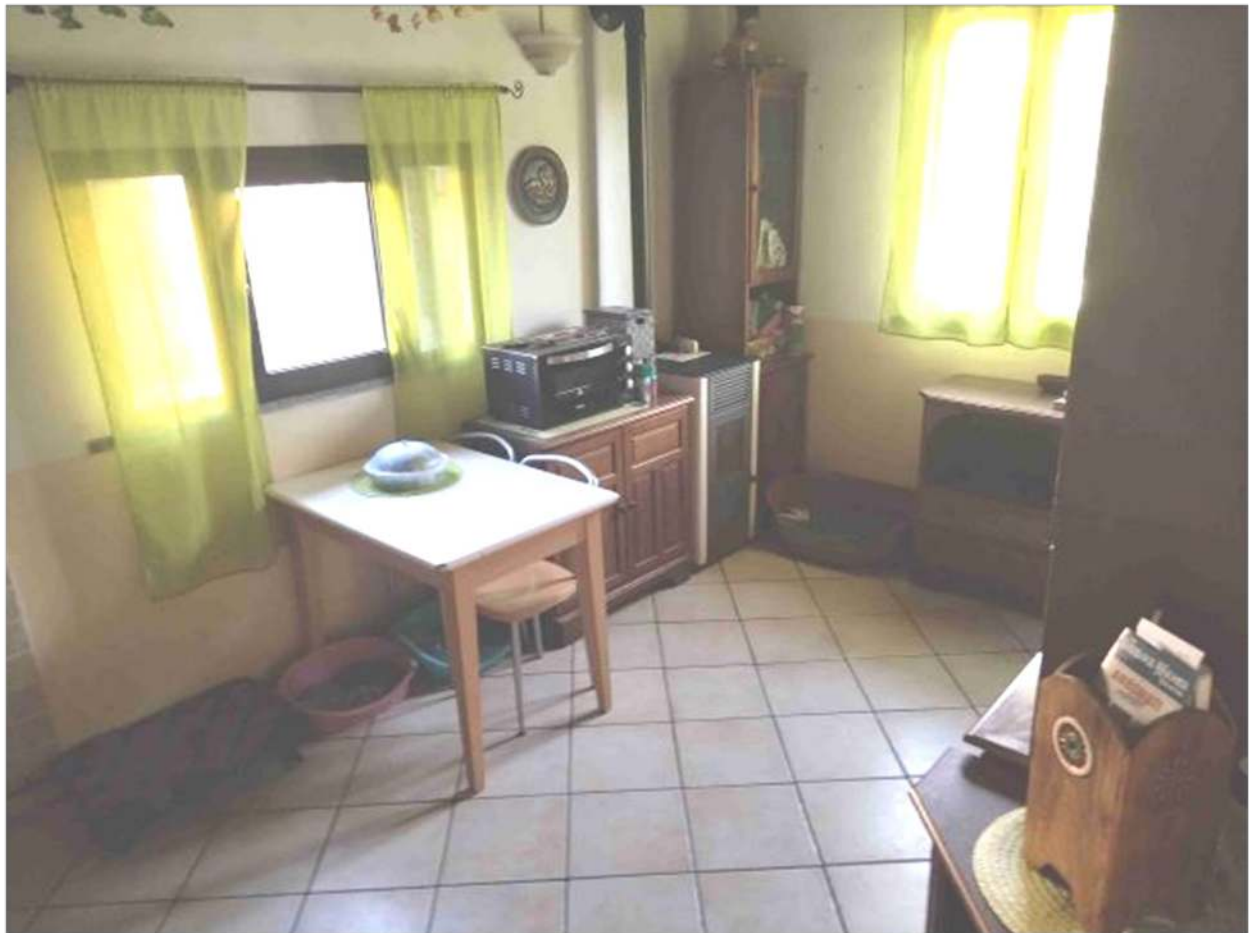
Cucina PT (autorimessa)