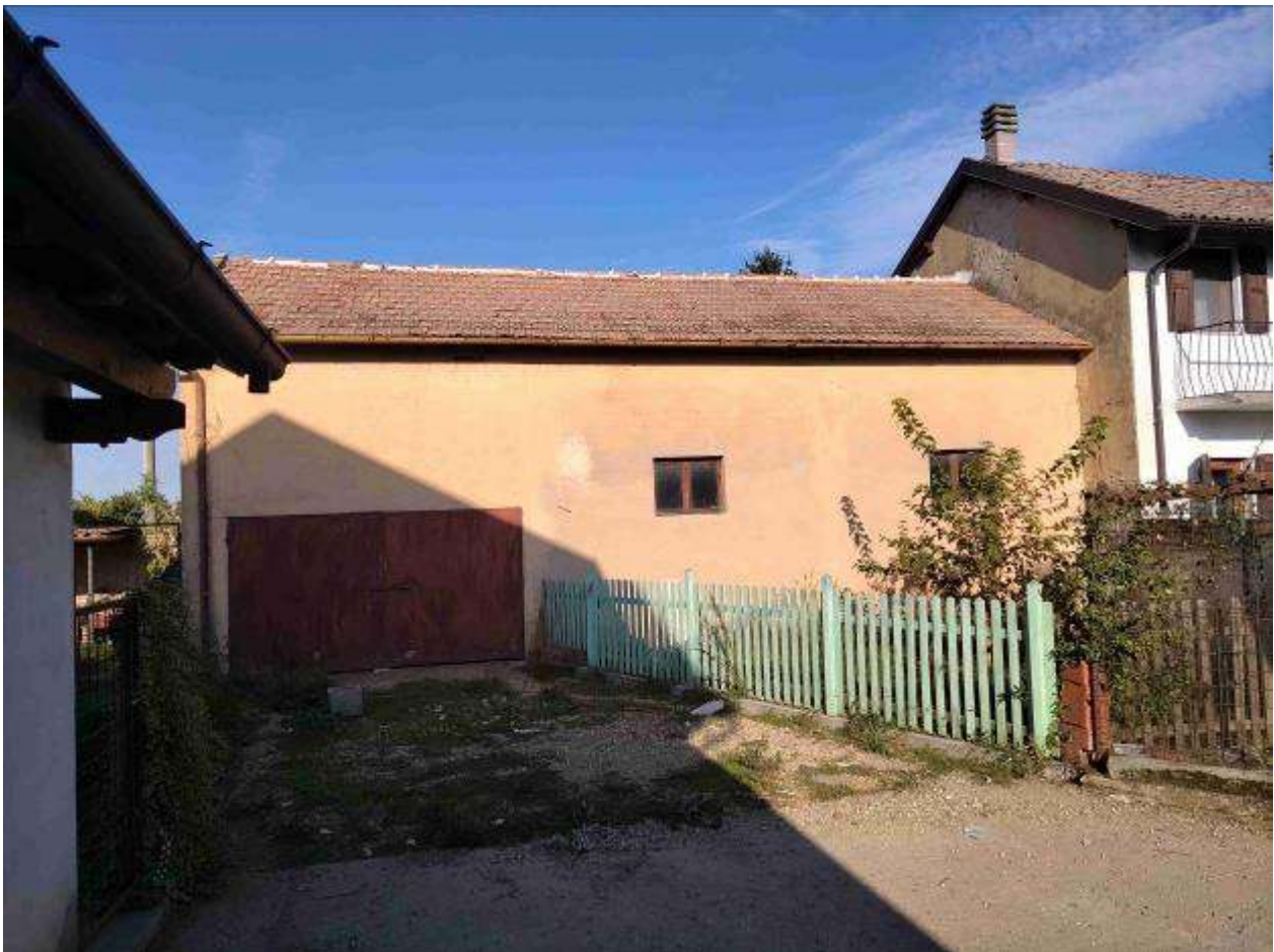
Fabbricato 3 deposito