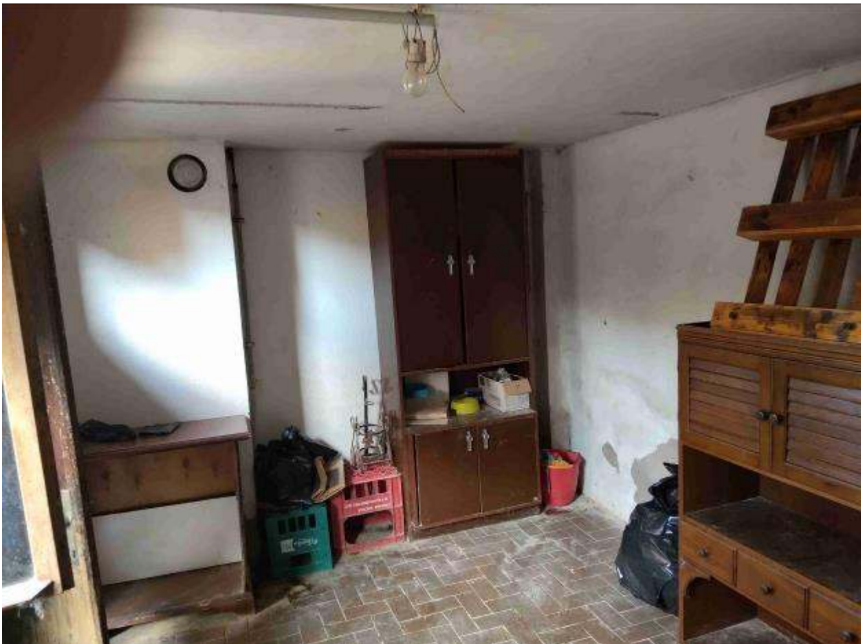
Fabbricato 2 - locale accessorio in cortile