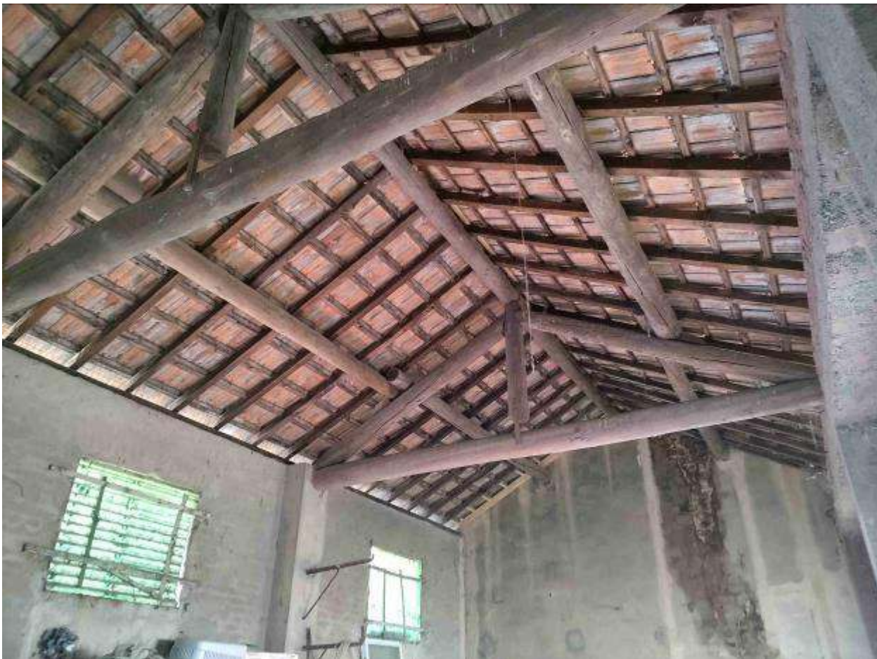
Locale 3 - deposito in cortile