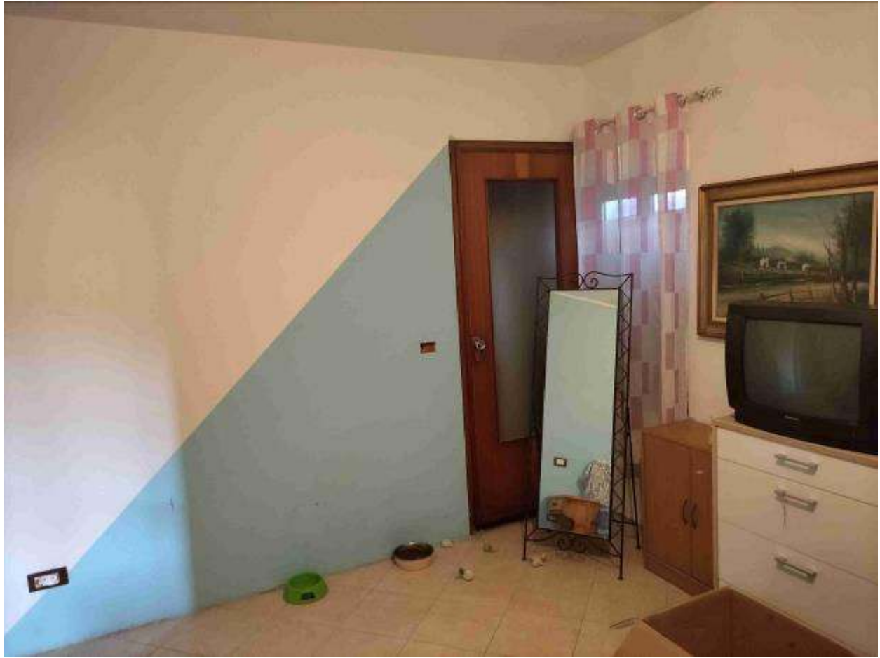
Camera 1 - 1P