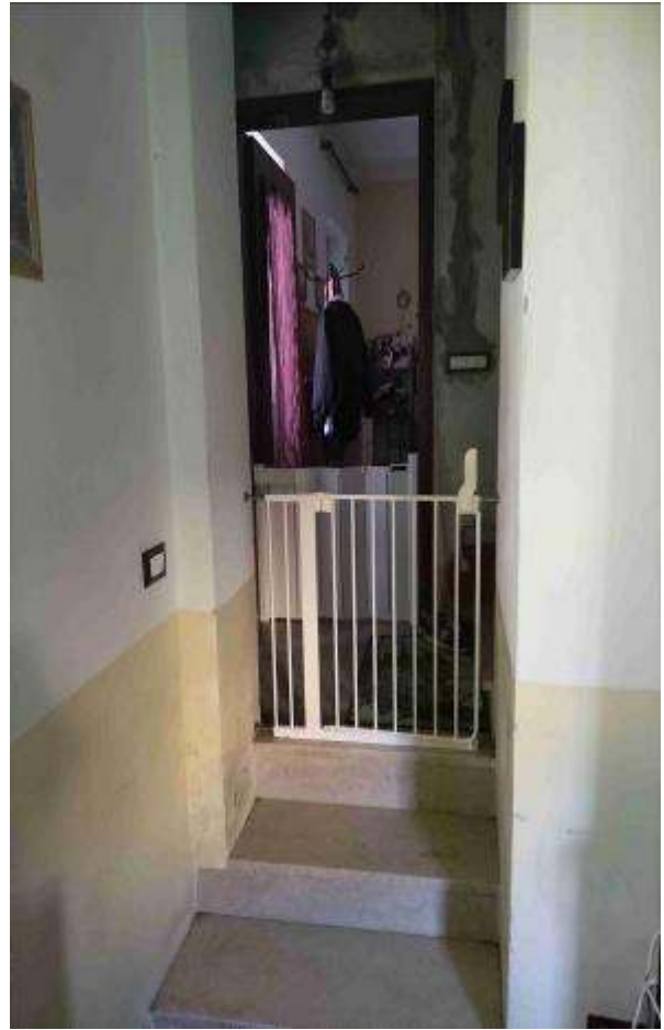
Collegamento alla cucina (autorimessa)