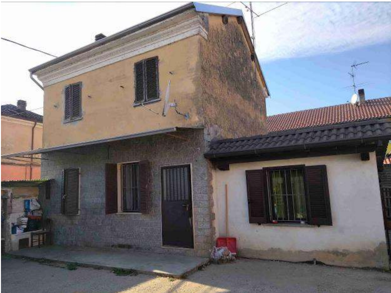
Fabbricato 1 civile abitazione