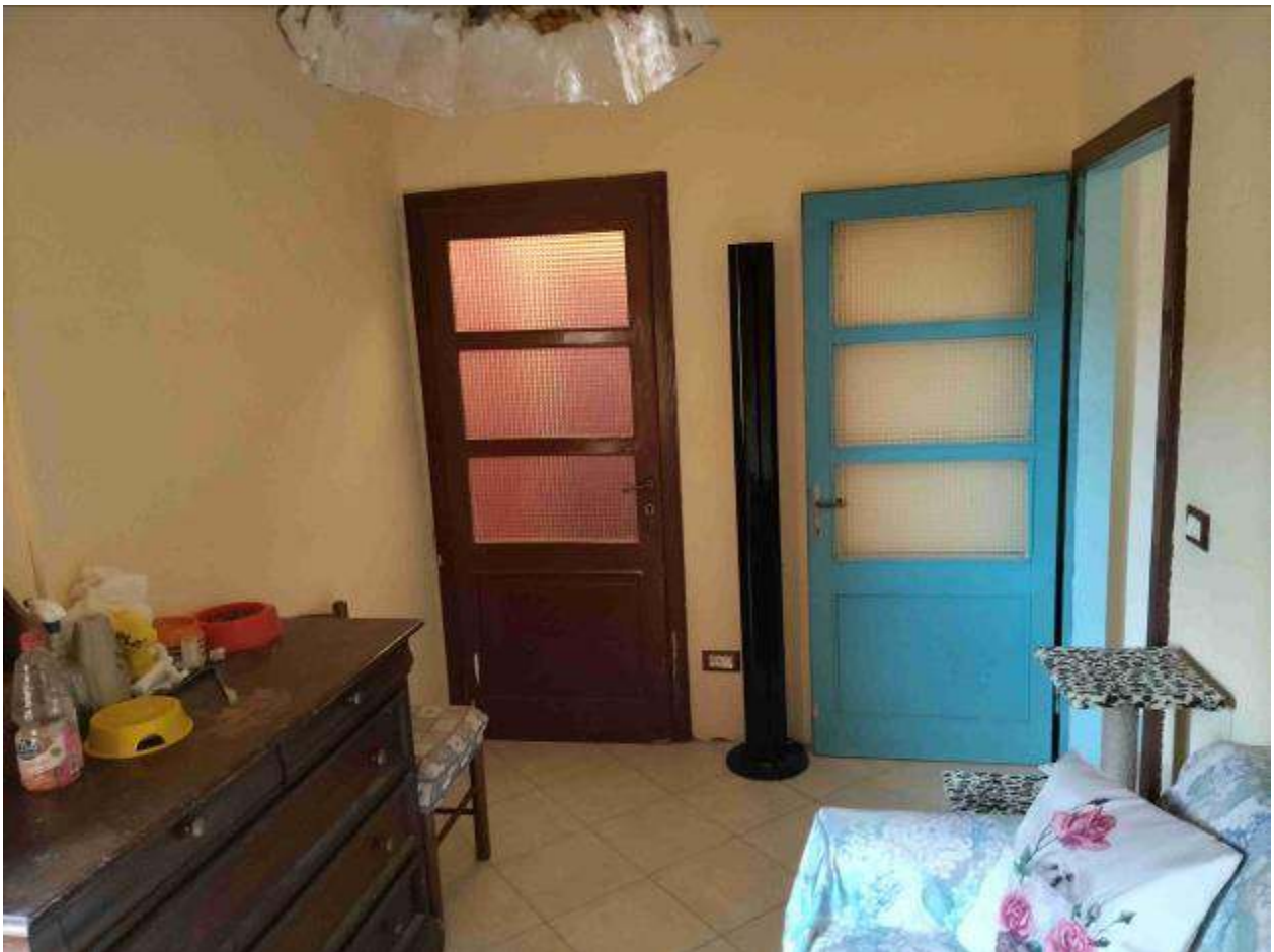
Camera 1 - 1P