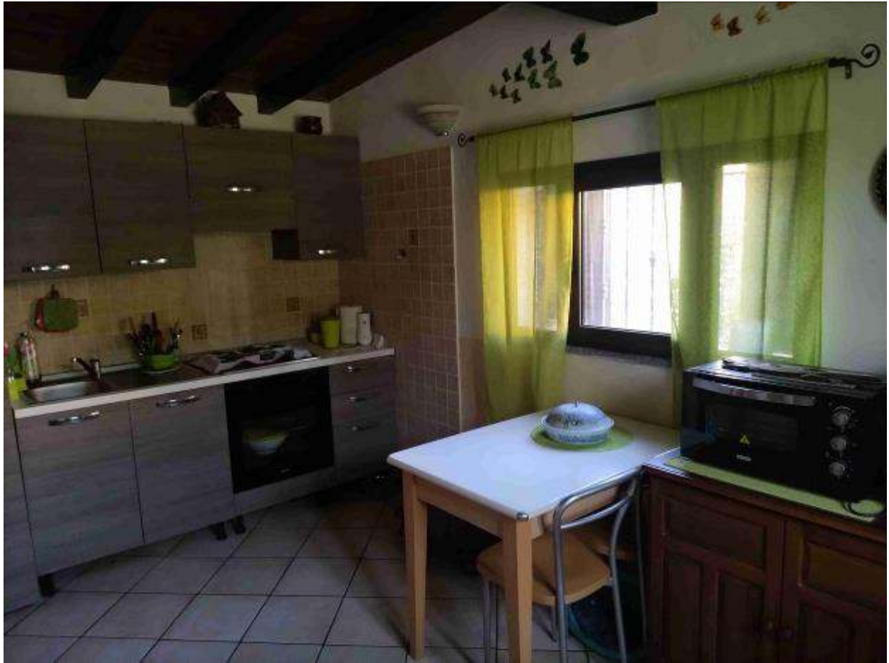
Cucina PT (autorimessa)