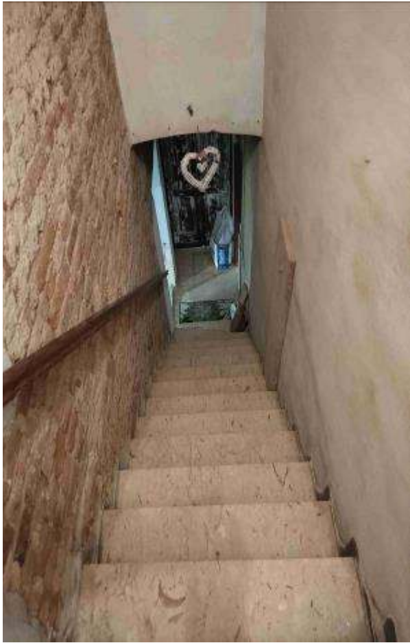
SCALA PT - 1P