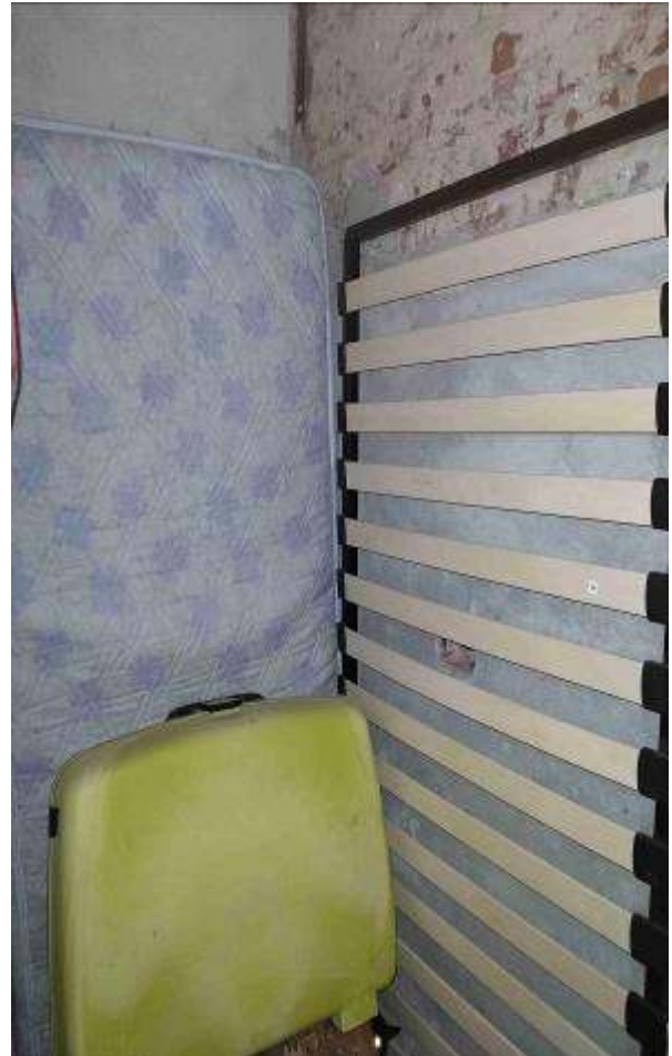
Bagno 2 - 1P (in ristrutturazione)