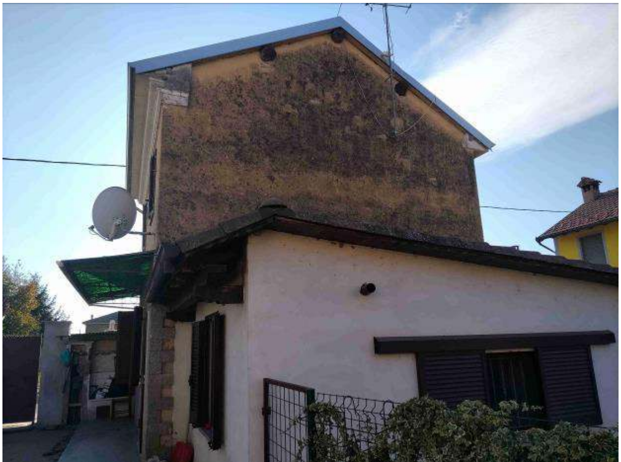
Fabbricato 1 civile abitazione