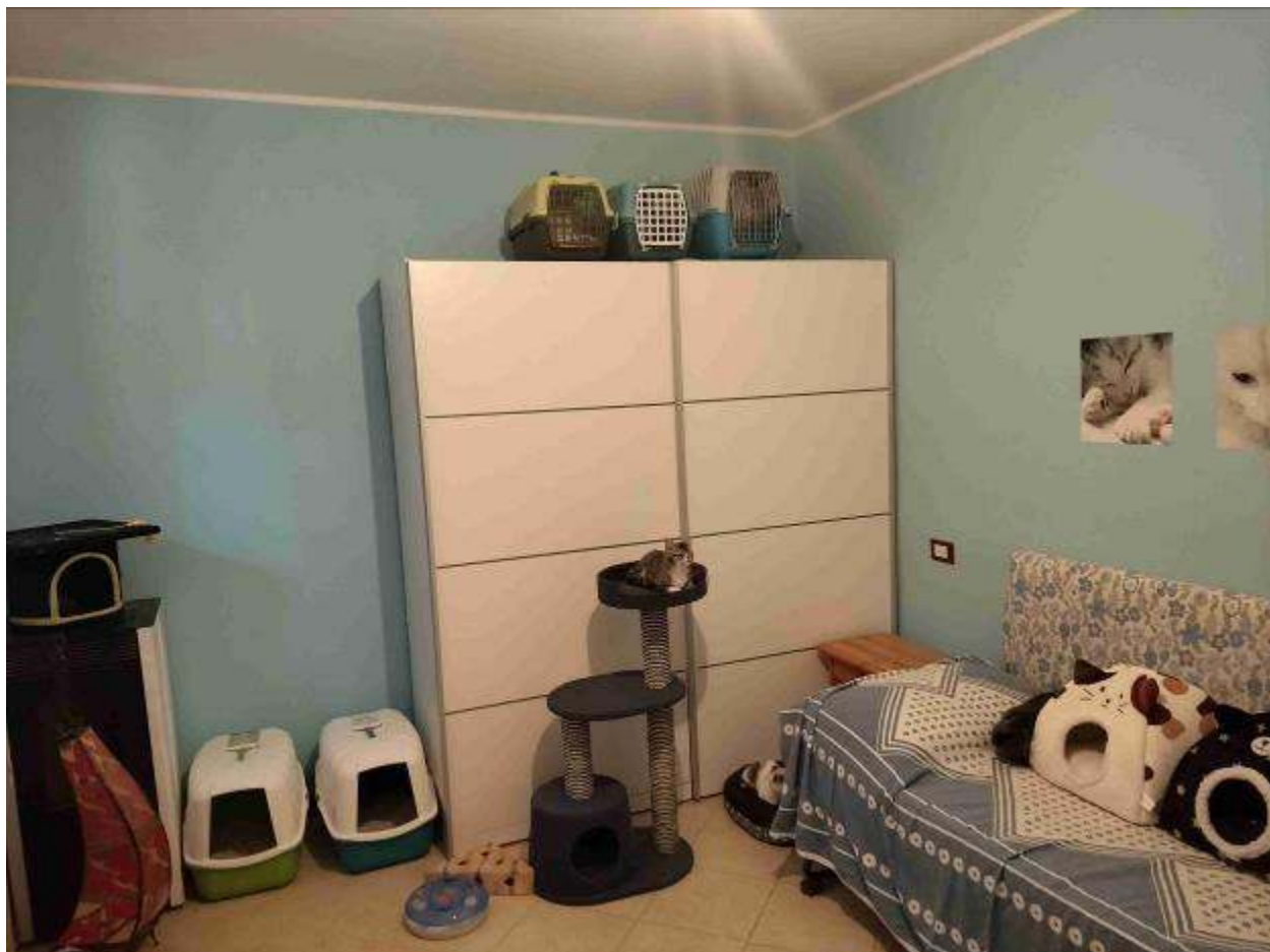
Camera 1 - 1P