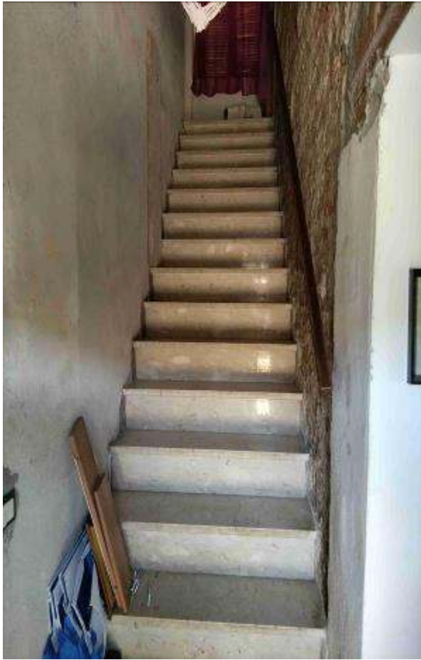
Ingresso su disimpegno e scala