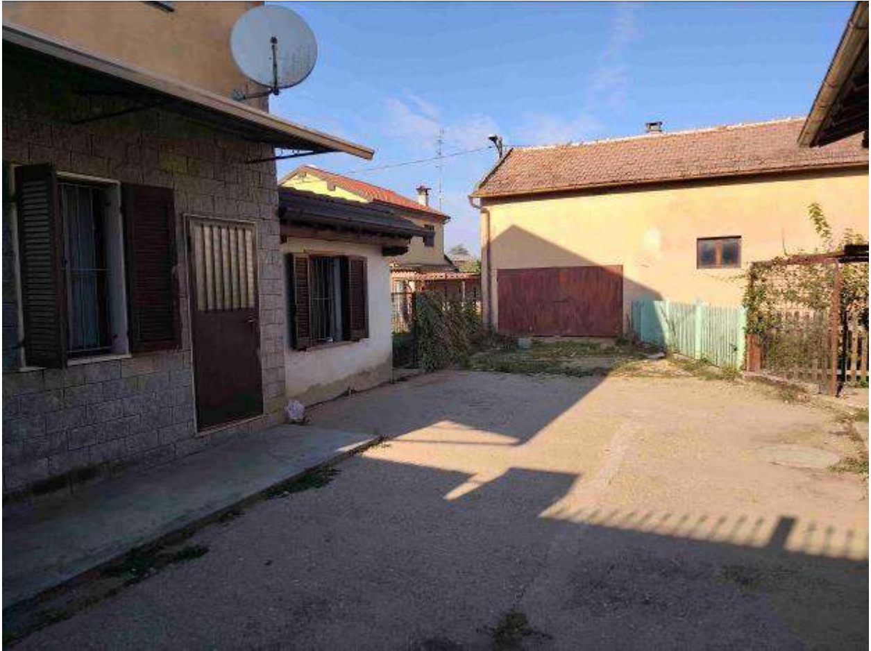
Cortile interno privato