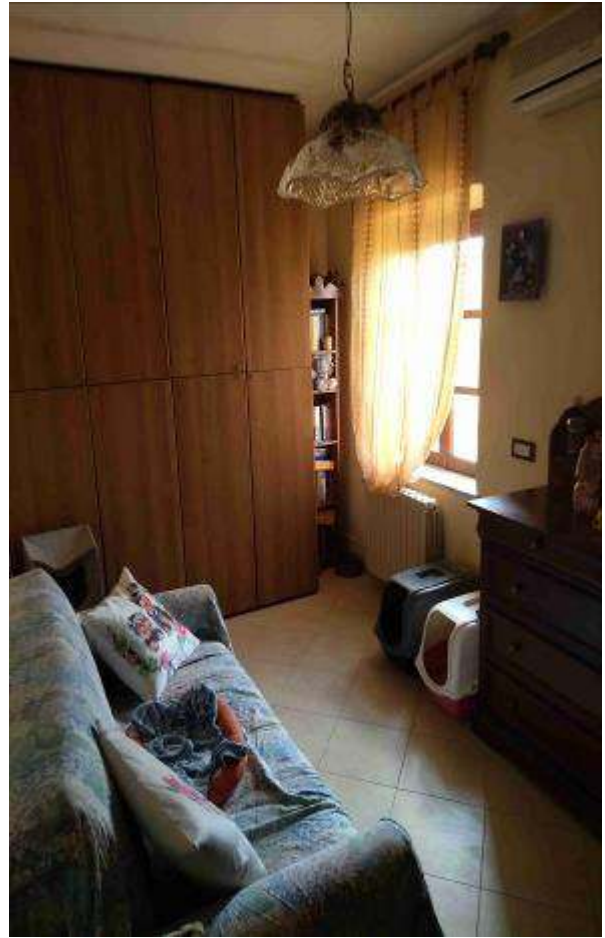
Camera 1 - 1P