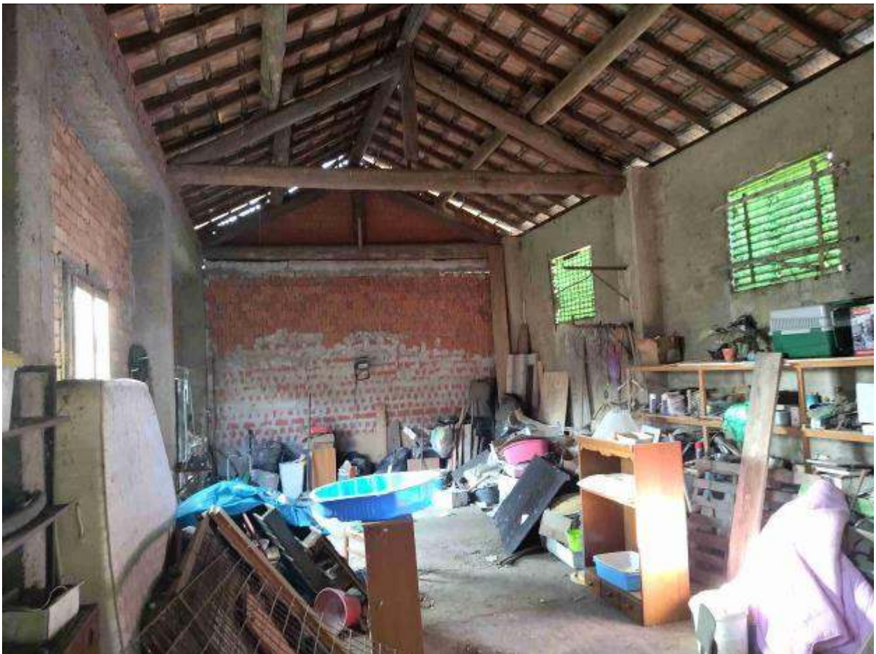
Locale 3 - deposito in cortile