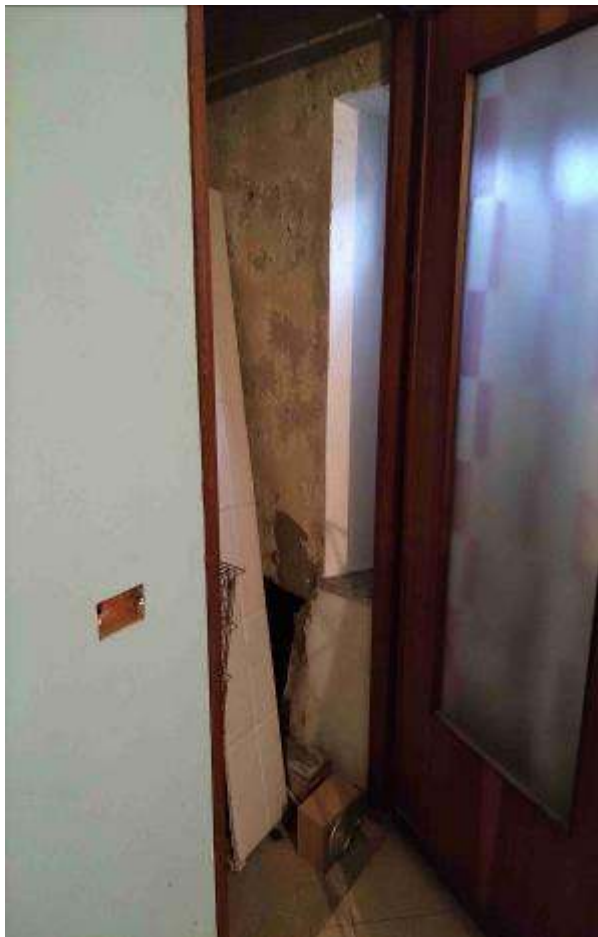
Bagno 2 - 1P (in ristrutturazione)