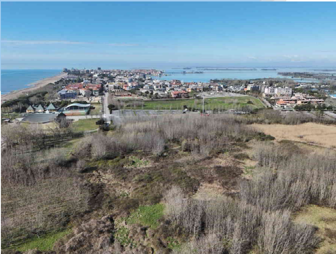
Foto: Terreni edificabili Lido dei Moreri