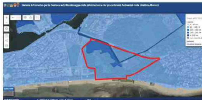
Figura 3 – Estratto PGRA Tiranti idrici TR100

I tiranti idrici attesi per un tempo di ritorno di 100 anni sono riportati nella figura 3, essi sono compresi tra 0,50m e 1,00m per l’area classificata in P1, mentre, per l’area classificata in P2, sono compresi tra 1,00m e 1,50m. L’area è inoltre attraversata da un canale di bonifica, canale Principe Primo relativo all’Idrovora la Sacca, il canale è gestito dal Consorzio di Bonifica Pianura Friulana.