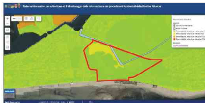
Figura 2 – Estratto PGRA classe di pericolosità idraulica (P2 colore giallo, P1 colore verde)

Nelle figure seguenti sono riportati degli estratti della cartografia allegata al PGRA, con indicazione della pericolosità idraulica per l’area in oggetto, che risulta classificata a pericolosità idraulica moderata P1, per una parte dell’area, e a pericolosità idraulica media P2, per la restante parte.