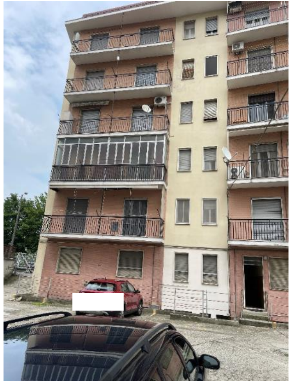
Ingresso e vista su corte