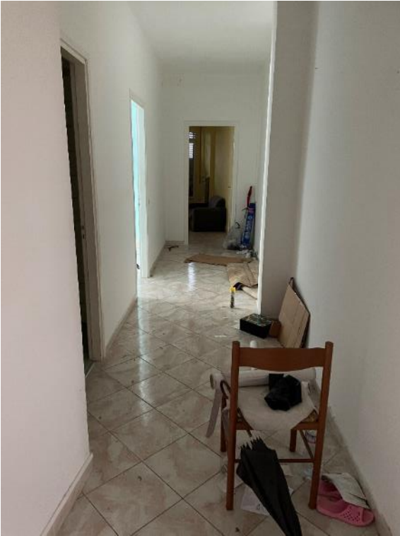
Vista su disimpegno