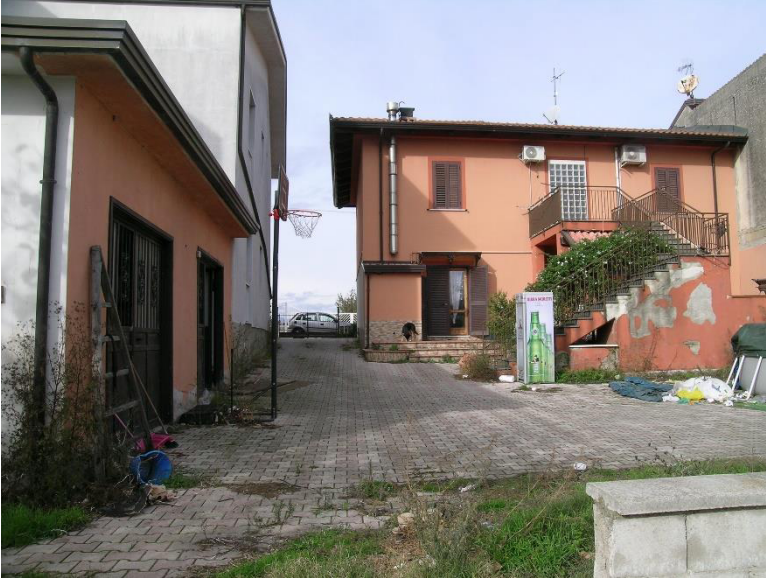
Foto 1 Corpo A Fabbricato pignorato foglio 23 Comune di Calvi (BN) p.lla 287 sub4 visto dalla corte antistante