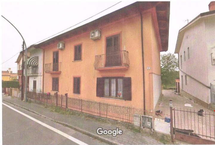
Foto 2 Corpo A Fabbricato pignorato foglio 23 Comune di Calvi (BN) p.lla 287 sub4 visto da Via La Frazia