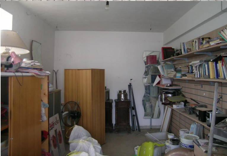
Foto 11 Interno corpo B Garage cat. C/6 foglio 23 Comune di Calvi (BN) p.lla 69 sub 8

Corpo C Garage cat C/6 foglio 23 Comune di Calvi (BN) p.lla 69 sub7