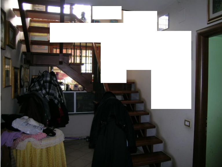
Foto 4 Interni Corpo A : disimpegno e scala piano terra che immette al piano primo