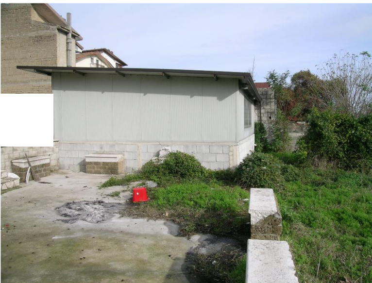
Foto 15 Manufatto ubicato sul Corpo E terreno Cat. Semin. Arbor foglio 23 Comune di Calvi (BN) p.lla 715 Il manufatto non è riportato nella planimetria catastale e non assentito da alcun titolo abilitativo