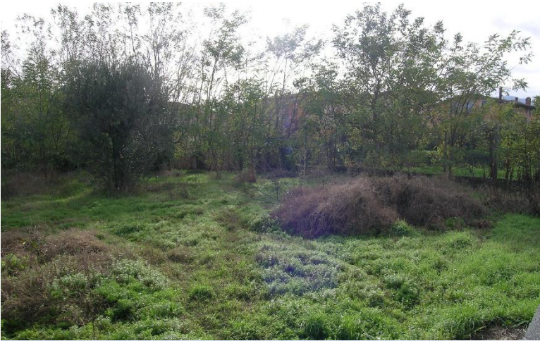
Foto 13 Corpo D Scorcio terreno Cat. Semin. Arbor foglio 23 Comune di Calvi (BN) p.lla 714