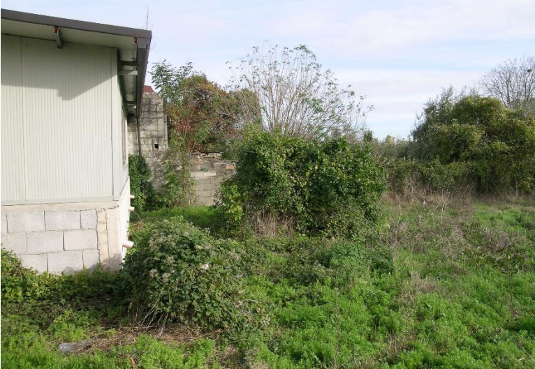
Foto 14 Corpo E Scorcio terreno Cat. Semin. Arbor foglio 23 Comune di Calvi (BN) p.lla 715