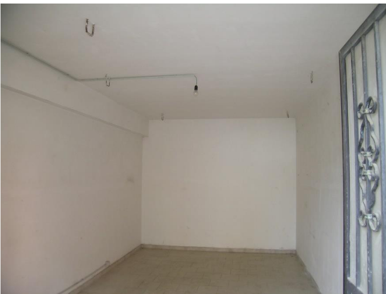
Foto 12 Interno corpo C Garage cat. C/6 foglio 23 Comune di Calvi (BN) p.lla 69 sub 7