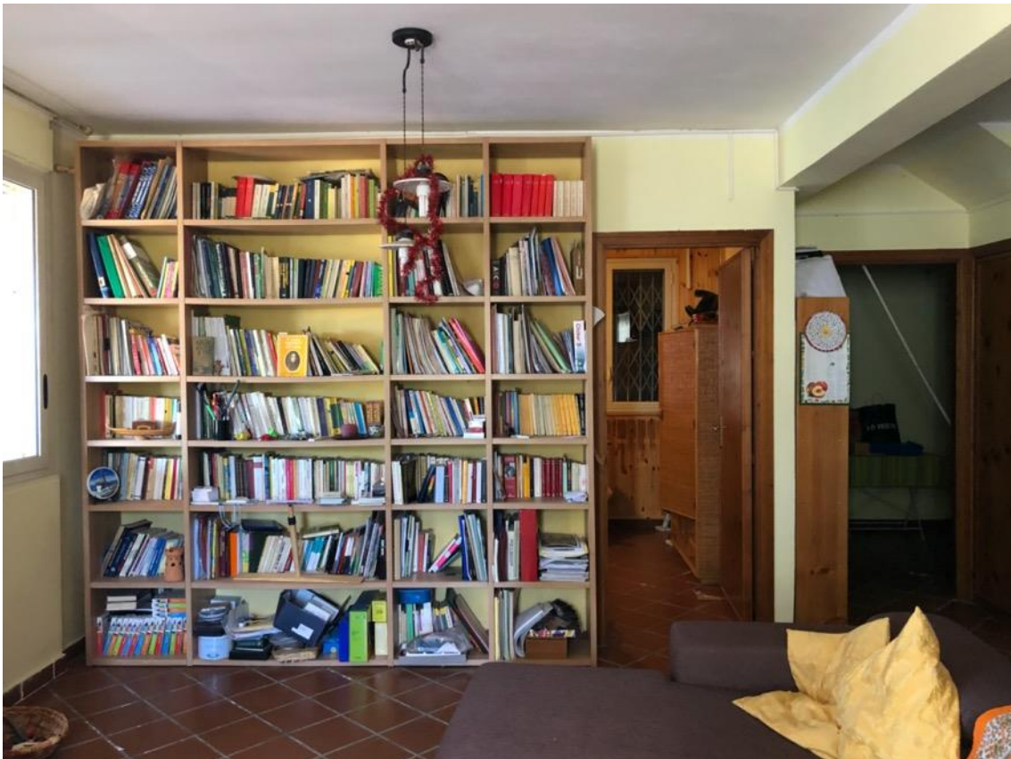
Foto 10 – Vista accessi alle due camere da letto dal soggiorno – piano seminterrato