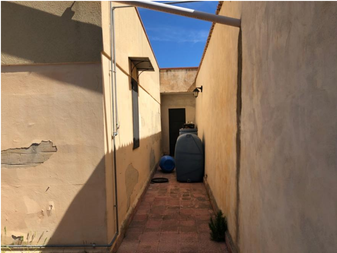
Foto 5 – Muro di contenimento del terreno e retrospetto del piano semiinterrato