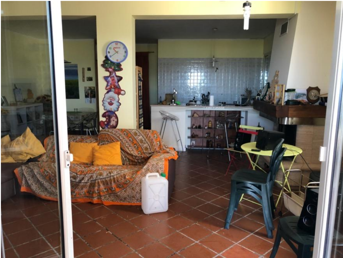
Foto 9 – Soggiorno con angolo cottura e camino – piano seminterrato