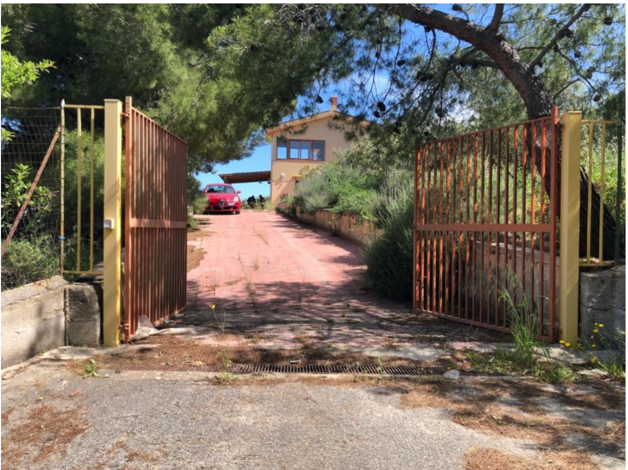
Foto 4 – Cancelli di ingresso al vialetto privato che conduce alla villa