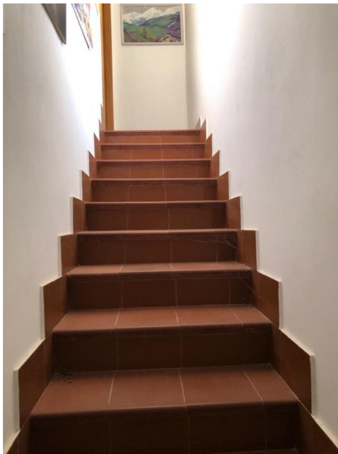
Foto 15 – Scala di collegamento interno tra seminterrato e piano terra