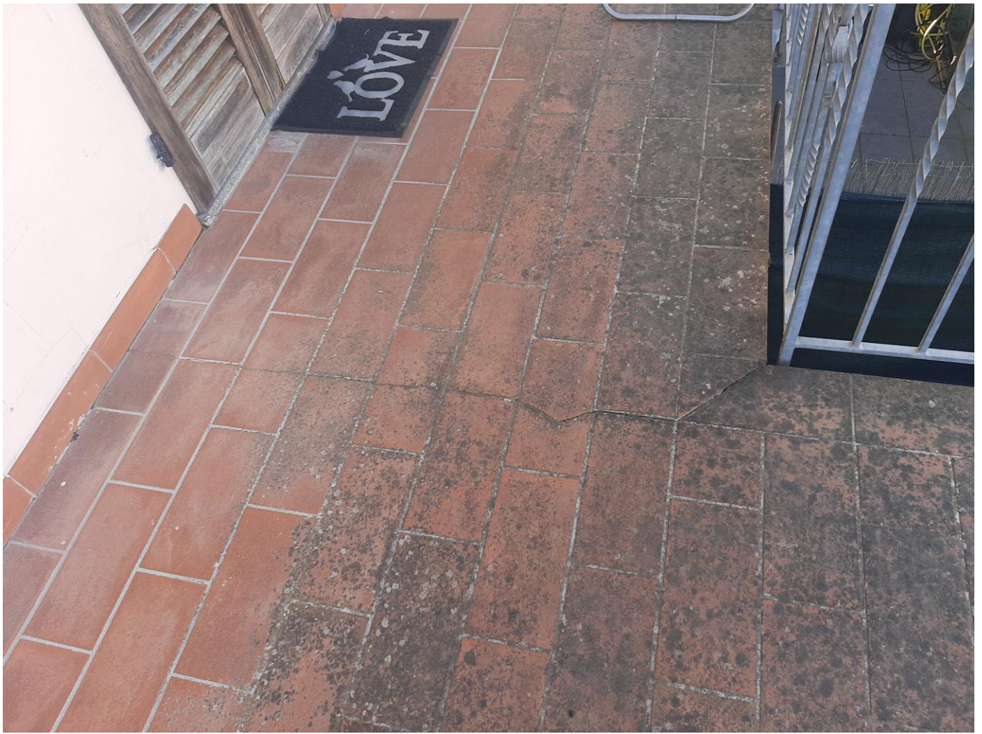
Foto n. 1 – lesione nel pavimento del terrazzo – persiane con carenza di manutenzione