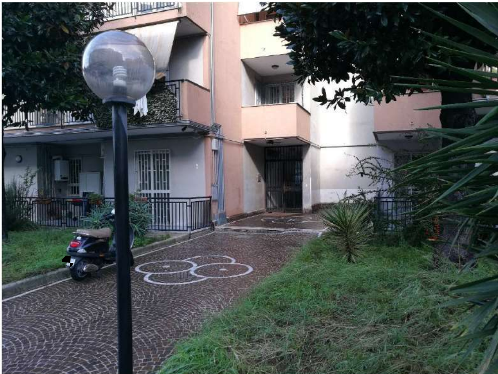
Foto n°2 : Vista dalla corte condominiale dell'Ingresso del fabbricato