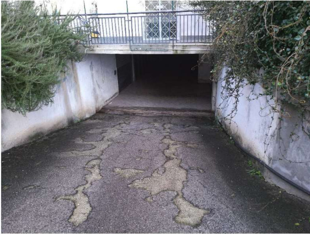
Foto n°25 : Vista Esterna rampa carrabile di accesso alla p.lla 710 sub 36