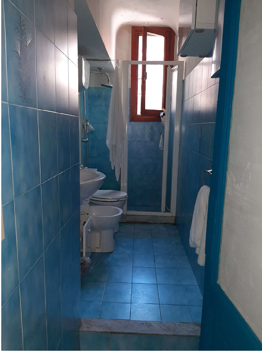
7 – Servizio igienico