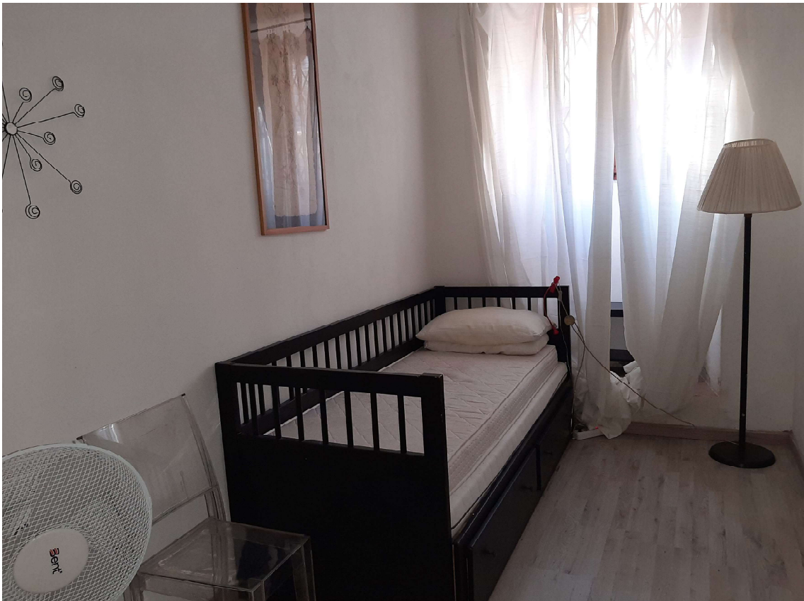
2 – Cameretta