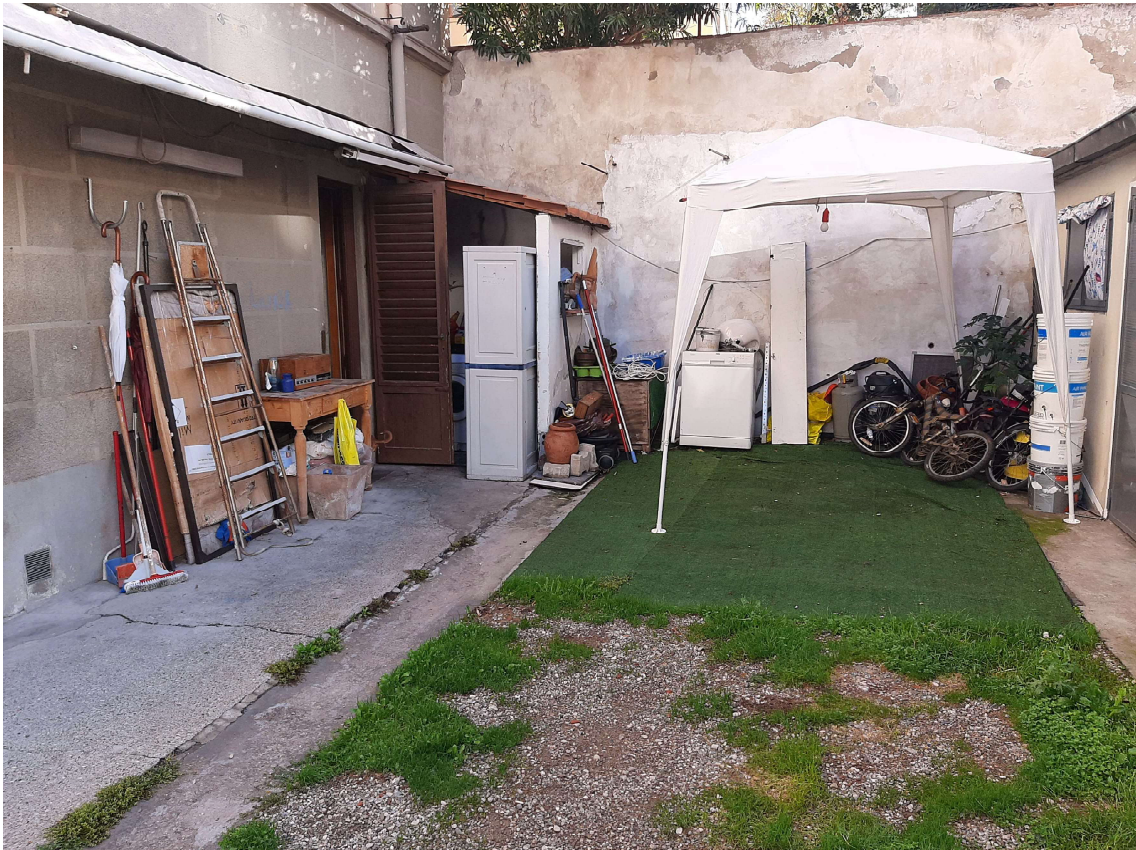
3- Corte interna