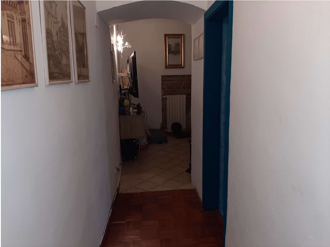
1 – Corridoio di ingresso