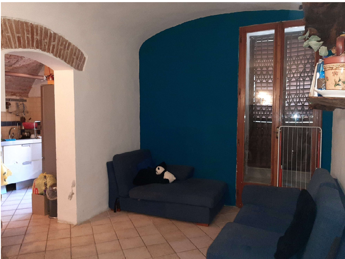
4 - Soggiorno - collegamento con la cucina