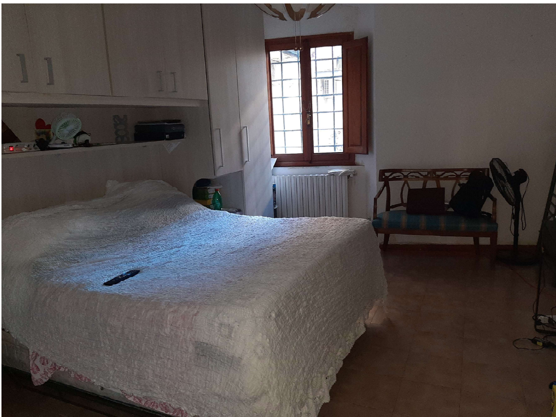
6 - Camera.