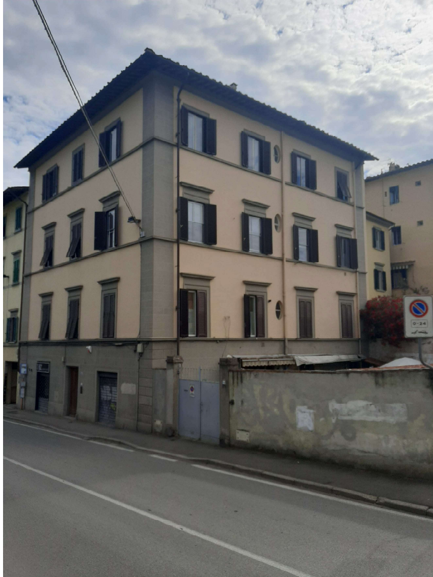
1 – Prospetto su via Senese