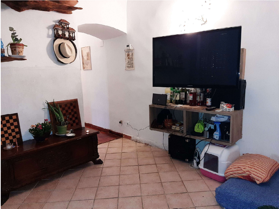
3 - Soggiorno