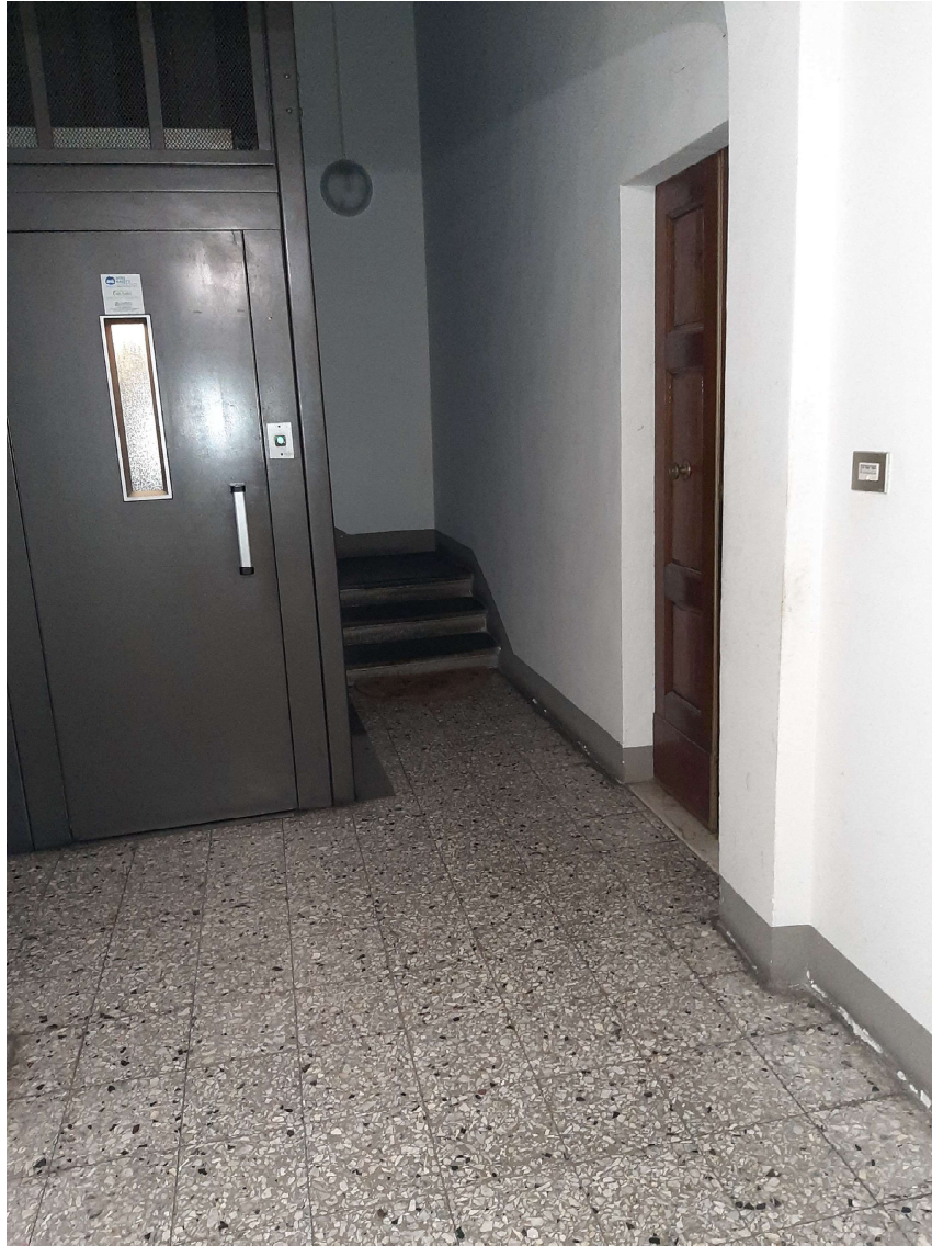
4 – Ingresso condominiale