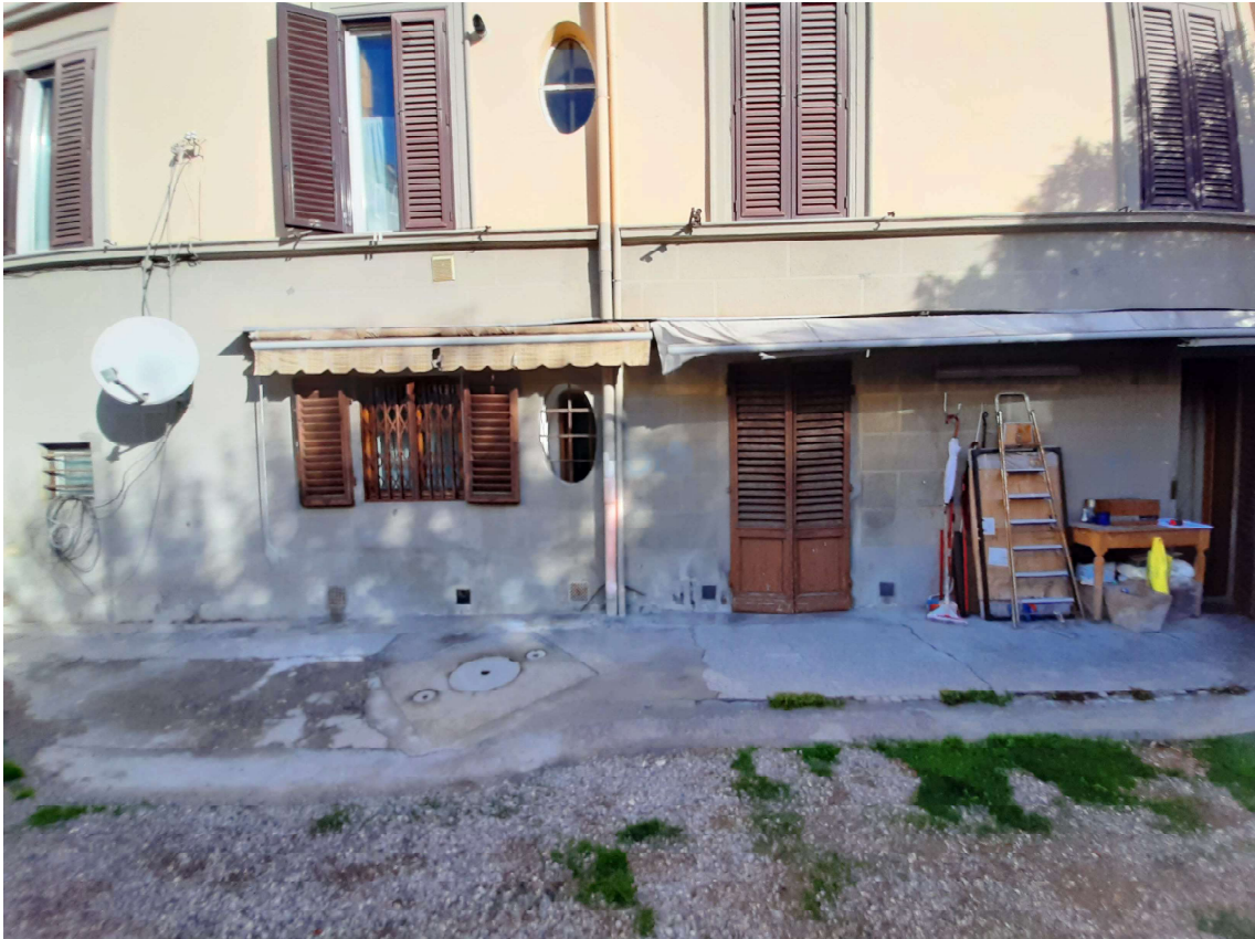
2 – Facciata interna verso via Da Castiglione