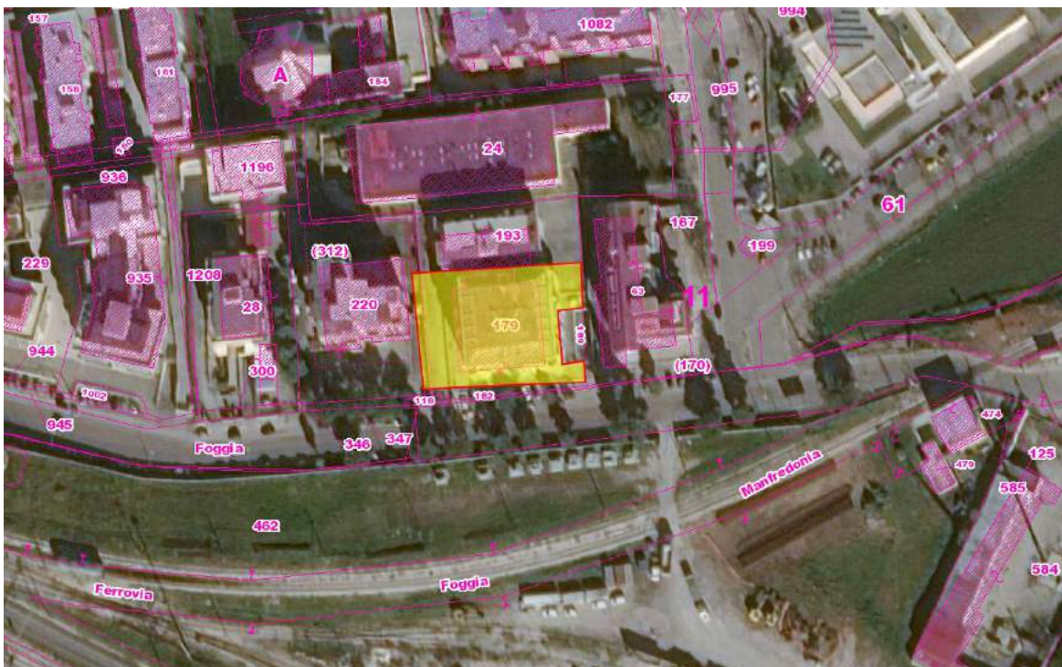
Figura 5 - Stralcio ortofoto catastale del Comune di Foggia - foglio 98, p.lle 179-180