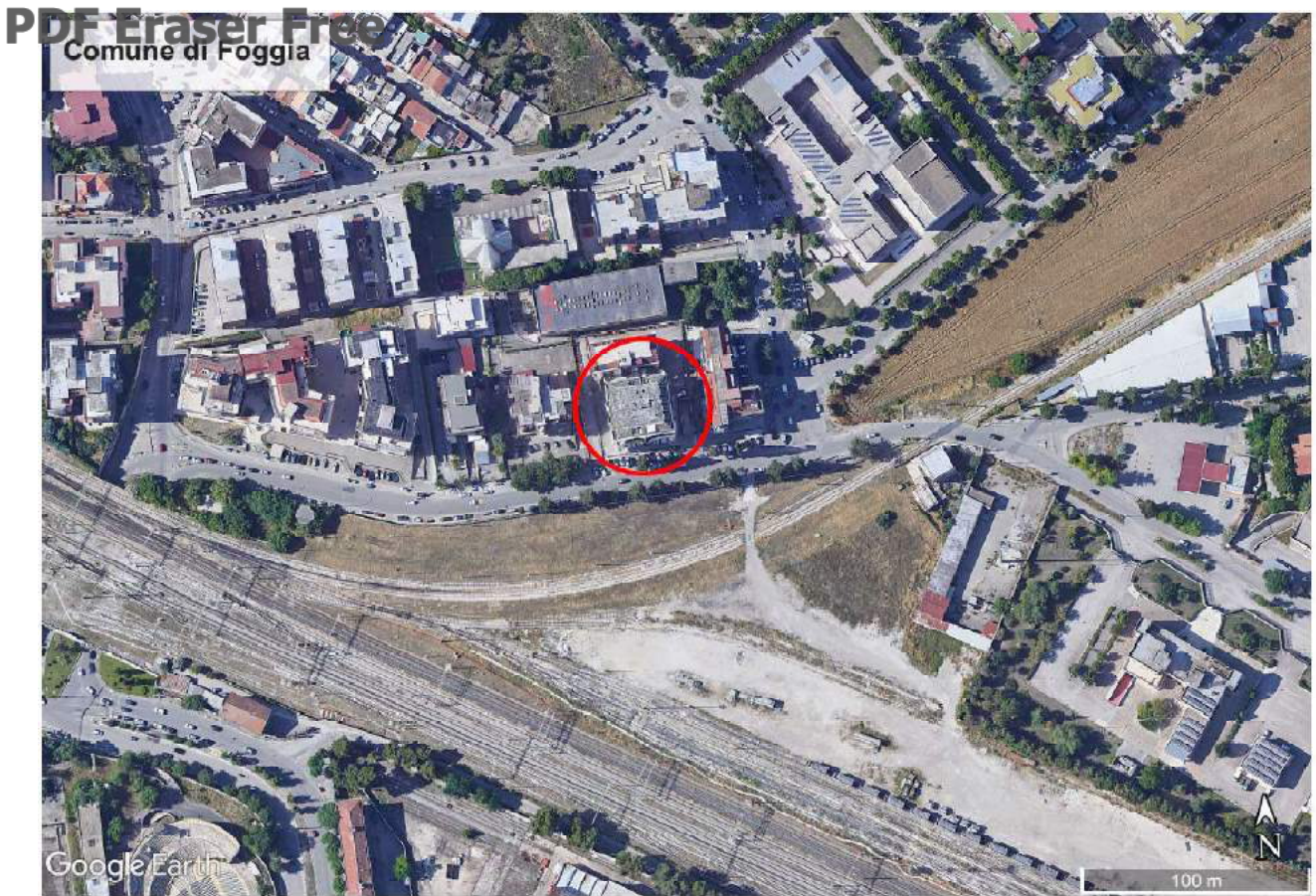
Figura 2 - Stralcio ortofoto del Comune di Foggia - scala 1:1.000