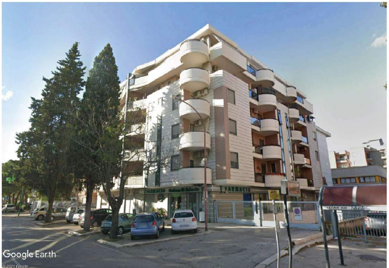
Figura 3 - Stabile di Viale Leone XIII n. 185 - Foggia