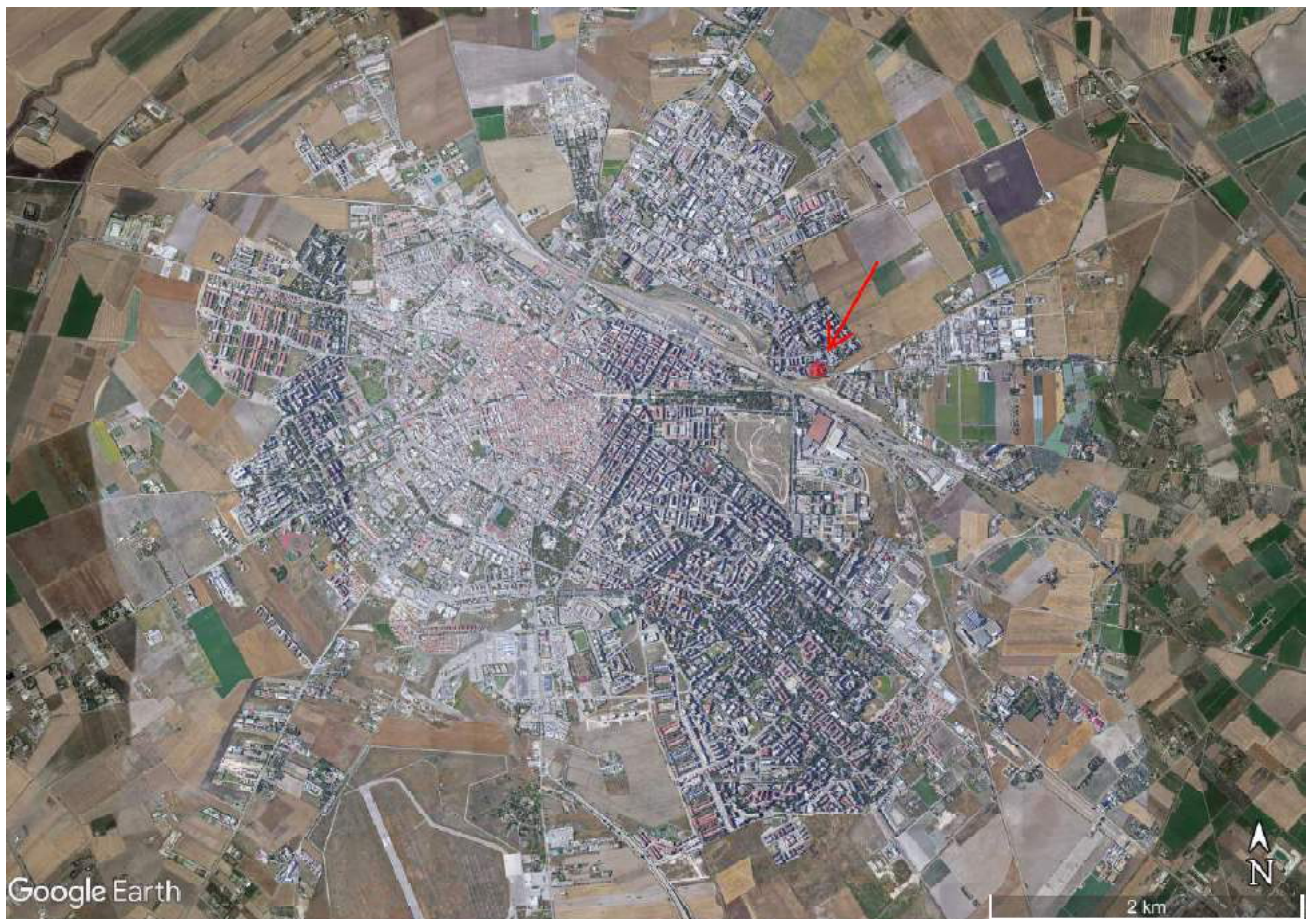
Figura 1 - Ortofoto del Comune di Foggia – scala 1:20.000

Il LOTTO 4 è costituito da un appartamento al II piano di stabile sito in Foggia al Viale Leone XIII n. 185 e da sottostante box auto al primo piano interrato.