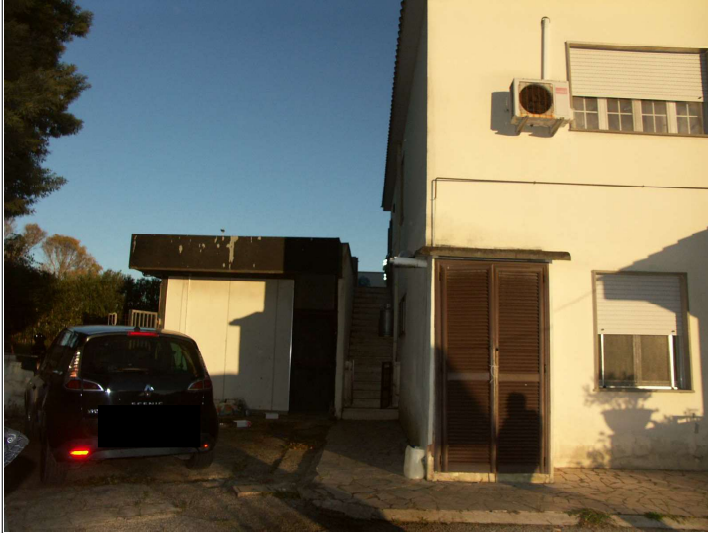
Foto esterno lato corte