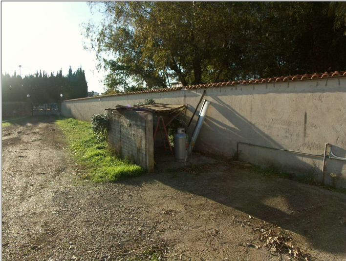
Vista corte interna-lato lungo lotto in corrispondenza della particella 503 (corte pertinenziale di accesso)