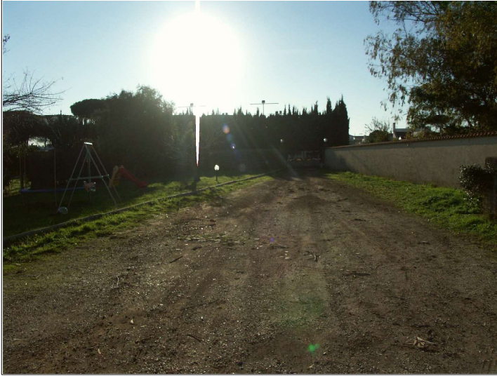
Accesso veicolare da Via Taro