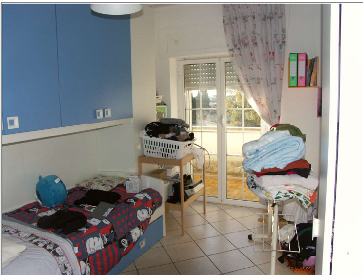
Camera da letto singola