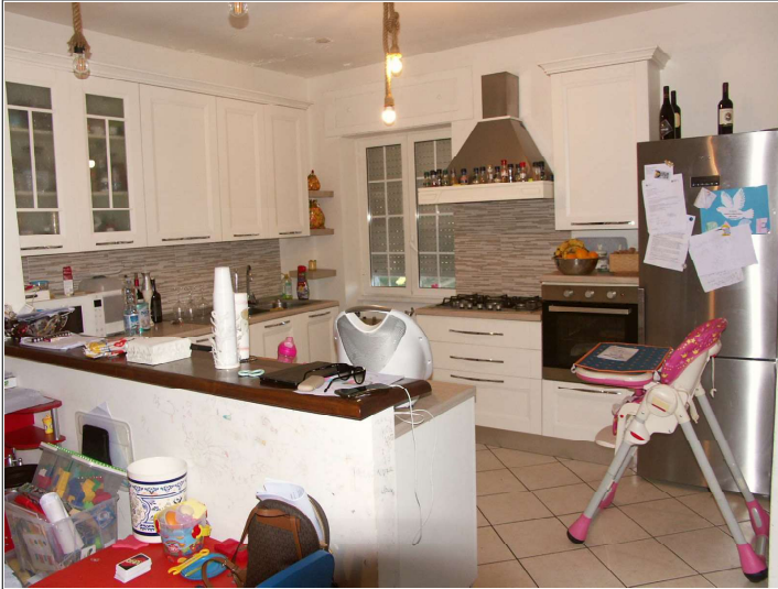
Cucina a vista