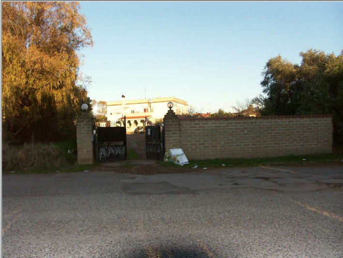
Vista esterna ingresso su Via Taro