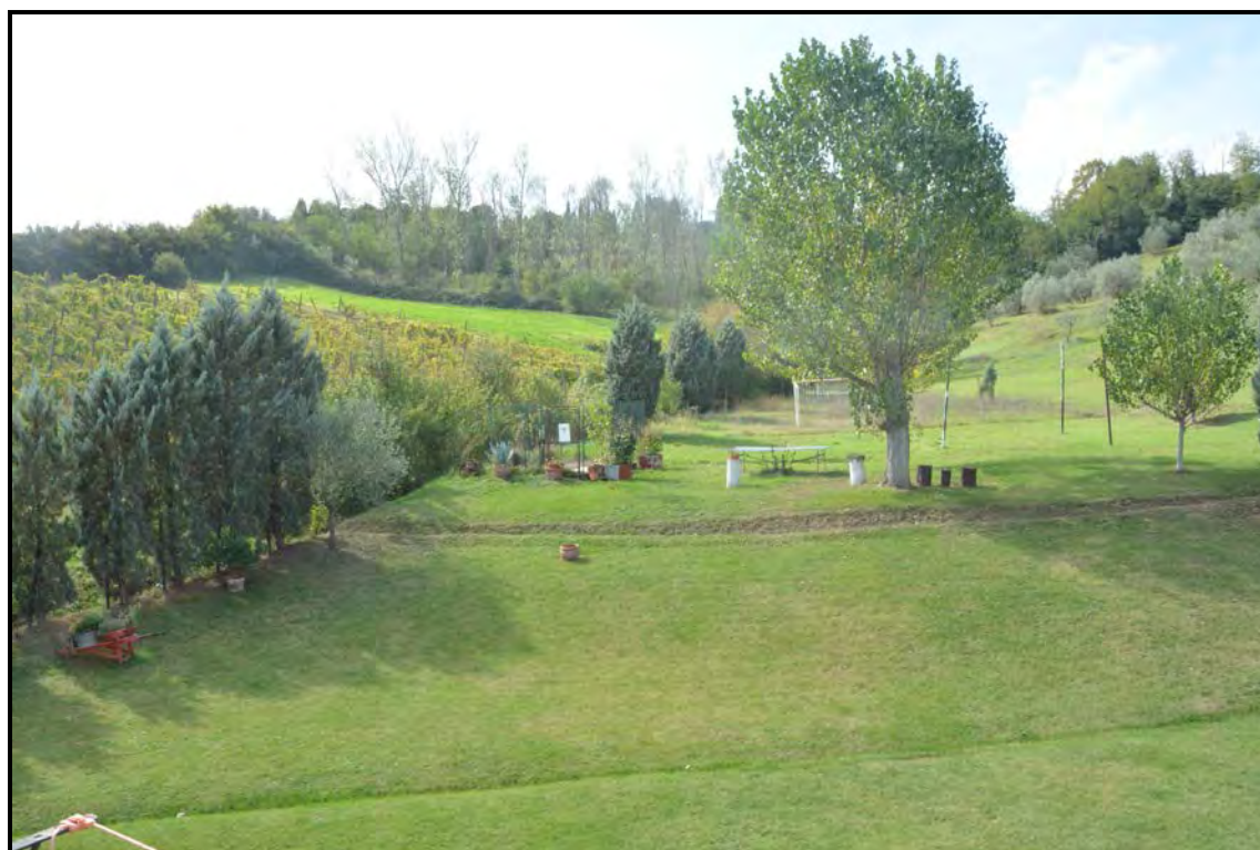
Fotografia n. 44 Terreni agricoli