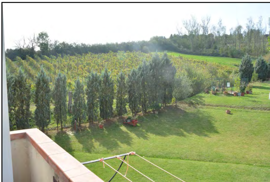
Fotografia n. 45 Terreni agricoli