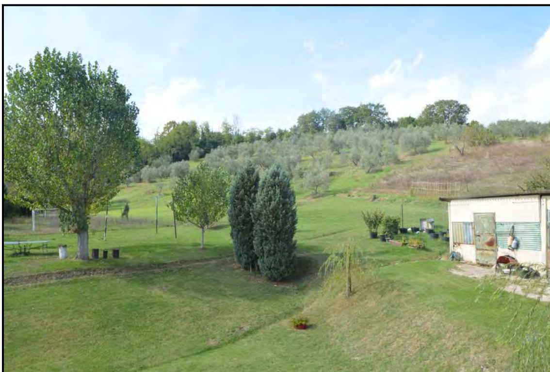
Fotografia n. 43 Terreni agricoli