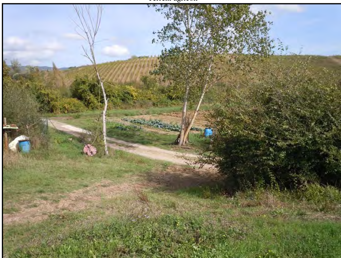
Fotografia n. 46 Terreni agricoli (in primo piano)