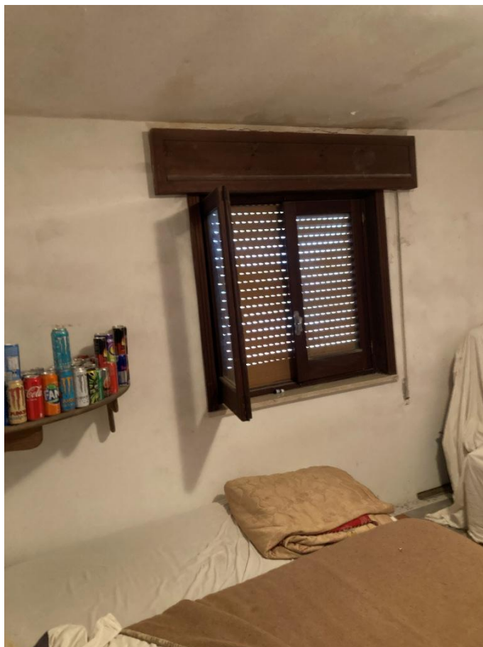
Cameretta 1° piano