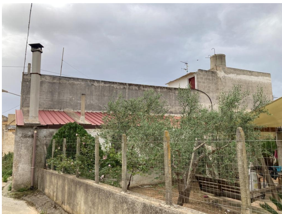
Parete ovest – cucina esterna