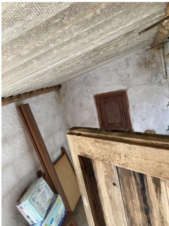
Ripostiglio con tetto in eternit