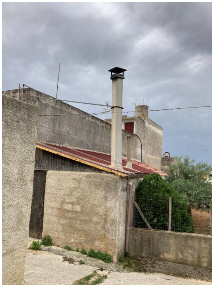
Parete ovest – Ingresso cucina esterna dalla strada posteriore