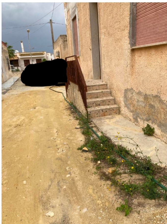
Parete est – con ingressi