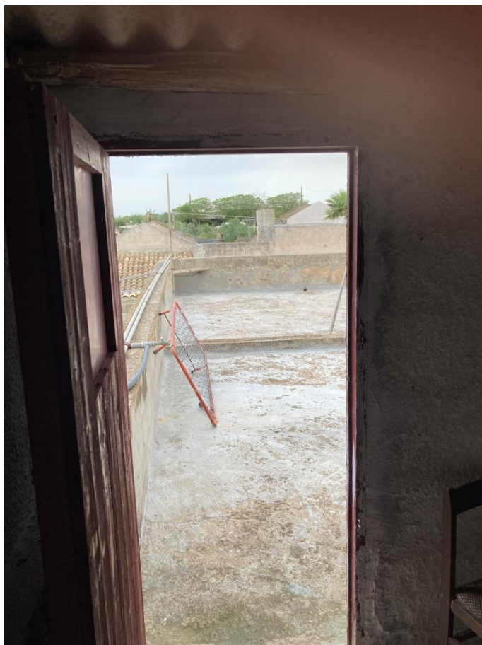
Uscita terrazzo praticabile