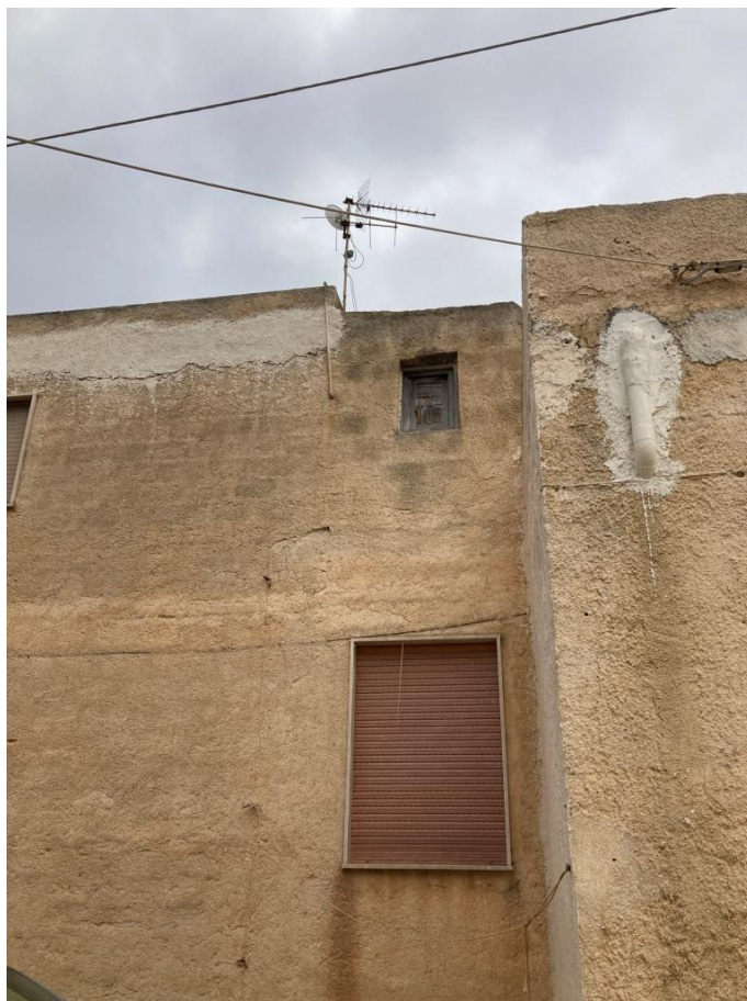
Parete est particolare con finestrella locale abusivo