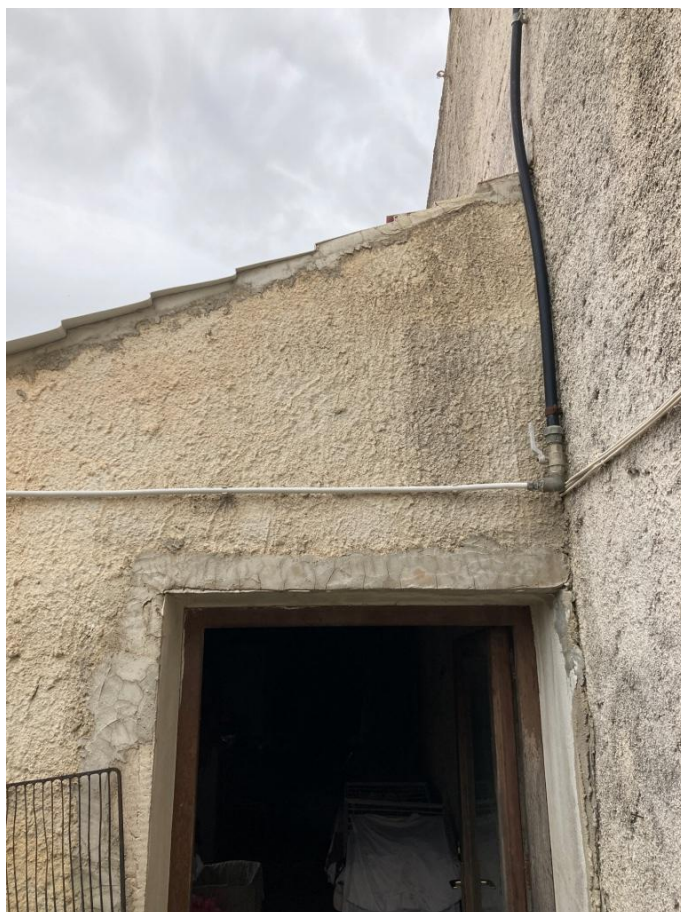
Ingresso cucina esterna dal cortiletto interno