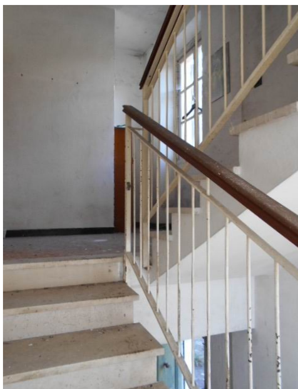
ingresso a piano terra e vano scala condominiale