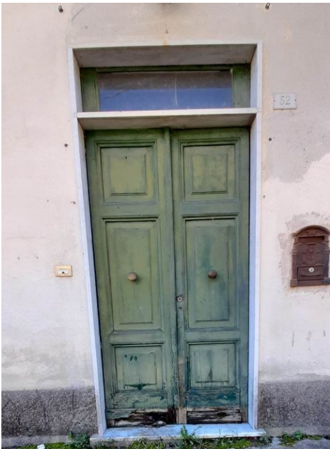
lo stato del portoncino di ingresso, dell'area davanti all'ingresso