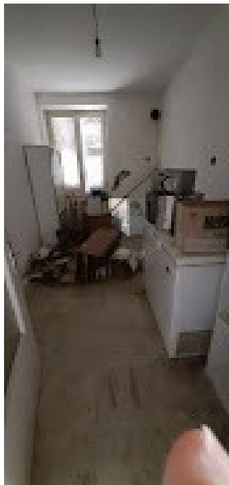
alloggio sub.3 a PT