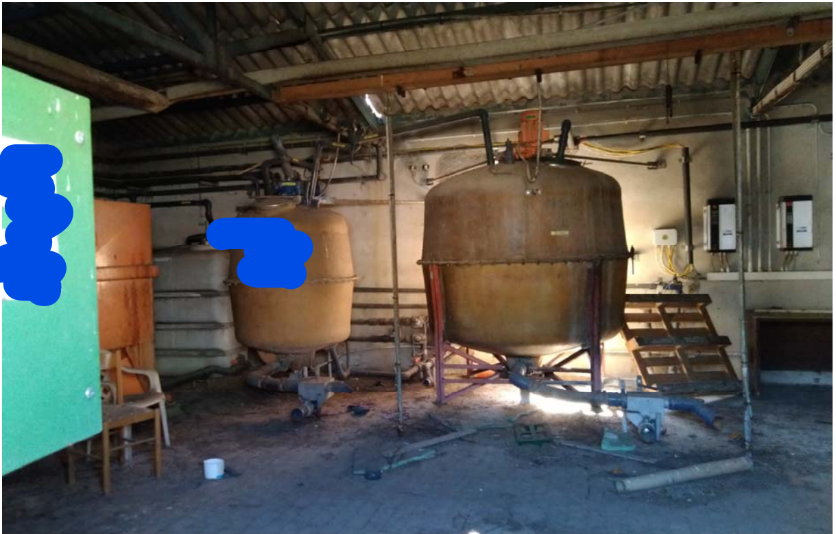
87 – LOCALE PREPARAZIONE MANGIMI – Interno – (Particella 169)