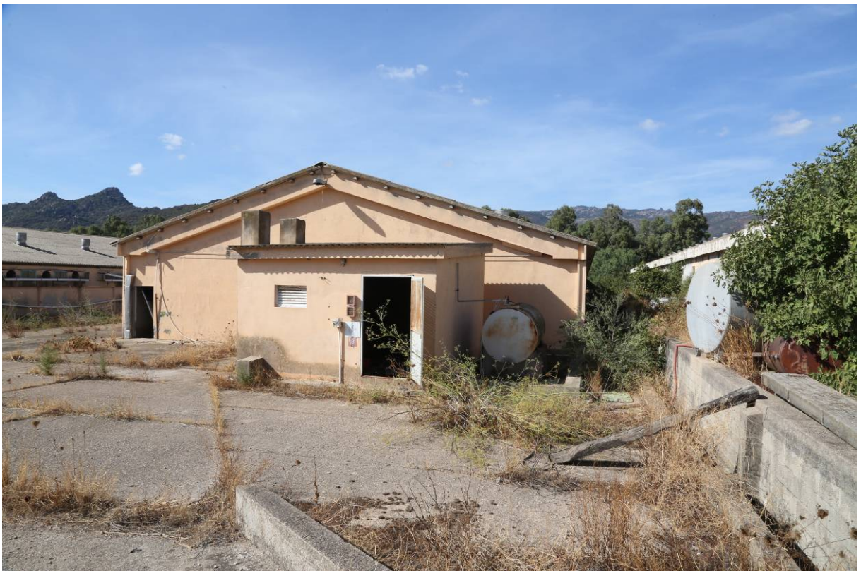
91 – CENTRALE TERMICA 2 (Particella 200)