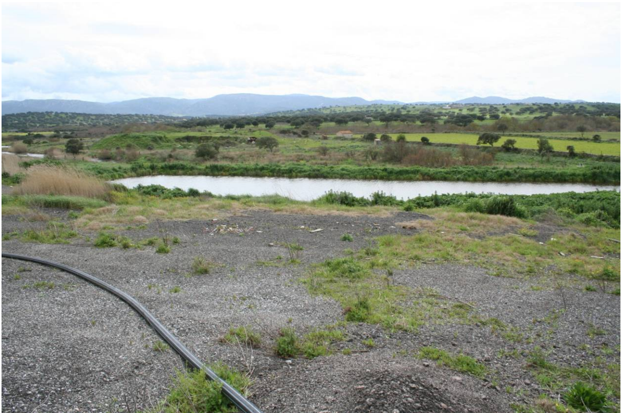
109 – IMPIANTO DI DEPURAZIONE: Vasca di accumulo in by-pass