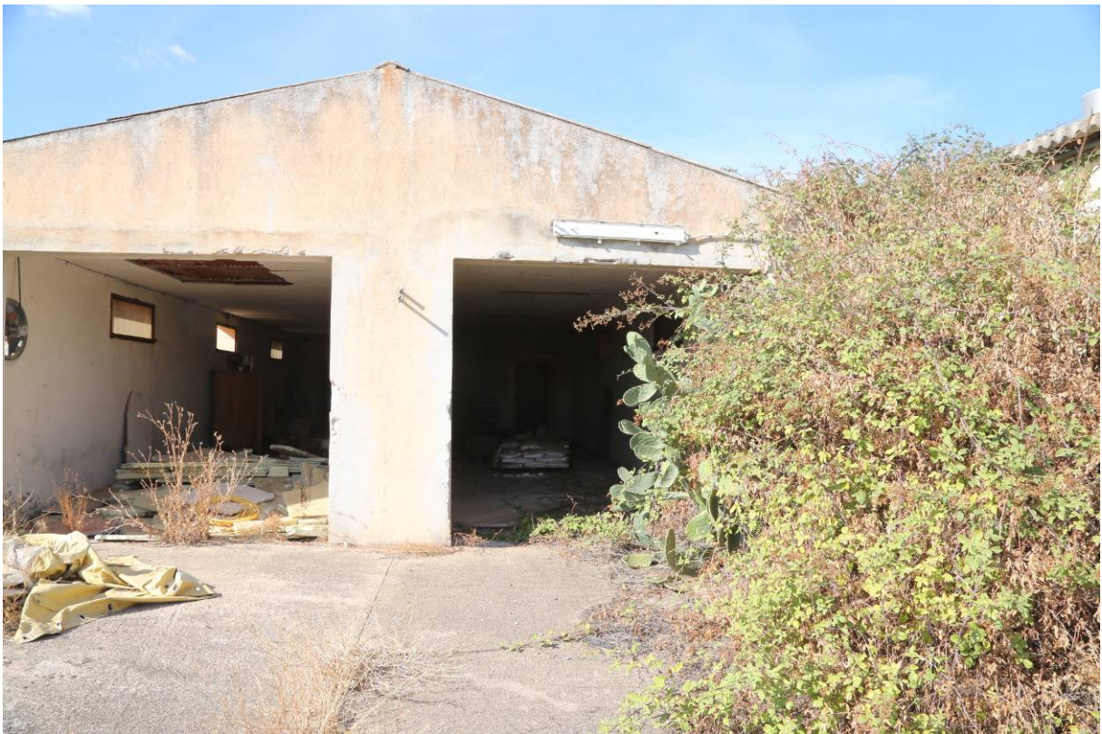
95 –RECUPERO SCARTI MACELLAZIONE – CELLE FRIGO (Particella 198)