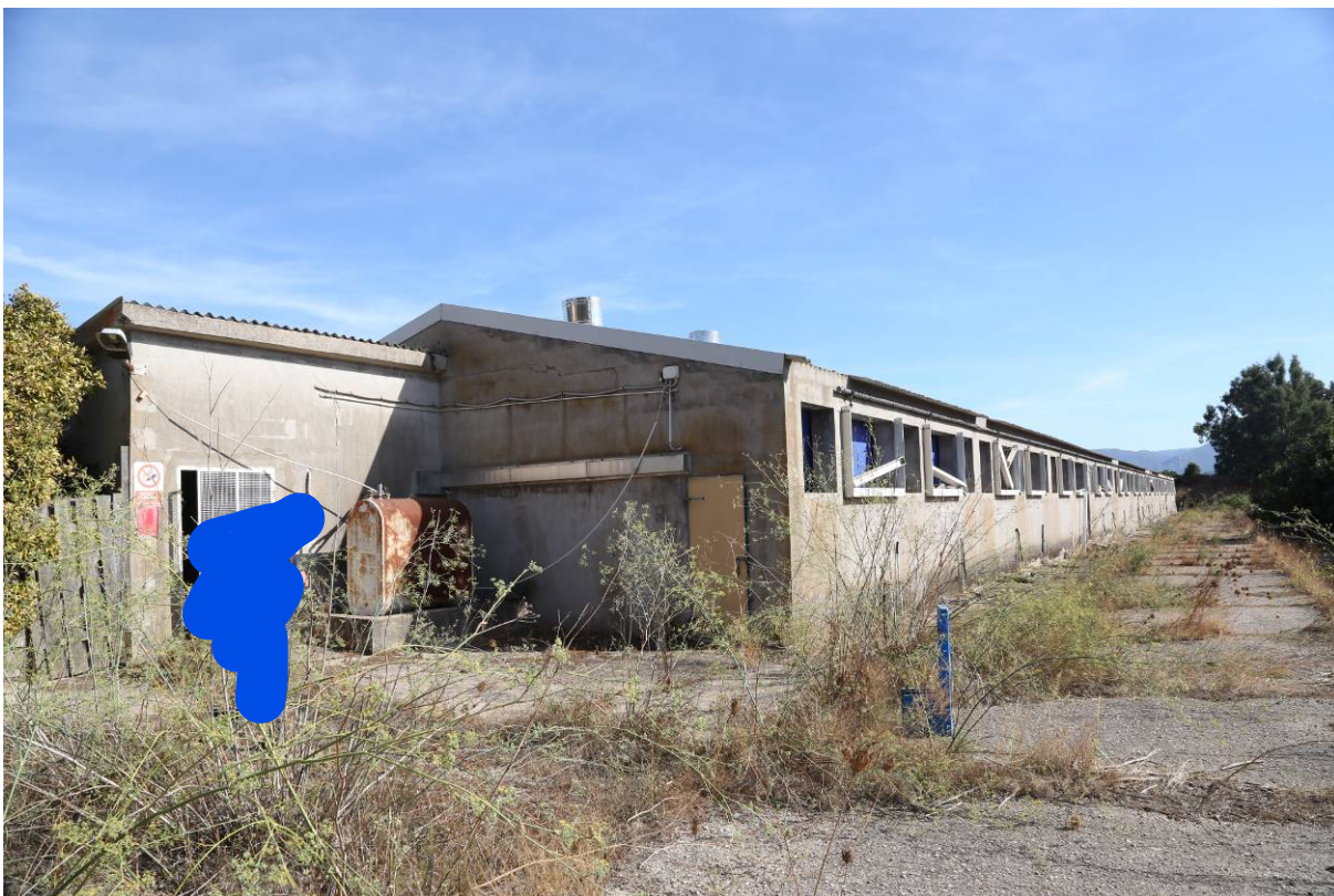
74 – BOX INGRASSO – (Particella 156)