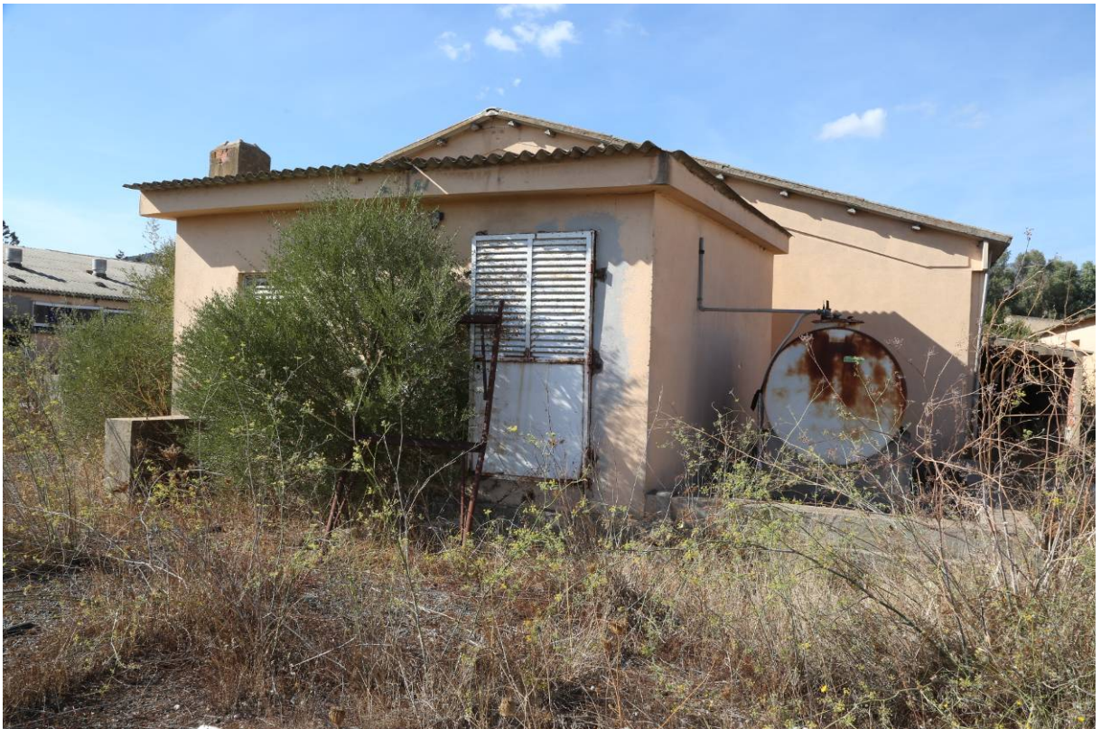
89 – CENTRALE TERMICA 1 (Particella 199)