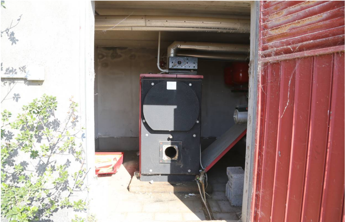
94 – CENTRALE TERMICA 4 (Particella 204)