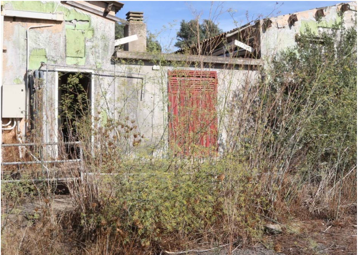
93 – CENTRALE TERMICA 3 (Particella 203)