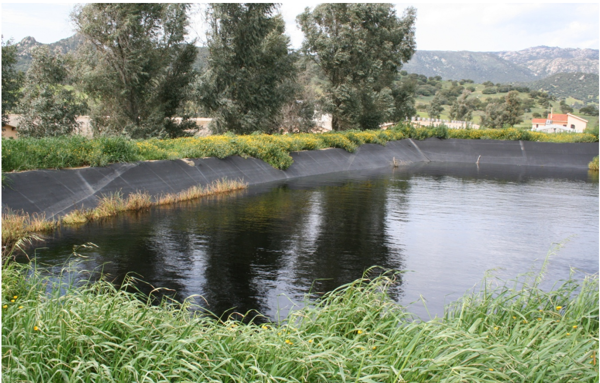
113 – LAGUNE DI OSSIDAZIONE: Vista interna di una vasca