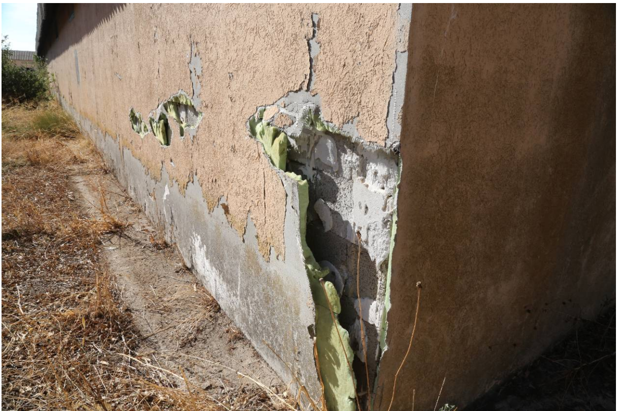
68 – BOX SVEZZAMENTO – (Particella 154) Fronte sud