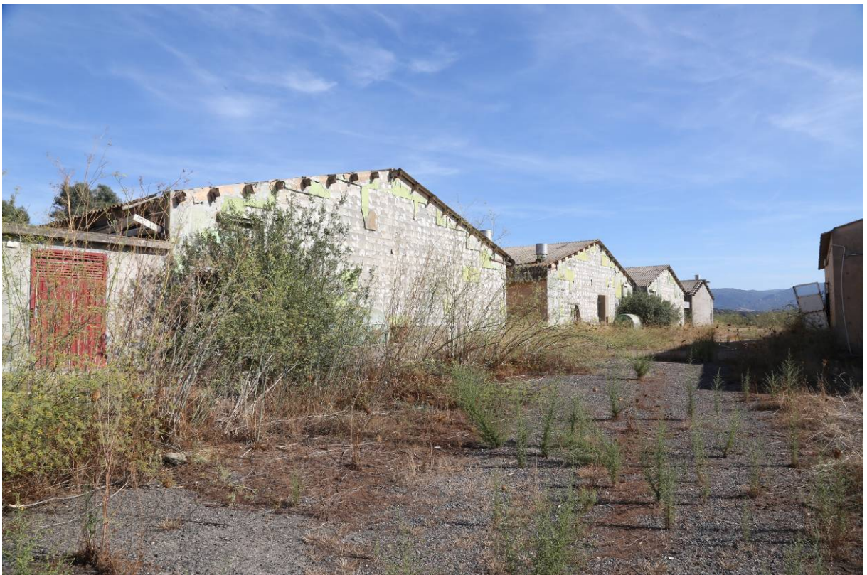
64 – SALA PARTO – (Particella 153) a sinistra la centrale termica