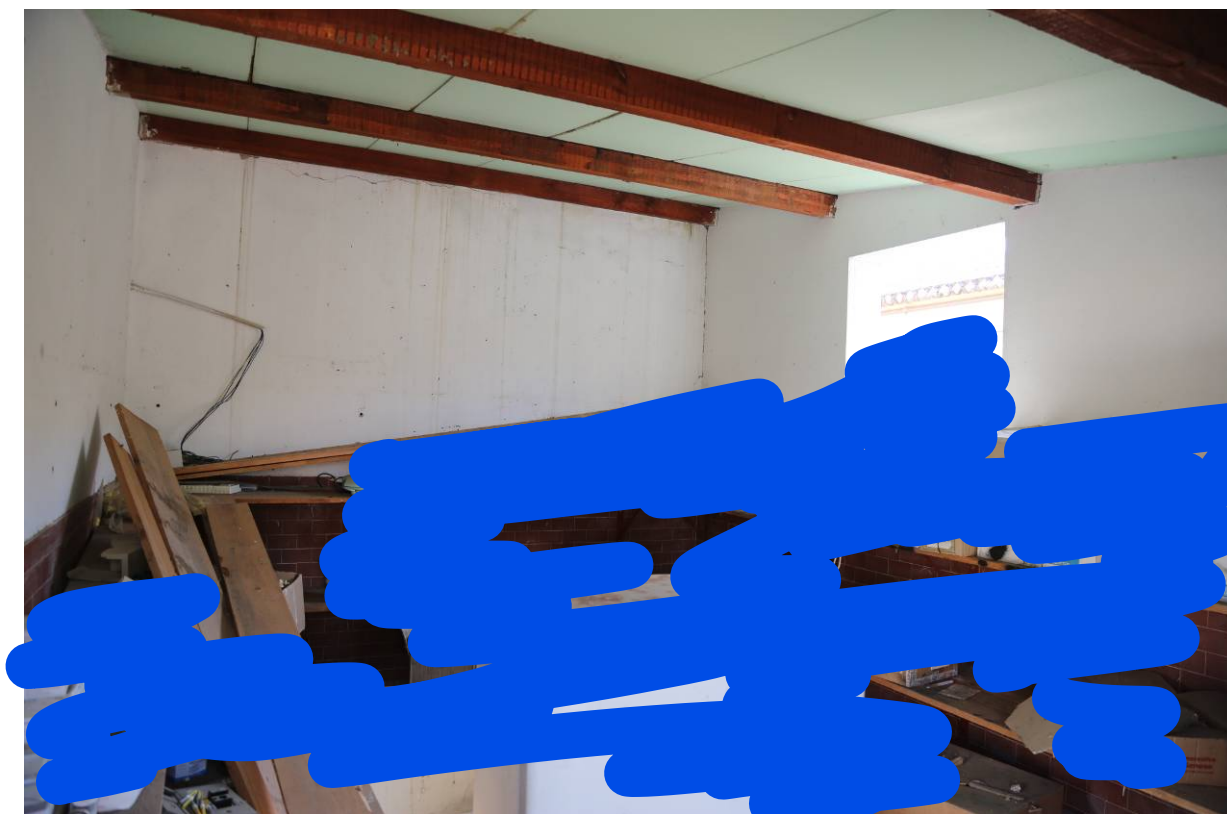
101 – MAGAZZINO-LABORATORIO (Particella 198): Interno