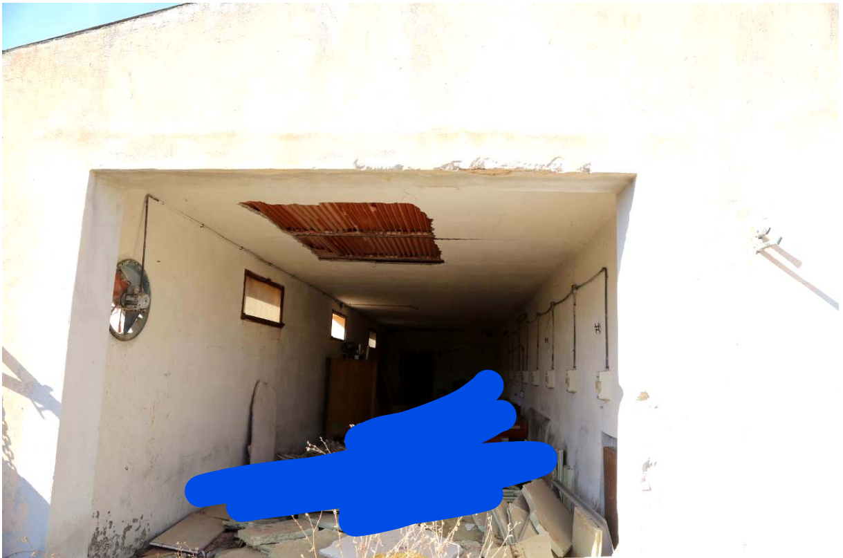
96 –RECUPERO SCARTI MACELLAZIONE – CELLE FRIGO: Interno