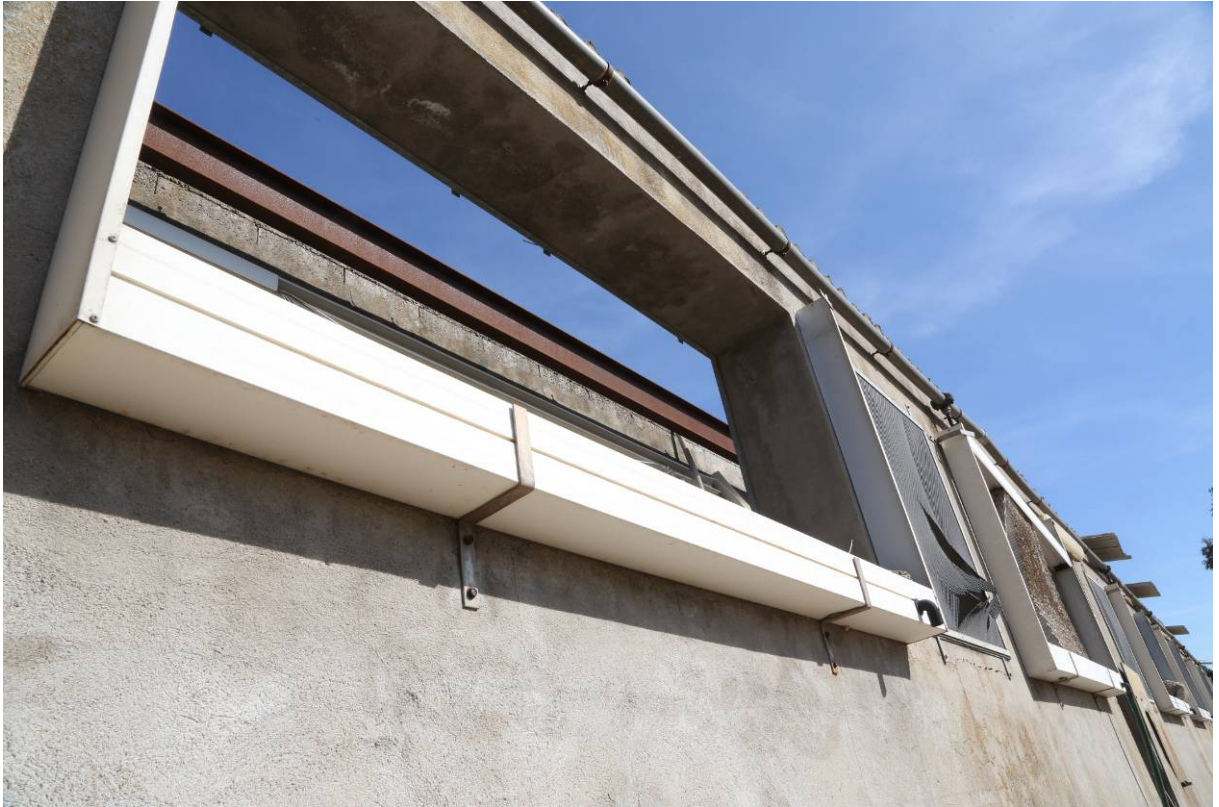
79 – BOX INGRASSO – (Particella 156)