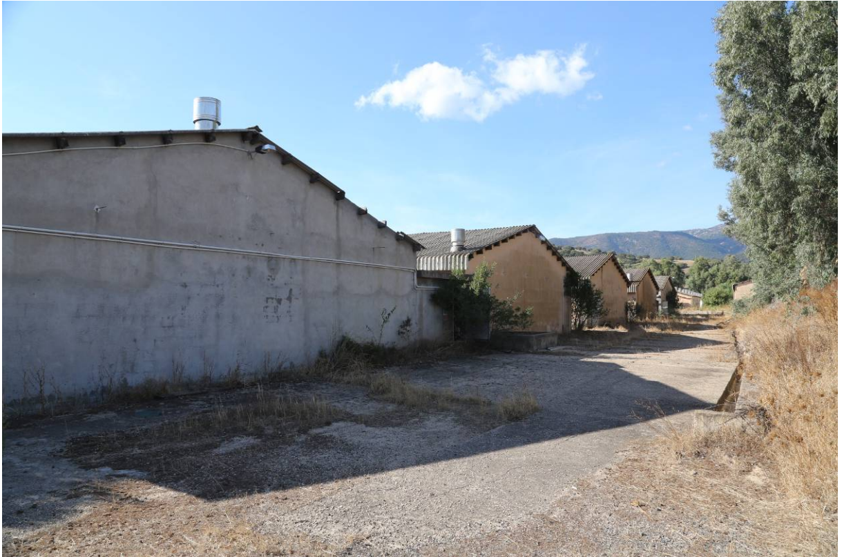
65 – BOX SVEZZAMENTO, BOX INGRASSO E SALE PARTO – (Particelle 149-155-154-153-152) Fronte Ovest