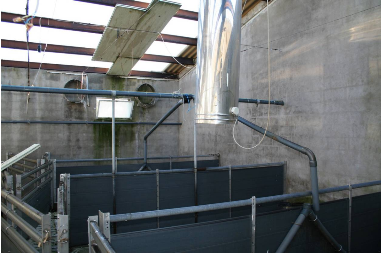
77 – BOX INGRASSO – Interno – (Particella 156)