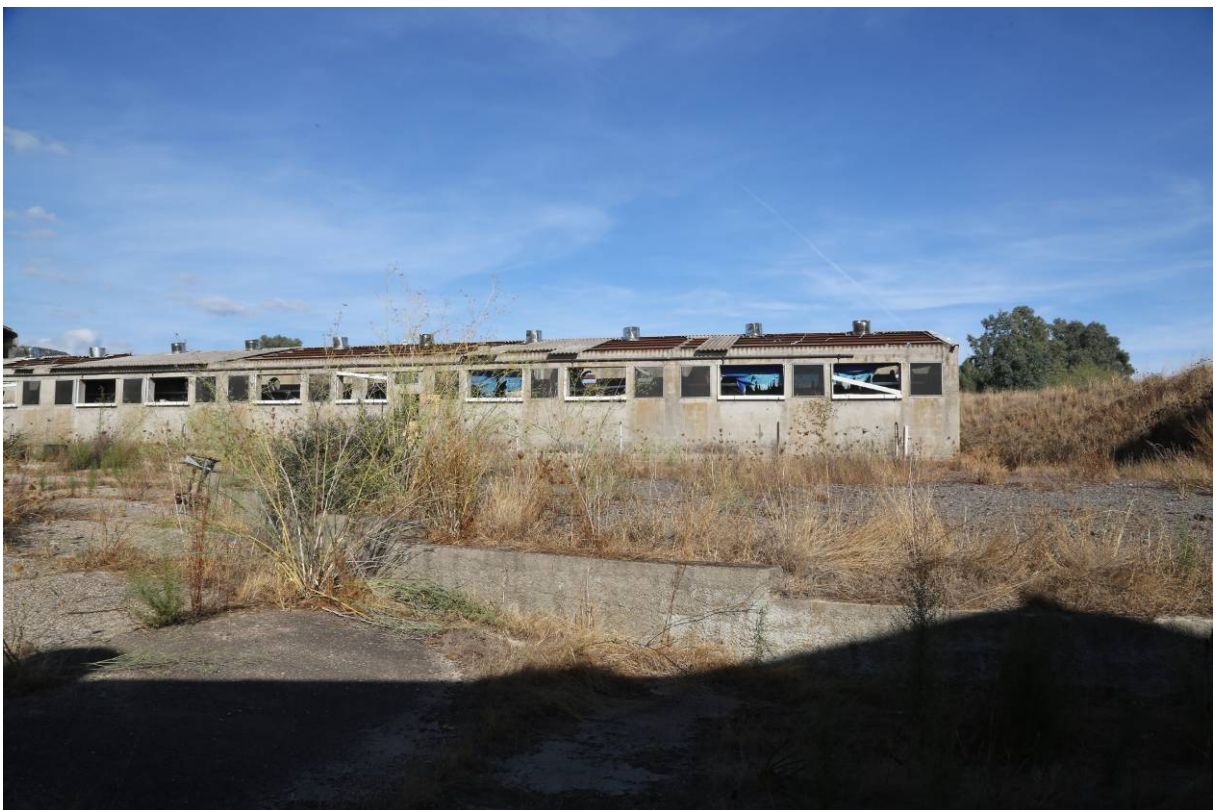
80 – BOX INGRASSO – (Particella 156)