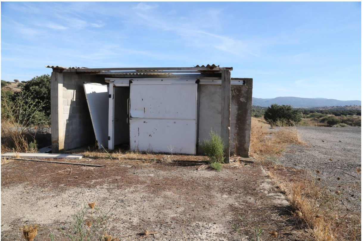
105 – FABBRICATO CELLA FRIGO (Particella 201)