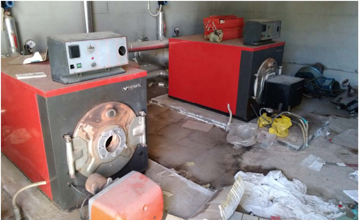
92 – CENTRALE TERMICA 2 (Particella 200) – Interno