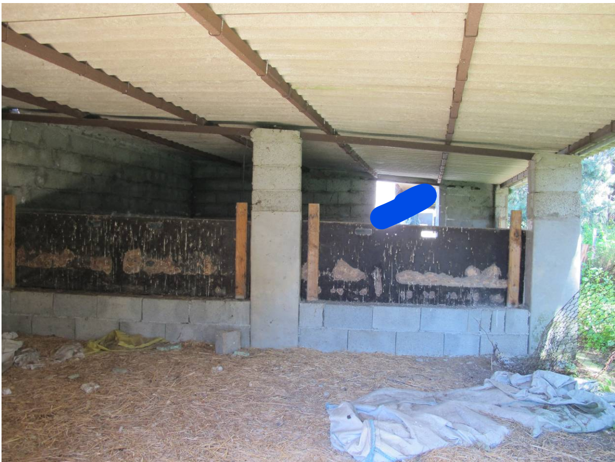
107 – PORCILAIE (Particella 202)