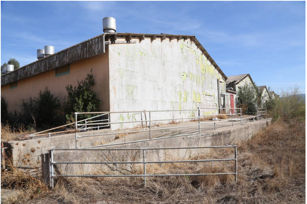
61 – SALA PARTO (Particella 152) e centrale termica (Particella 203)