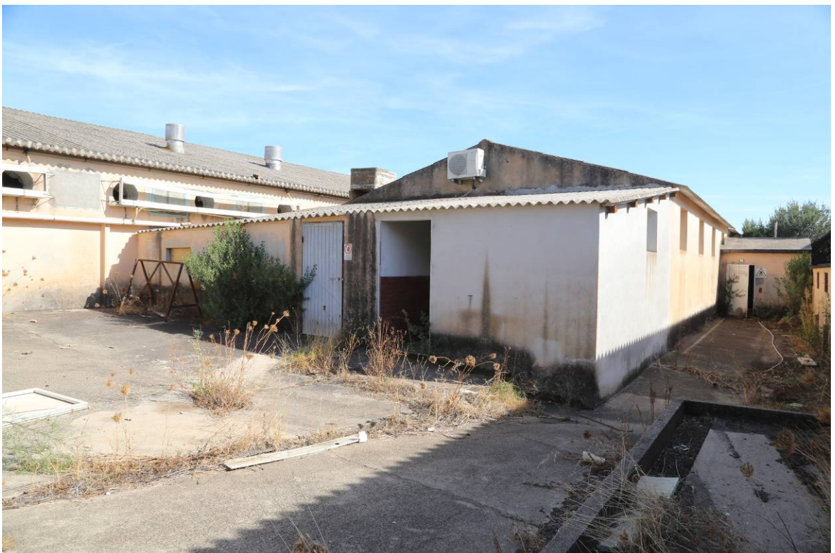
97 –SALA VERRI E MAGAZZINO-LABORATORIO (Particella 198)