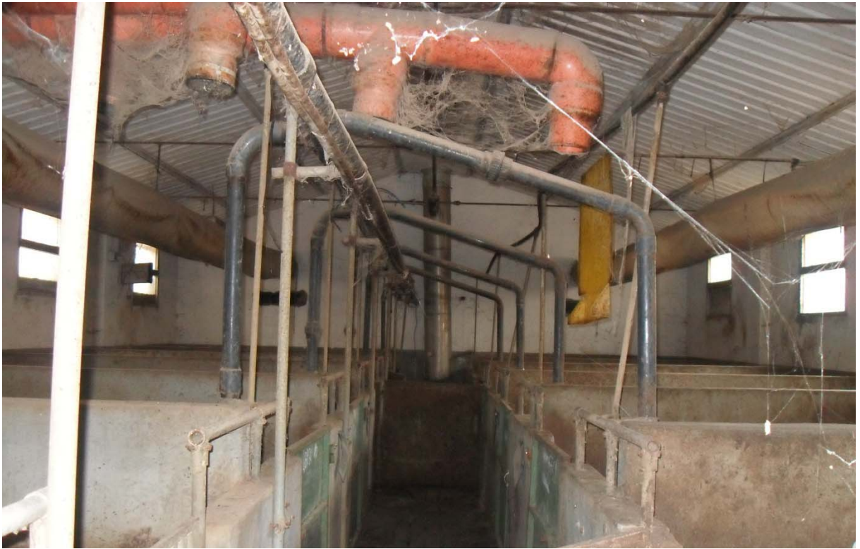
98 –SALA VERRI: Interno (Particella 198)