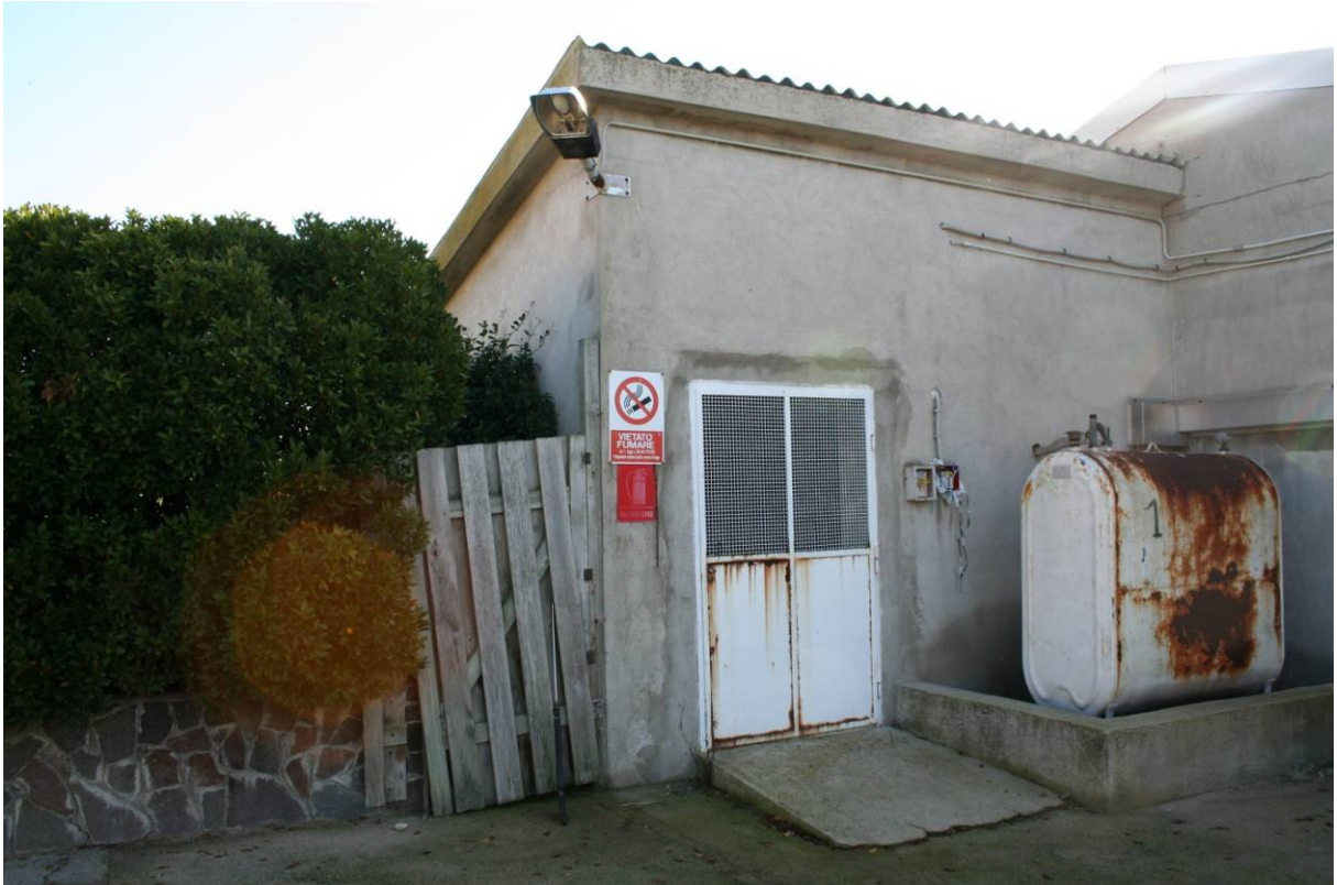
75 – BOX INGRASSO – Centrale Termica – (Particella 156)