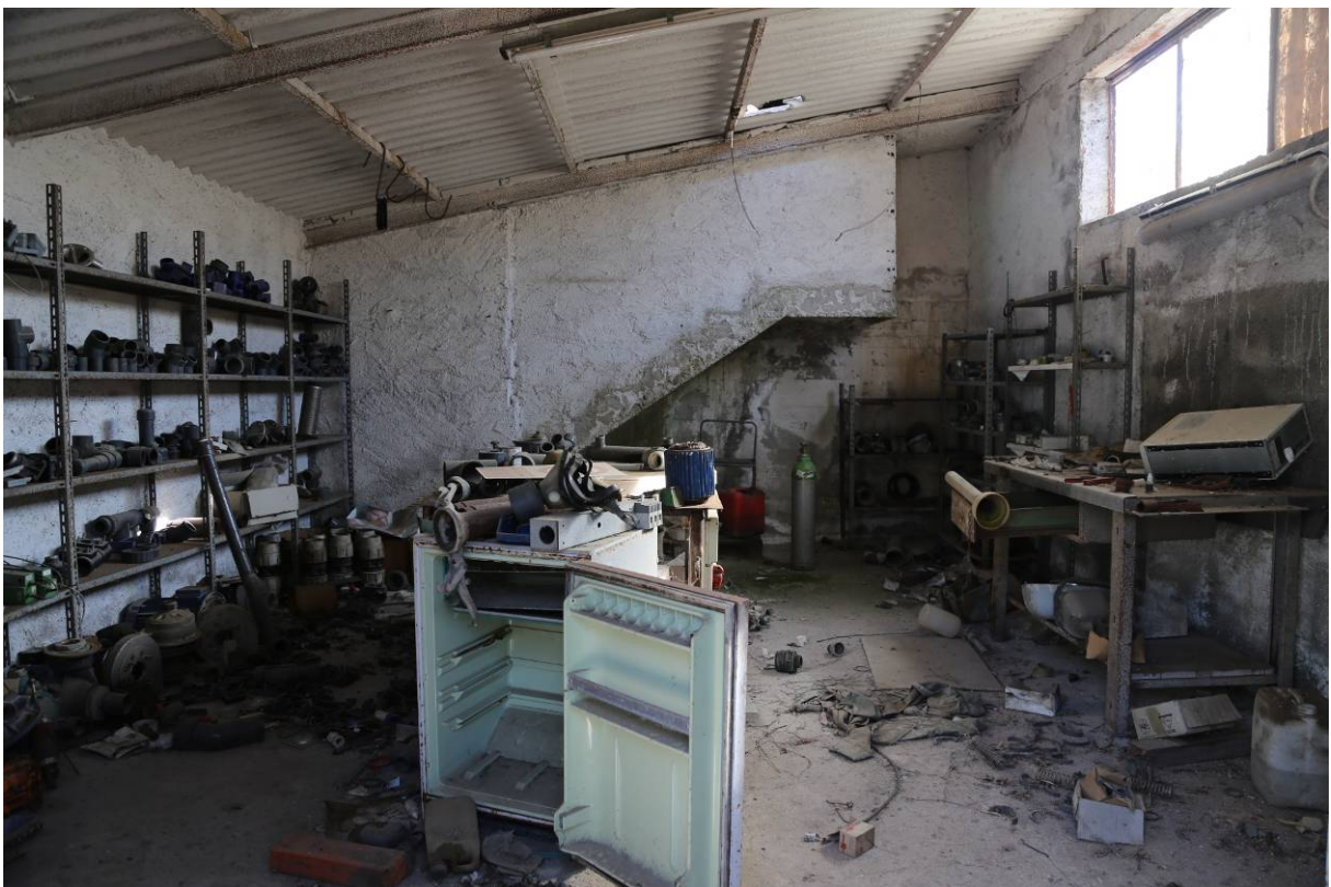
103 – OFFICINA (Particella 197): Interno