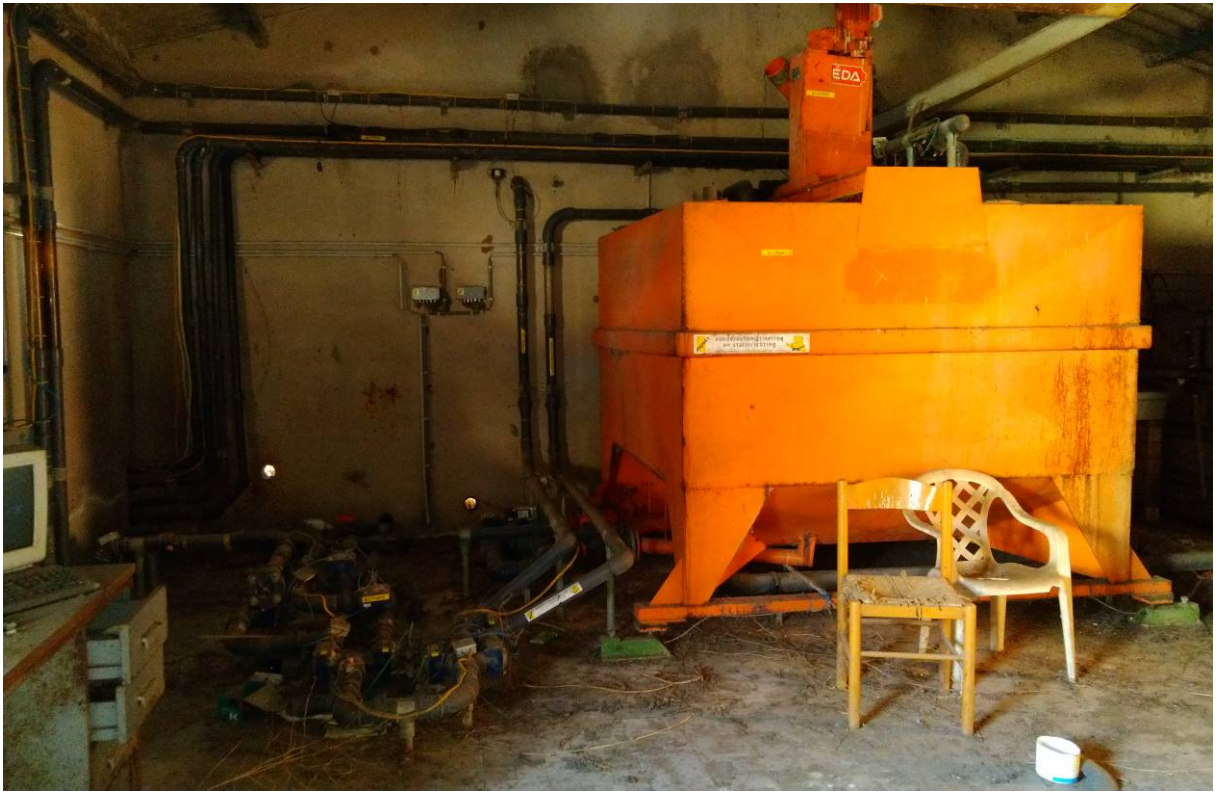
88 – LOCALE PREPARAZIONE MANGIMI – Interno – (Particella 169)