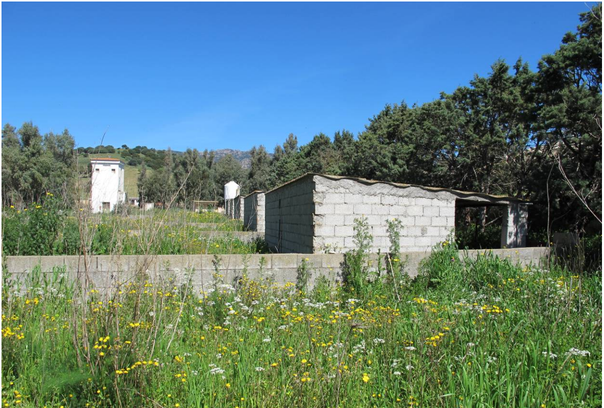
106 – PORCILAIE (Particella 202)