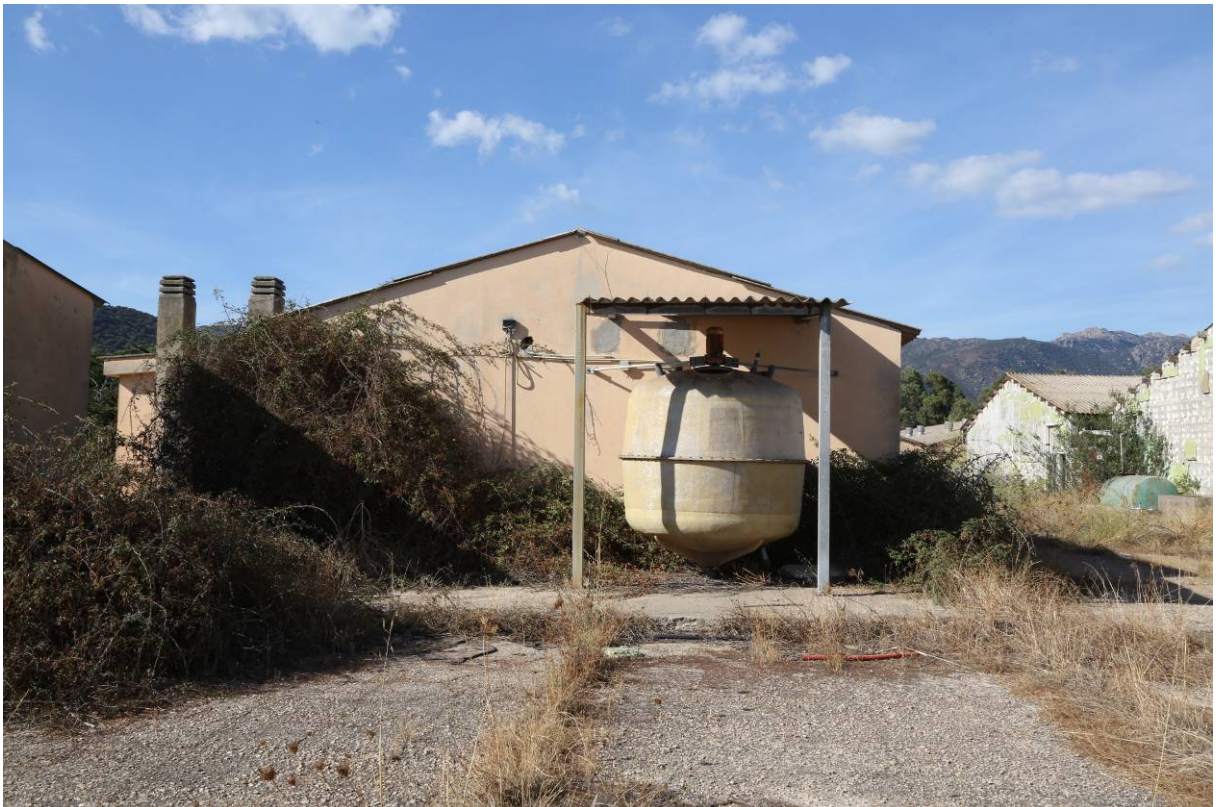
85 – PREPARAZIONE MANGIMI – (Particella 169)