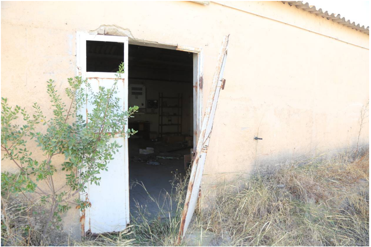
86 – PREPARAZIONE MANGIMI – (Particella 169)