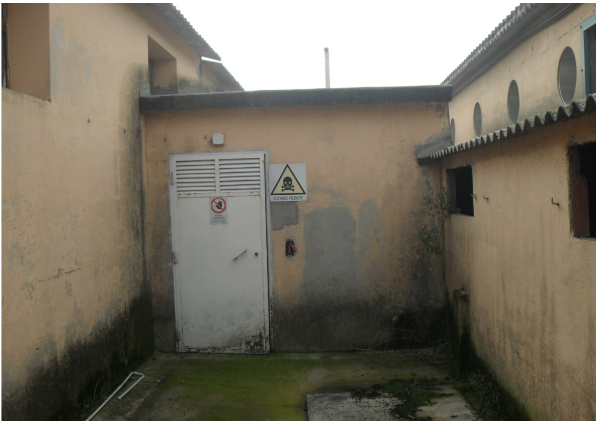
99 – MAGAZZINO-MEDICINALI (Particella 198)