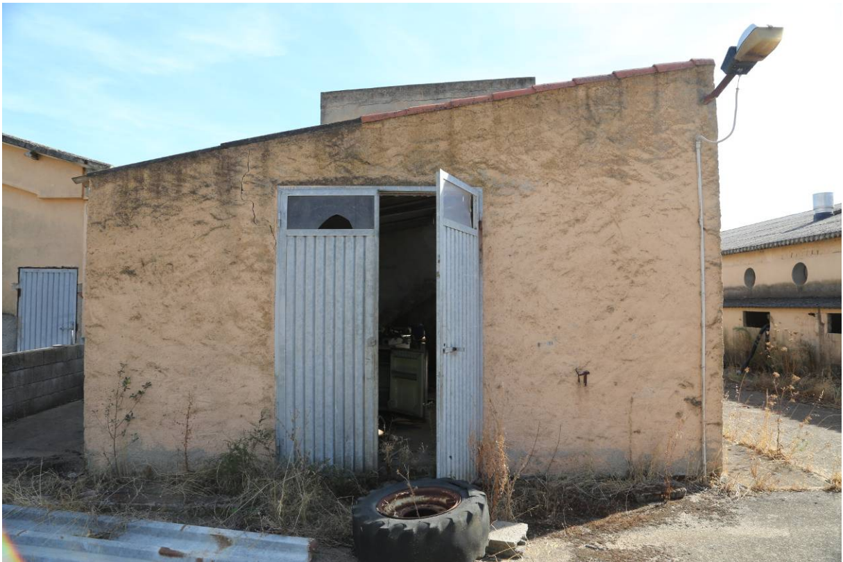
102 – OFFICINA (Particella 197)