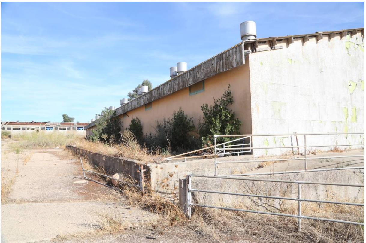
62 – SALA PARTO – (Particella 152)