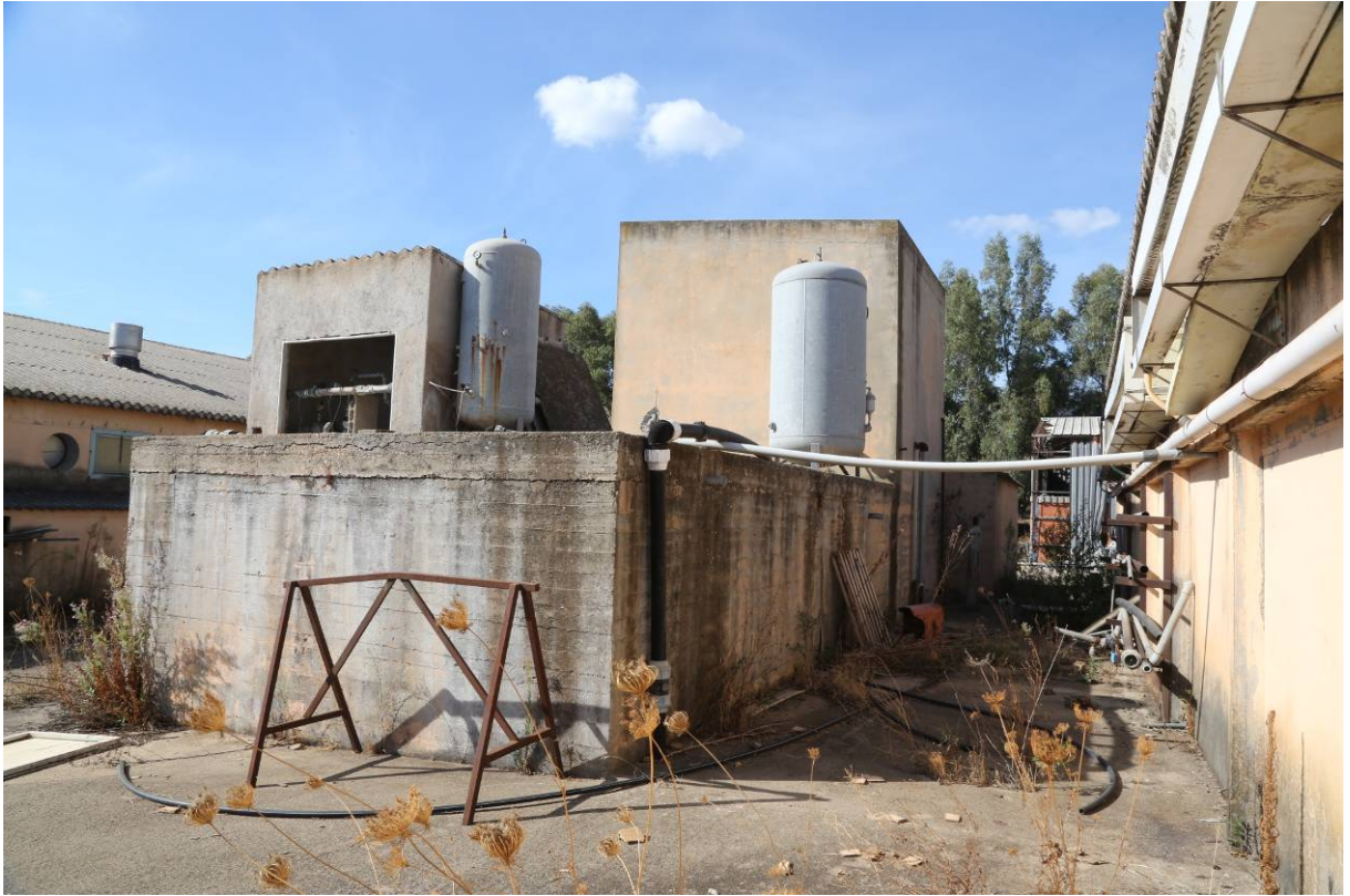
104 – VASCA RISERVA IDRICA E LOCALE POMPE (Particella 197)