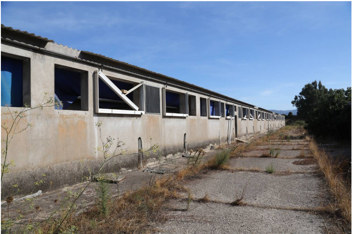
78 – BOX INGRASSO – (Particella 156)