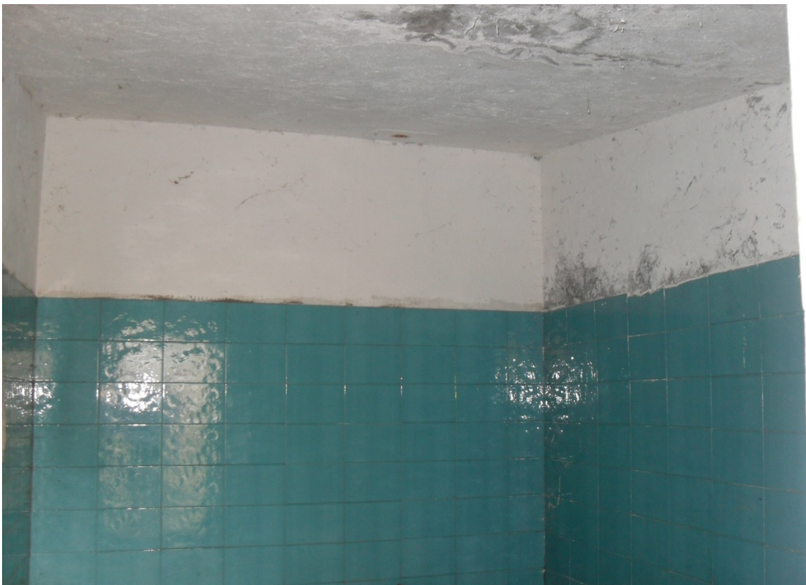
100 – MAGAZZINO-MEDICINALI (Particella 198): Interno