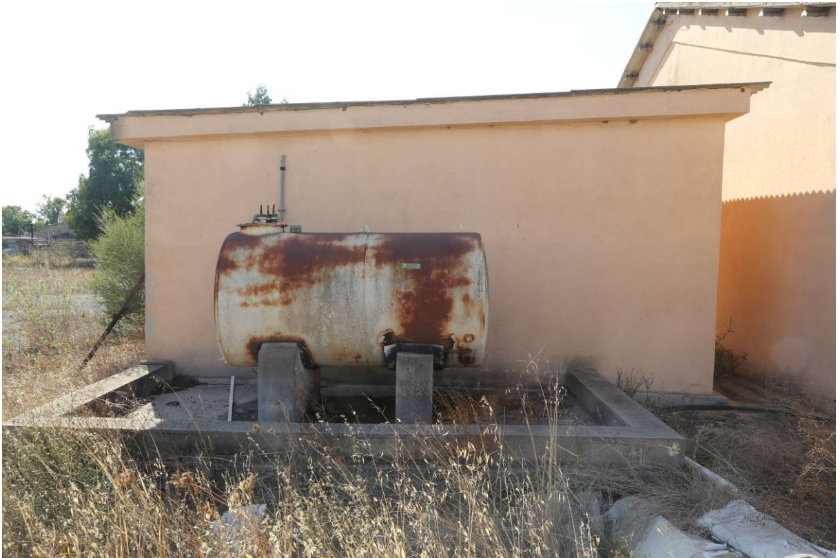
90 – CENTRALE TERMICA 1 (Particella 199)