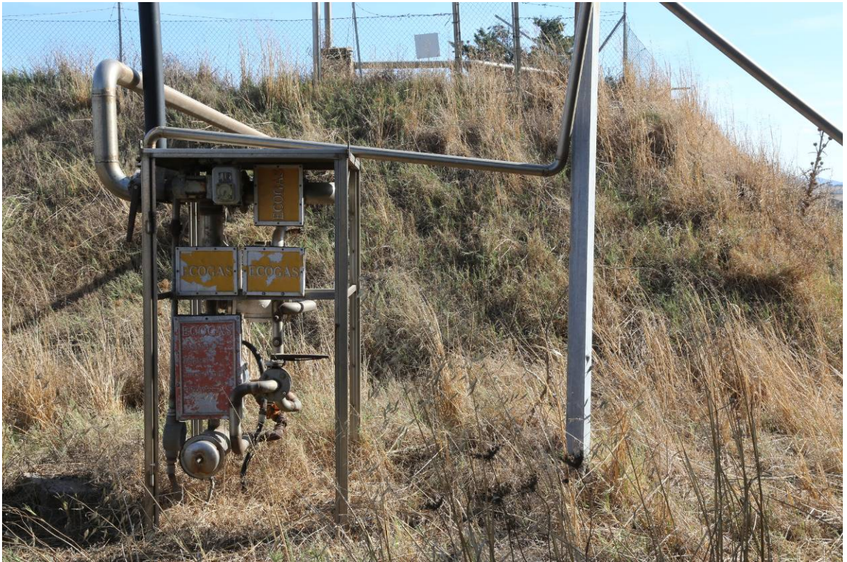
110 – IMPIANTO BIO GAS: Apparecchiature