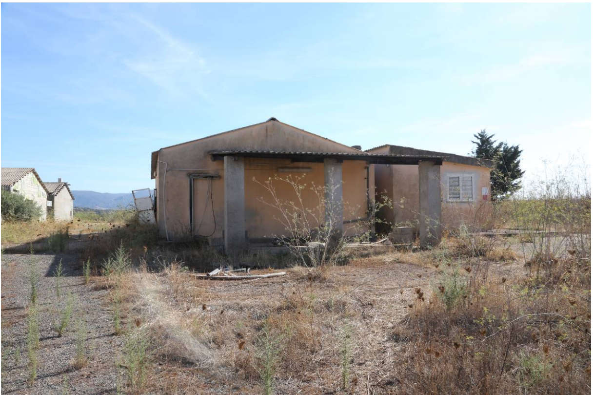
83 – PREPARAZIONE MANGIMI-DEPOSITO – (Particella 169)