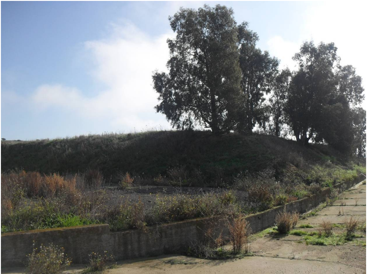
112 – LAGUNE DI OSSIDAZIONE: Vista esterna degli argini