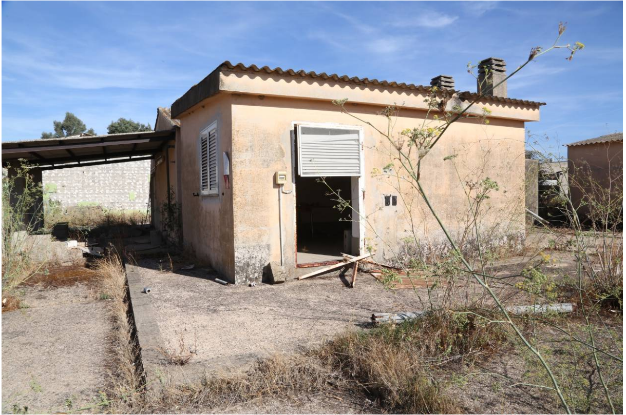
84 – DEPOSITO – (Particella 169)