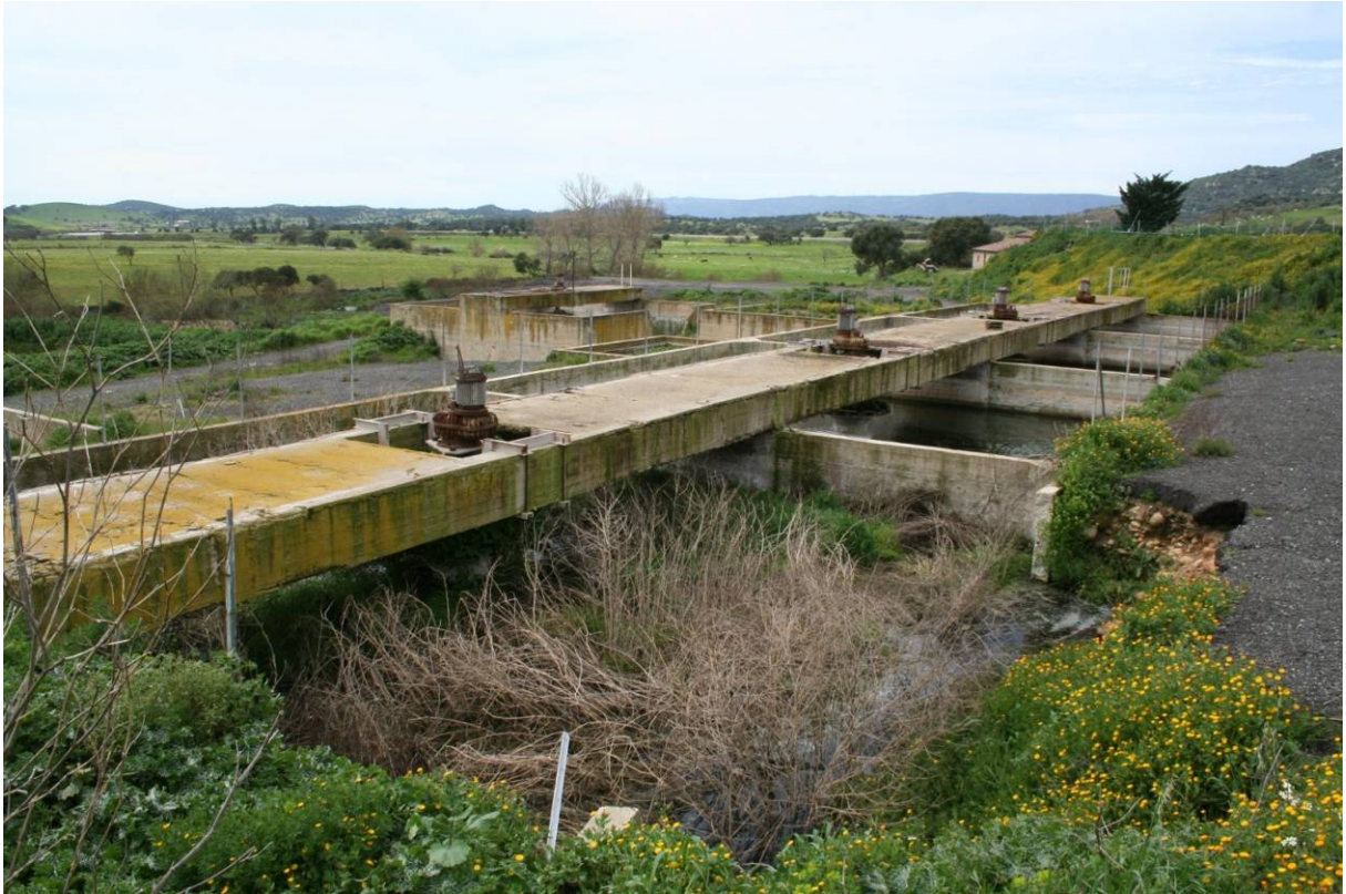
108 – VASCHE IMPIANTO DI DEPURAZIONE