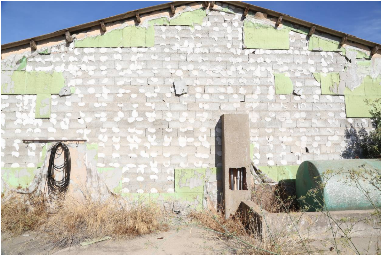
67 – BOX SVEZZAMENTO – (Particella 154) Fronte ovest