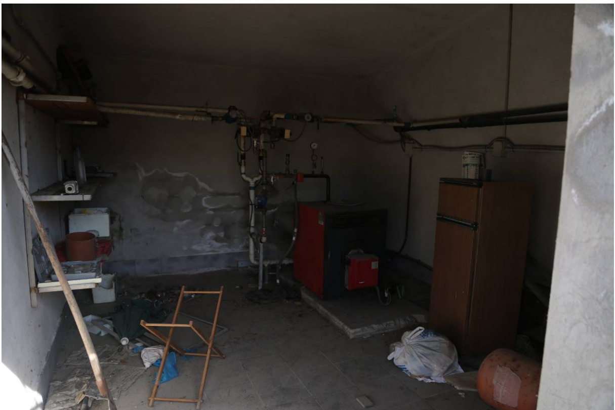
76 – BOX INGRASSO – Interno centrale Termica – (Particella 156)