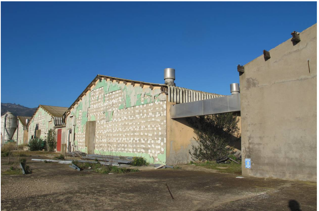
66 – BOX SVEZZAMENTO, BOX INGRASSO E SALE PARTO – (Particelle 153-154-155-149) Fronte Est