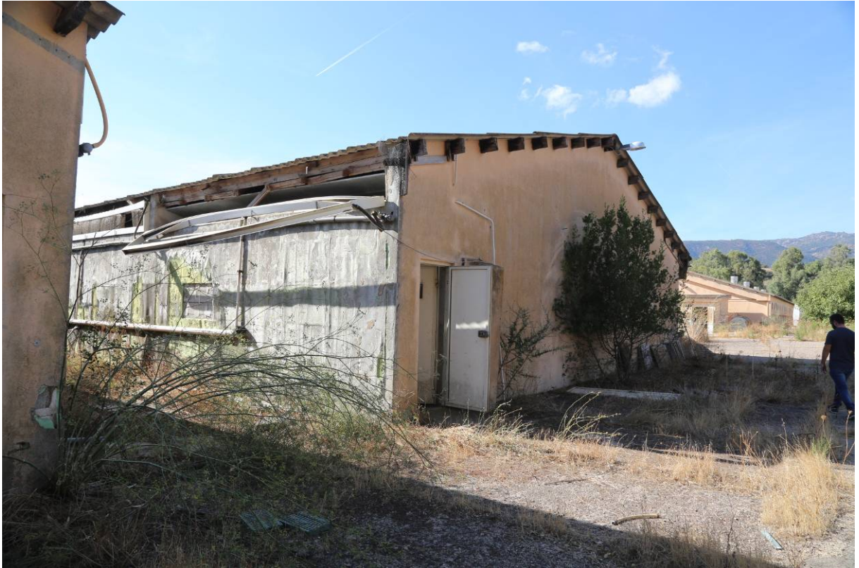
63 – SALA PARTO – (Particella 152)