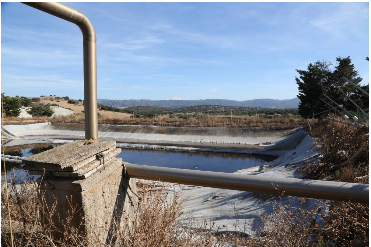
111 – IMPIANTO BIO GAS: Vasca