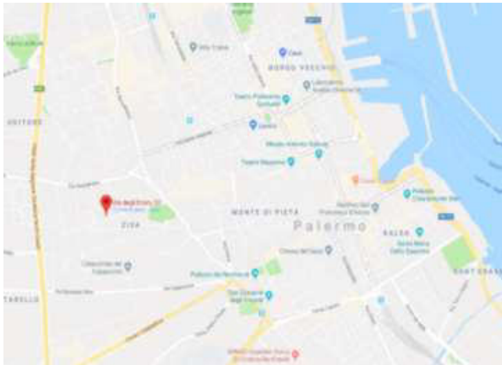
MAPPA DELLA CITTA