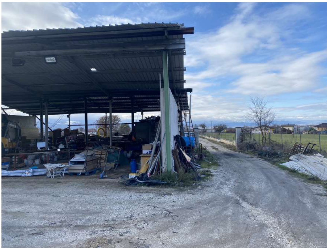
Foto 3: Vista dell'accesso al terreno e del manufatto da demolire.