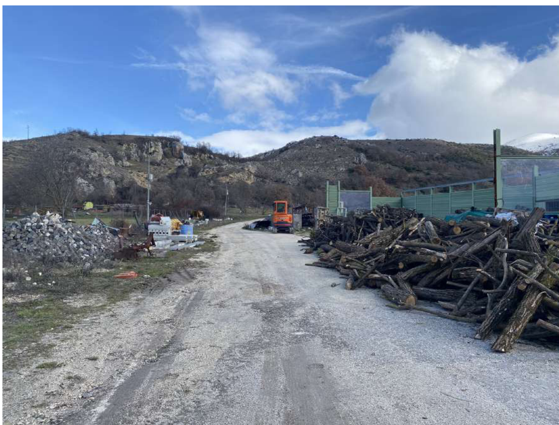
Foto 4: Vista interna del terreno e di attrezzature e macchinari presenti