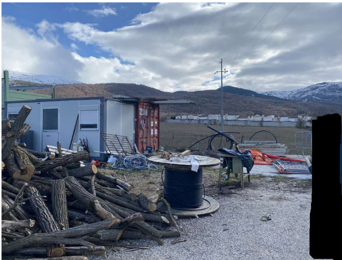
Foto 5: Vista interna del terreno, di altro manufatto da smantellare e del cimitero in orizzonte e di attrezzature e macchinari presenti