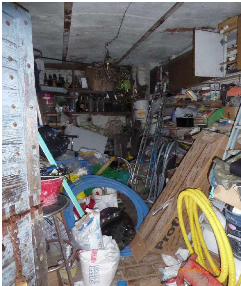
MAGAZZINI PIANO TERRA