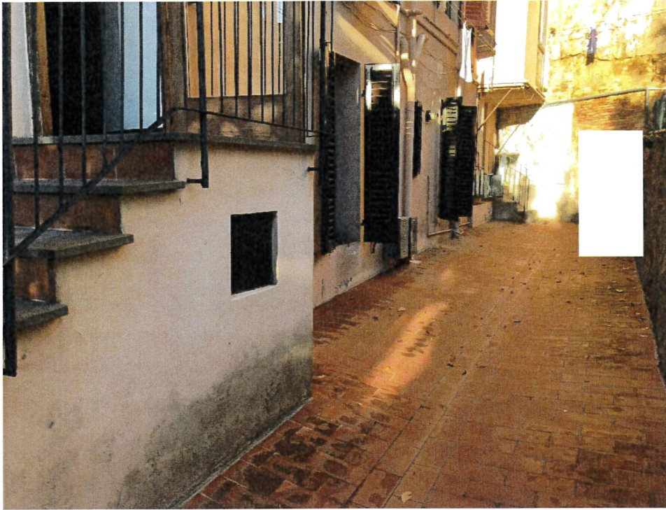
Vista dal retro – corte comune