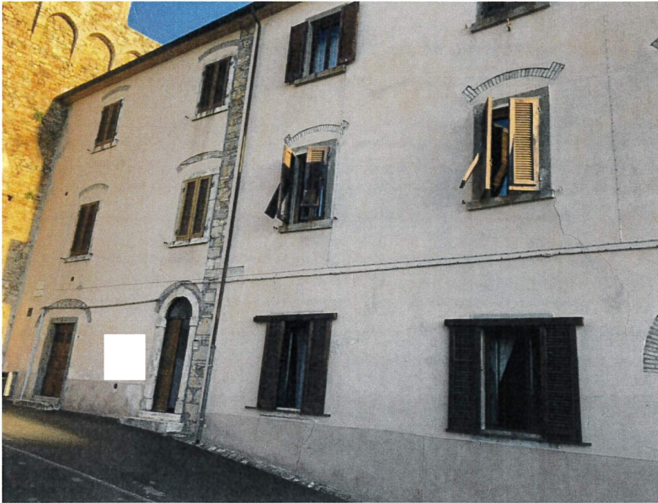
Vista da Via Curtatone