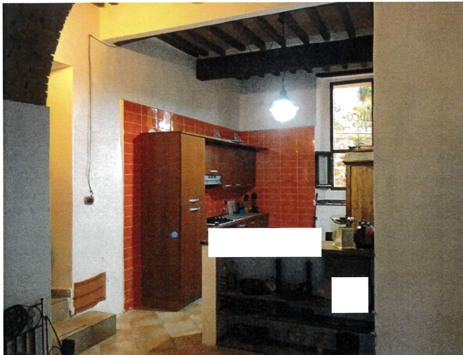
Cucina vista dal soggiorno