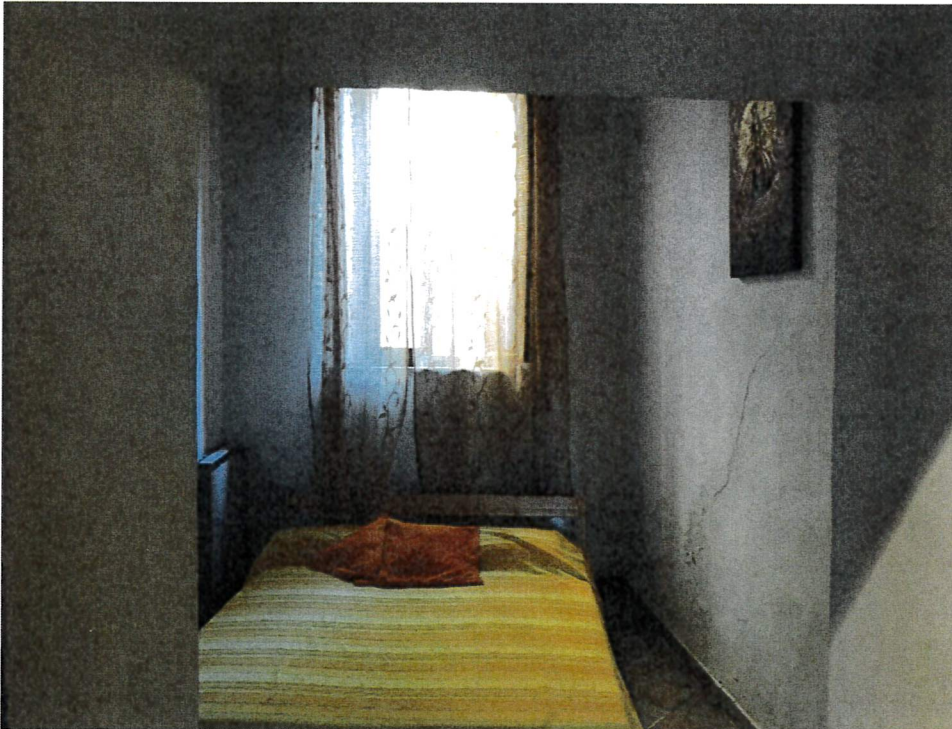
Camara da letto