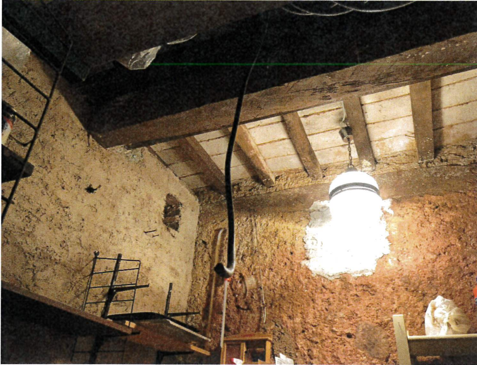
Vista interno ripostiglio