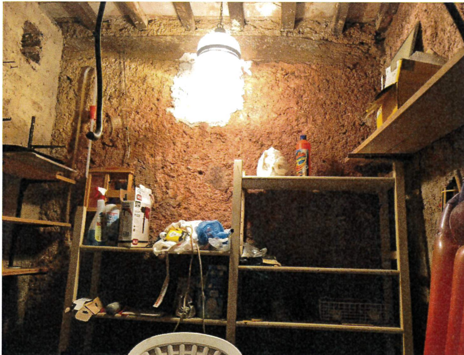
Vista interno ripostiglio