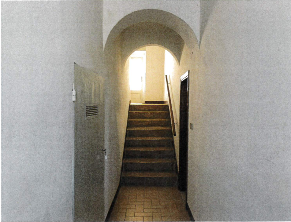
Vista vano scala

Sulla sx la porta di accesso al ripostiglio e sulla dx la posta di accesso all'appartamento-