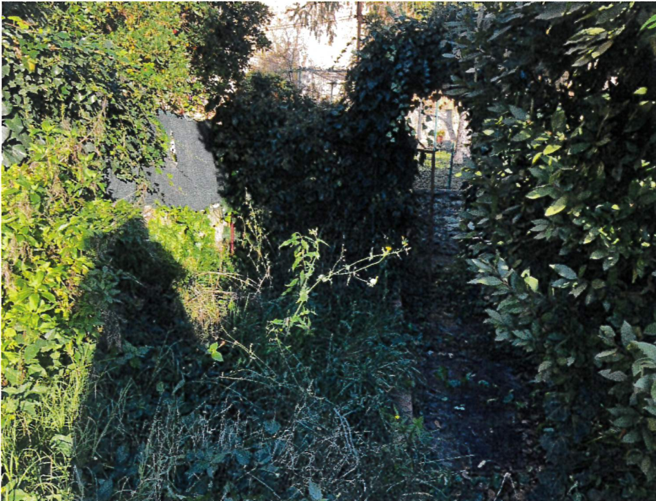
Vista della particella 529 graffata