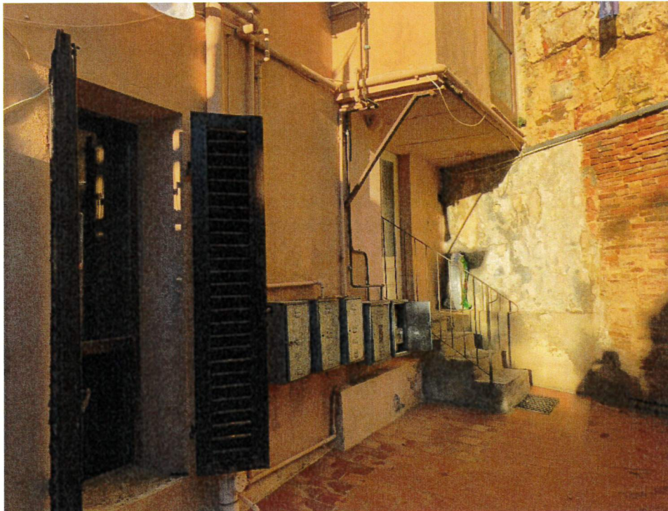
Vista dal retro – corte comune