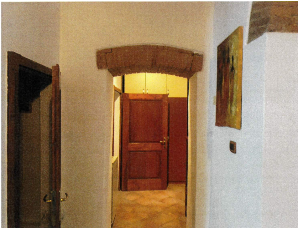
Zona ingresso e disimpegno appartamento

Sulla sx la porta di accesso al ripostiglio e sulla dx la posta di accesso all'appartamento-