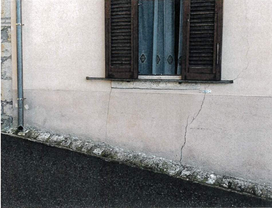
Monitoraggio murature edificio