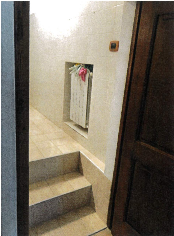
Ingresso del bagno