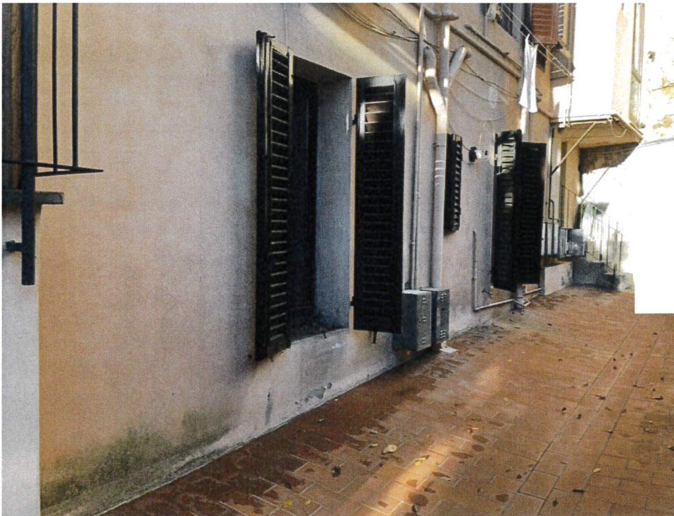
Vista dal retro – corte comune