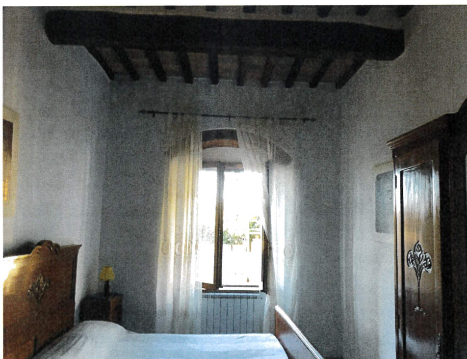
Seconda camera da letto