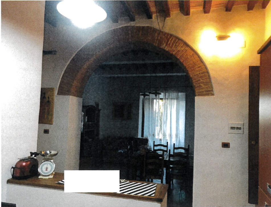
Vista ingresso e soggiorno dalla cucina