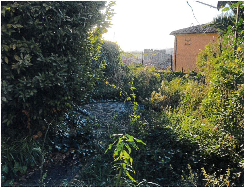
Vista della particella 529 graffata