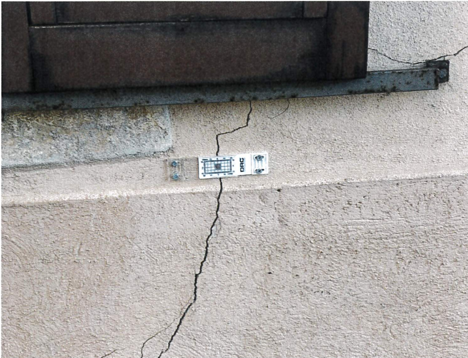
Monitoraggio murature edificio