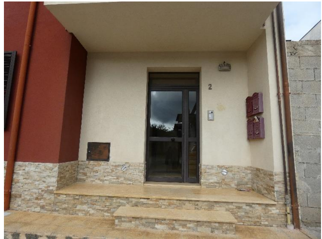
FOTO 1, 2, 3, 4 PROSPETTO SU VIA PISA E PORTONE DI INGRESSO CONDOMINIALE