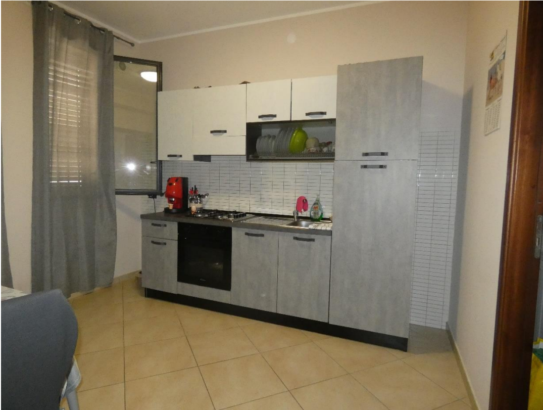
FOTO 11, 12, 13 CUCINA, ACCESSO AL CORRIDOIO DAL SOGGIORNO E CORRIDOIO