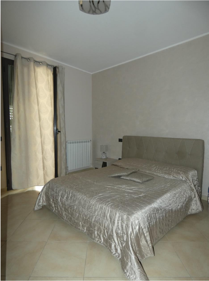
FOTO 18, 19, 20 CAMERA DA LETTO, ULTERIORE CAMERA E RIPOSTIGLIO