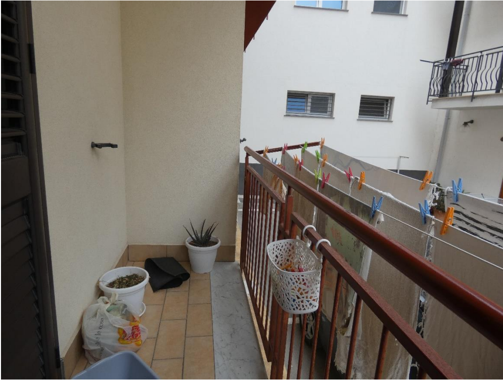
FOTO 25, 26 LOGGIA A RETROSPETTO