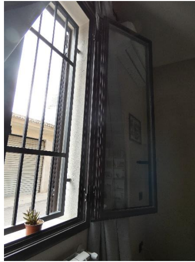
FOTO 21, 22, 23, 24 LAVANDERIA, PARTICOLARE FINESTRA SU PROSPETTO, LOGGIA SU RETROPROSPETTO