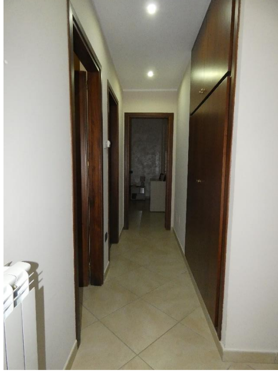
FOTO 14, 15, 16, 17 CORRIDOIO, WC DOCCIA E WC BAGNO