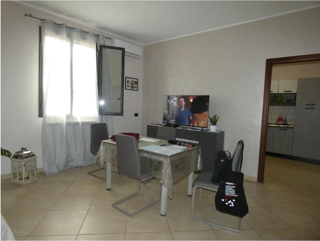
FOTO 9, 10 SOGGIORNO DI INGRESSO