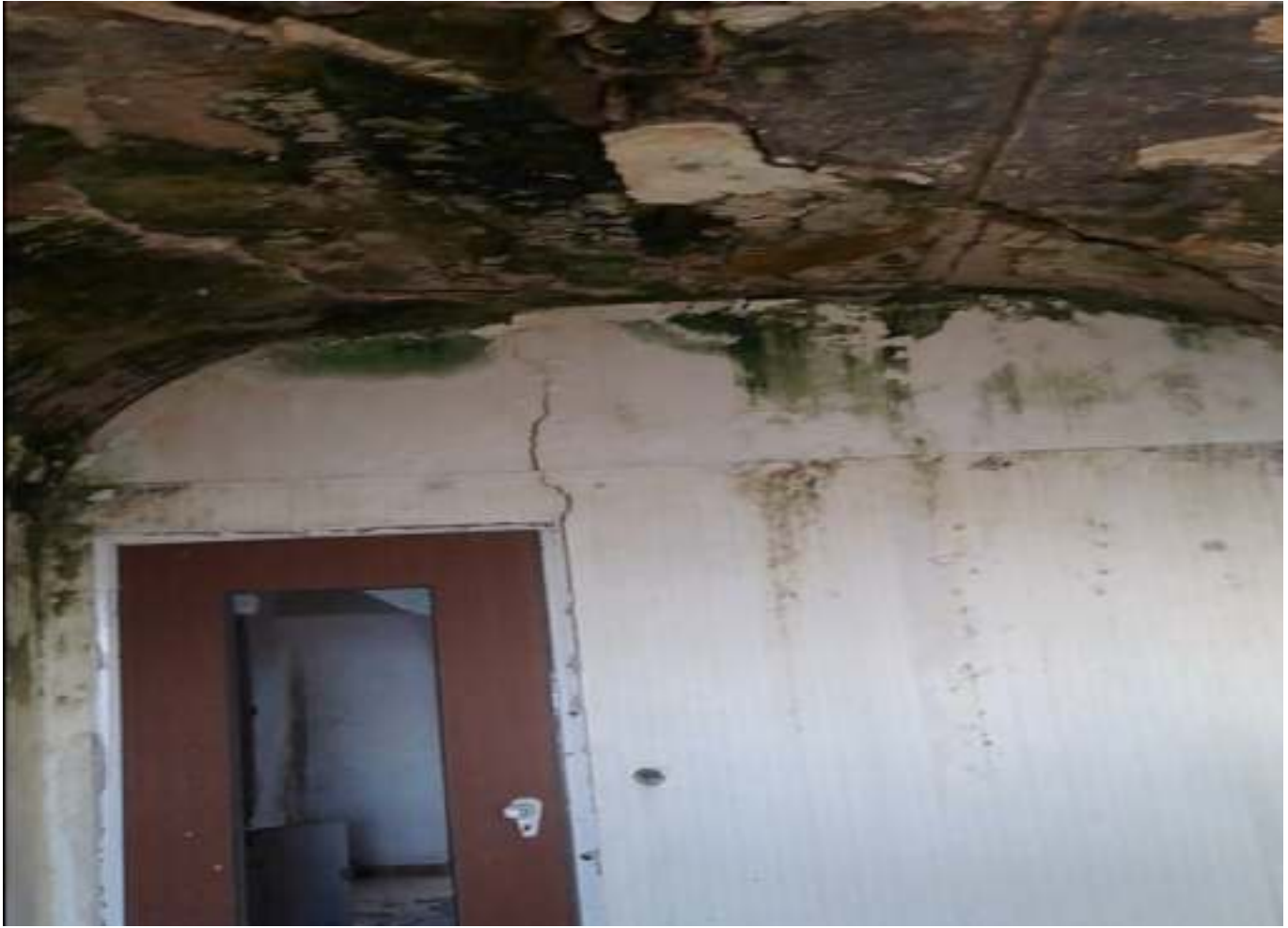
FOTO N. 13 VISTA DI PORZIONE DI VOLTA DEL LOCALE LETTO 1