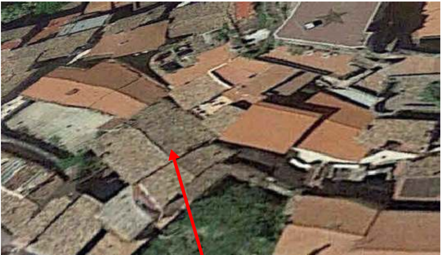
VISTA AEREA DA GOOGLE MAPS DI DETTAGLIO-QUI CESPITE