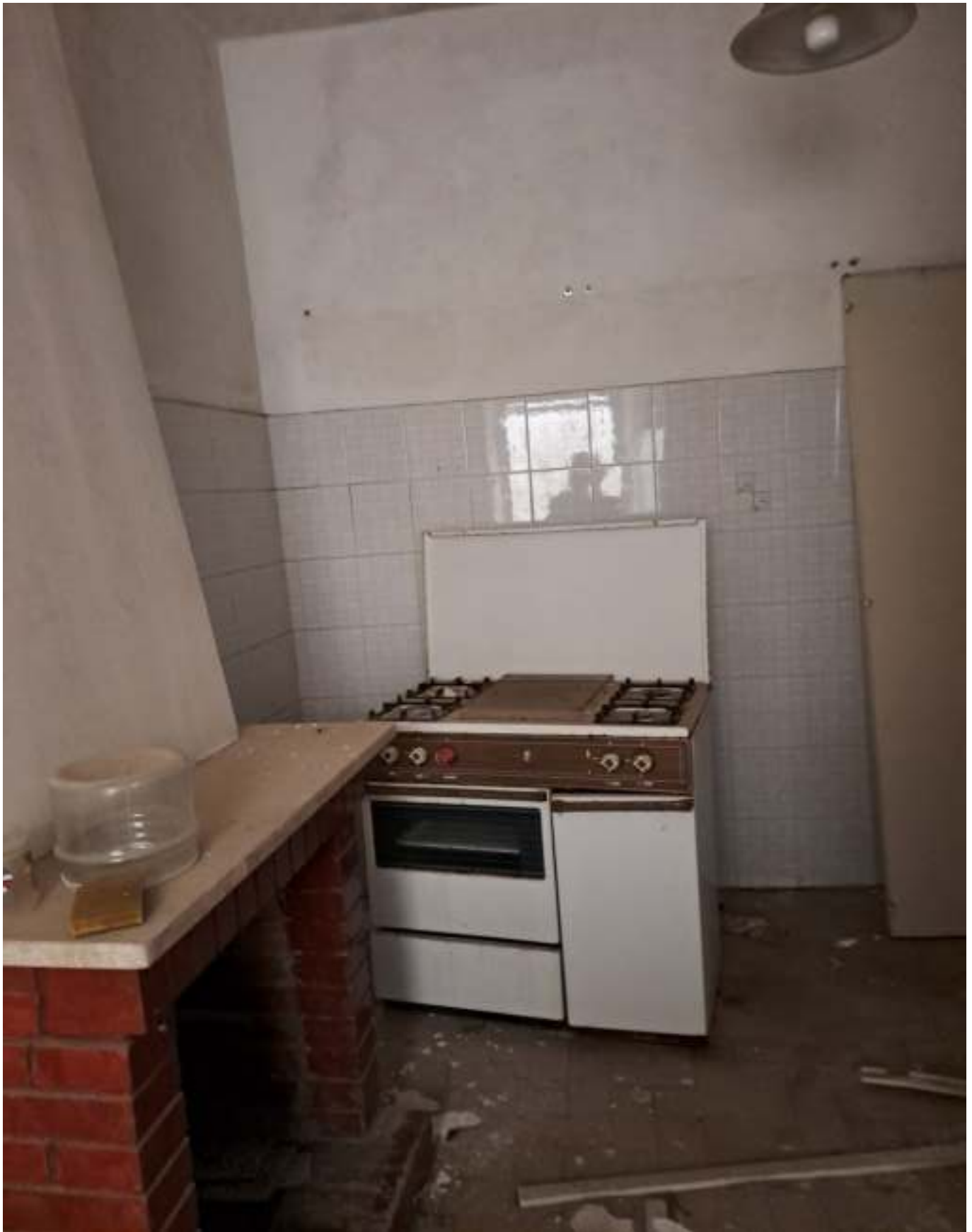
FOTO N. 9 ALTRA VISTA DEL LOCALE CUCINA