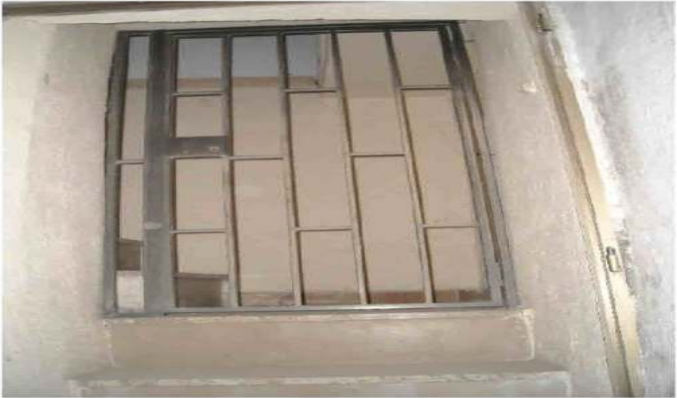
FOTO N.1 VISTA DELLA SCALA DI ACCESSO DALL'ANDRONE COMUNE