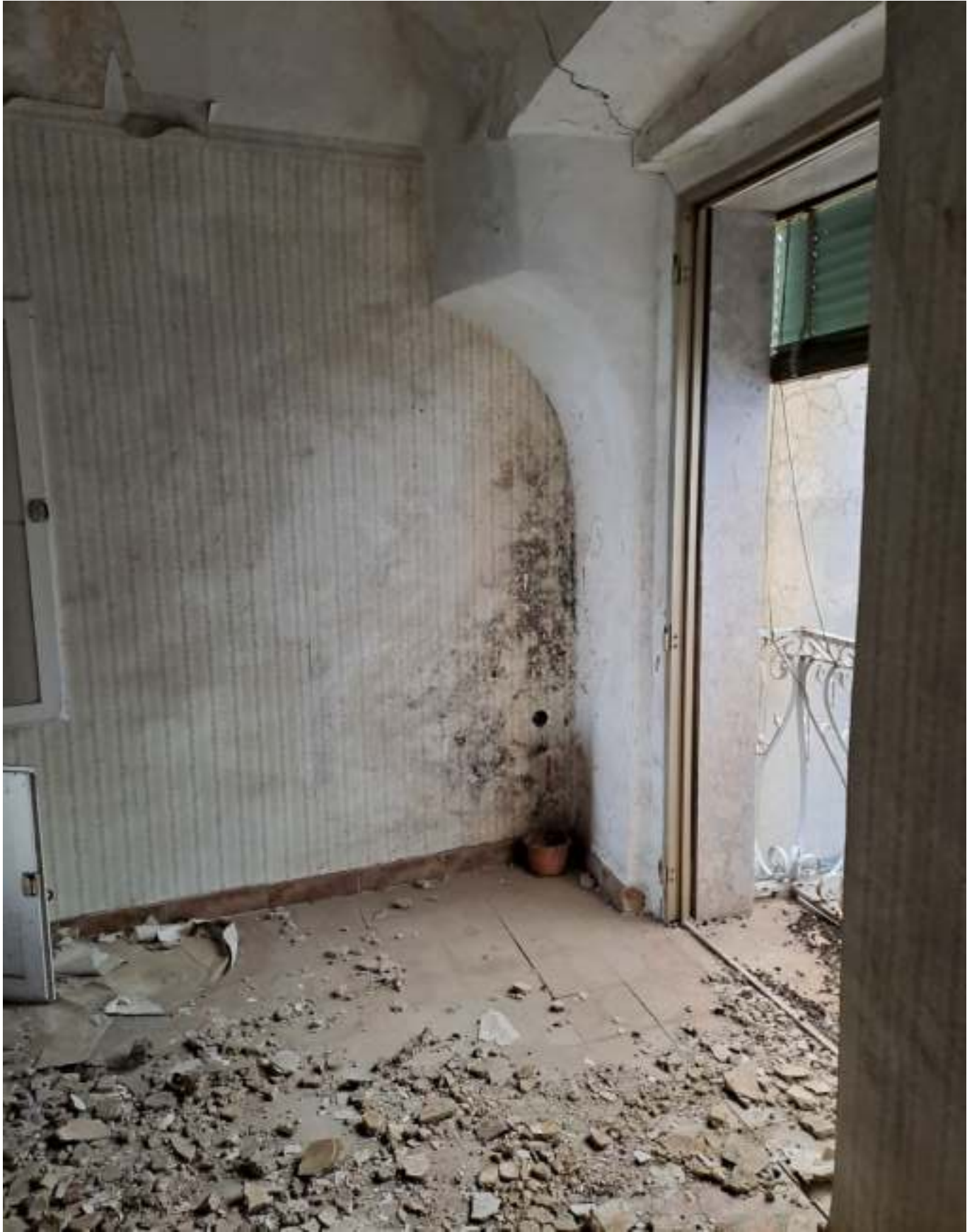
FOTO N. 5 ALTRA VISTA DEL LOCALE LETTO 1