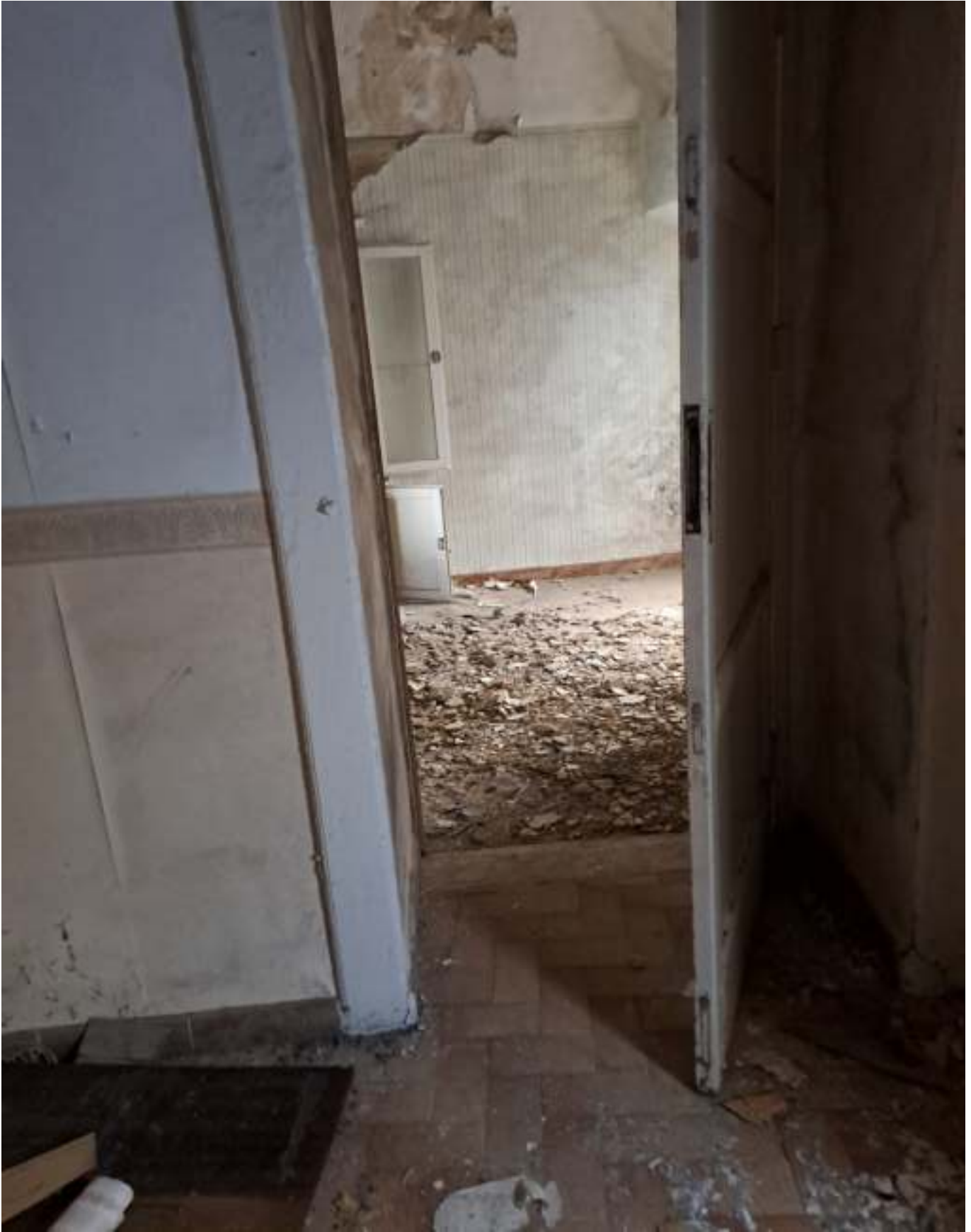
FOTO N. 4 VISTA DEL LOCALE LETTO 1