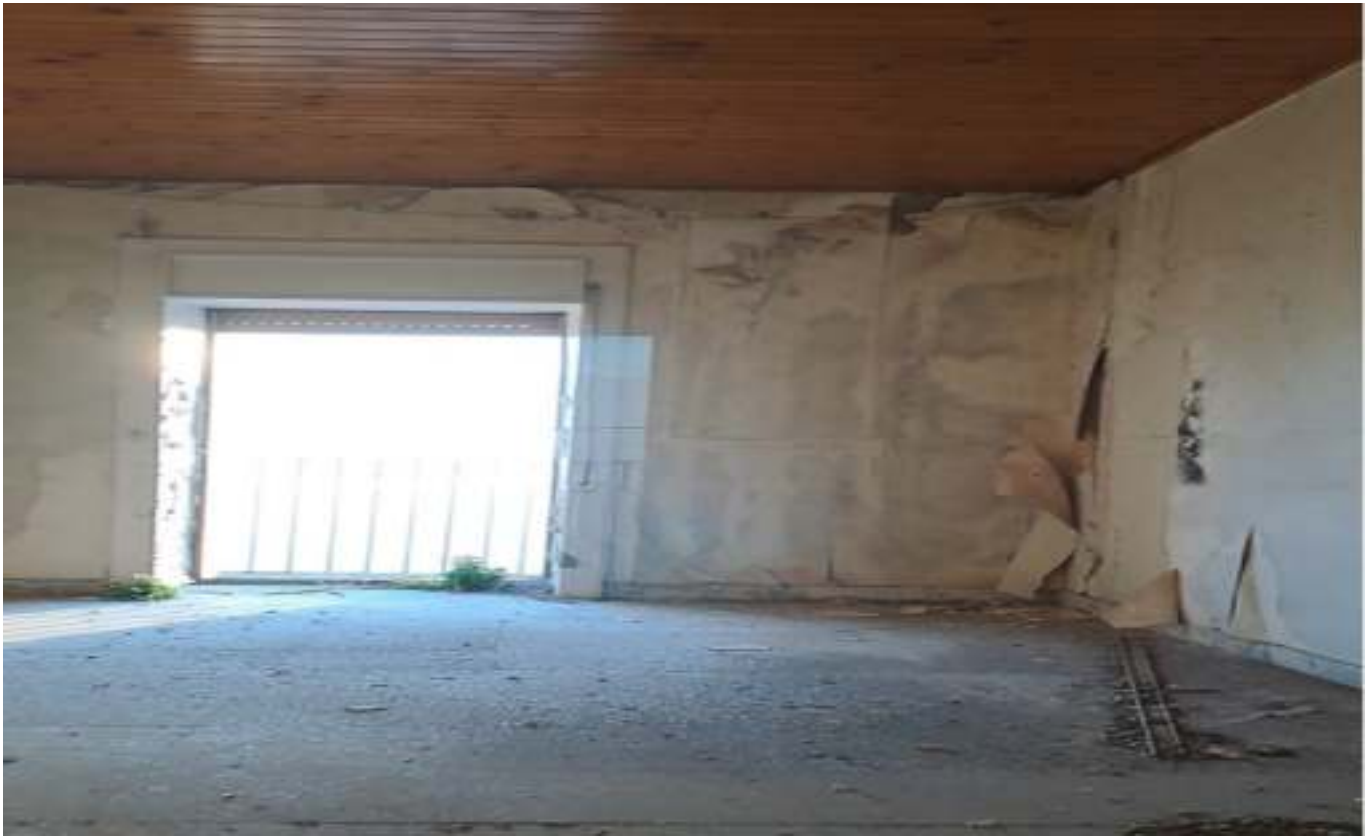
FOTO N. 11 VISTA DEL LOCALE SOGGIORNO PRANZO