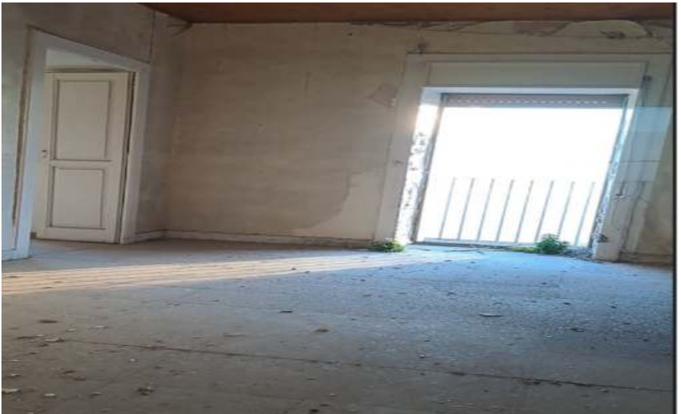
FOTO N. 12 ALTRA VISTA DEL LOCALE SOGGIORNO PRANZO