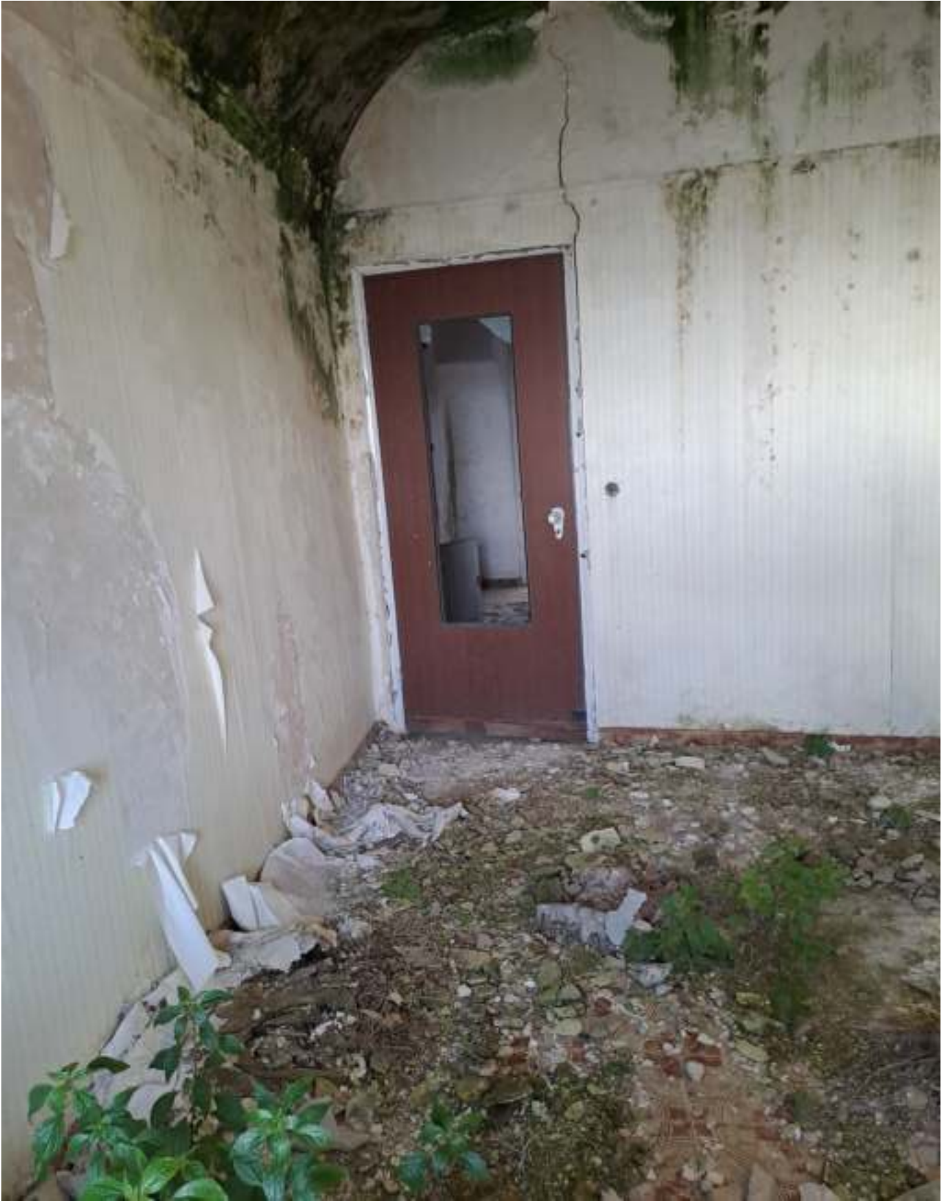
FOTO N. 6 ALTRA VISTA DEL LOCALE LETTO 2