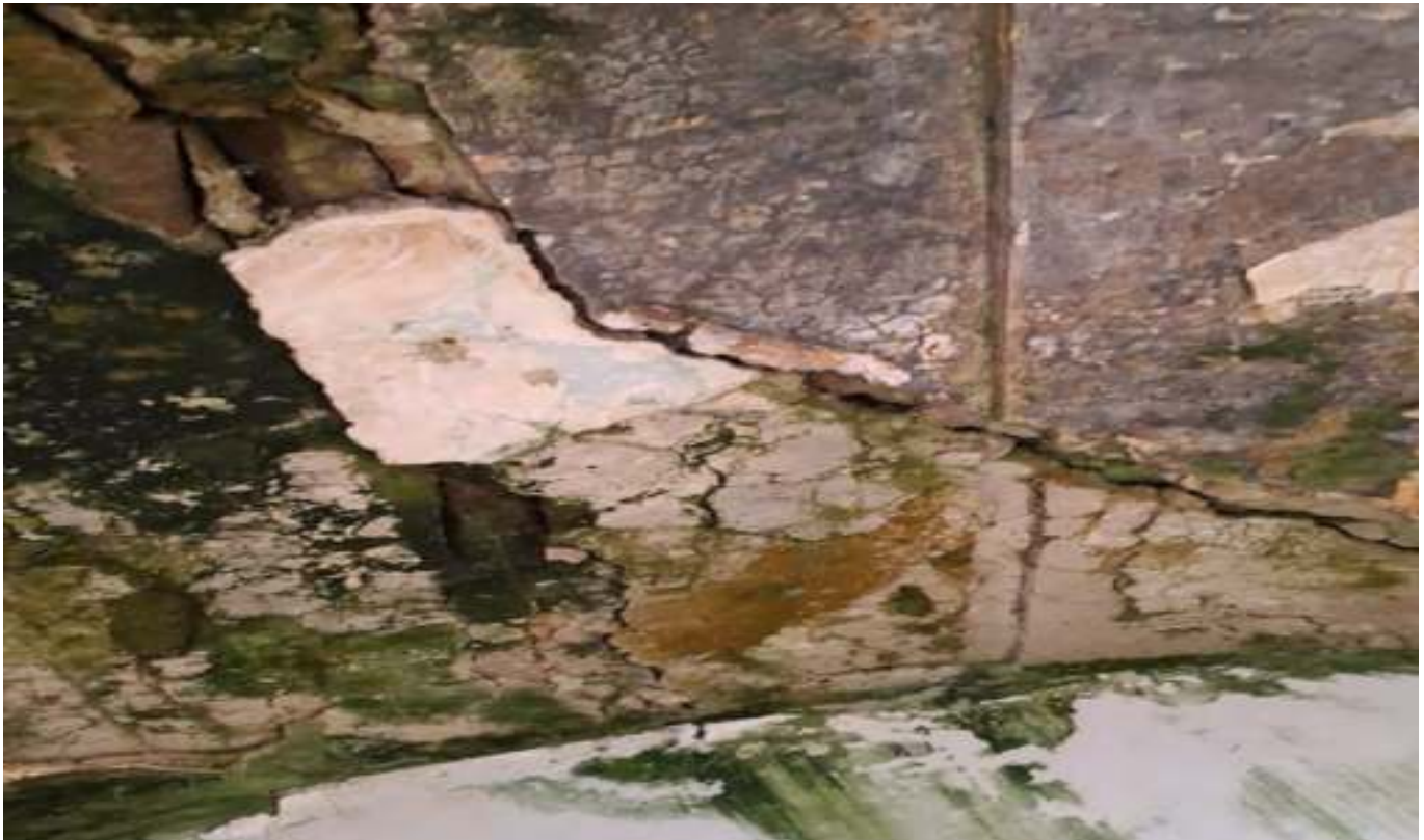
FOTO N. 14 VISTA INGRANDITA DEL DEGRADO DELLA VOLTA DEL LOCALE LETTO 1