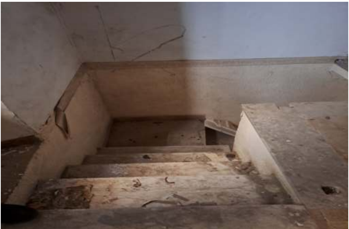
FOTO N.2 ALTRA VISTA DELLA SCALA DI ACCESSO