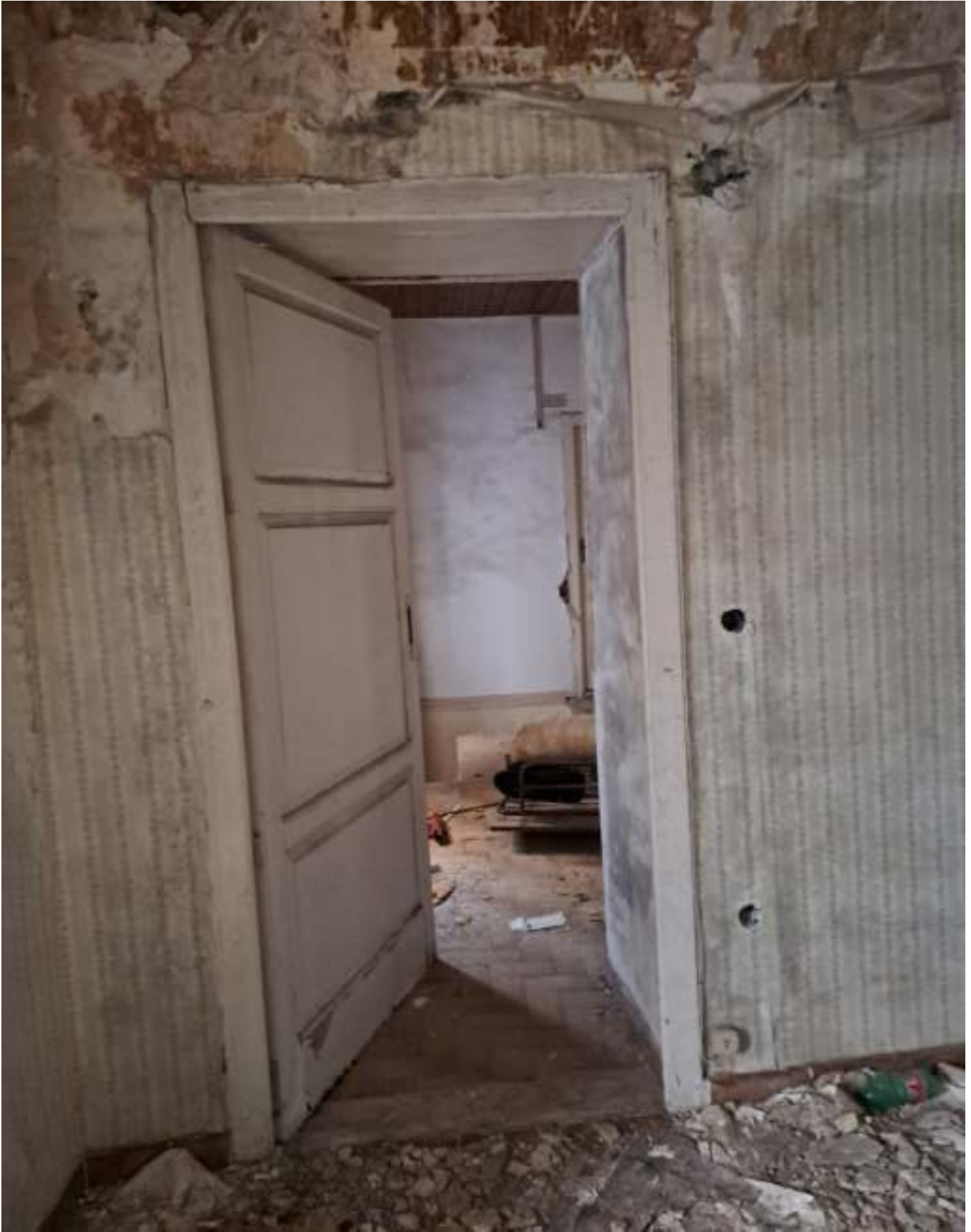
FOTO N. 7 VISTA DELLA PORTA DI COMUNICAZIONE TRA INGRESSO E LETTO 1