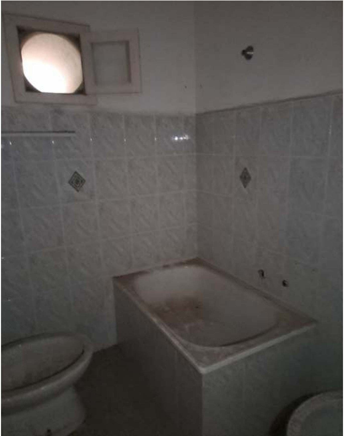
FOTO N. 10 VISTA DEL LOCALE BAGNO