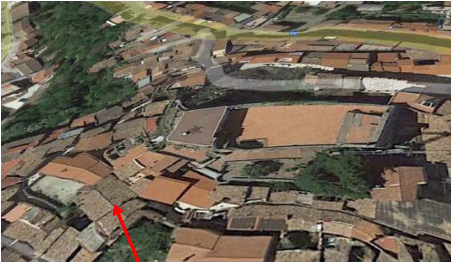
VISTA AEREA DA GOOGLE MAPS-QUI CESPITE