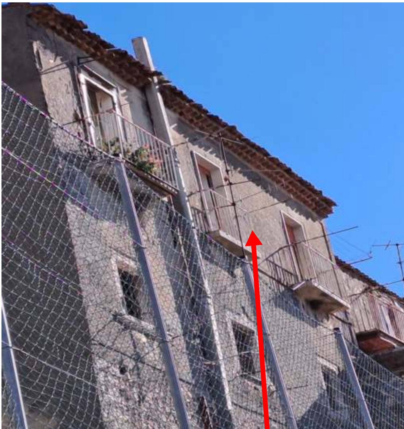
FOTO N. 15 VISTA DEL PROSPETTO ESTERNO DAL LATO SUD OVEST DEL CESPITE