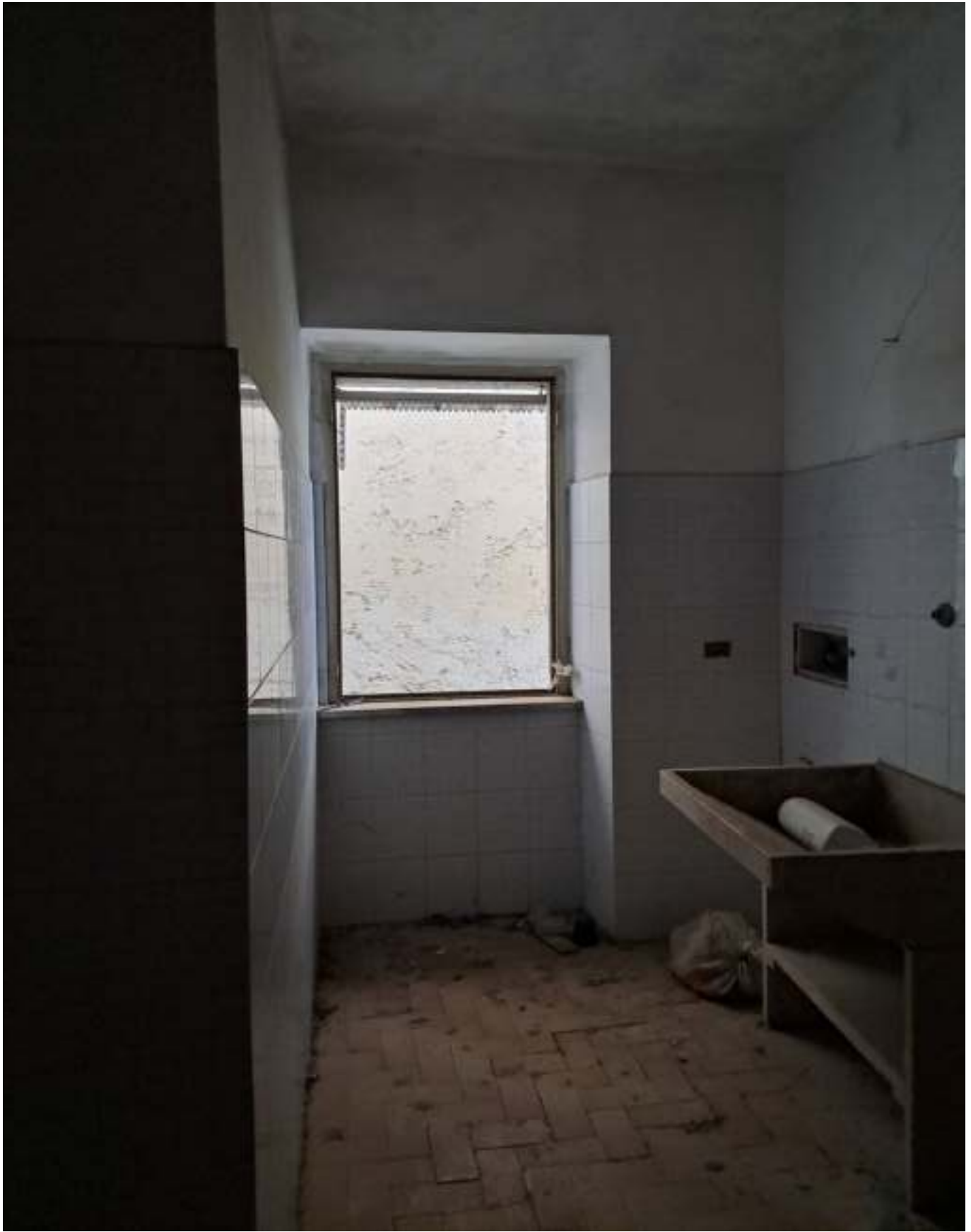
FOTO N. 8 VISTA DEL LOCALE CUCINA