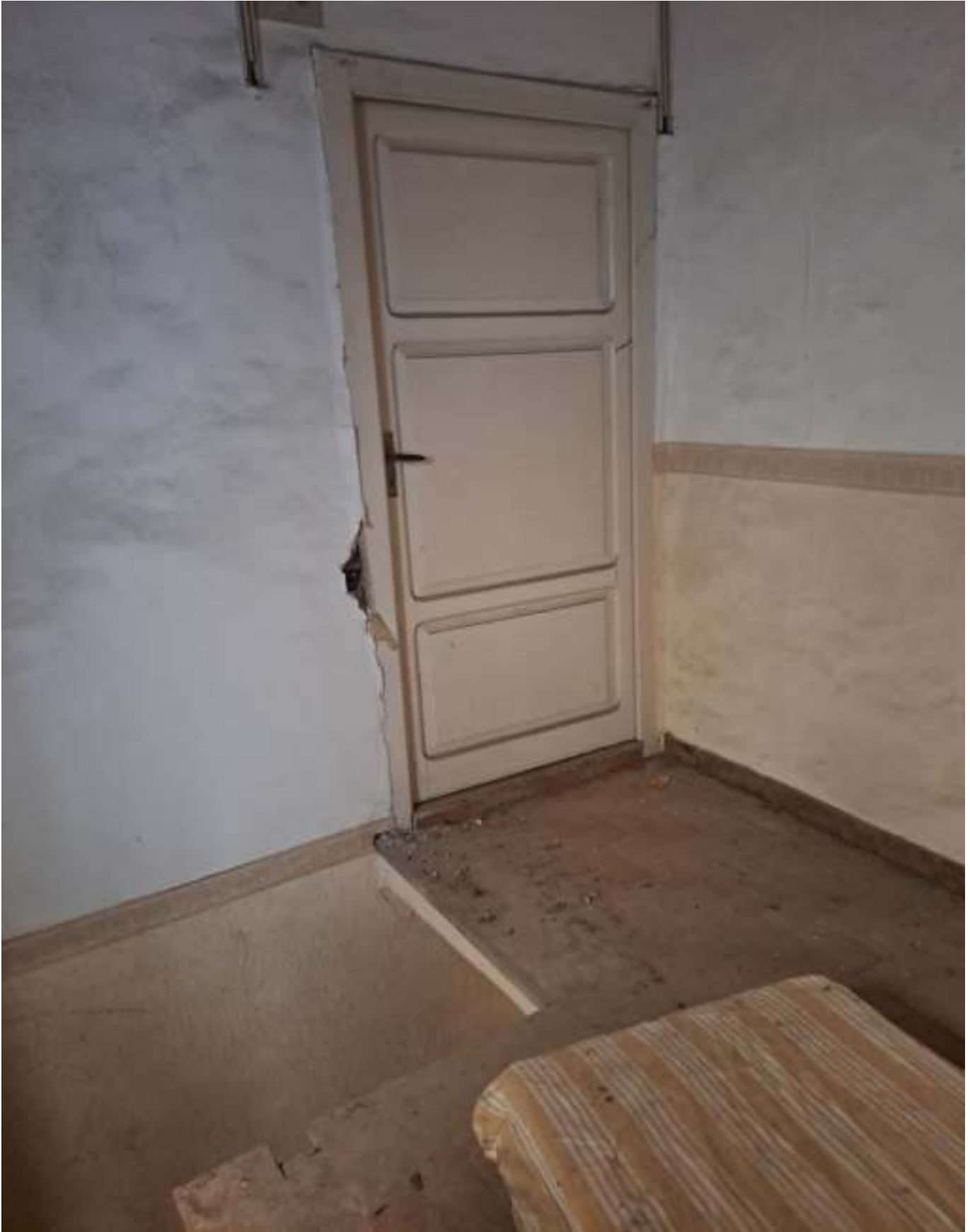
FOTO N. 3 VISTA DELLA PORTA DI ACCESSO ALLA CUCINA