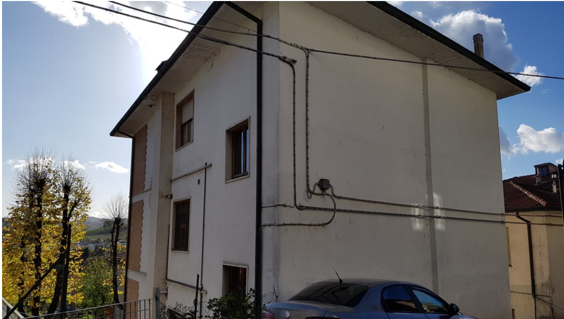
da via Giovanni XXIII