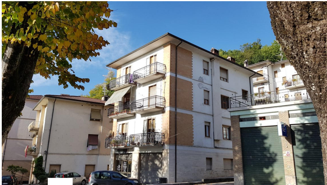
da via Cesare Battisti