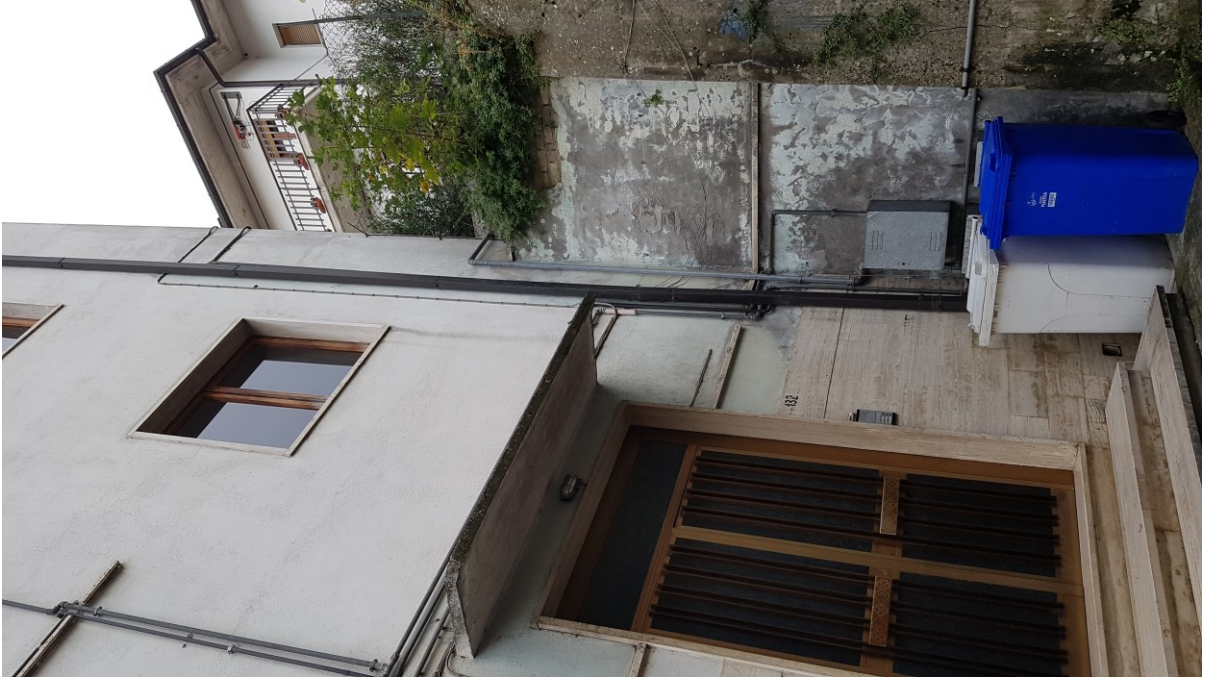
Ingresso vano scala