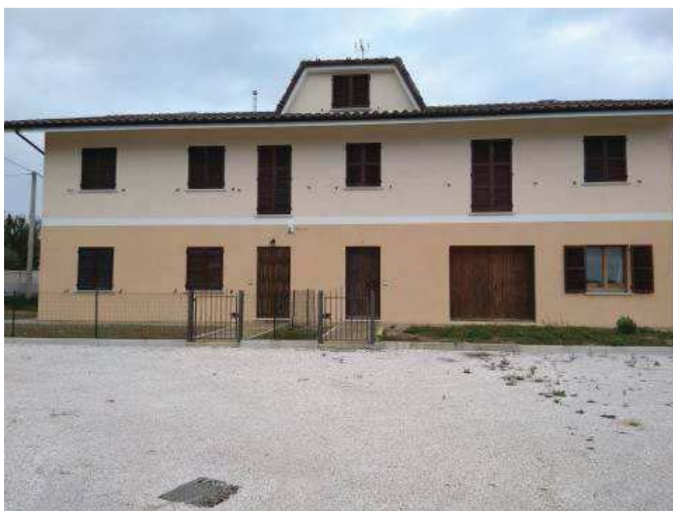
Vista esterna area