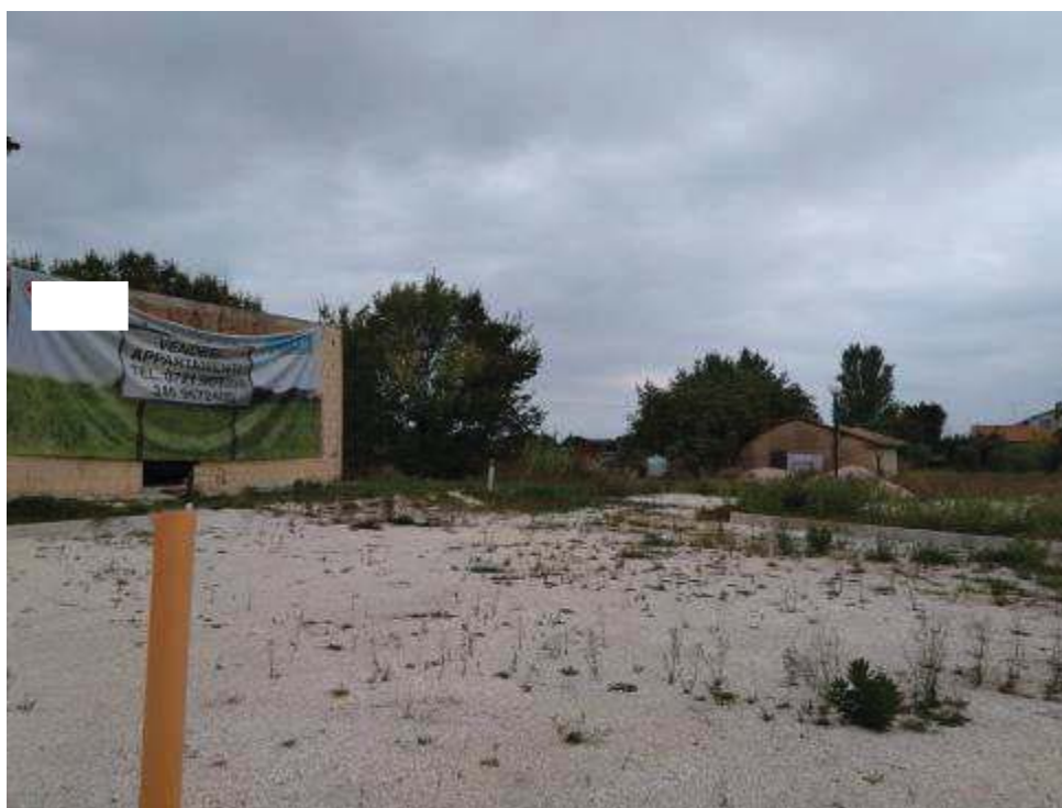
Vista esterna area