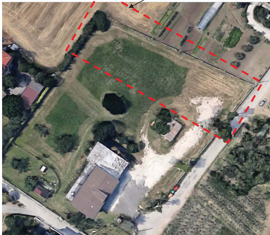
Foto 26. Prato arborato