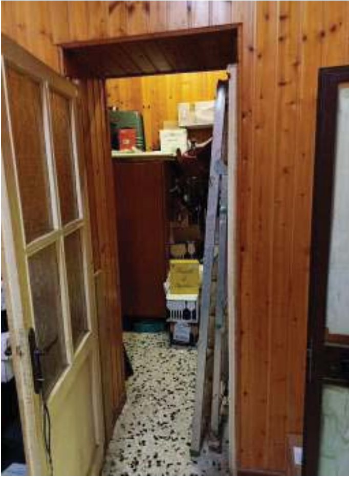
FOTOGRAFIA N° 29