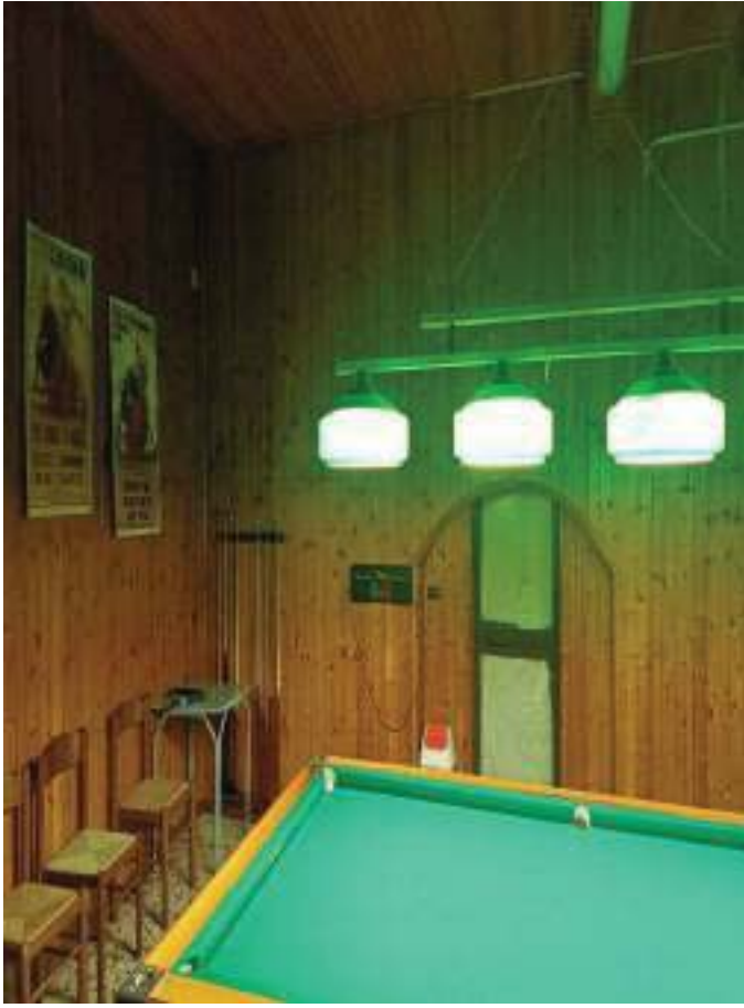
FOTOGRAFIA N° 25