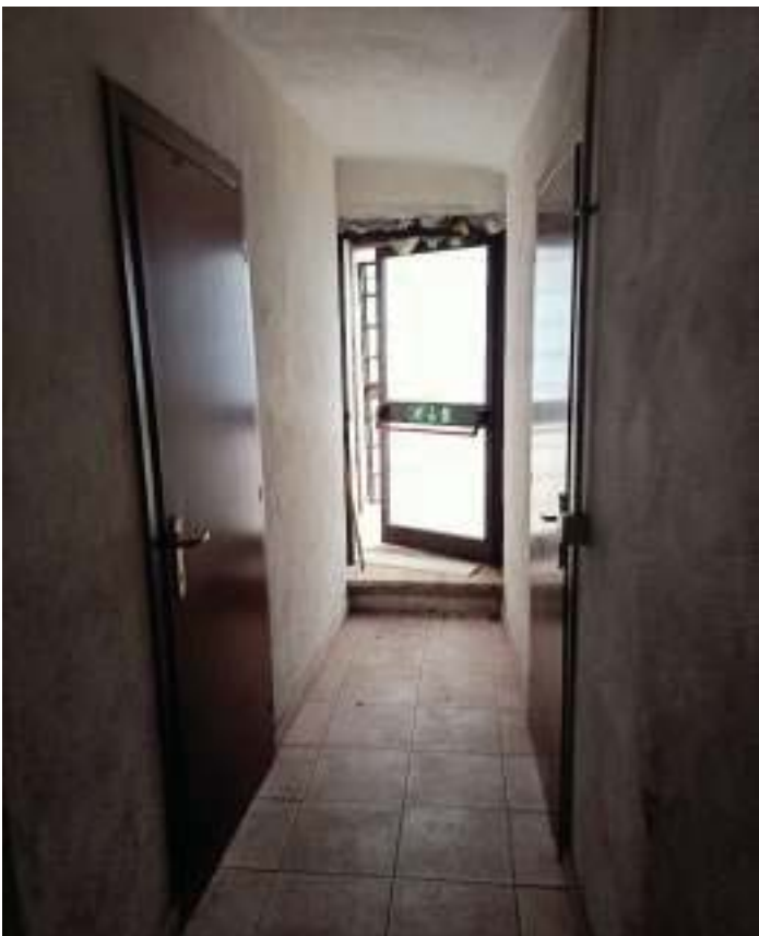
FOTOGRAFIA N° 35