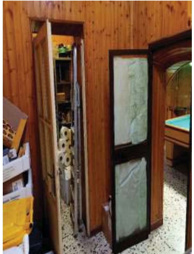
FOTOGRAFIA N° 28