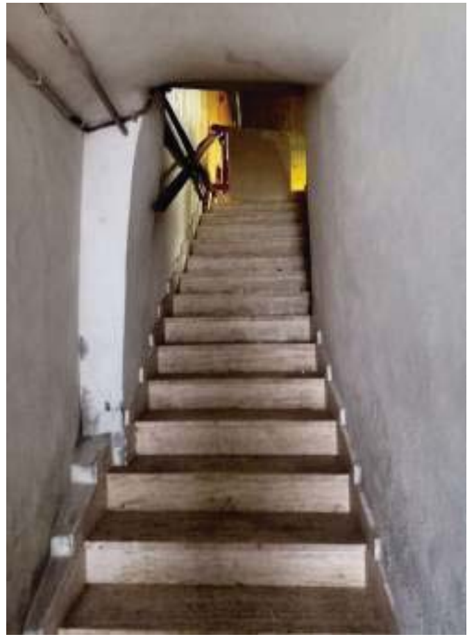
FOTOGRAFIA N° 34