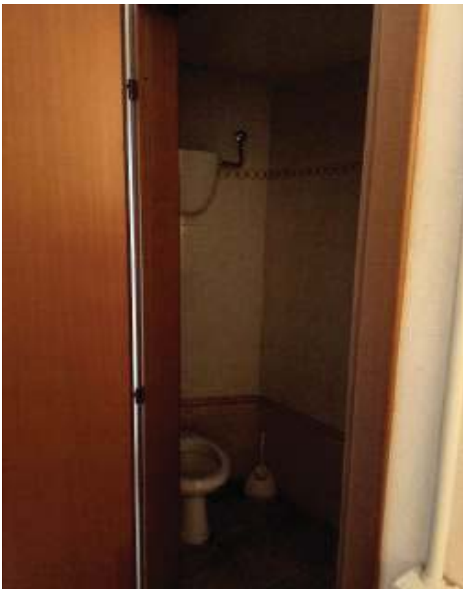
FOTOGRAFIA N° 39