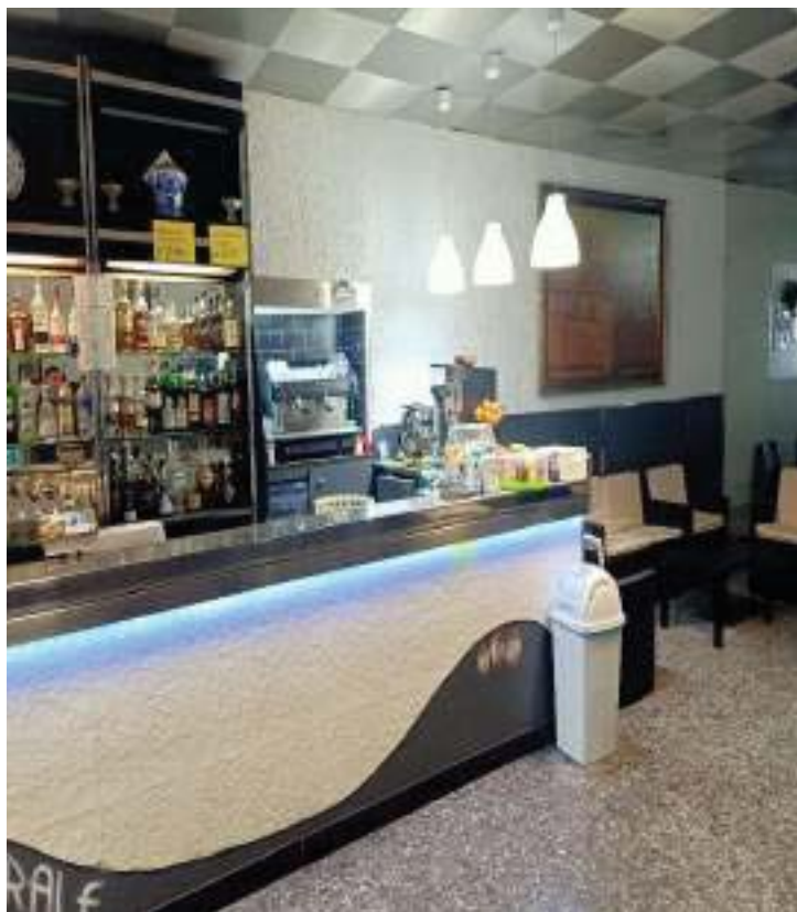
FOTOGRAFIA N° 5