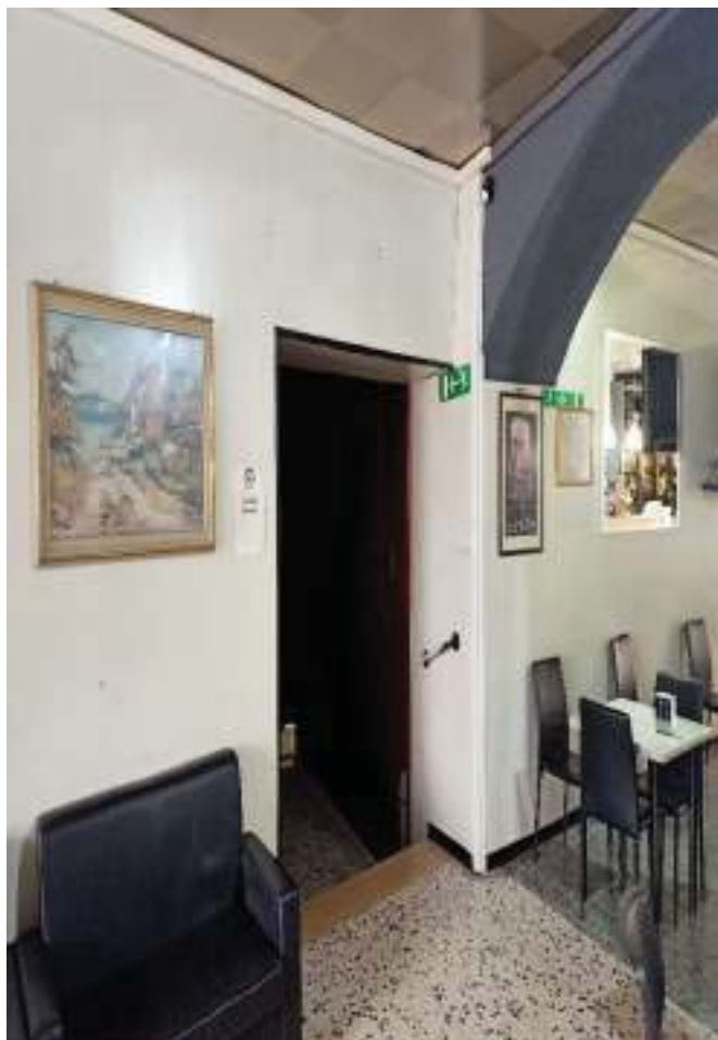
FOTOGRAFIA N° 21