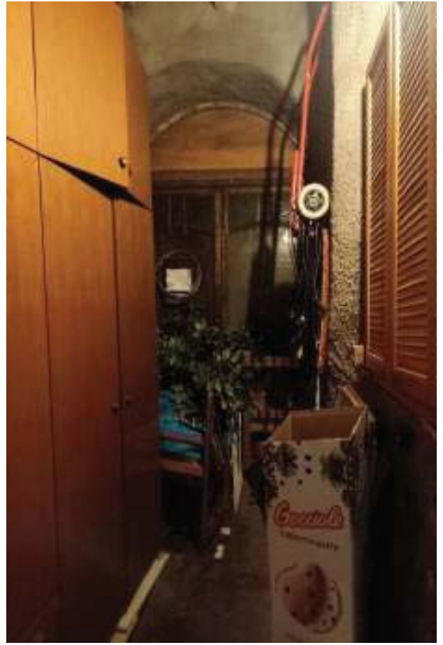
FOTOGRAFIA N° 30