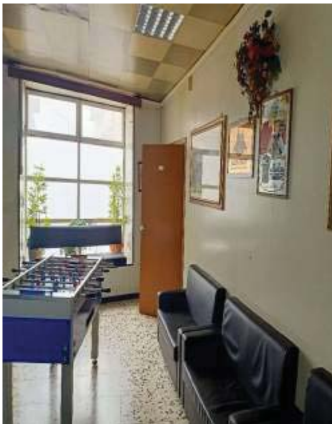
FOTOGRAFIA N° 15