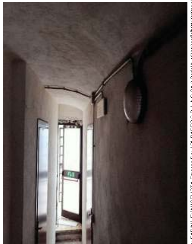
FOTOGRAFIA N° 36