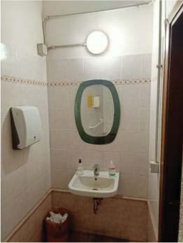
FOTOGRAFIA N° 9