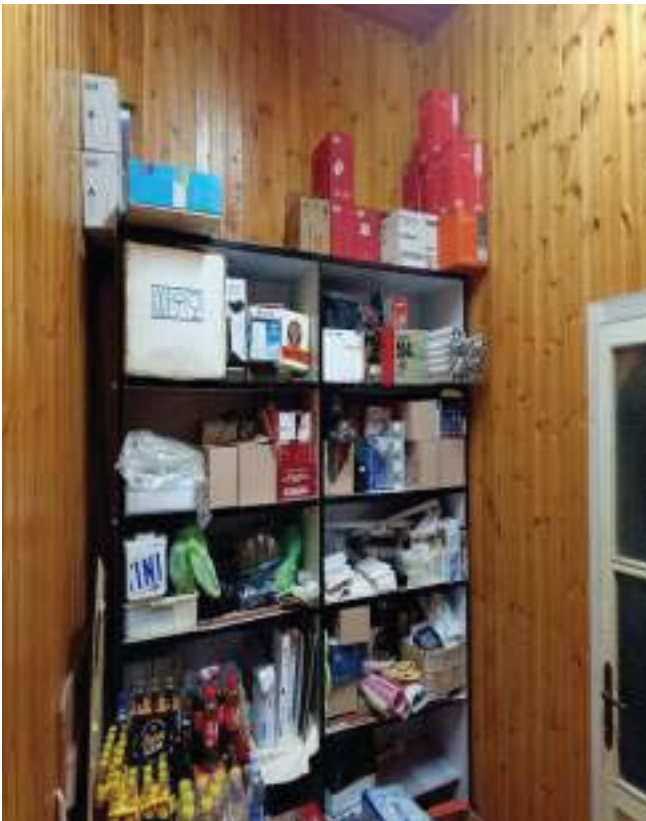
FOTOGRAFIA N° 27