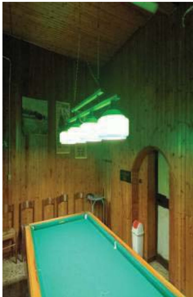
FOTOGRAFIA N° 22