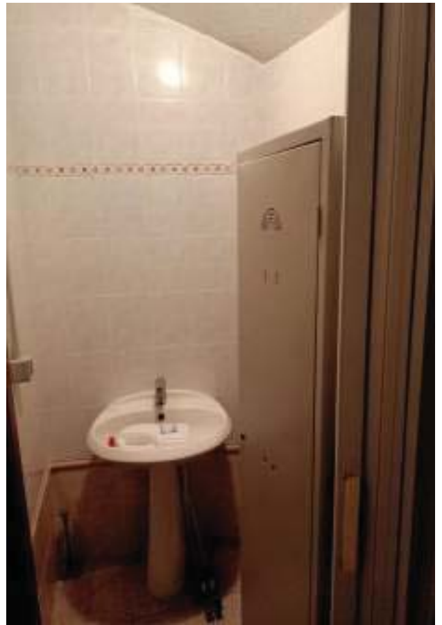
FOTOGRAFIA N° 38