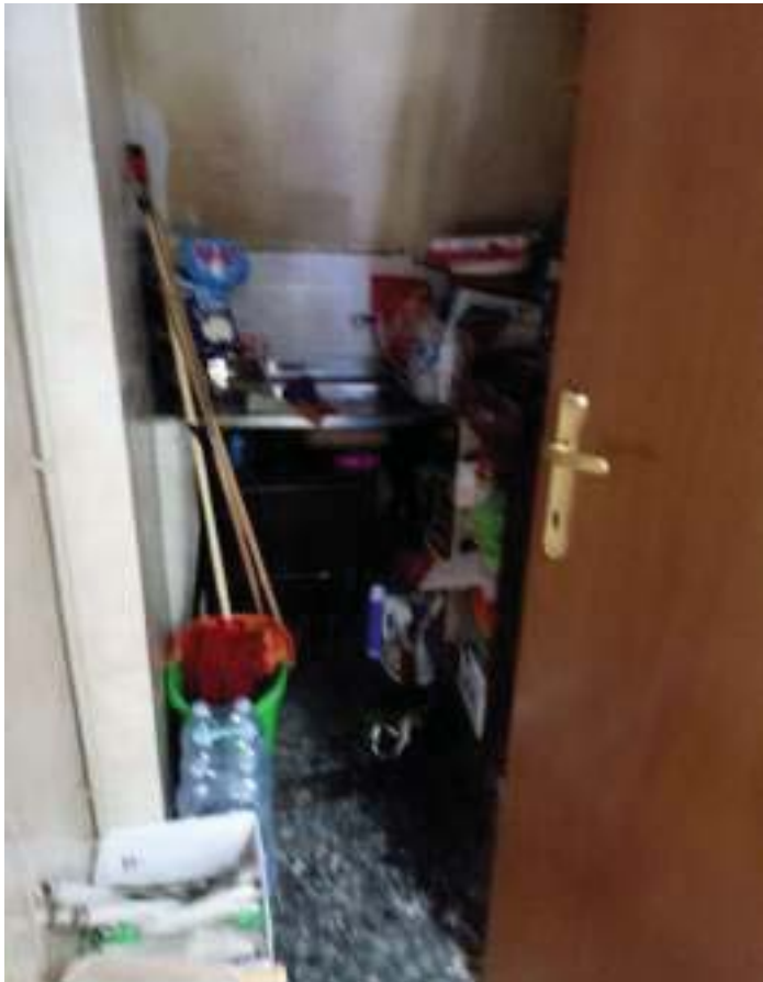
FOTOGRAFIA N° 11