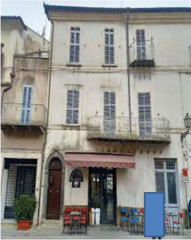
FOTOGRAFIA N° 1