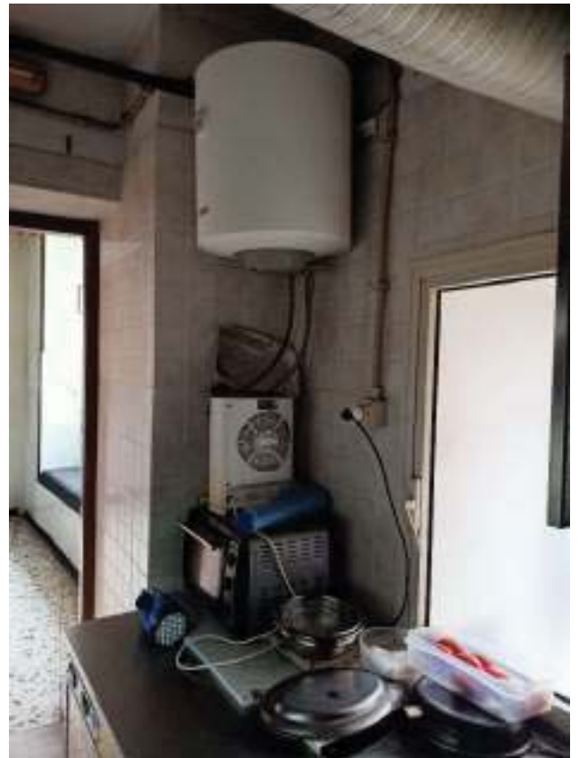
FOTOGRAFIA N° 20