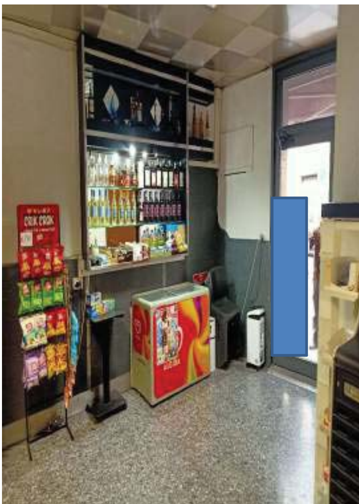
FOTOGRAFIA N° 7