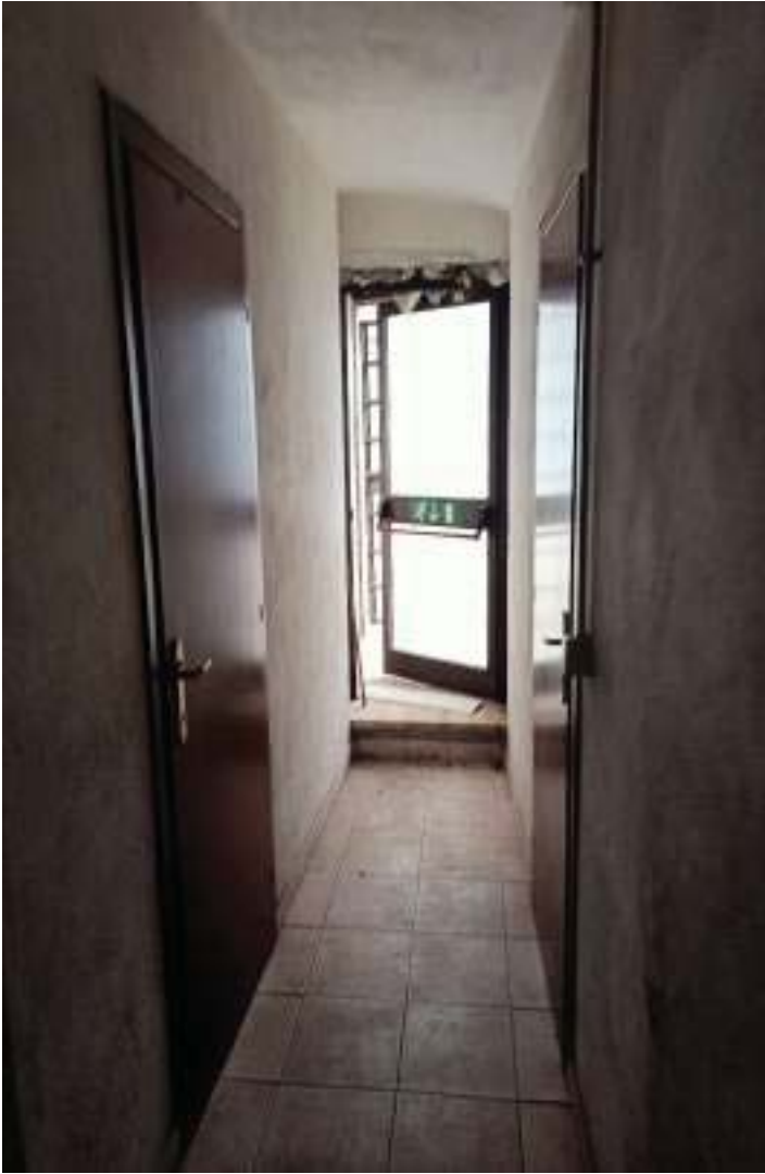
FOTOGRAFIA N° 41