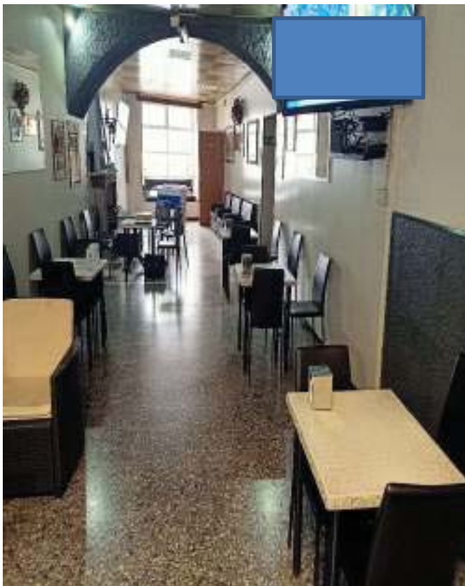
FOTOGRAFIA N° 13