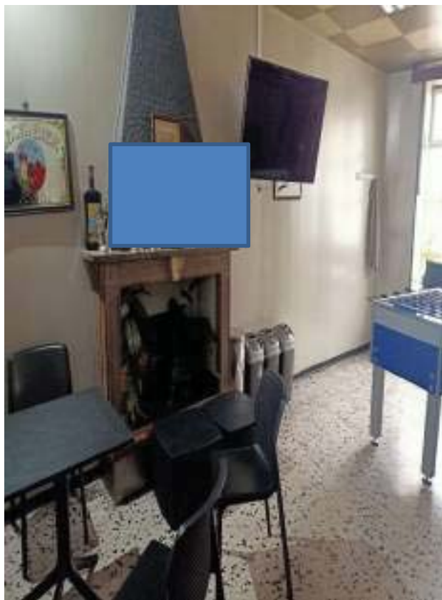
FOTOGRAFIA N° 14