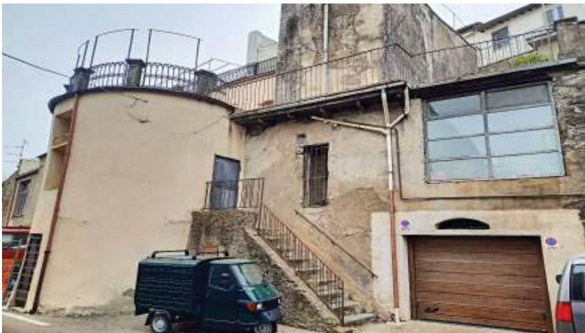
FOTOGRAFIA N° 43