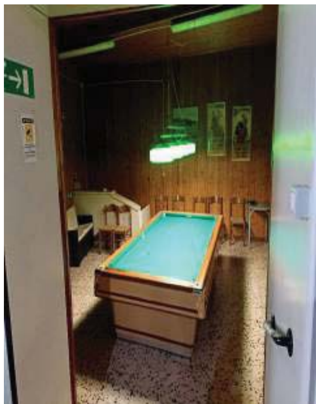
FOTOGRAFIA N° 24