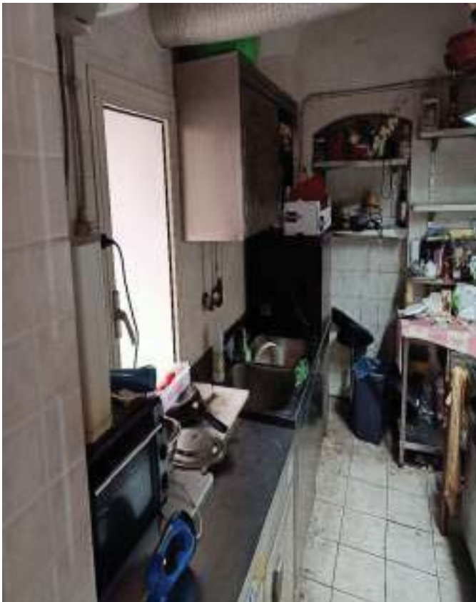
FOTOGRAFIA N° 19