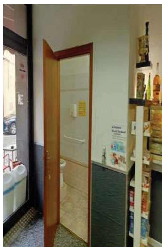
FOTOGRAFIA N° 8