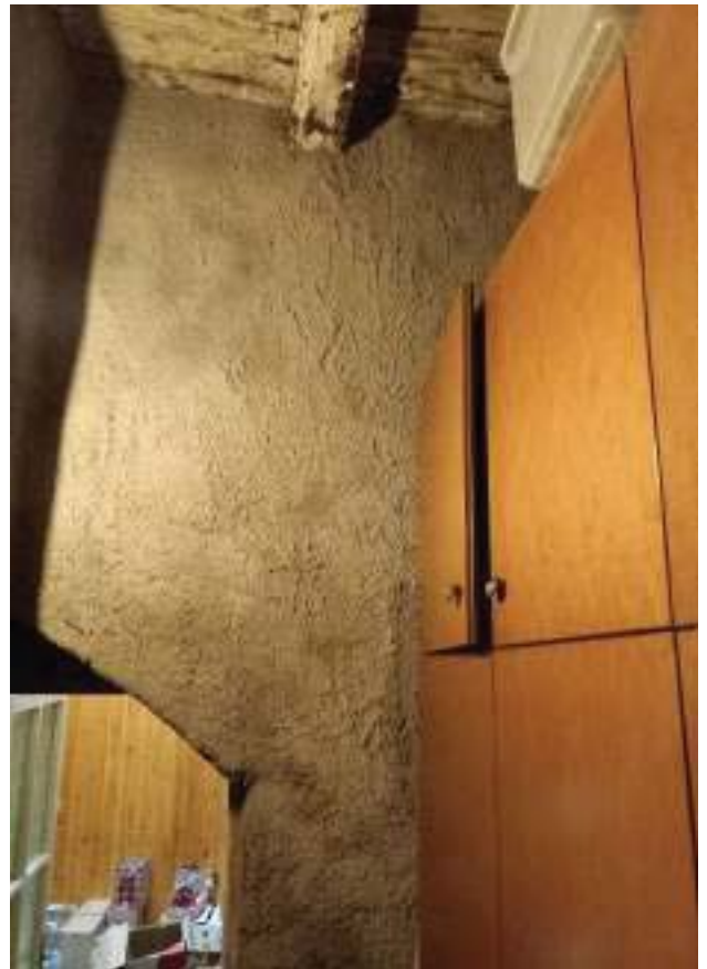
FOTOGRAFIA N° 32