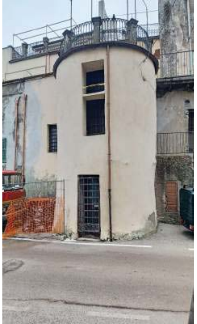
FOTOGRAFIA N° 42