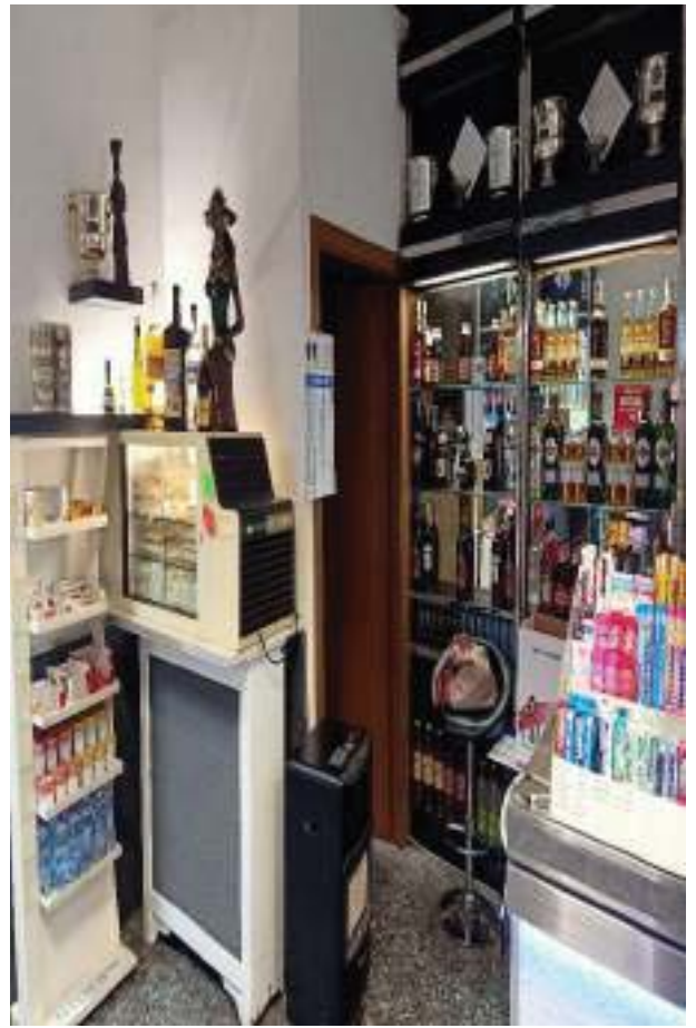
FOTOGRAFIA N° 10