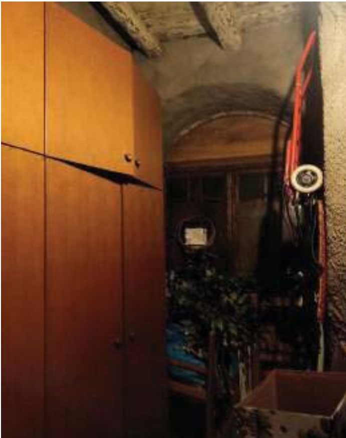
FOTOGRAFIA N° 31