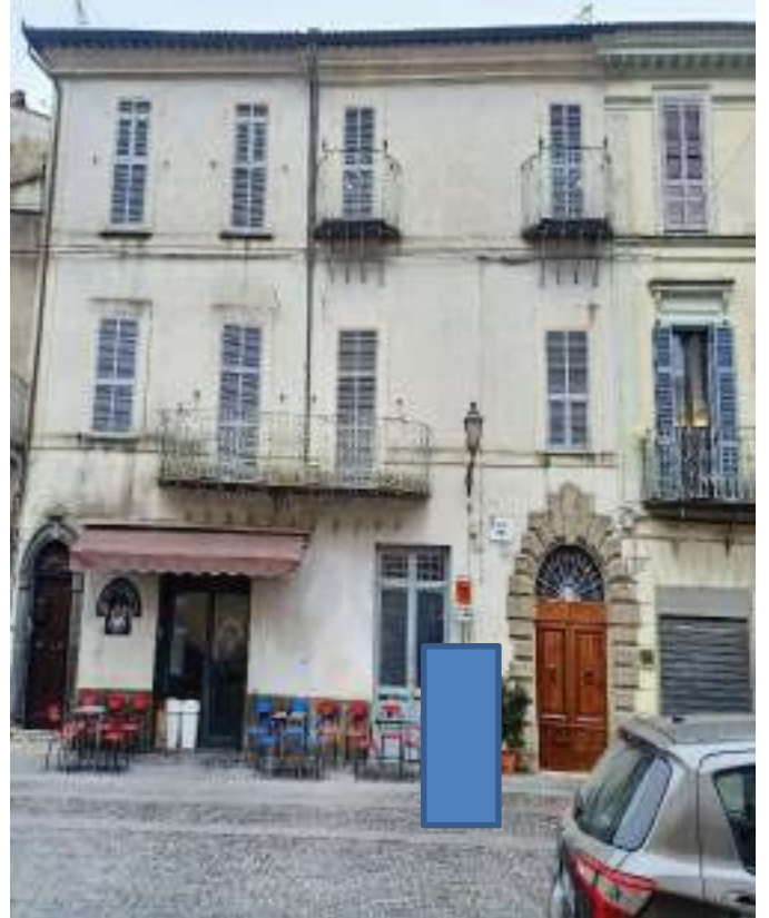
FOTOGRAFIA N° 2