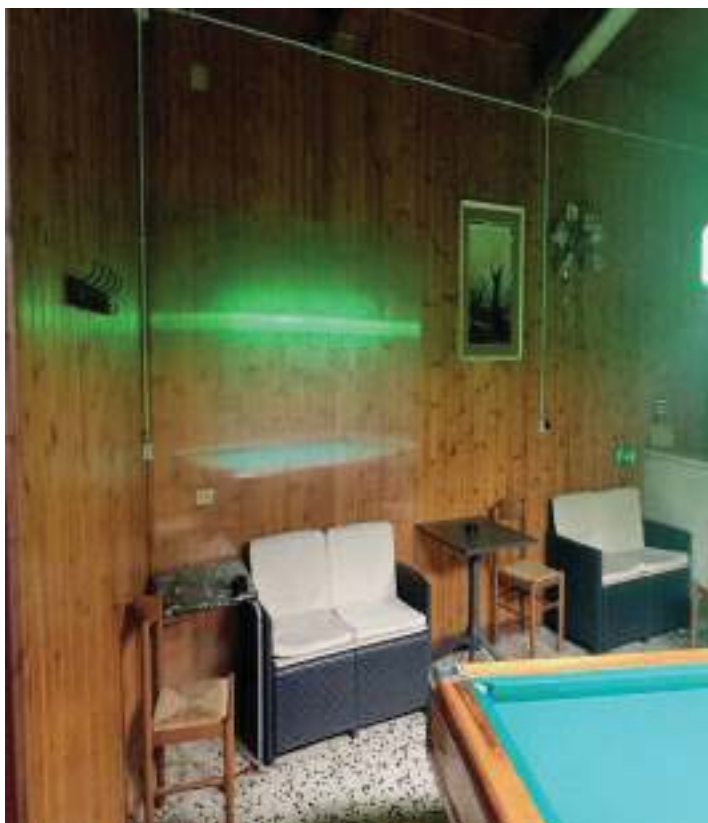
FOTOGRAFIA N° 23