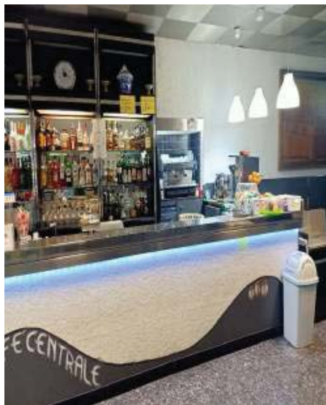
FOTOGRAFIA N° 6