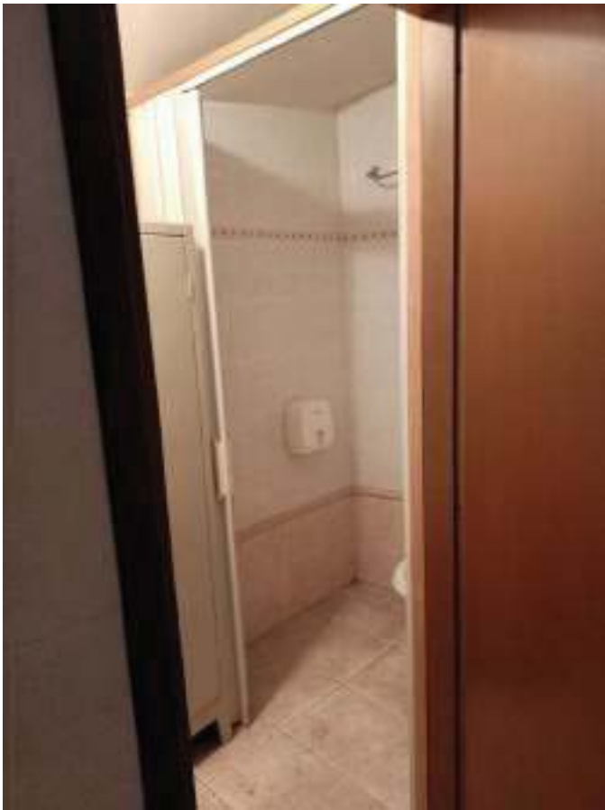
FOTOGRAFIA N° 37