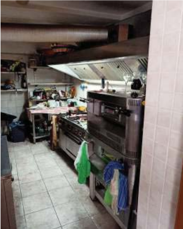
FOTOGRAFIA N° 17