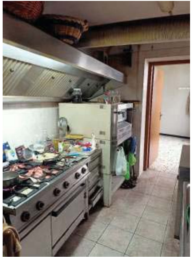
FOTOGRAFIA N° 18