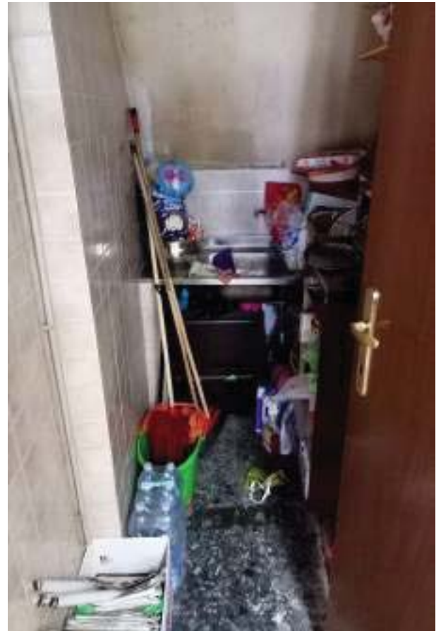
FOTOGRAFIA N° 12