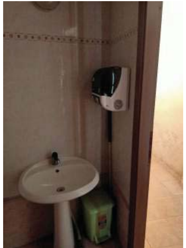
FOTOGRAFIA N° 40