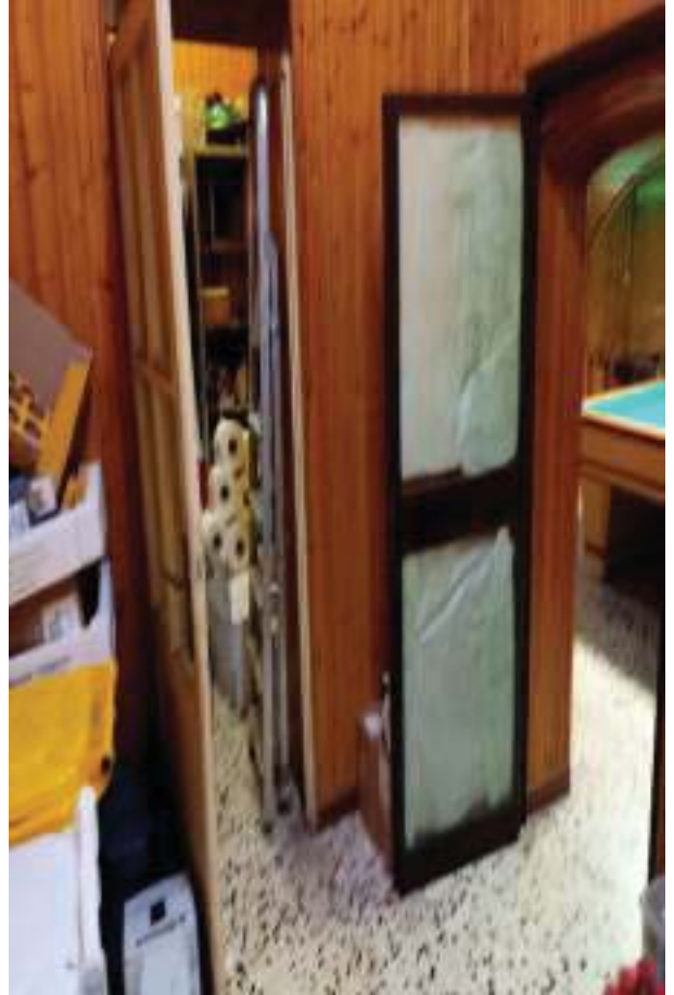
FOTOGRAFIA N° 26