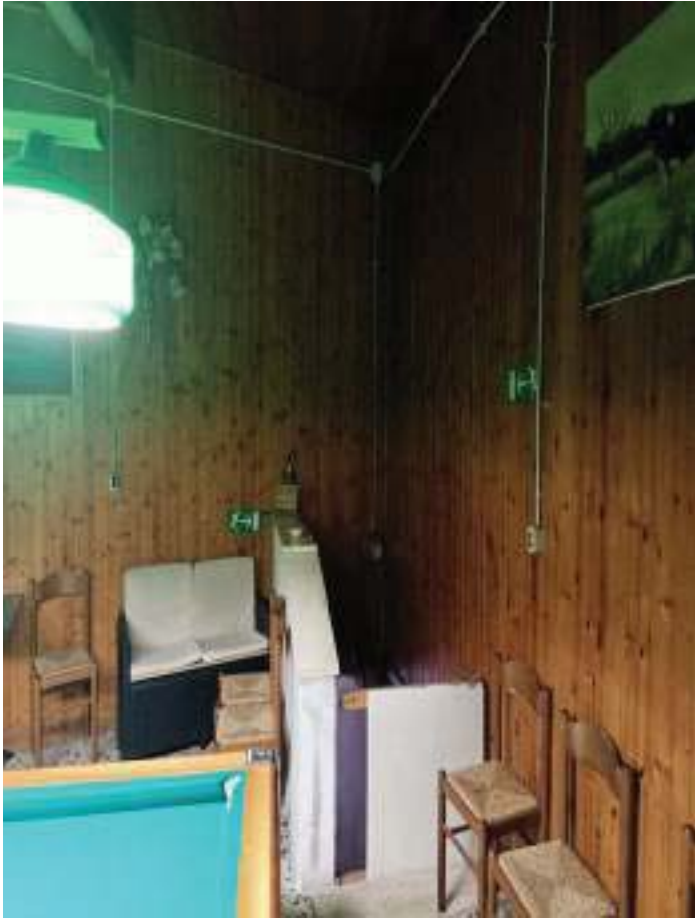
FOTOGRAFIA N° 33