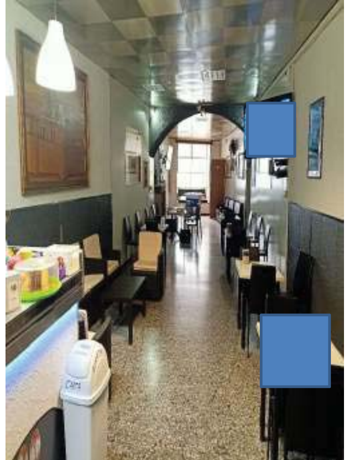
FOTOGRAFIA N° 4