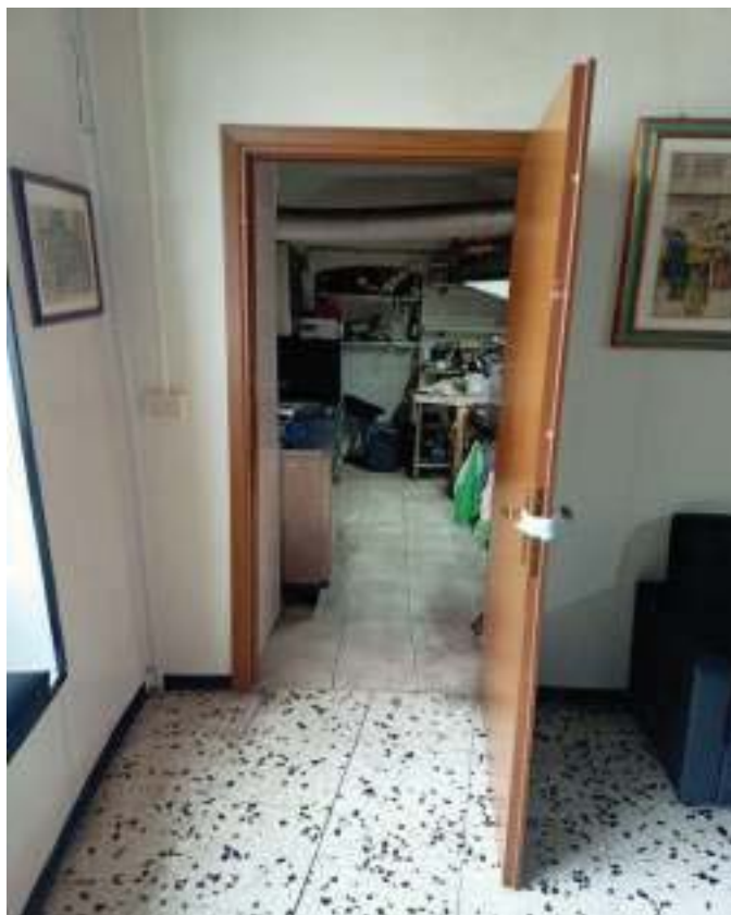
FOTOGRAFIA N° 16