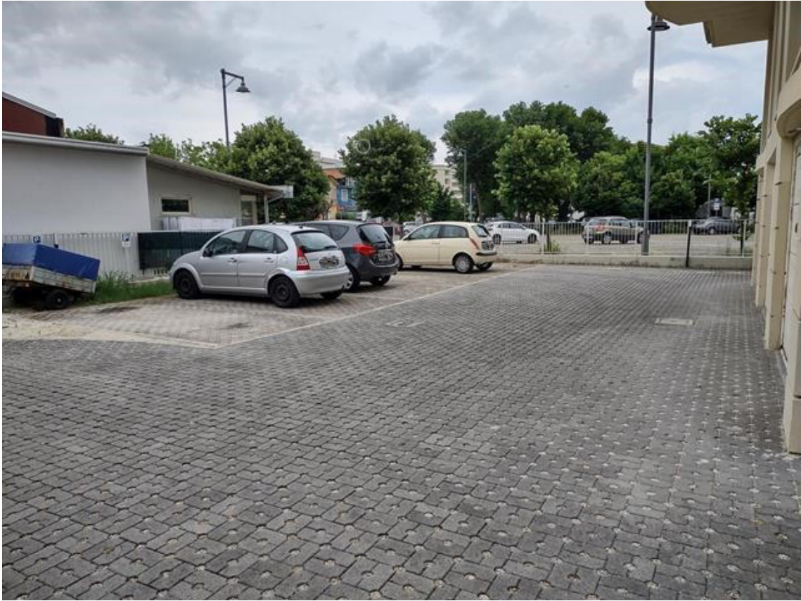
FOTO 16. Posti auto di proprietà privata (il primo e il secondo stallo)