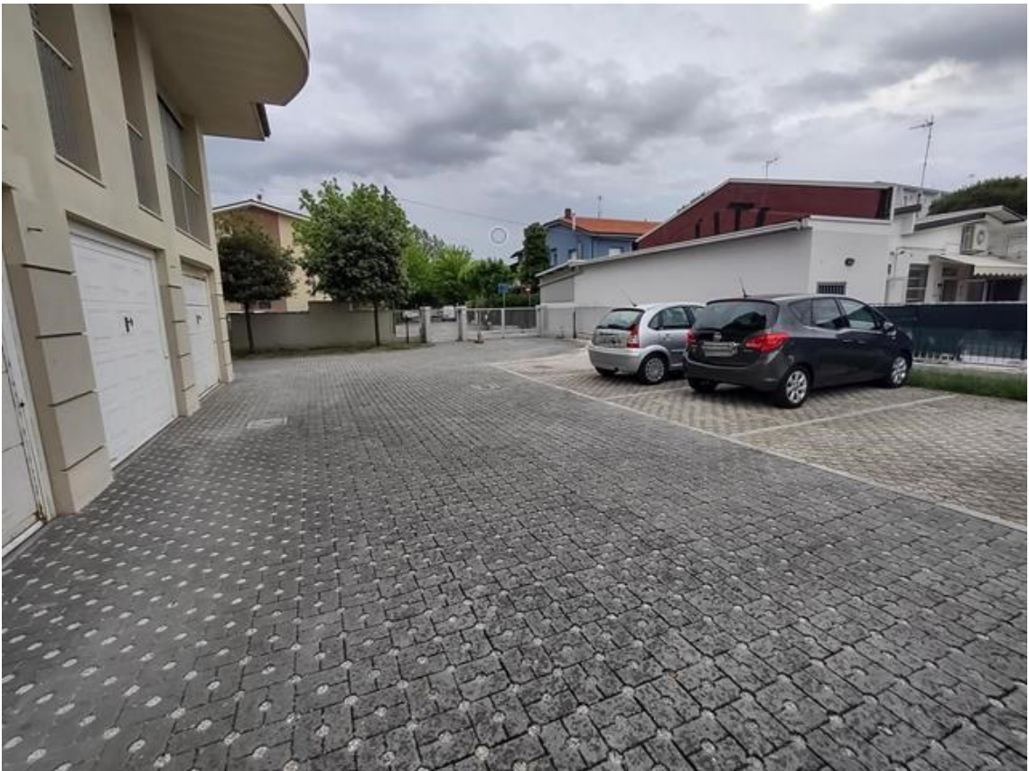
FOTO 17. Posti auto di proprietà privata e vista di uno degli accessi alla corte