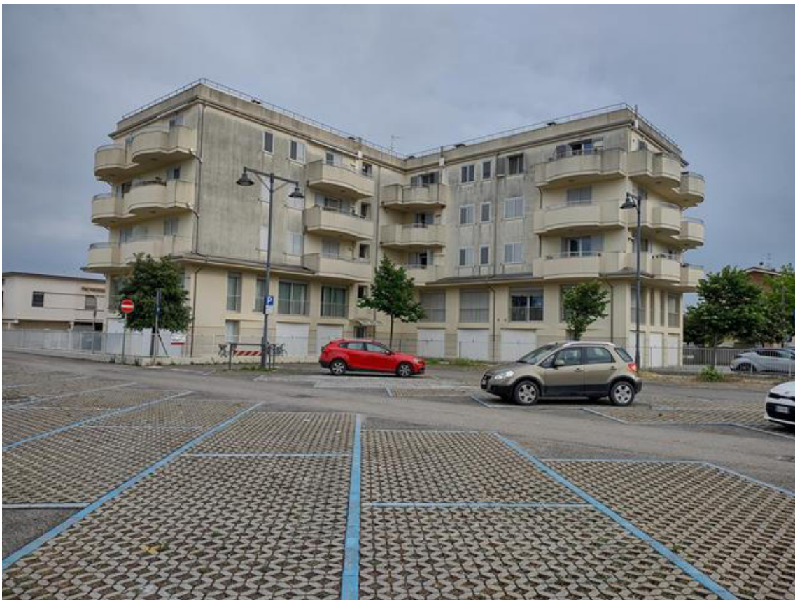
FOTO 2. Il condominio: vista dal parcheggio pubblico di Via Ravenna