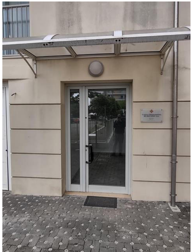
FOTO 5 e 6. Il condominio: vista del percorso pedonale e dell'ingresso comuni