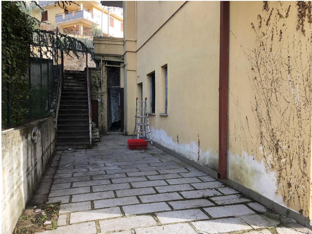
SCALA ESTERNA, LOCALE TECNICO, CORTE ESCLUSIVA LOTTO UNICO: Comune di Fiuggi - Fg. 39, part. 341, sub. 2