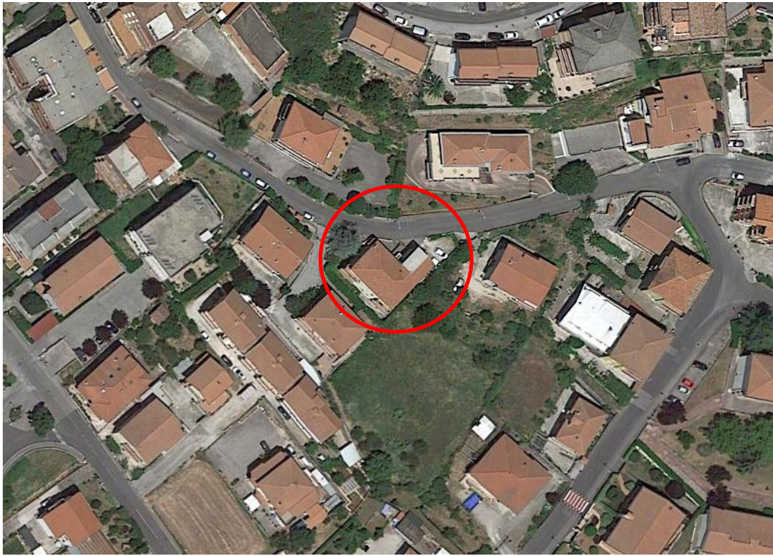
FOTO AEREA INDIVIDUAZIONE DEI BENI OGGETTO DI PIGNORAMENTO LOTTO UNICO: Comune di Fiuggi - Fg. 39, part. 341, sub. 2