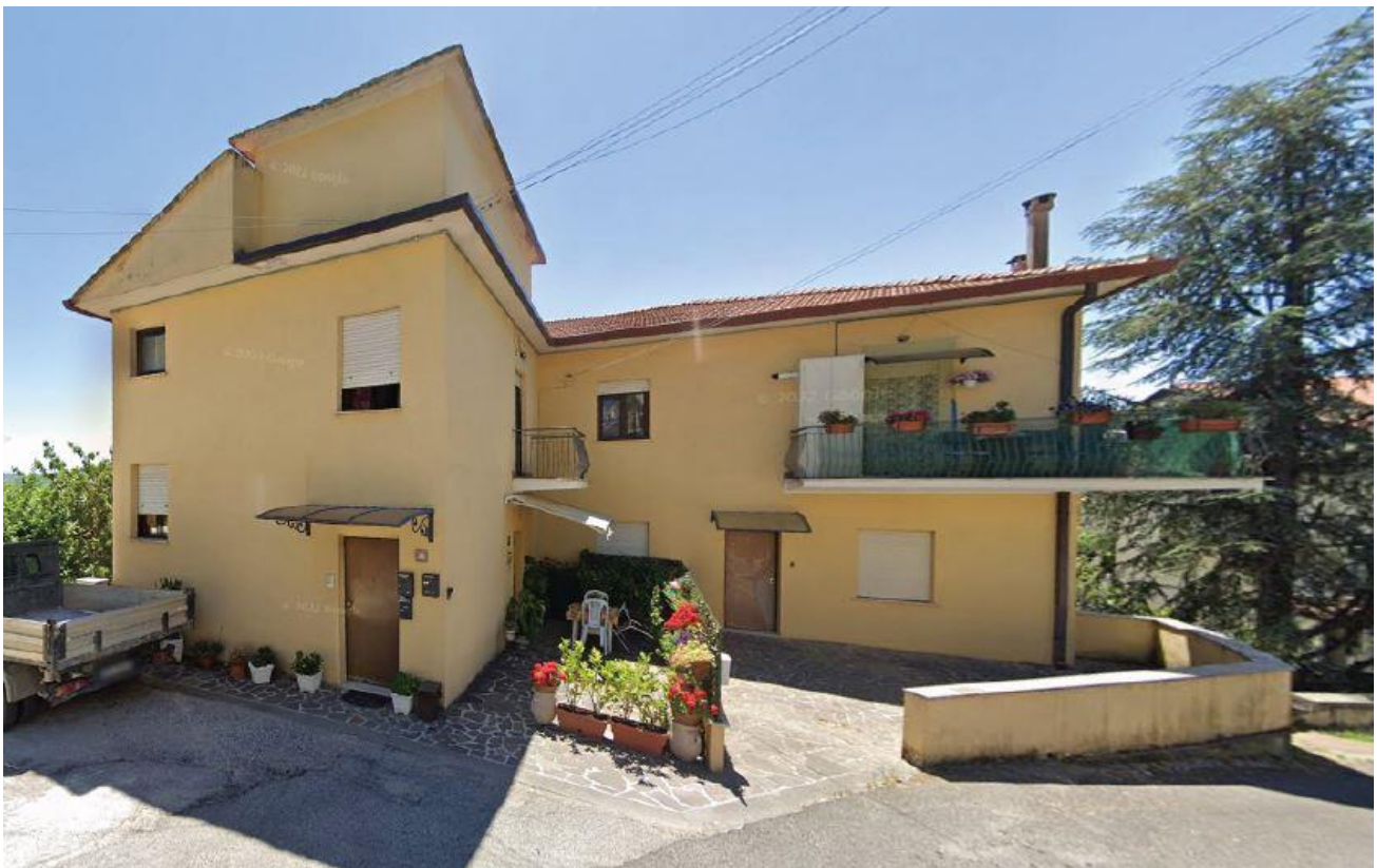
VISTA ESTERNA DEL FABBRICATO LOTTO UNICO: Comune di Fiuggi - Fg. 39, part. 341, sub. 2