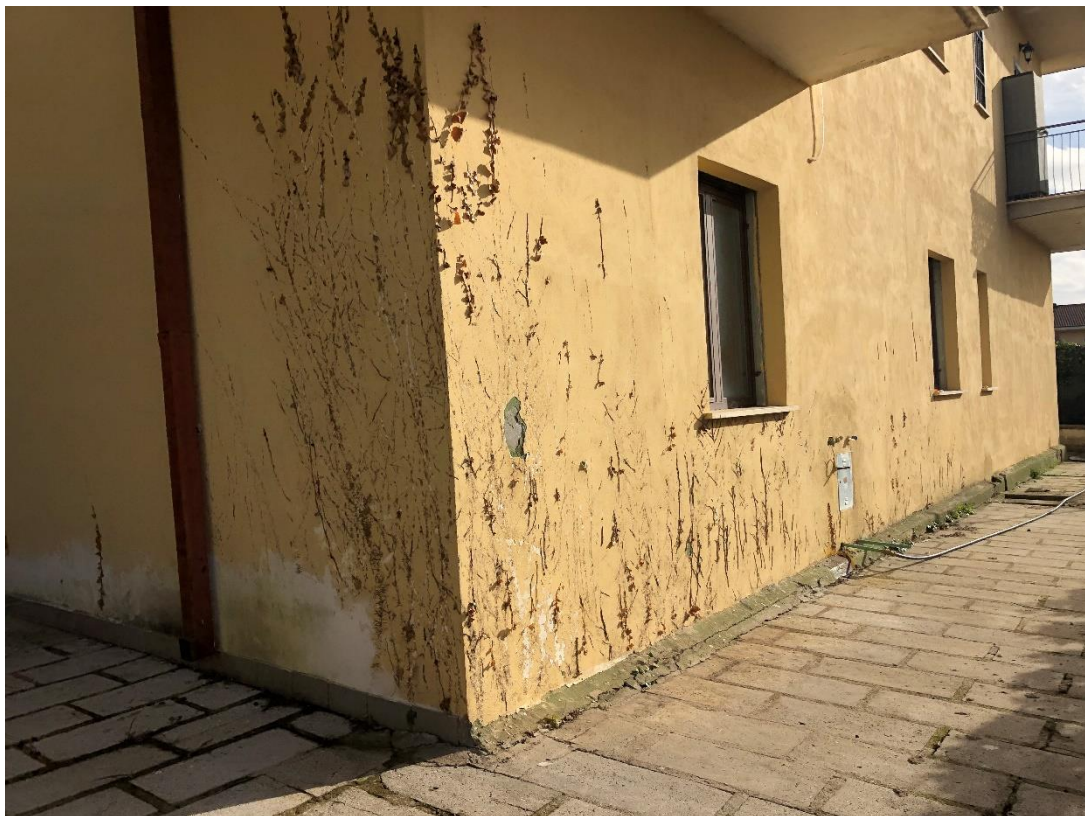
CORTE ESCLUSIVA LOTTO UNICO: Comune di Fiuggi - Fg. 39, part. 341, sub. 2