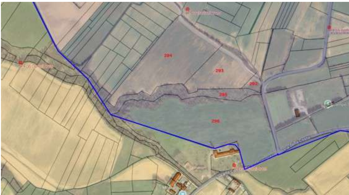
Fotografia I.8 - Paderna fg. 3 part 292-293-294-295-296