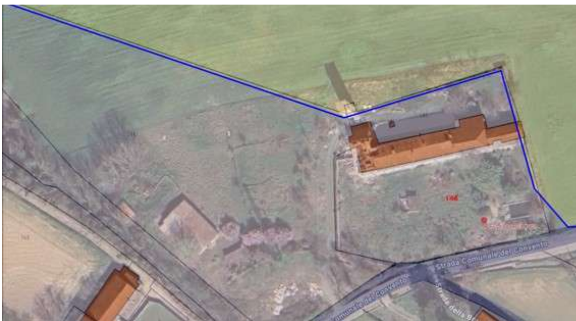
Fotografia I.10 - Carezzano fg part 146