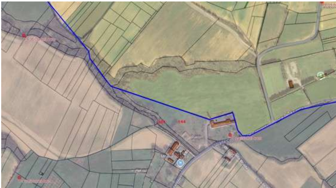
Fotografia I.9 - Carezzano fg 4 part 144-324