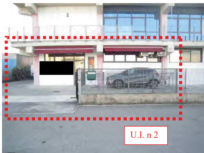
VISTA FRONTE OVEST DEL LABORATORIO ARTIGIANALE (U.I. N 2) DALLA VIA STRADA PROVINCIALE 23