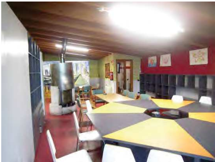
LOCALE PER ACCOGLIENZA MIGRANTI