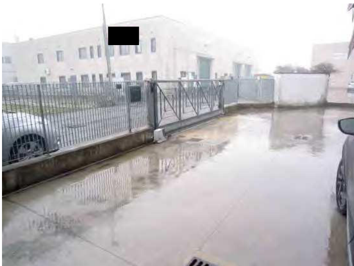
VISTA AREA CORTILIZIA PERTINENZIALE ESCLUSIVA SUL LATO OVEST