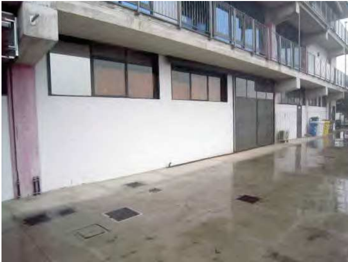
VISTAPROSPETTO OVEST ED AREA CORTILIZIA PERTINENZIALE ESCLUSIVA