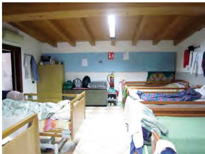
CAMERA PER ACCOGLIENZA MIGRANTI