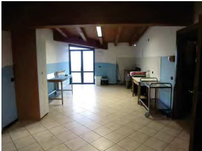
LOCALE PER ACCOGLIENZA MIGRANTI