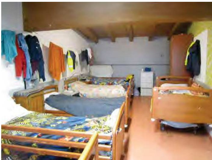
CAMERA PER ACCOGLIENZA MIGRANTI