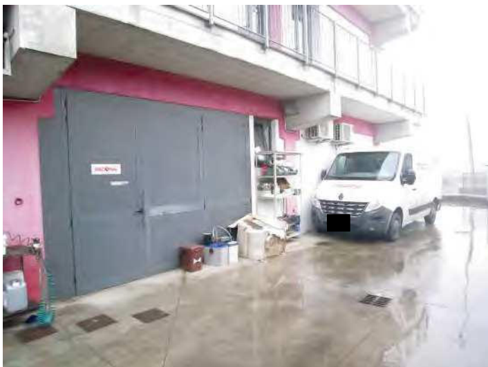
VISTA PROSPETTO NORD