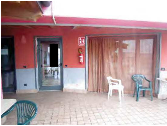
FOTO INGRESSO DALLA TERRAZZA COMUNE