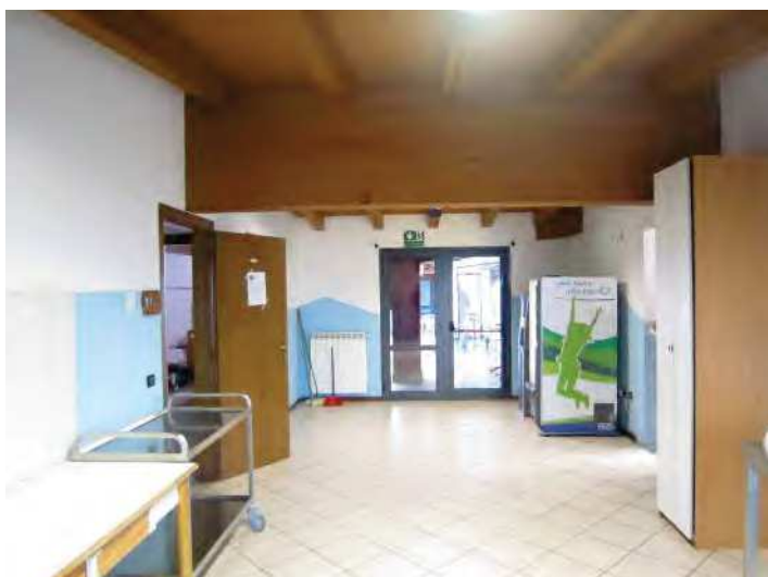
LOCALE PER ACCOGLIENZA MIGRANTI