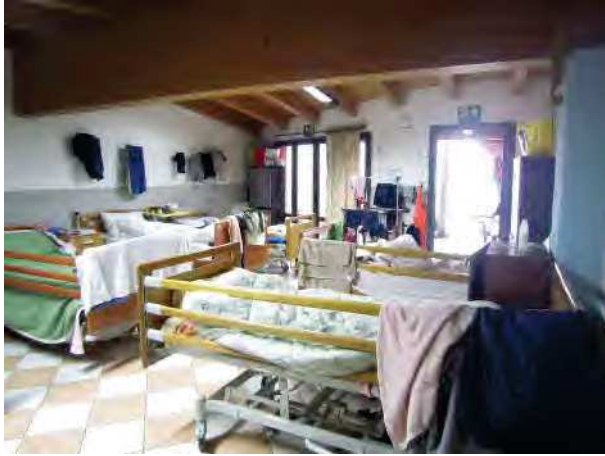
CAMERA PER ACCOGLIENZA MIGRANTI