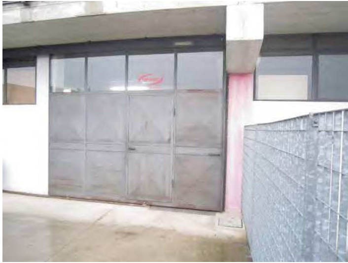
VISTA PORTA DI INGRESSO AL MAGAZZINO/DEPOSITO