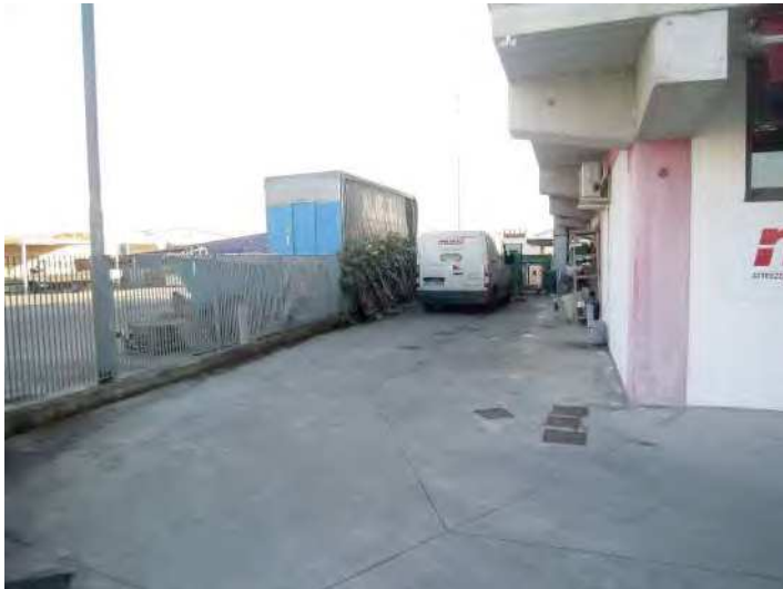
VISTA AREA CORTILIZIA PERTINENZIALE ESCLUSIVA SUL LATO NORD