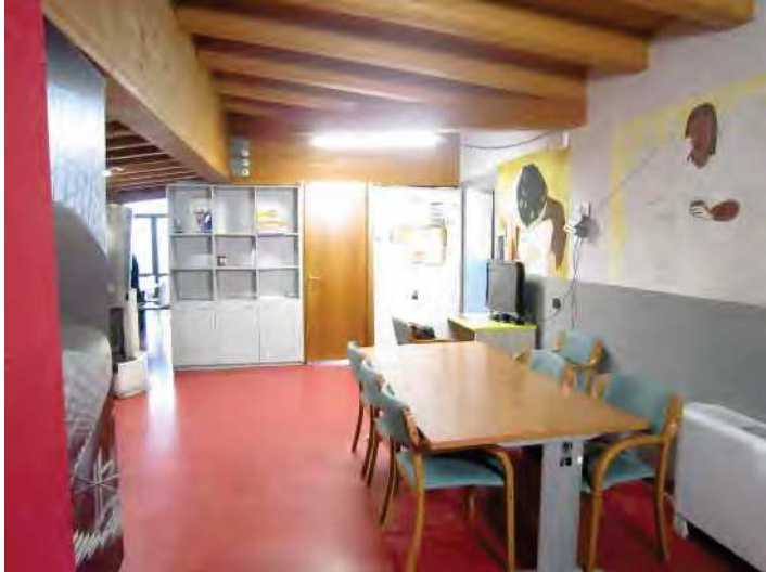
LOCALE PER ACCOGLIENZA MIGRANTI