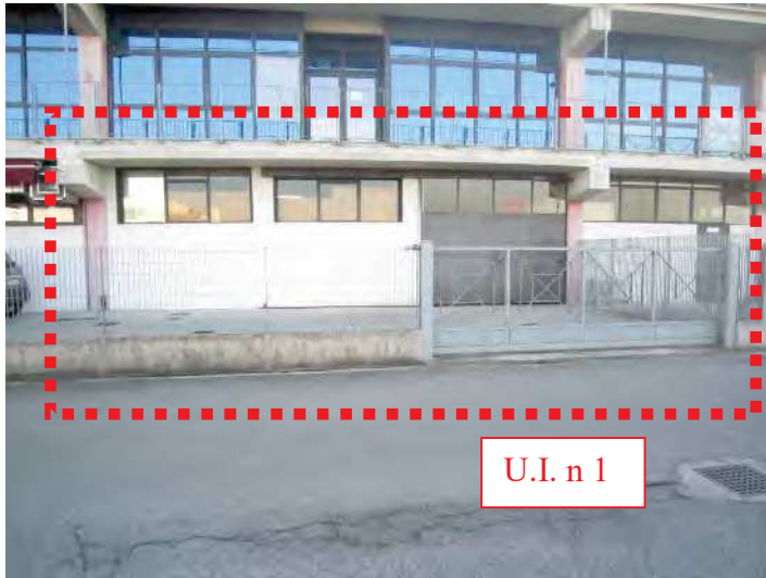
VISTA FRONTE OVEST DEL MAGAZZINO/DEPOSITO (U.I. N 1) DALLA VIA STRADA PROVINCIALE 23