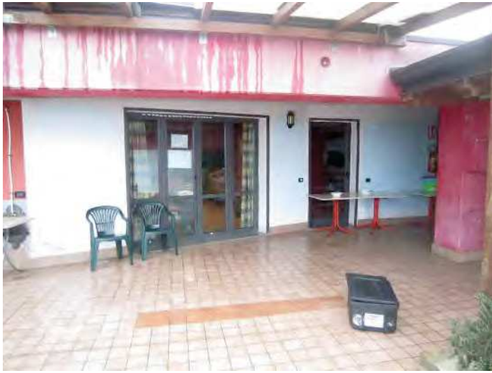
VISTA INGRESSO DALLA TERRAZZA COMUNE