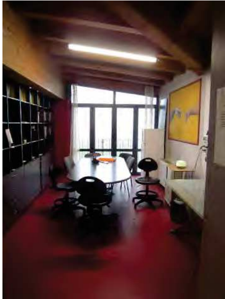
LOCALE PER ACCOGLIENZA MIGRANTI