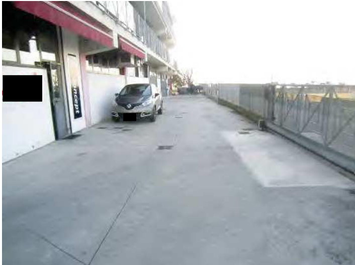
VISTA AREA CORTILIZIA PERTINENZIALE ESCLUSIVA SUL LATO OVEST