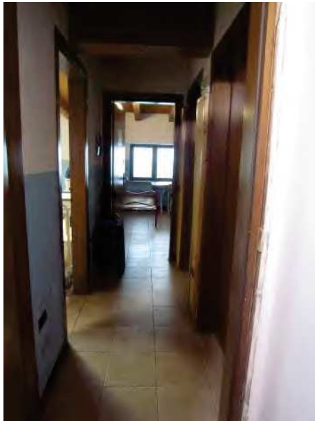
VISTA DISIMPEGNO DALLA CAMERA (1)