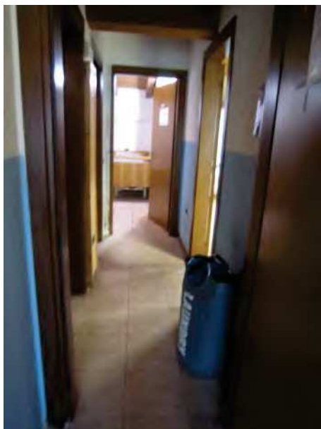
VISTA DISIMPEGNO DALLA CAMERA (2)