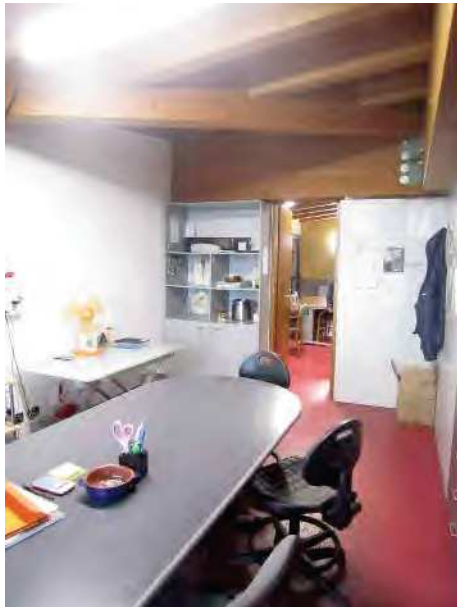
LOCALE PER ACCOGLIENZA MIGRANTI