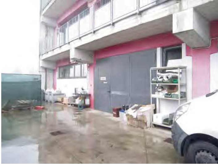
VISTA PROSPETTO NORD E INGRESSO AL MAGAZZINO