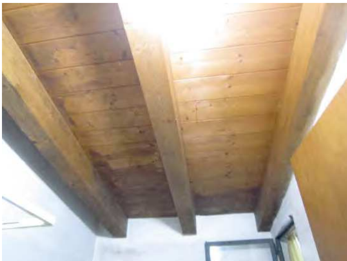
VISTA MACCHIE SUI TRAVETTI E SULL'ASSITO IN LEGNO NEL BAGNO