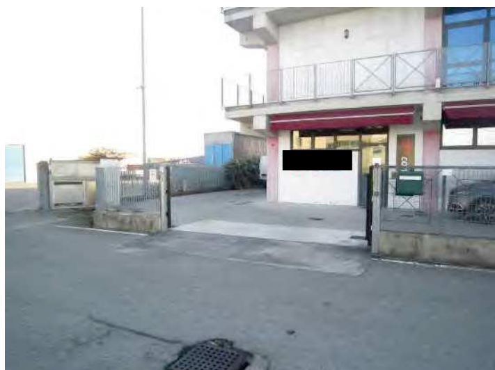
VISTA INGRESSO CARRALE/PEDONALE DEL LABORATORIO ARTIGIANALE (U.I. N 2) DALLA VIA STRADA PROVINCIALE 23