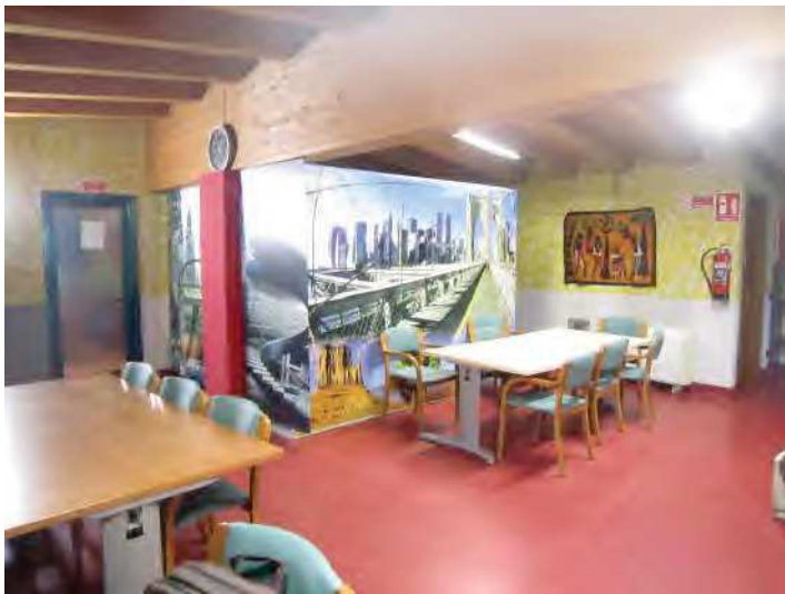
LOCALE PER ACCOGLIENZA MIGRANTI