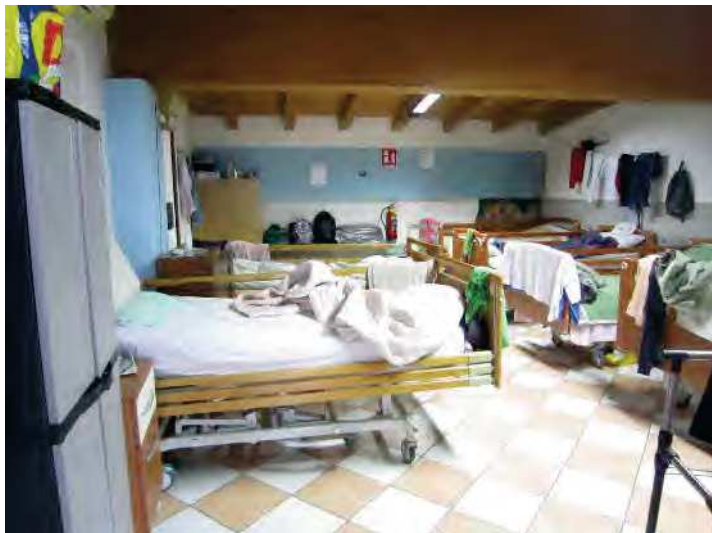
CAMERA PER ACCOGLIENZA MIGRANTI