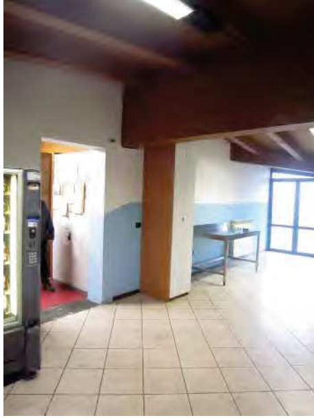
VISTA APERTURA VERSO ALTRA UNITA' IMMOBILIARE (U.I. n 4)