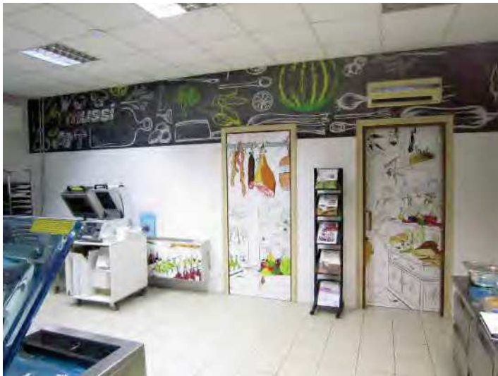
VISTA PORTE UFFICIO E DISIMPEGNO/SPOGLIATOIO DAL LOCALE ESPOSIZIONE