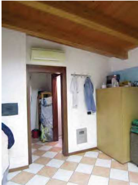
VISTA INGRESSO AL DISIMPEGNO