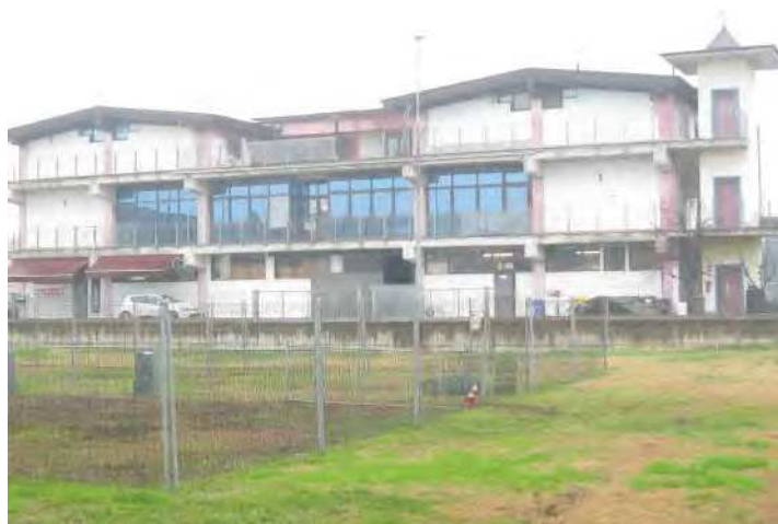
VISTA FRONTE OVEST DEL FABBRICATO A DESTINAZIONE ARTIGIANALE/PRODUTTIVA DA VIA STRADA PROVINCIALE 23