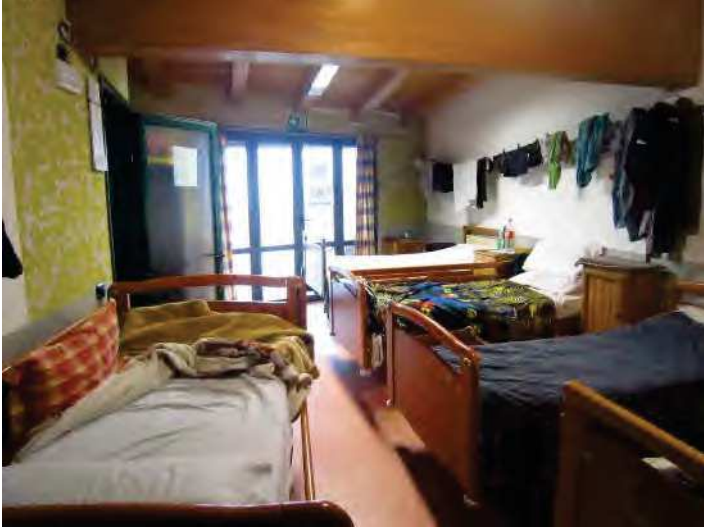
CAMERA PER ACCOGLIENZA MIGRANTI