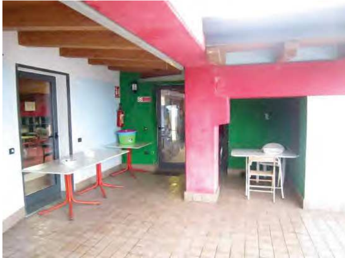
VISTA INGRESSO E PORTICO DALLA TERRAZZA COMUNE