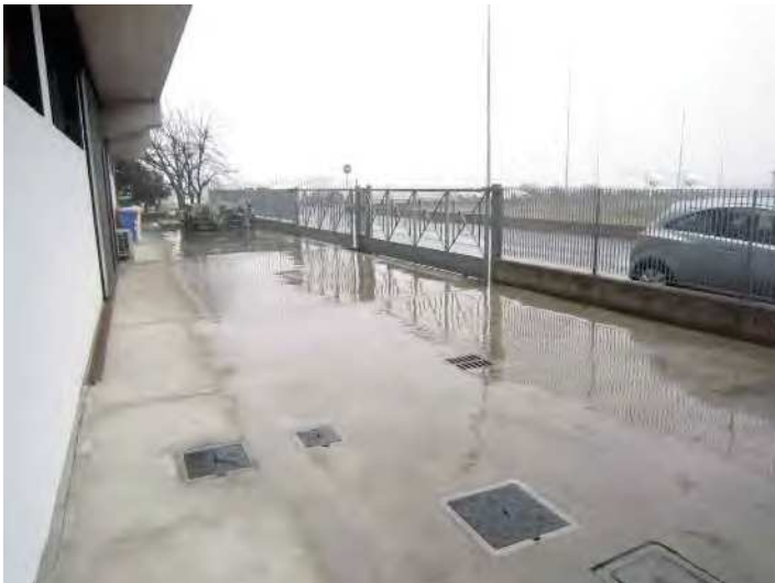
VISTA AREA CORTILIZIA PERTINENZIALE ESCLUSIVA