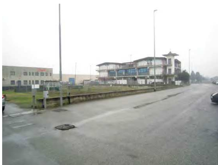
VISTA FABBRICATO A DESTINAZIONE ARTIGIANALE/PRODUTTIVA DA VIA STRADA PROVINCIALE 23