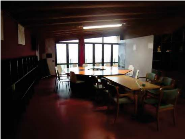
LOCALE PER ACCOGLIENZA MIGRANTI