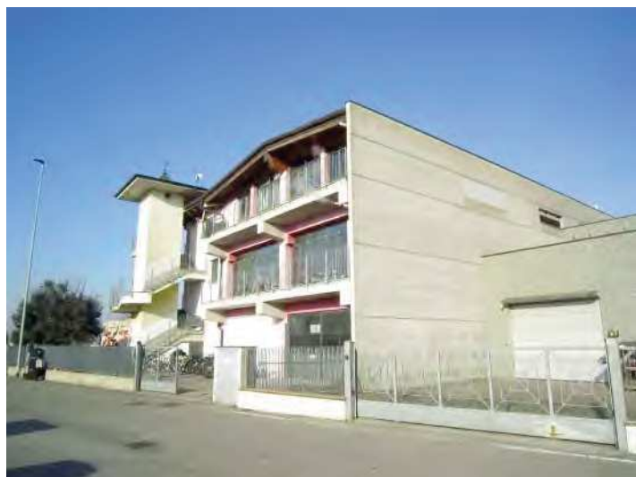
VISTA FRONTE SUD-EST DEL FABBRICATO A DESTINAZIONE ARTIGIANALE/PRODUTTIVA DA VIA STRADA PROVINCIALE 23