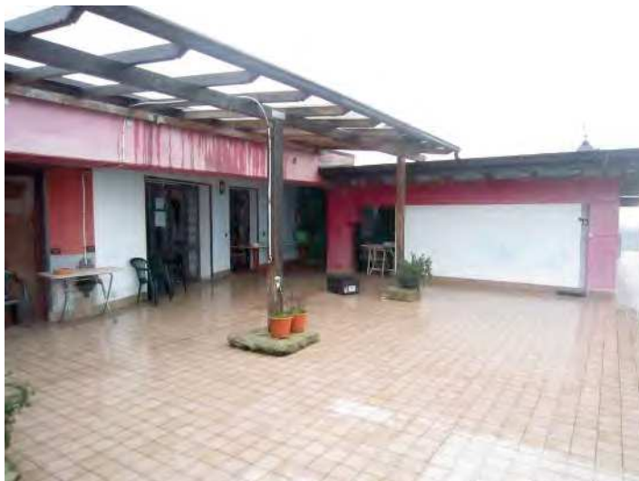
VISTA TERRAZZA COMUNE AL PIANO SECONDO