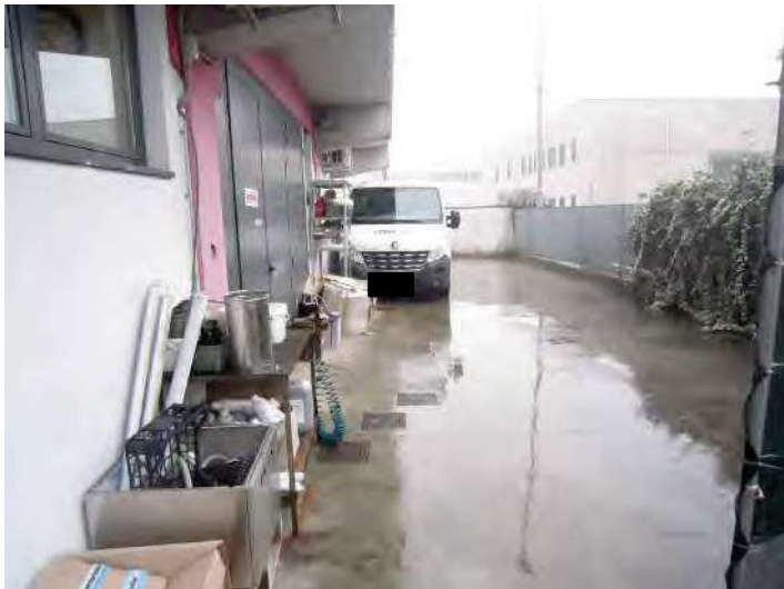
VISTA AREA CORTILIZIA PERTINENZIALE ESCLUSIVA SUL LATO NORD