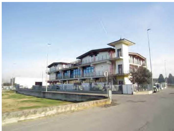
VISTA FRONTI SUD-OVEST DEL FABBRICATO A DESTINAZIONE ARTIGIANALE/PRODUTTIVA DA VIA STRADA PROVINCIALE 23