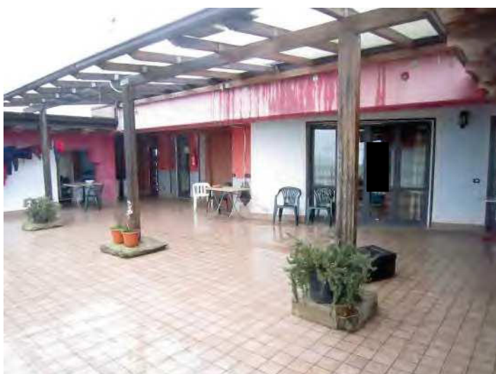
VISTA TERRAZZA COMUNE AL PIANO SECONDO