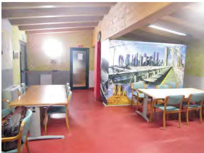
LOCALE PER ACCOGLIENZA MIGRANTI E VISTA INGRESSO ALLA CAMERA