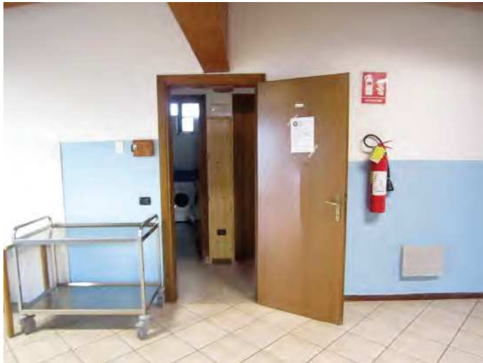
VISTA PORTA VERSO ZONA NOTTE