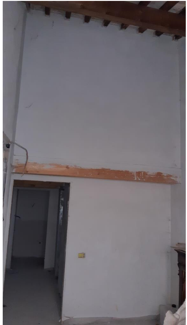
Piano Primo - Camera