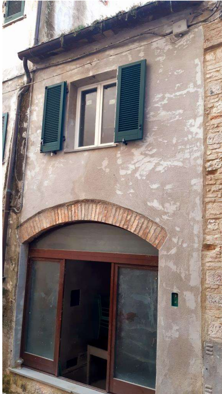
Fronte su Via Mazzini n.21