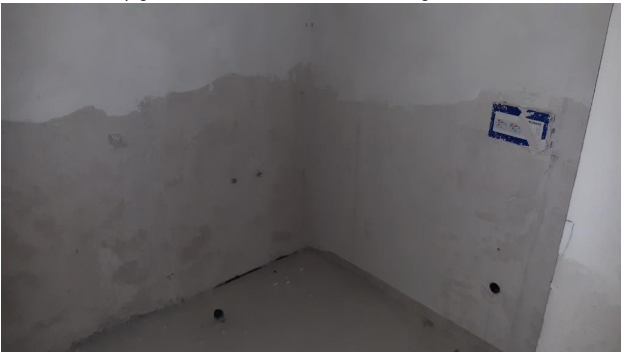
Piano Primo – Bagno