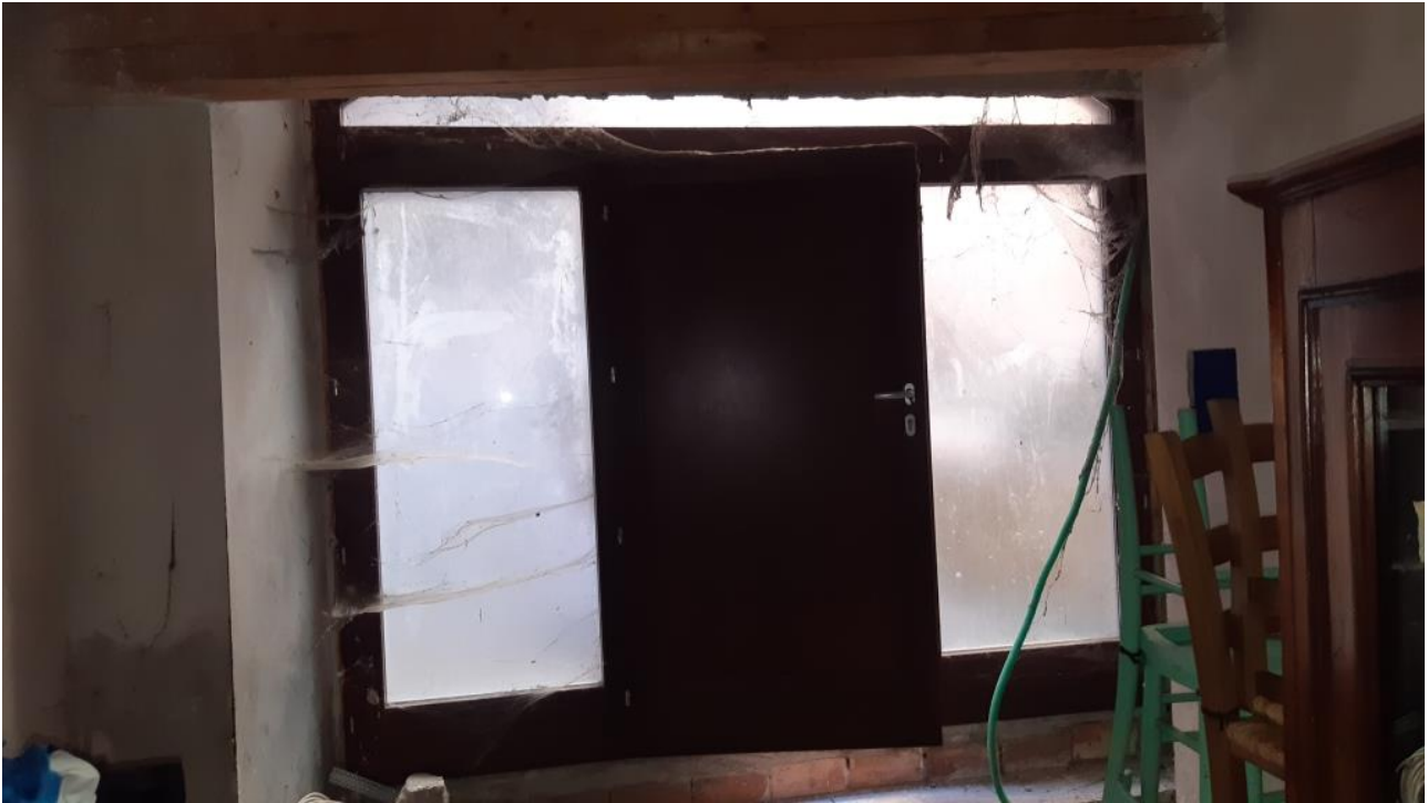
Piano Terra: Ingresso Cucina-Soggiorno