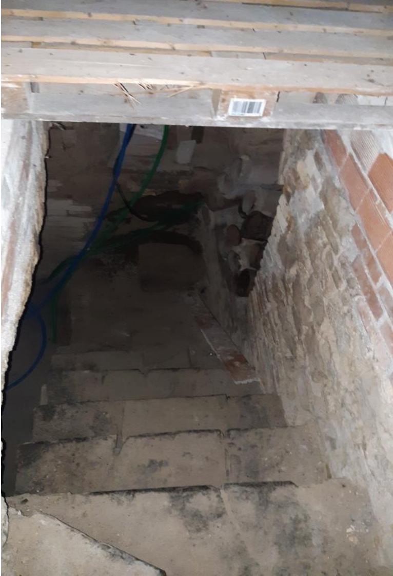
Piano Terra: Scala al Piano Interrato