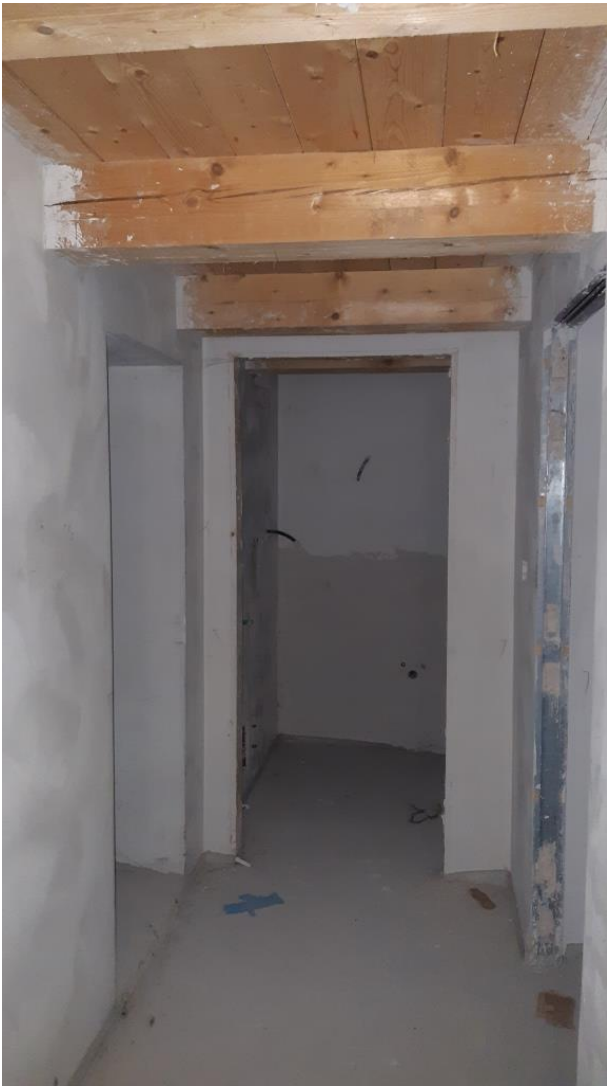
Piano Primo – Disimpegno