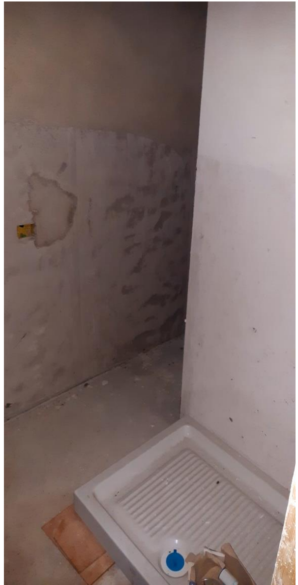
Piano Terra - Bagno