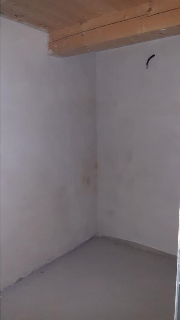
Piano Primo – Ripostiglio