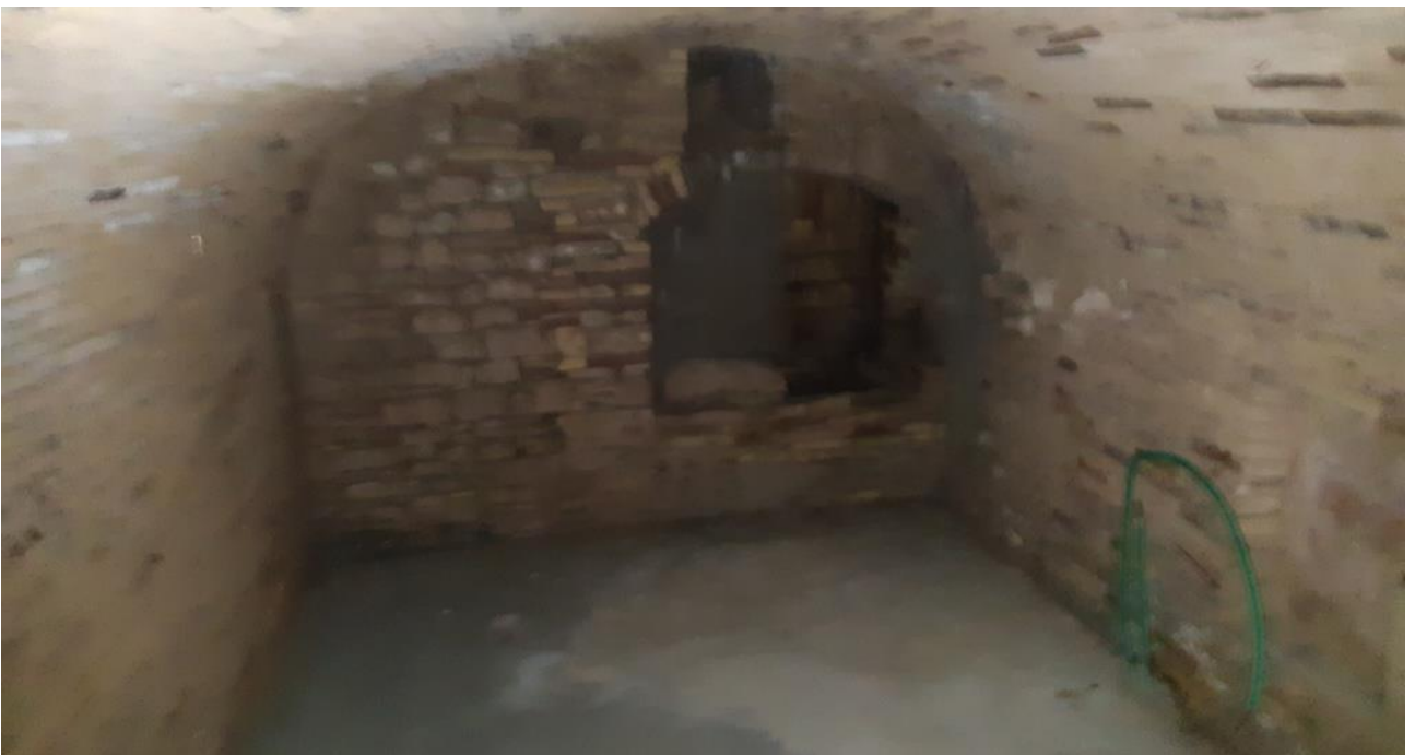
Piano Interrato : Grotta