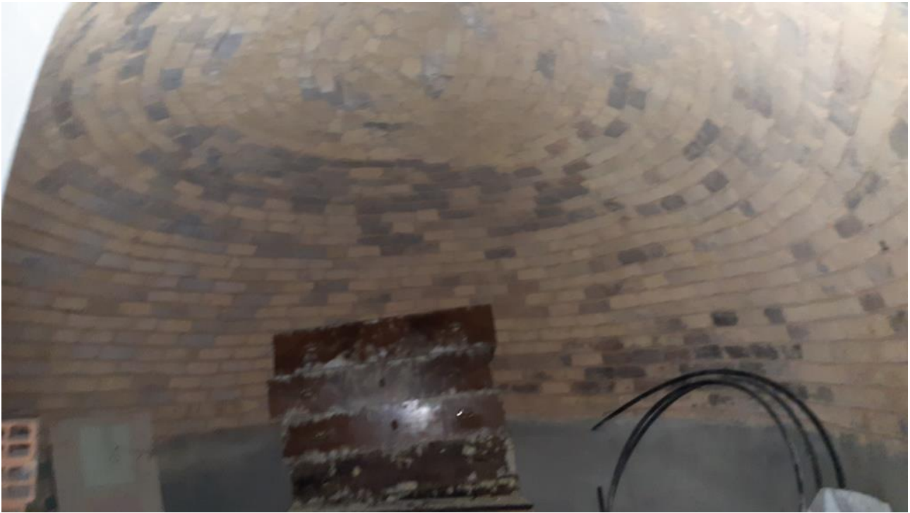
Piano Terra: Ripostiglio (ex Forno)