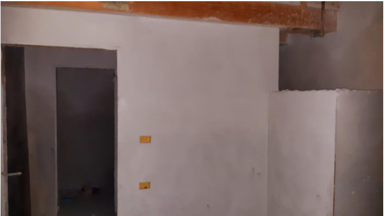
Piano Terra: Disimpegno