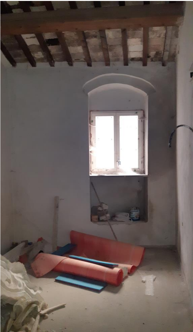
Piano Primo – Camera