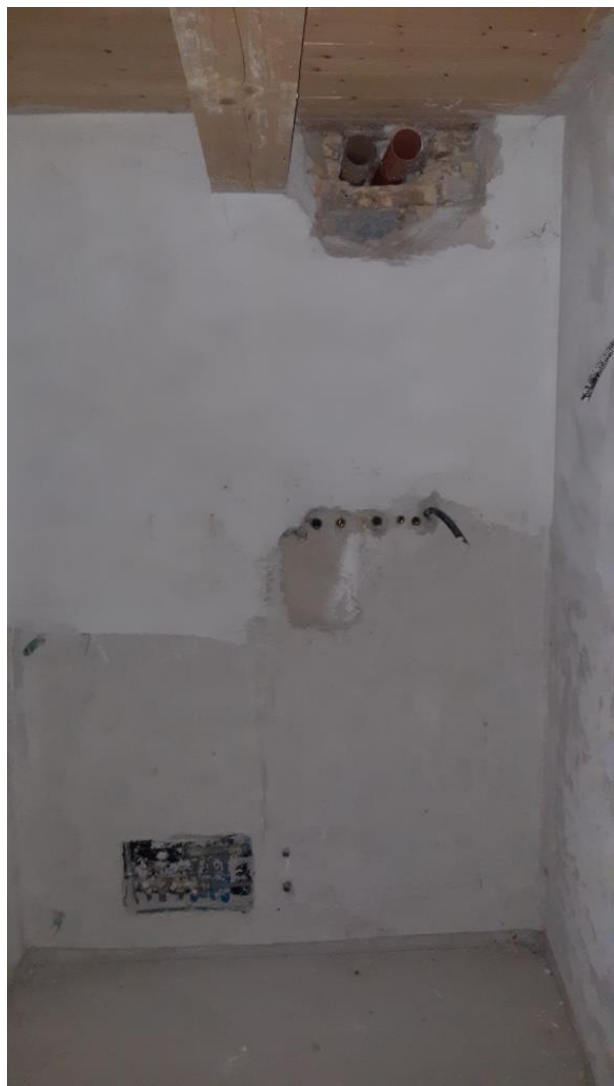
Piano Primo – Bagno