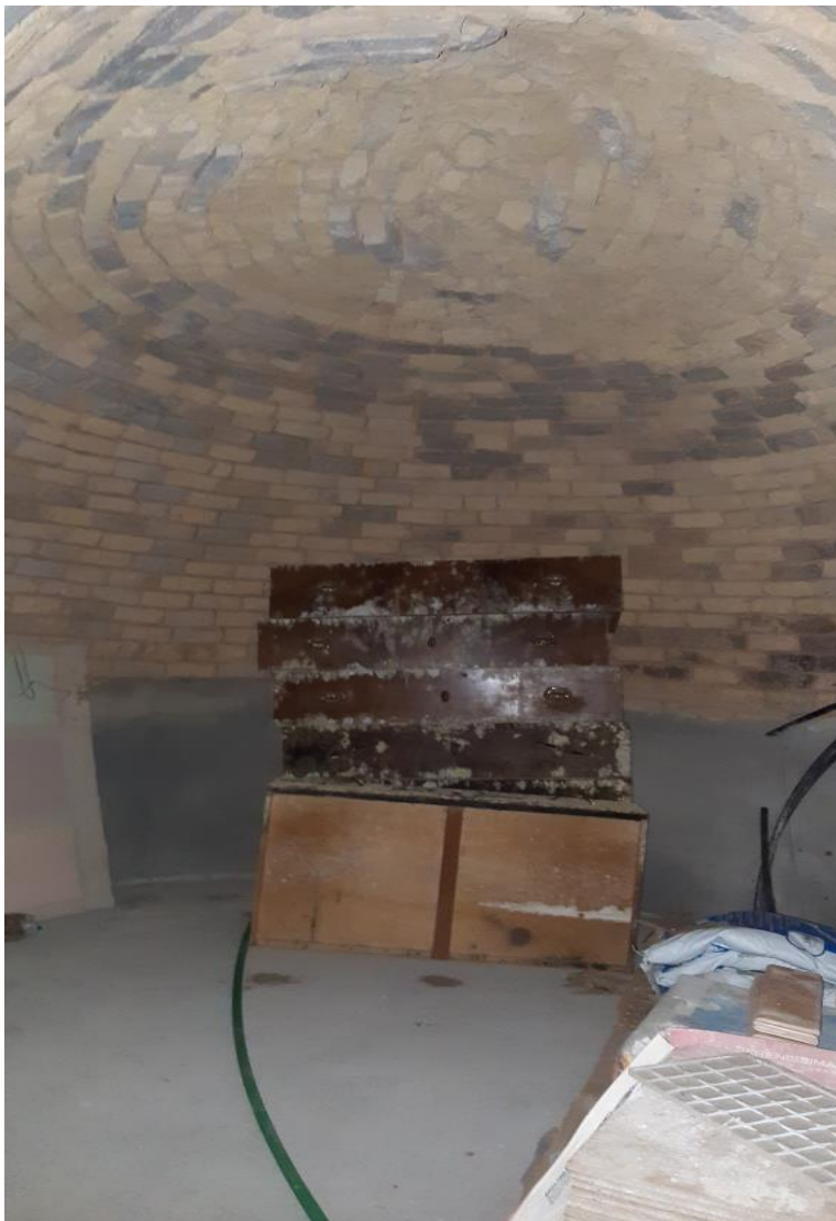
Piano Terra: Ripostiglio (ex forno)