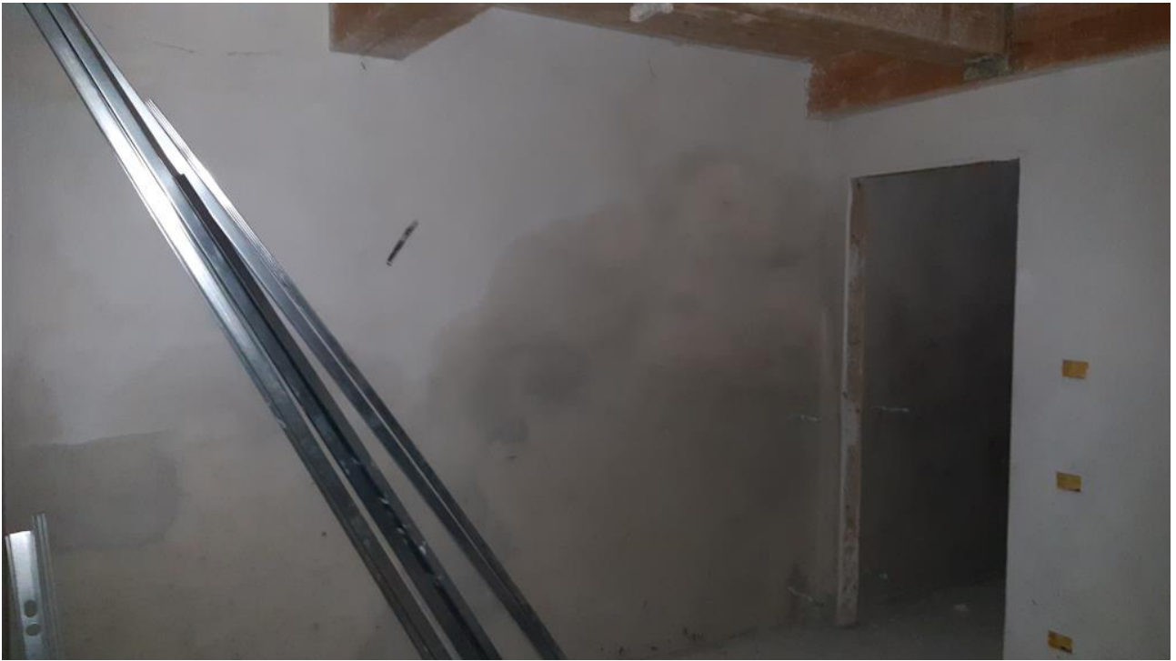
Piano Terra: Disimpegno