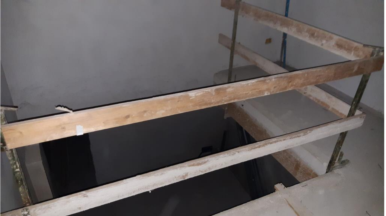
Piano Primo: Disimpegno-Vano Scala