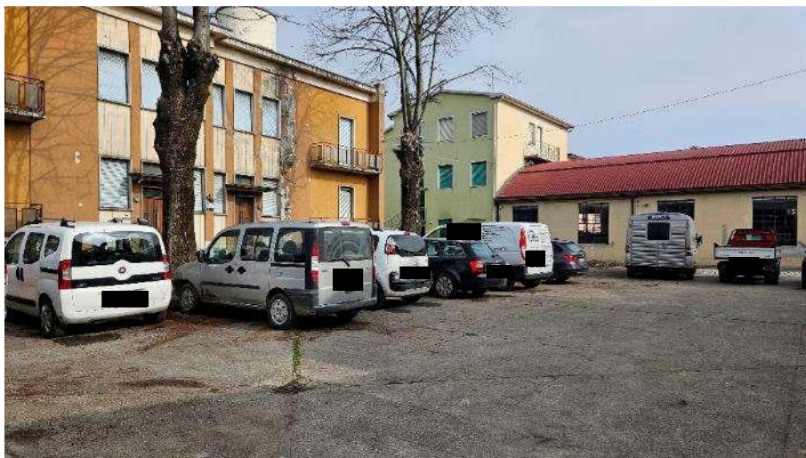
Cortile interno lato Sud-Est