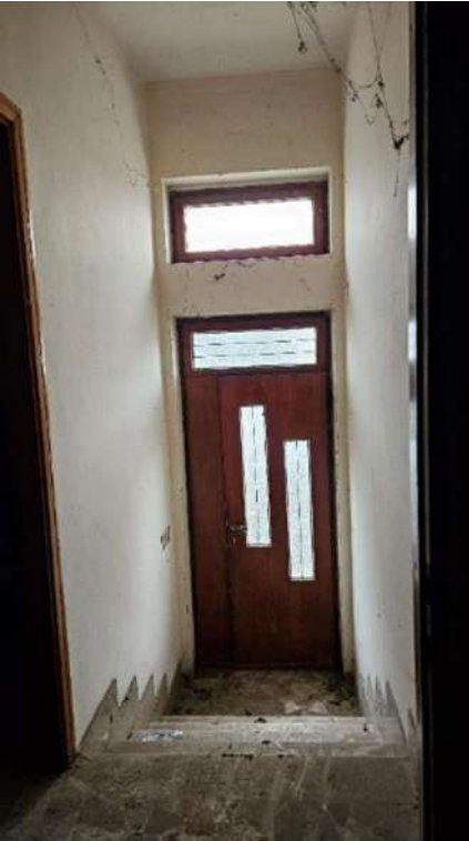
Scala ingresso posteriore