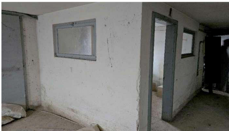
Esterno locale 1