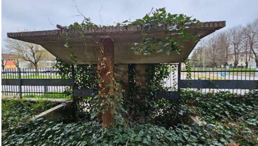
Ingressi pedonali lato Piazzale Europa