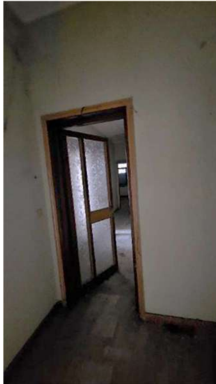
Porta interna di collegamento tra i due lotti a piano rialzato