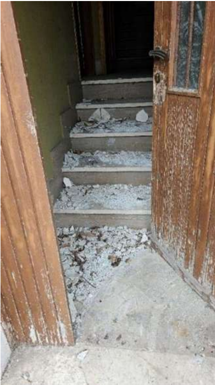
Ingresso di servizio