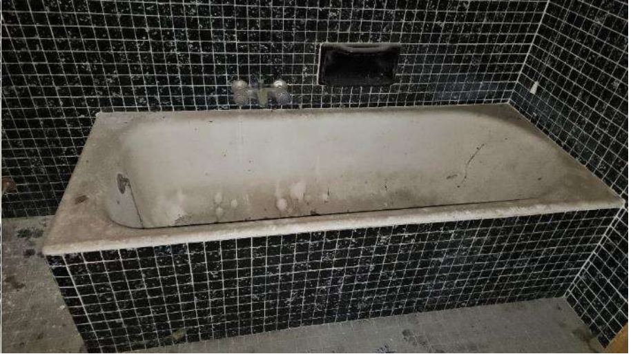
Bagno e WC piano primo