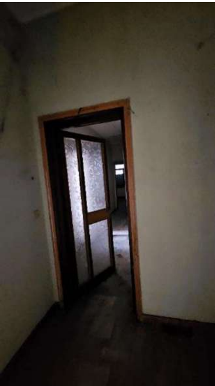
Porta collegamento tra i due lotti piano rialzato