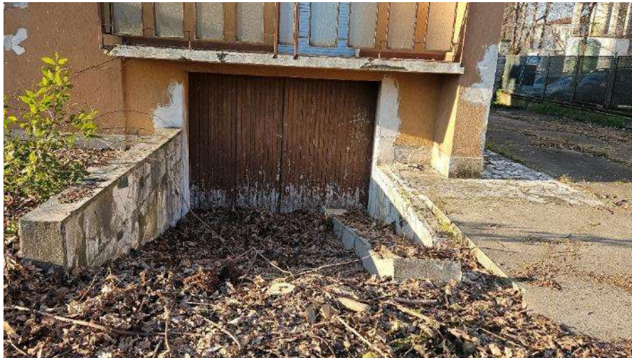
Accesso interrato lato Nord-Est