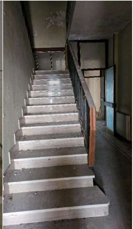
Scala interna PT/P1