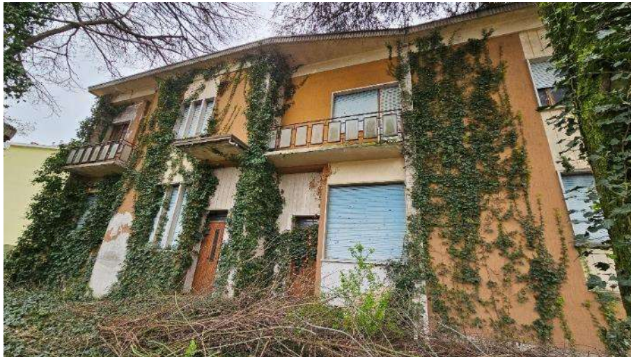
Dettaglio prospetto lato Nord-Ovest