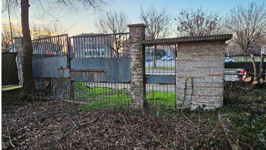
Dettaglio accesso carraio/pedonale Sud