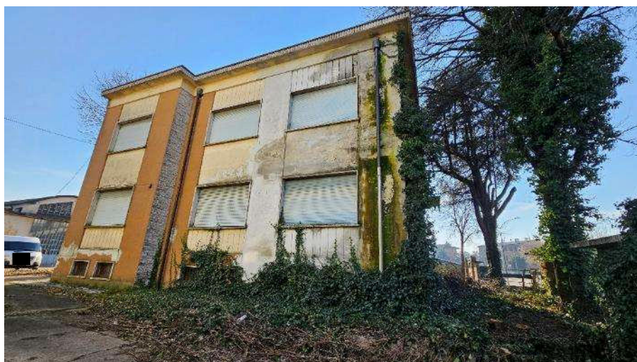
Prospetto interno lato Nord-Nord