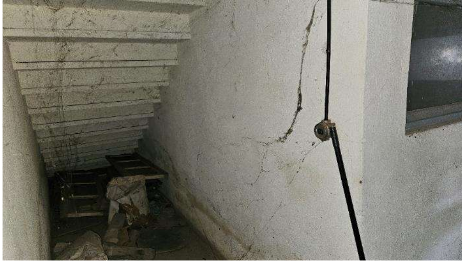
Sottoscala (scala interna)