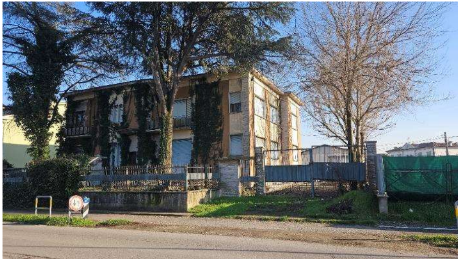
Cancello carraio lato Sud-Ovest