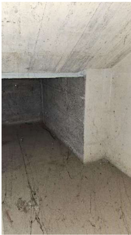
sottoscala (ingresso principale)