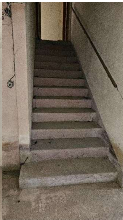
scala interna cantina/PT