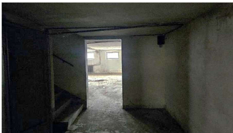
Porta interna di collegamento tra i due lotti a piano interrato