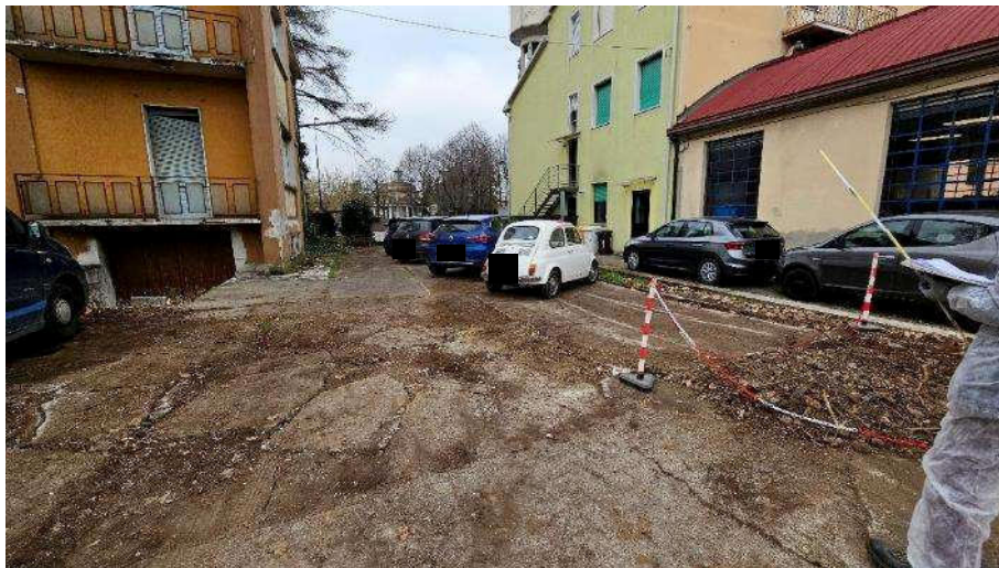
Cortile interno lato Nord-Est