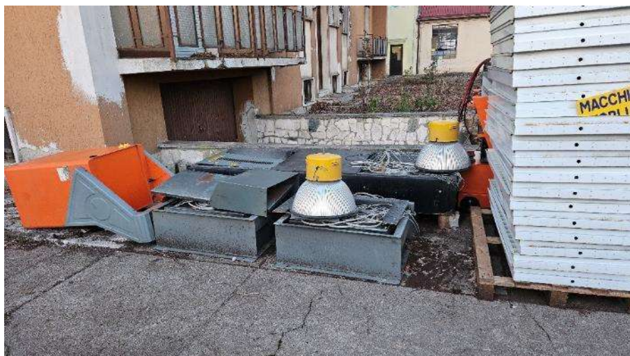
Dettaglio balcone piano rialzato