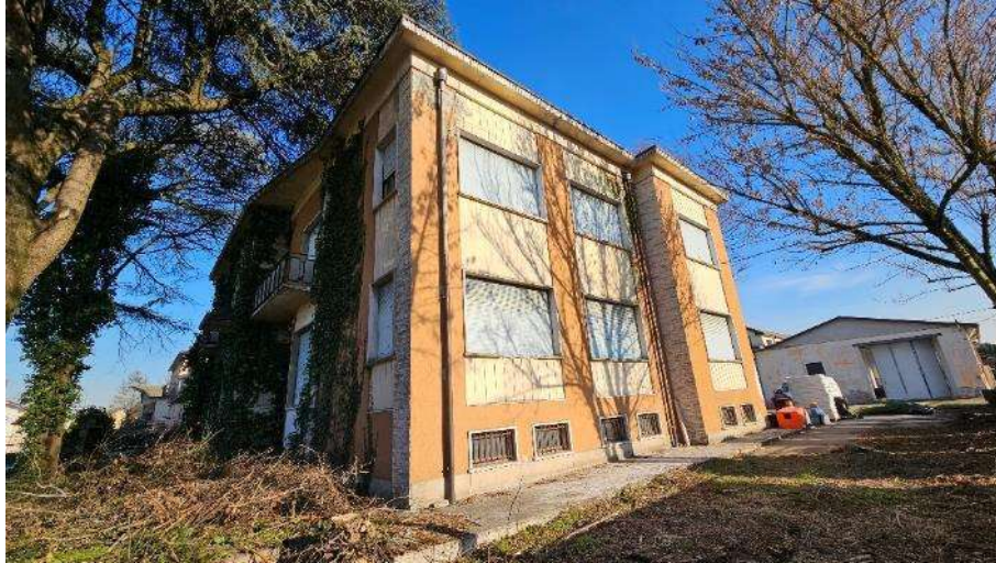
Prospetto interno lato Sud-Ovest