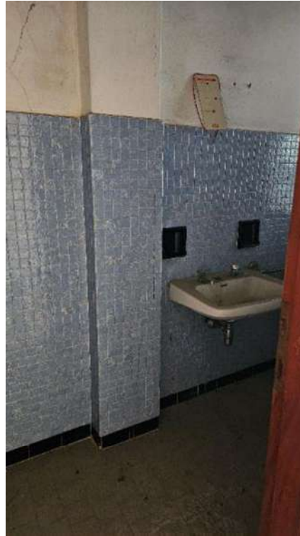
bagno piano rialzato