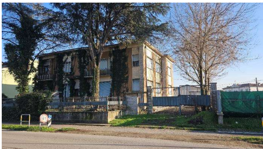
Fronte esterno su Piazzale Europa lato Nord-Ovest