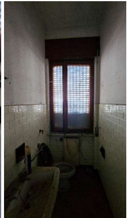
Bagno e WC piano primo