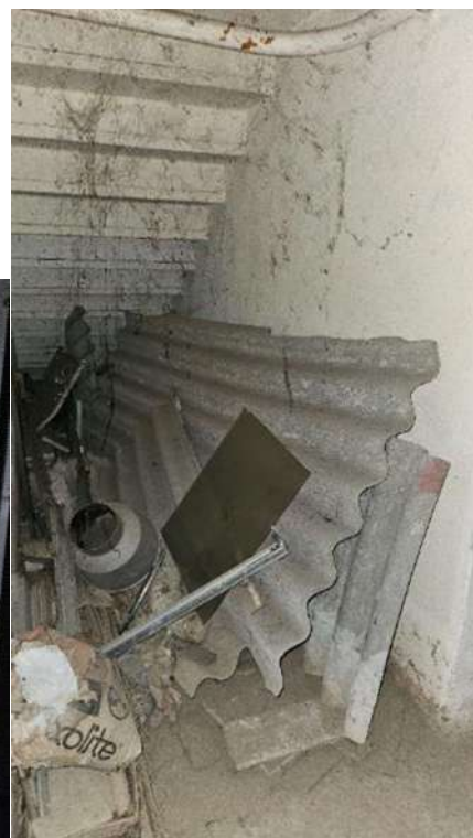
Sottoscala (scala interna)