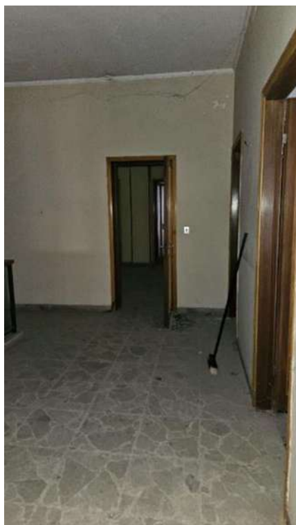
Porta collegamento tra i due lotti a piano primo