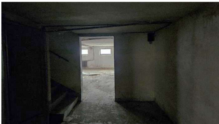
Porta interna di collegamento tra i due lotti a piano interrato