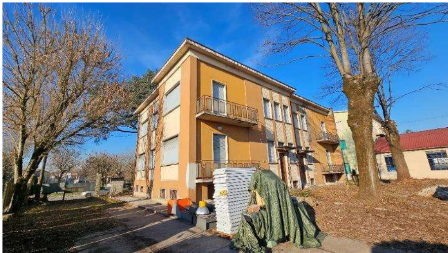
Cortili interni lati Sud-Ovest e Sud-Est