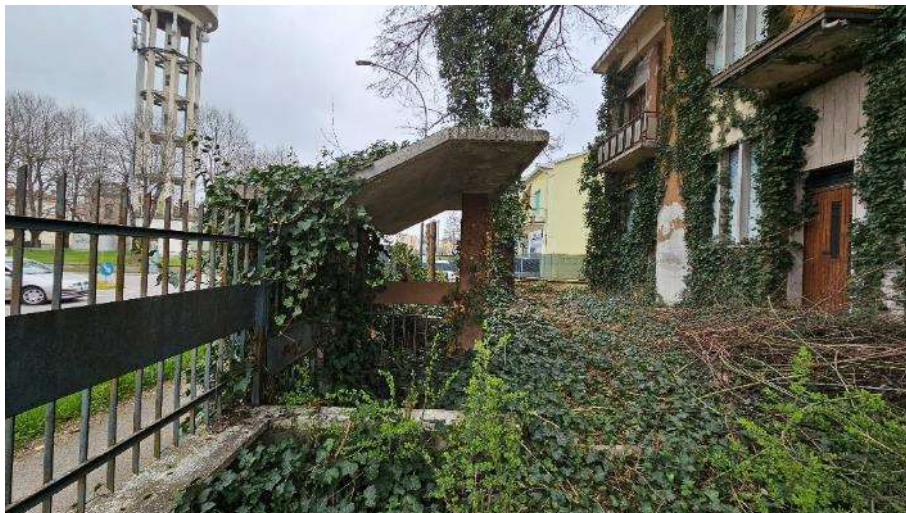
Cortile lato Nord-Ovest