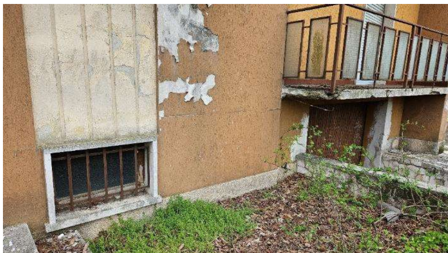
Dettaglio balcone piano rialzato