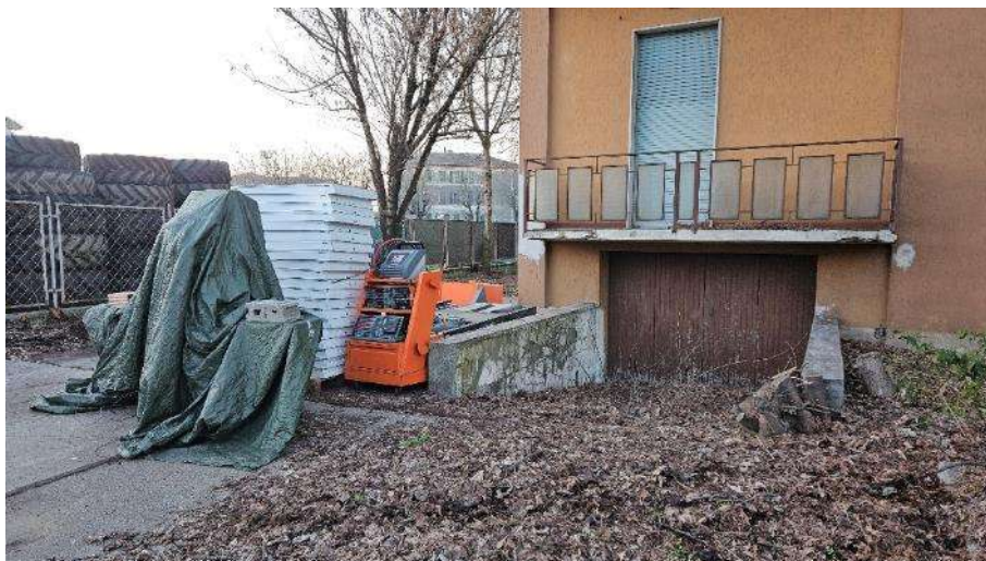
Accesso interrato lato Sud-Ovest