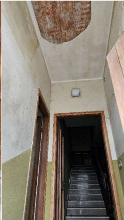
Ingresso di servizio