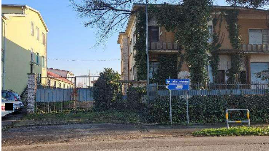
Cancello carraio lato Nord-Est