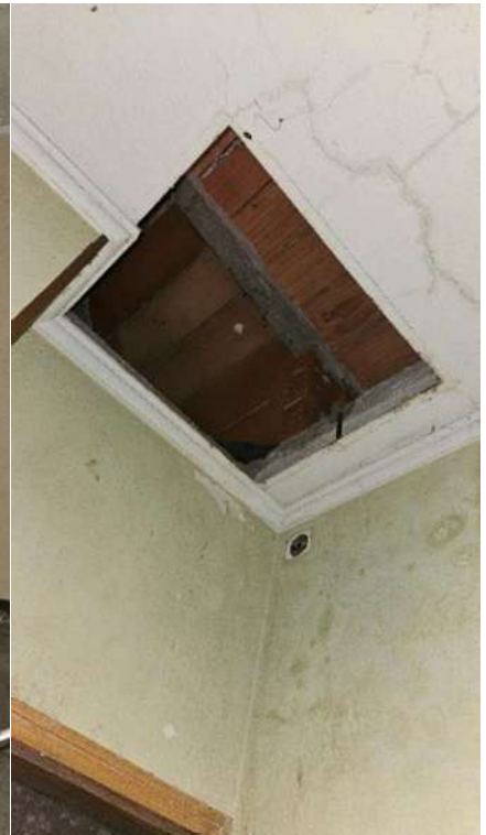
Botola accesso sottotetto