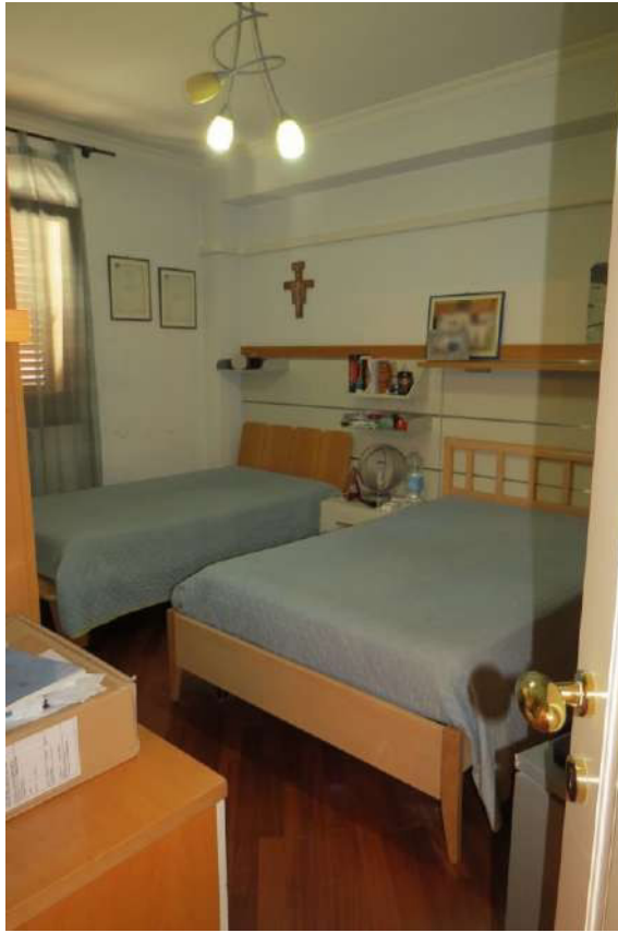
Foto n. 57 – Lotto 7, Edificio per civile abitazione, Piano primo.