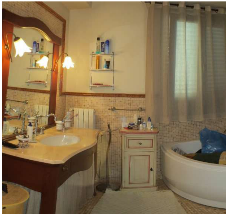
Foto n. 56 – Lotto 7, Edificio per civile abitazione, Piano primo.