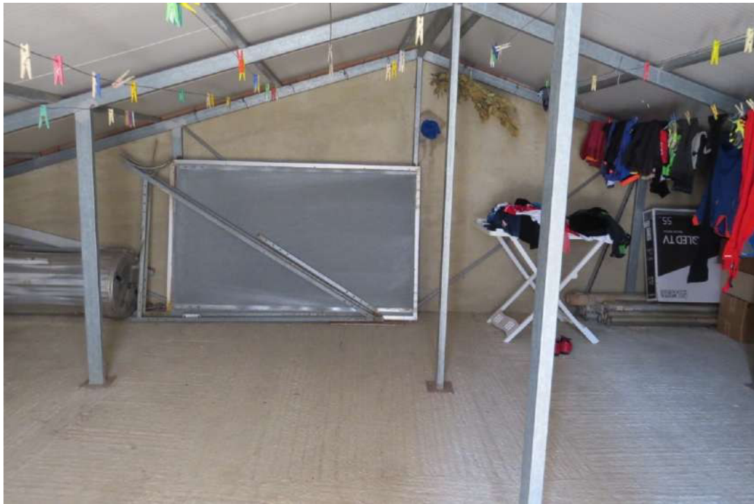
Foto n. 65 – Lotto 7, Edificio per civile abitazione, Piano copertura.