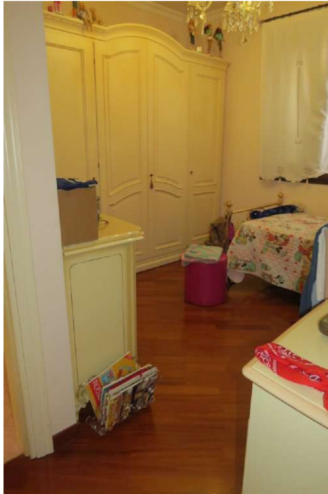
Foto n. 55 – Lotto 7, Edificio per civile abitazione, Piano primo.