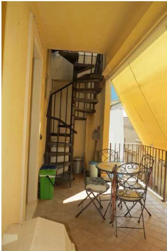
Foto n. 62 – Lotto 7, Edificio per civile abitazione, Piano secondo.