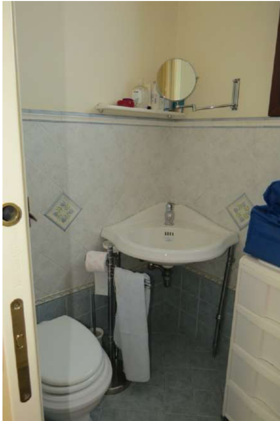
Foto n. 61 – Lotto 7, Edificio per civile abitazione, Piano secondo.