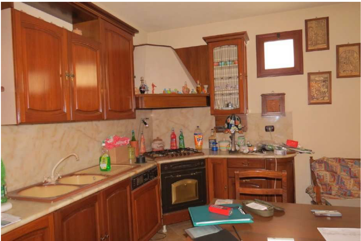
Foto n. 54 – Lotto 7, Edificio per civile abitazione, Piano seminterrato.