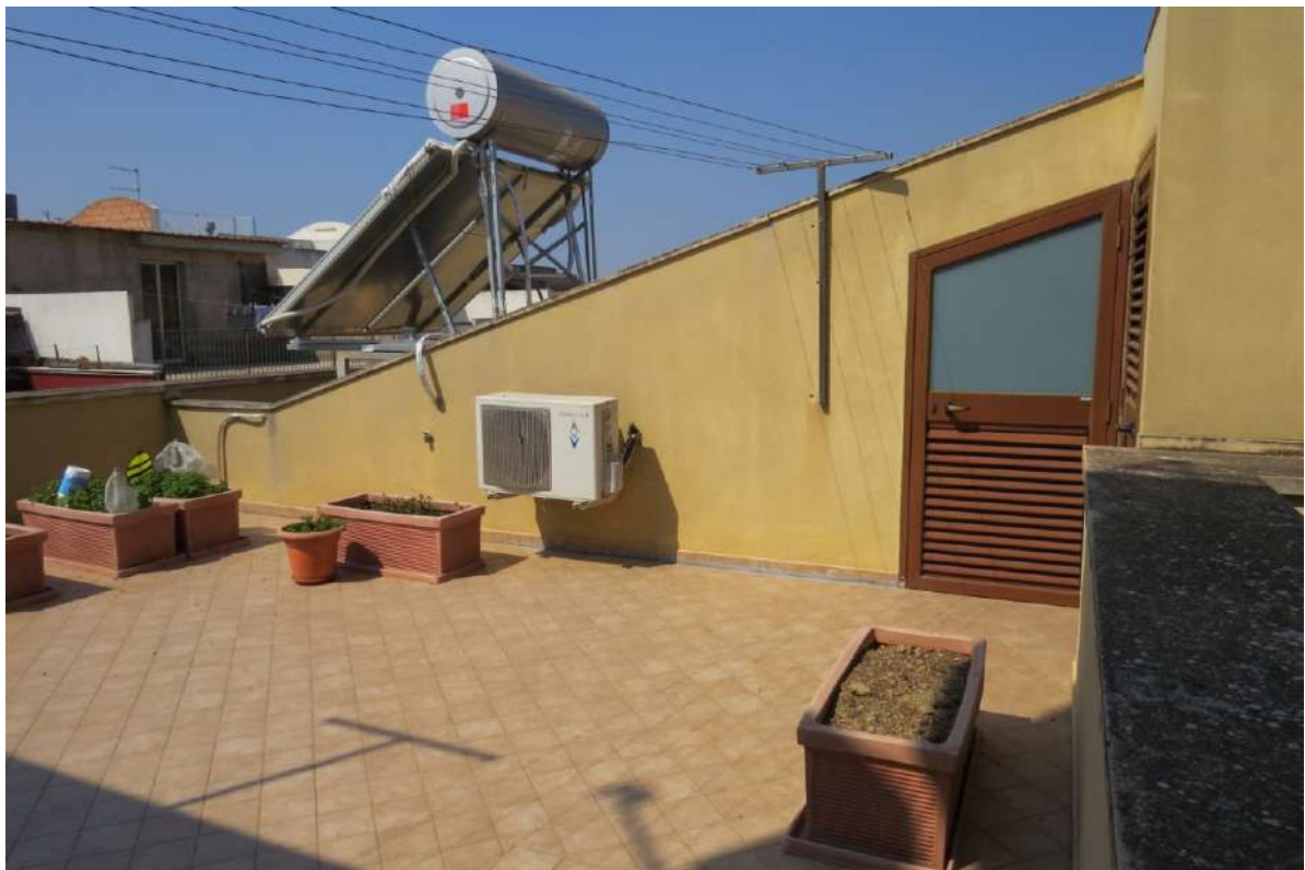
Foto n. 64 – Lotto 7, Edificio per civile abitazione, Piano copertura.