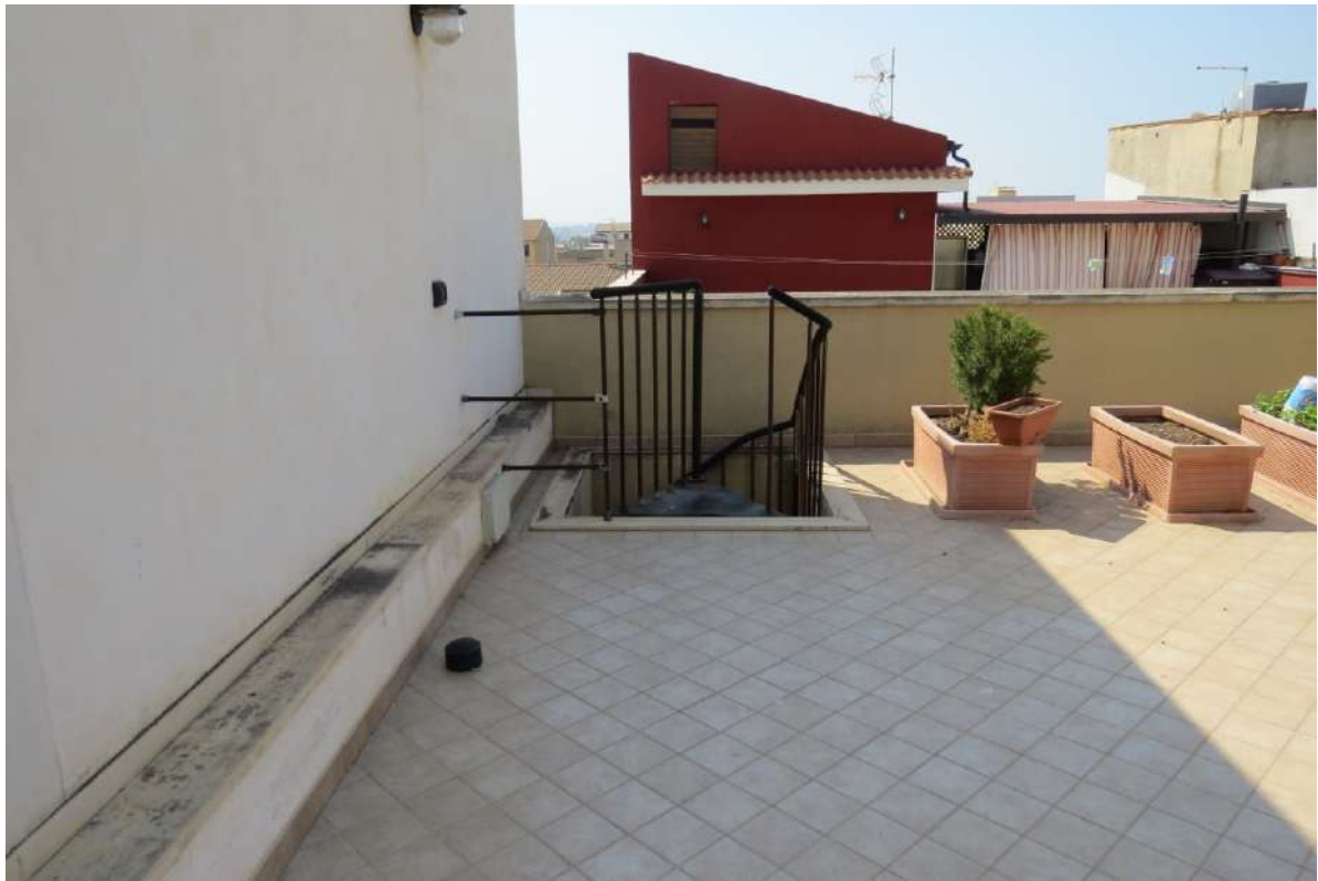
Foto n. 63 – Lotto 7, Edificio per civile abitazione, Piano copertura.