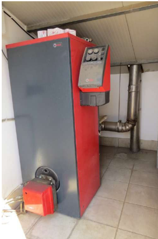
Foto n. 66 – Lotto 7, Edificio per civile abitazione, Piano copertura.