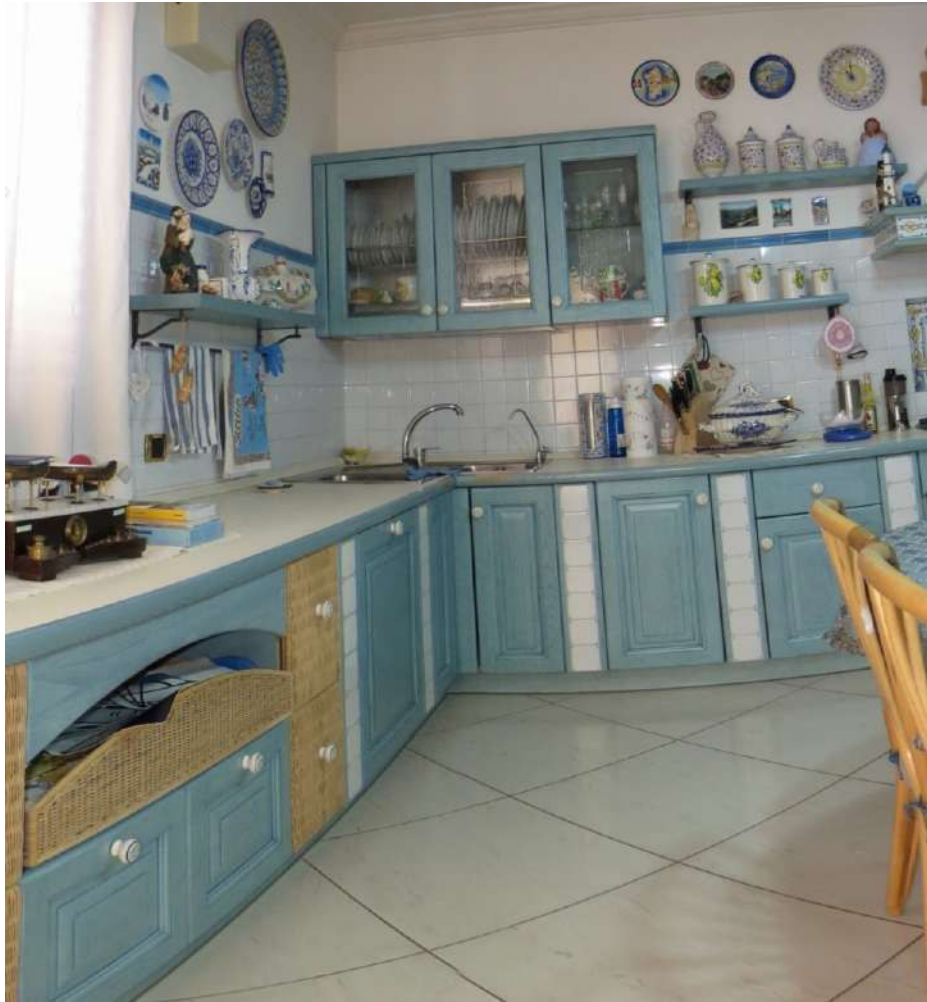
Foto n. 59 – Lotto 7, Edificio per civile abitazione, Piano secondo.