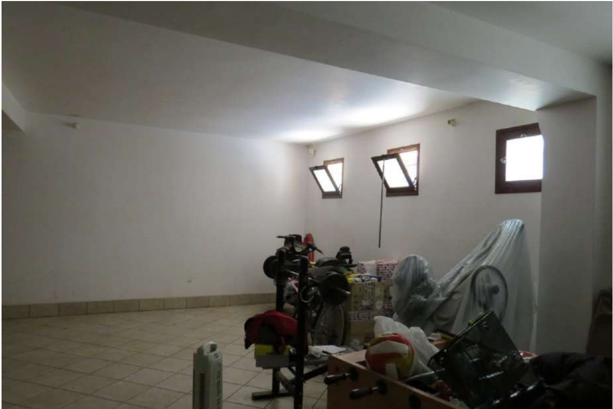
Foto n. 53 – Lotto 7, Edificio per civile abitazione, Piano seminterrato.