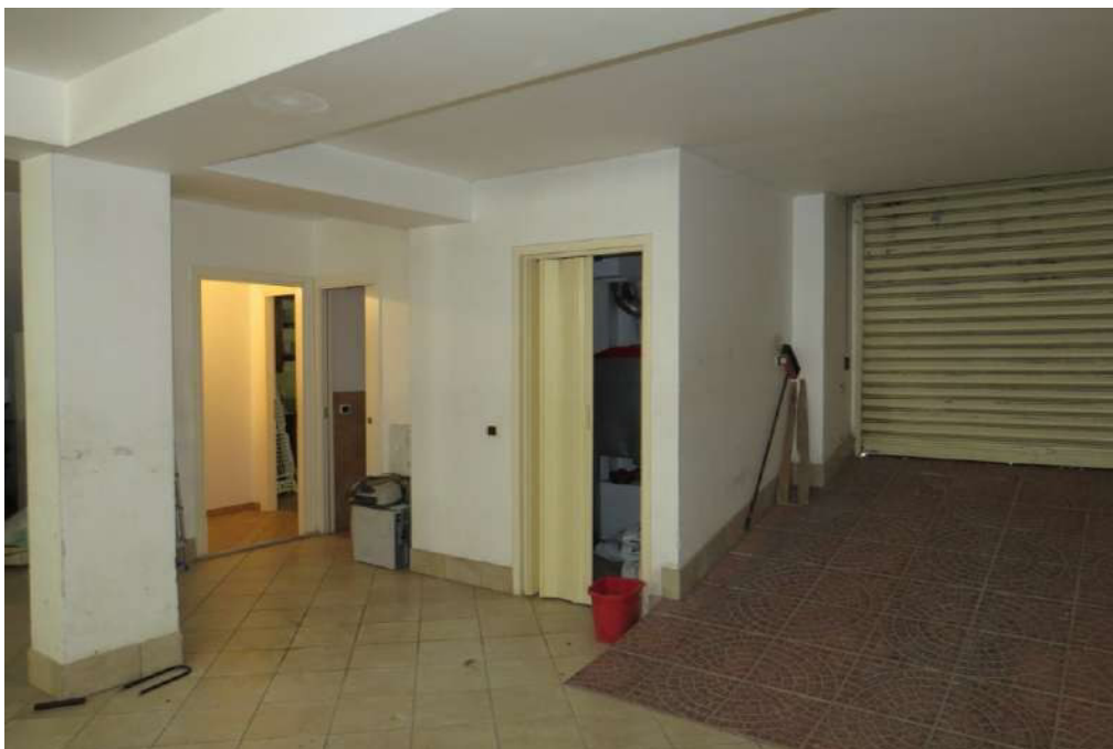
Foto n. 52 – Lotto 7, Edificio per civile abitazione, Piano seminterrato.