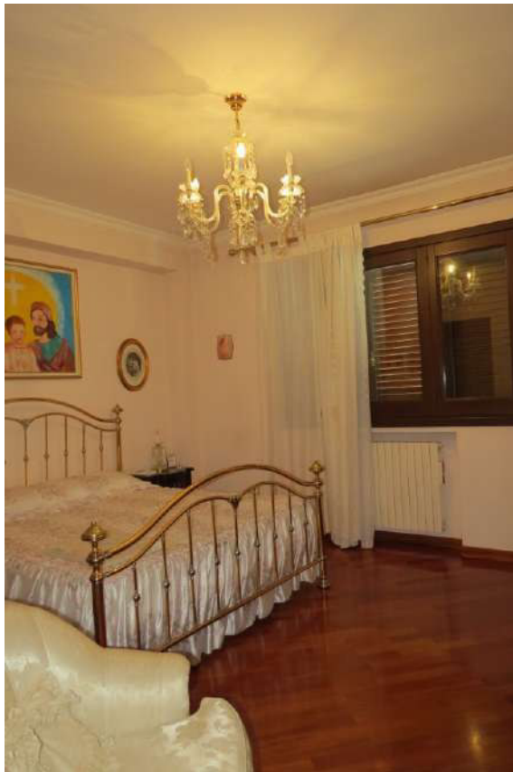
Foto n. 58 – Lotto 7, Edificio per civile abitazione, Piano primo.