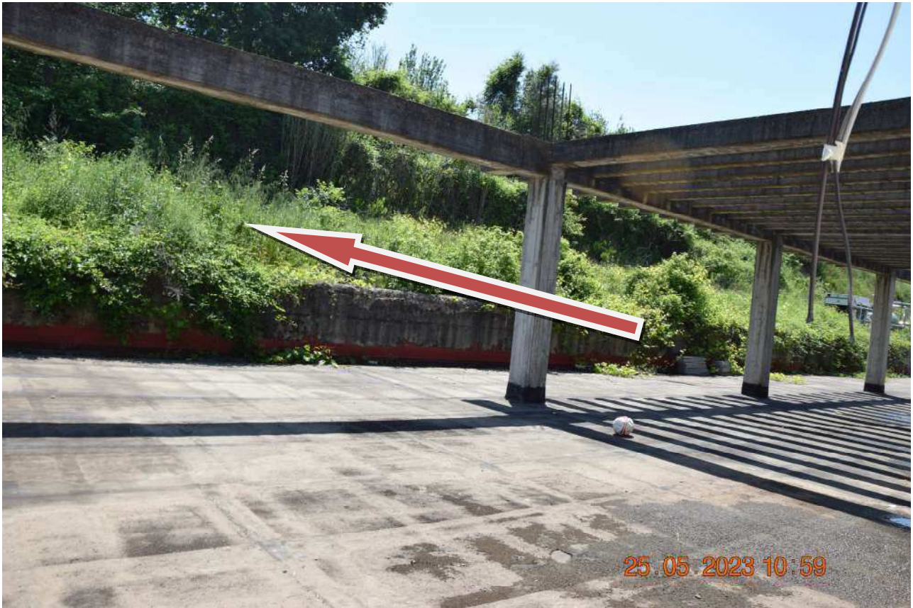
AREA A VERDE