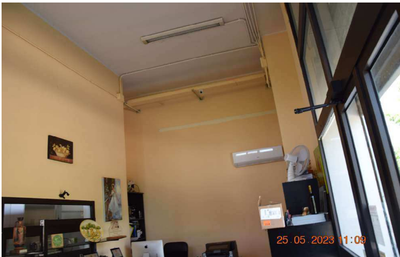
PIANO TERRA UFFICIO SUB 5