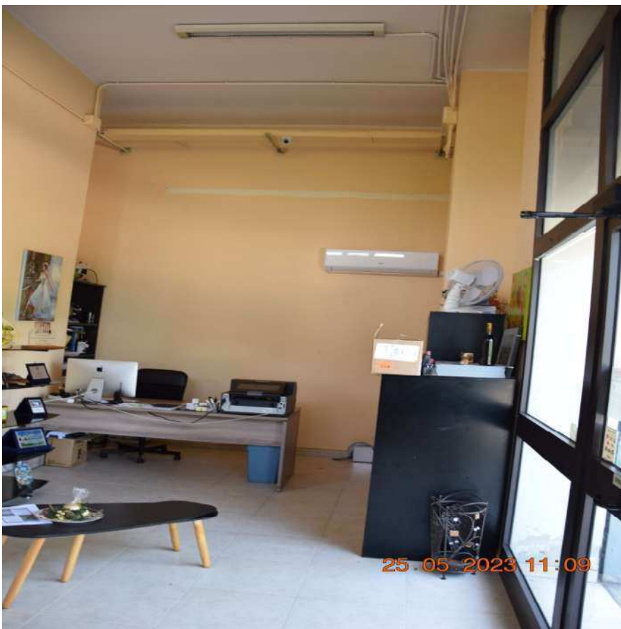
PIANO TERRA UFFICIO SUB 5