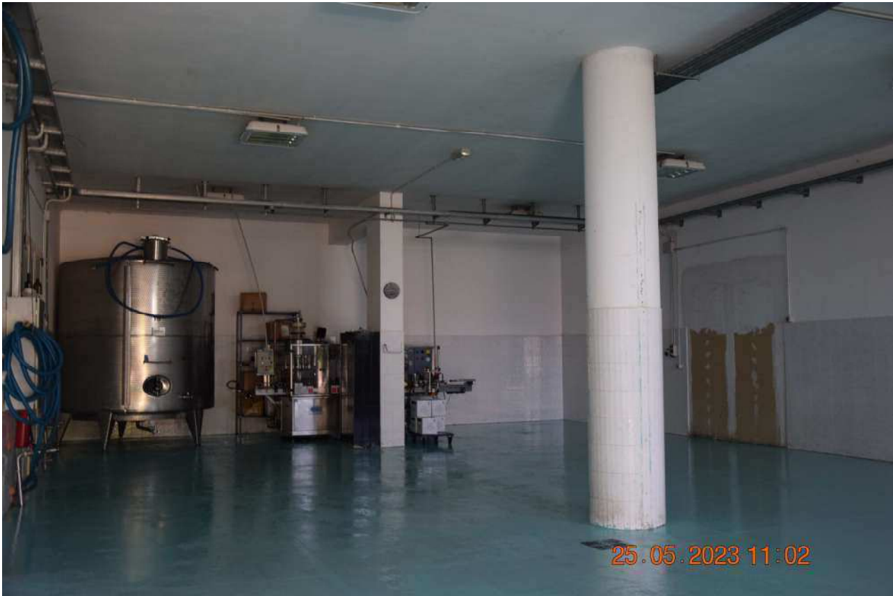
PIANO TERRA IMBOTTIGLIAMENTO SUB 6