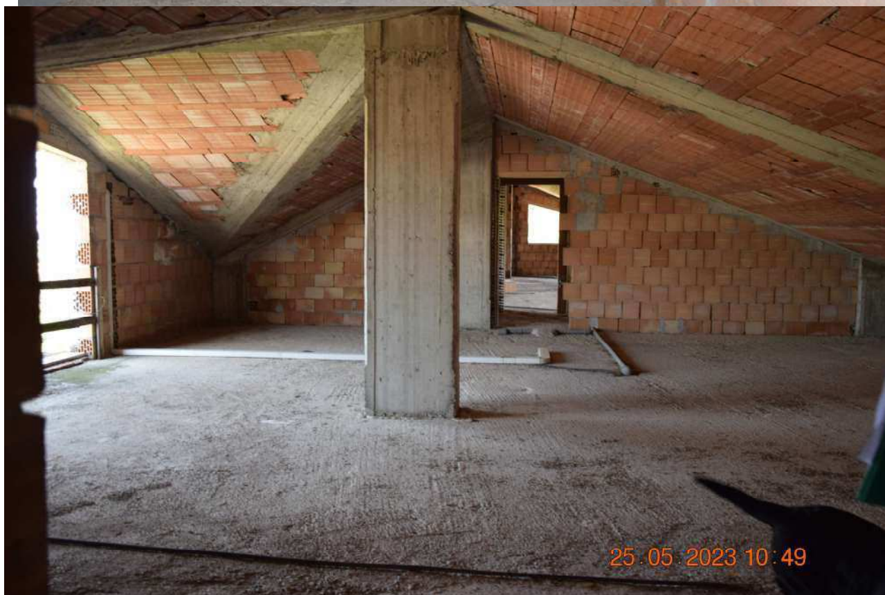
Foto n. 6 Spogliatoi