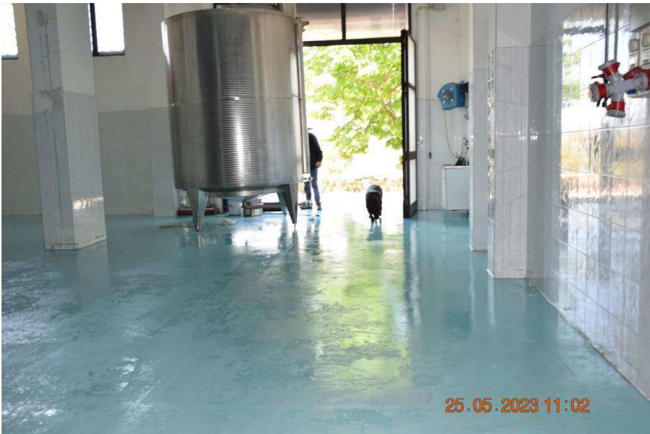
PIANO TERRA IMBOTTIGLIAMENTO SUB 6