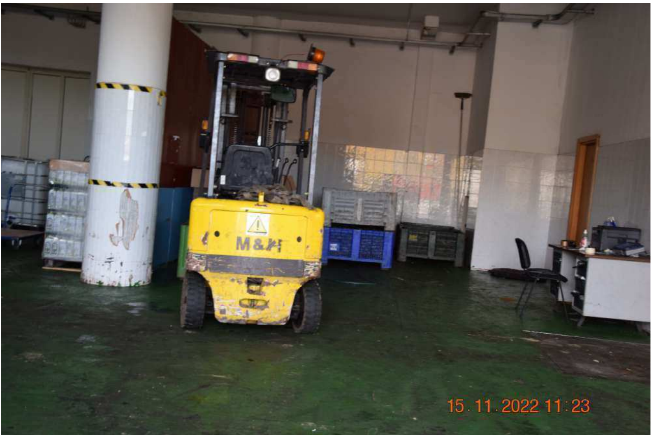
PIANO TERRA FRANTOIO SUB 5