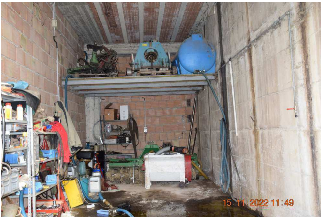
PIANO TERRA GARAGE SUB 8