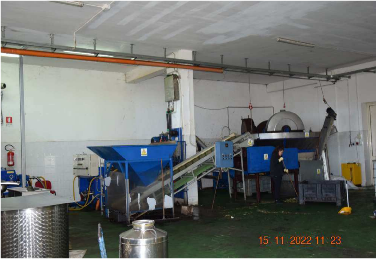
PIANO TERRA FRANTOIO SUB 5