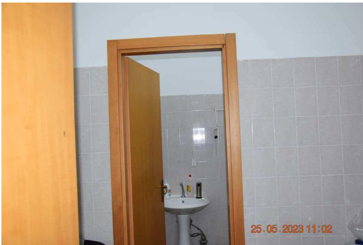
PIANO TERRA BAGNO SUB 5