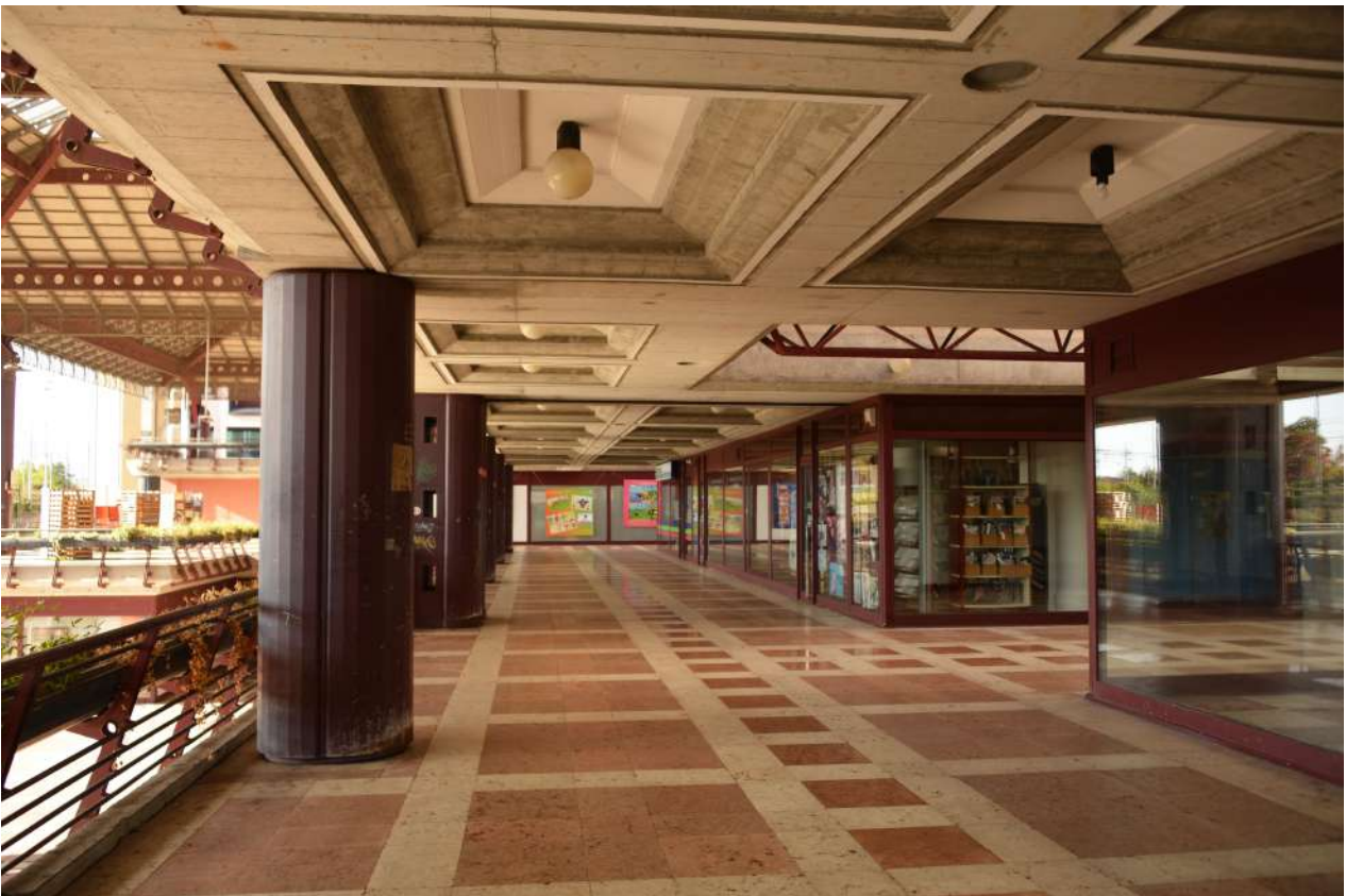
Foto n. 10 Shopping Center galleria interna piano terra