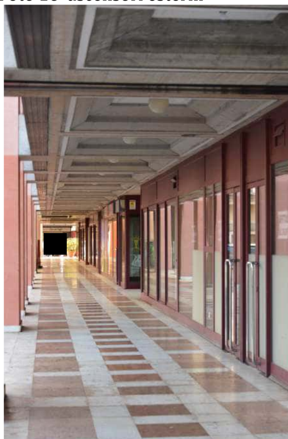
Foto 18 Galleria livello Via Colombo