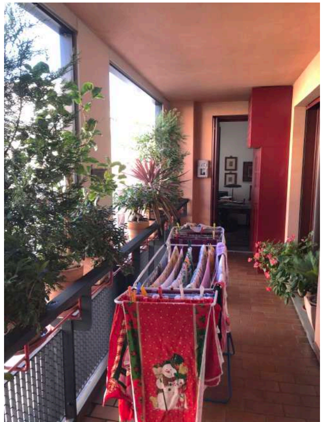
Foto n. 26- 27 Loggia