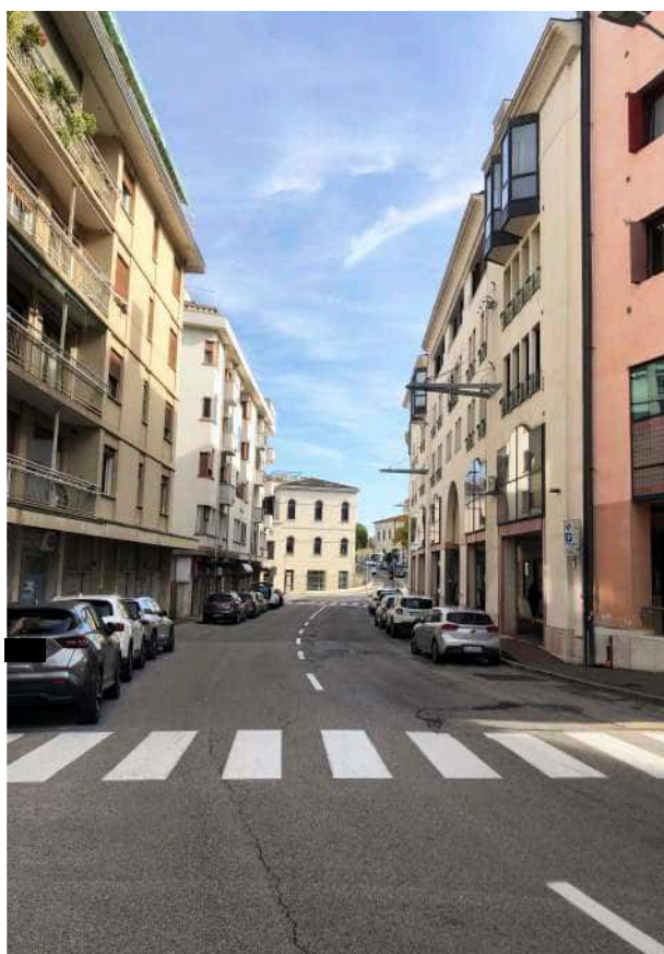
Foto n. 4 Via Cristoforo Colombo