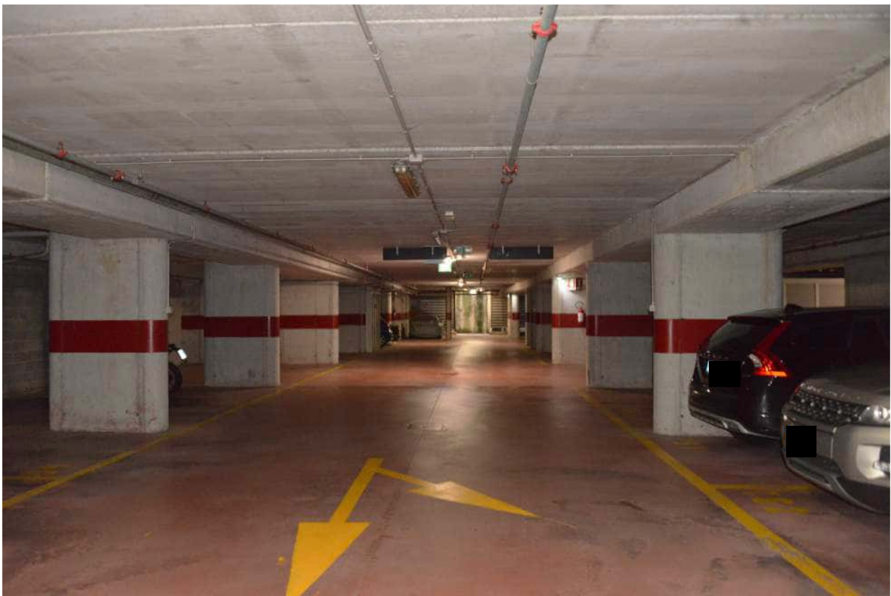
Foto n. 38 corsia di manovra garage interrato terzo piano sottostrada