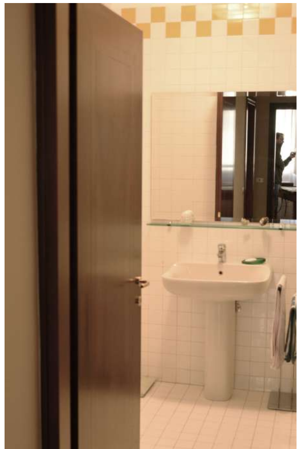
Foto n. 34 bagno