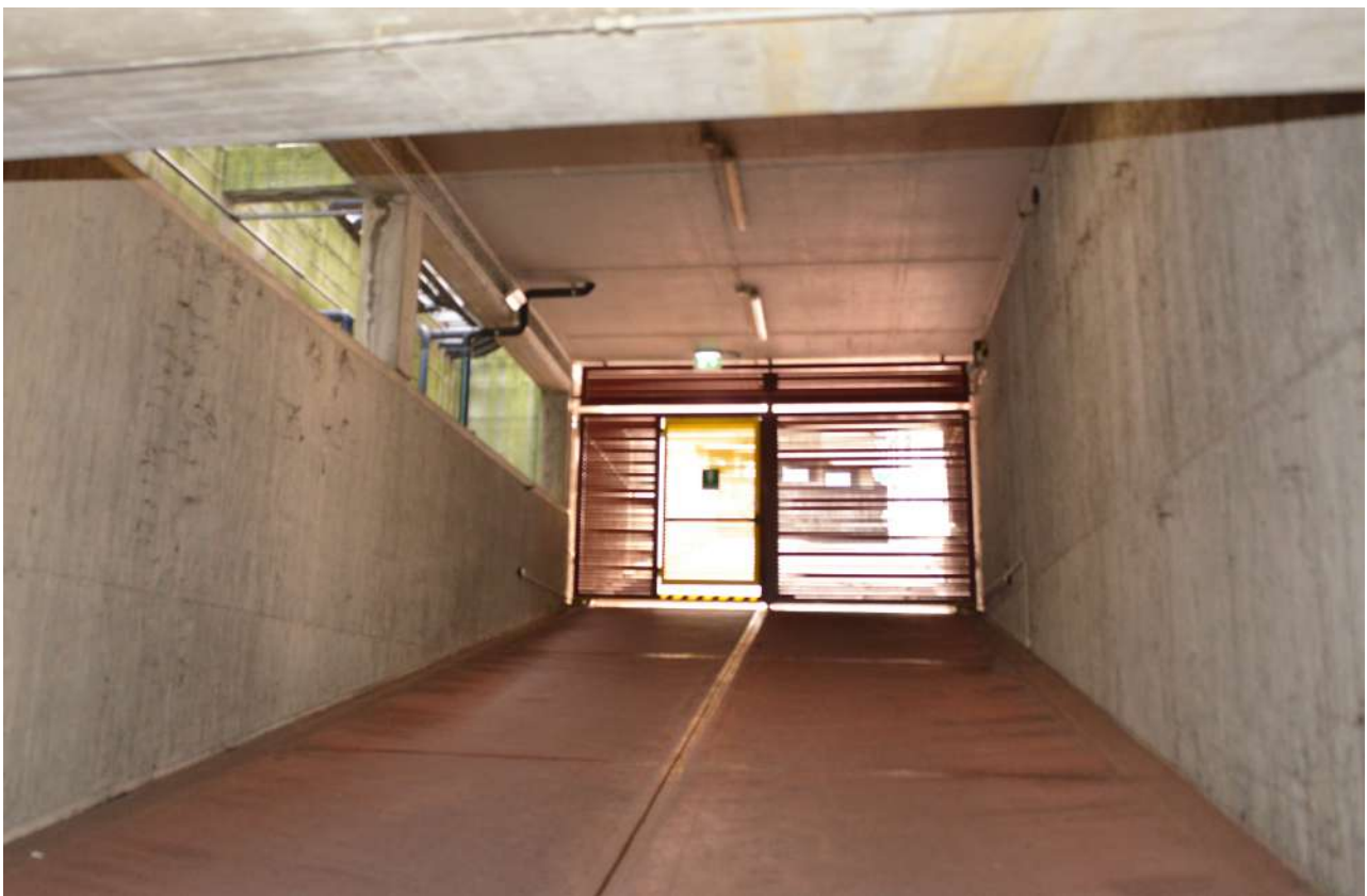
Foto n. 36 rampa di accesso piani sottostrada e garage