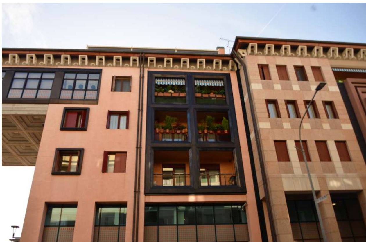
Foto n. 6 part. elementi costruttivi “Shopping Center” – fronte sub 115 3° piano