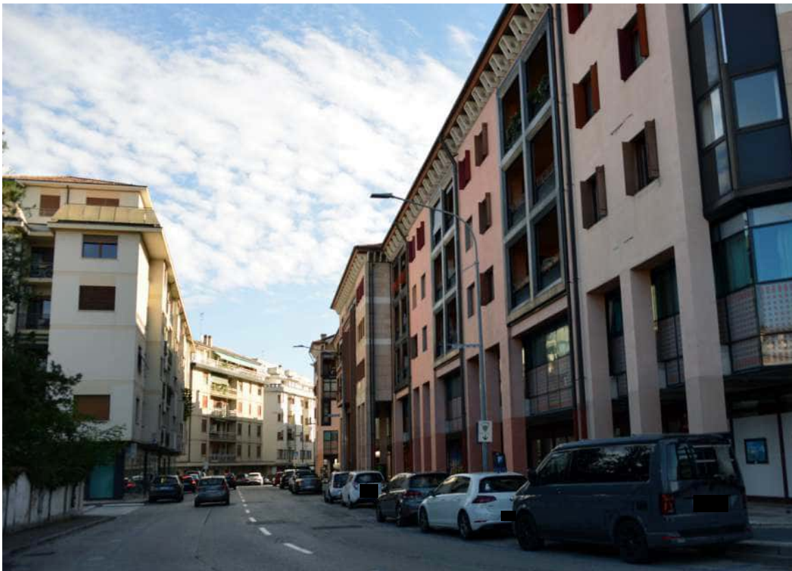
Foto n. 2 Via Cristoforo Colombo