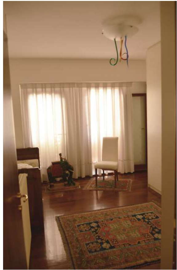
Foto n. 32 camera