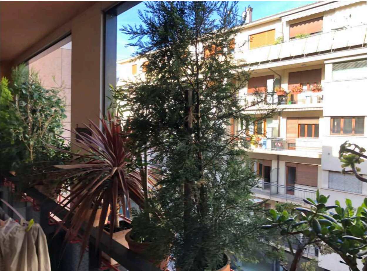
Foto n. 25 Loggia