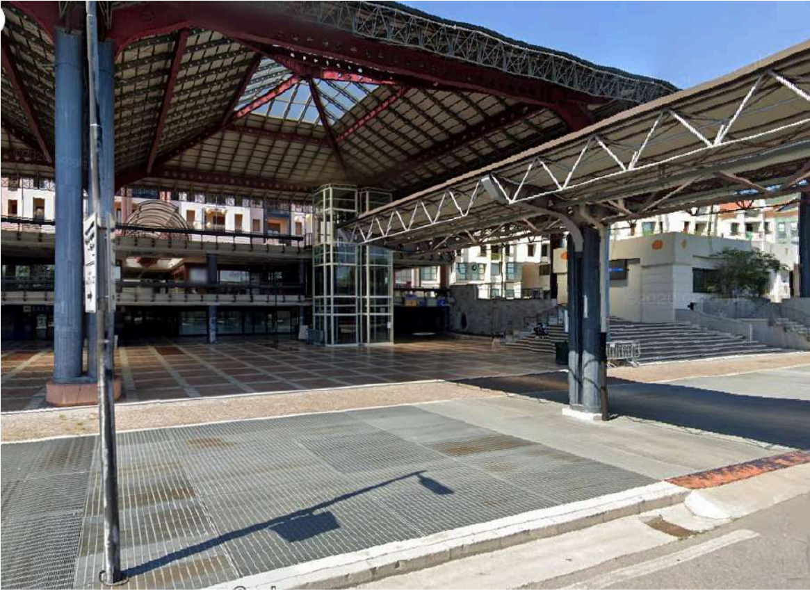
Foto n. 13 Shopping Center