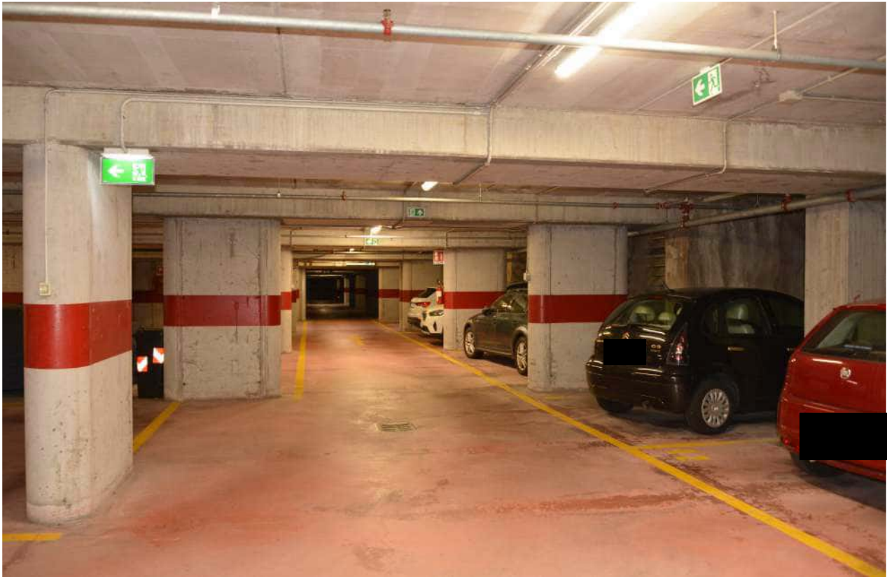
Foto n. 37 corsia di manovra garage interrato terzo piano sottostrada