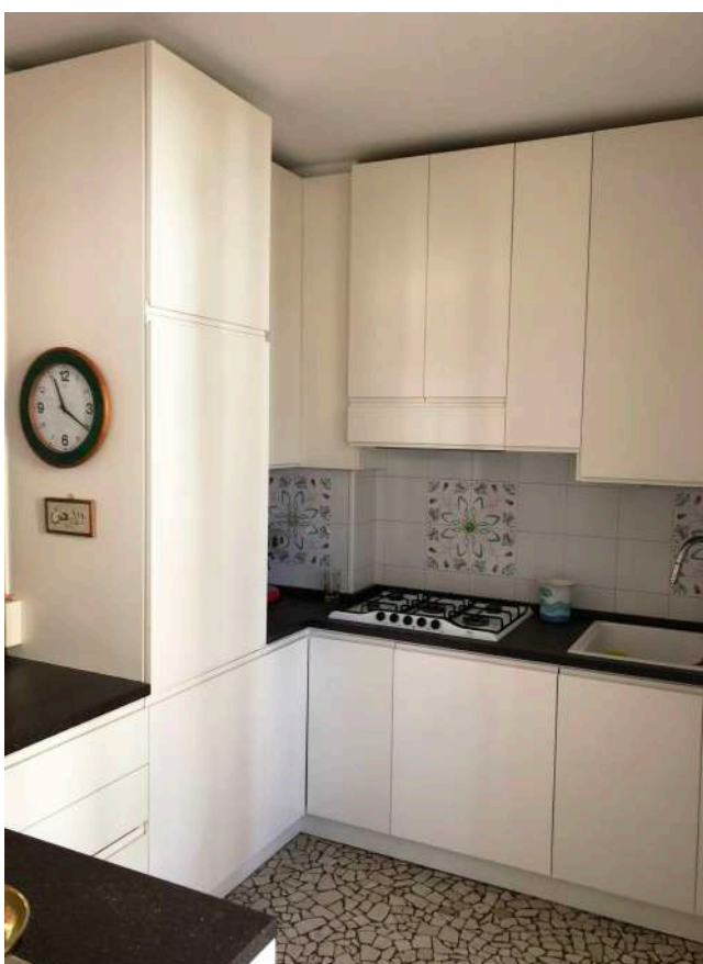
Foto n. 29 angolo cottura