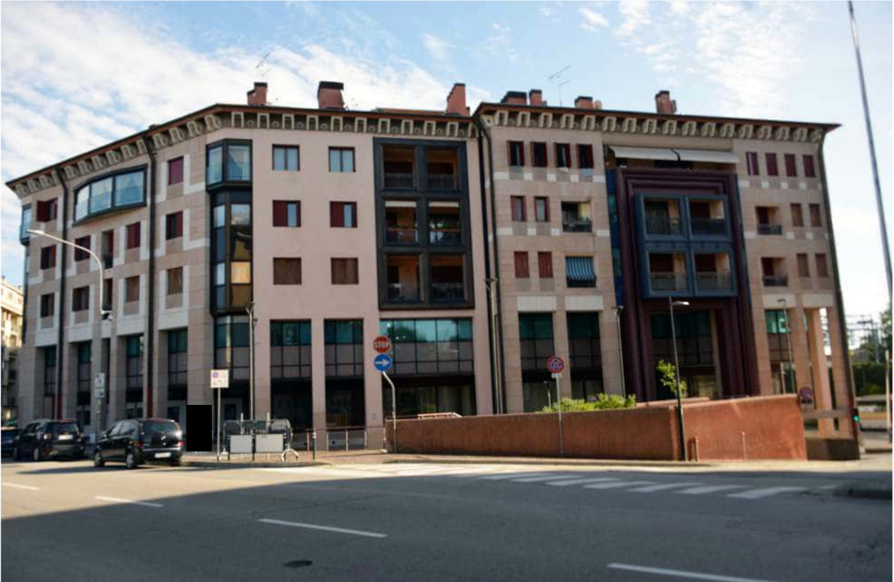
Foto n. 9 Shopping Center