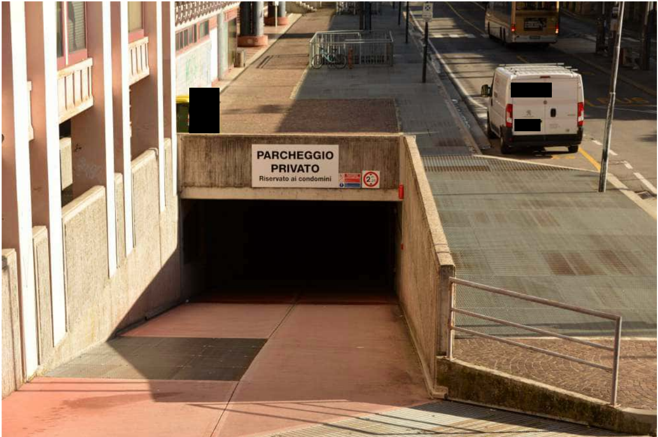
Foto n. 35 rampa di accesso piani sottostrada e garage