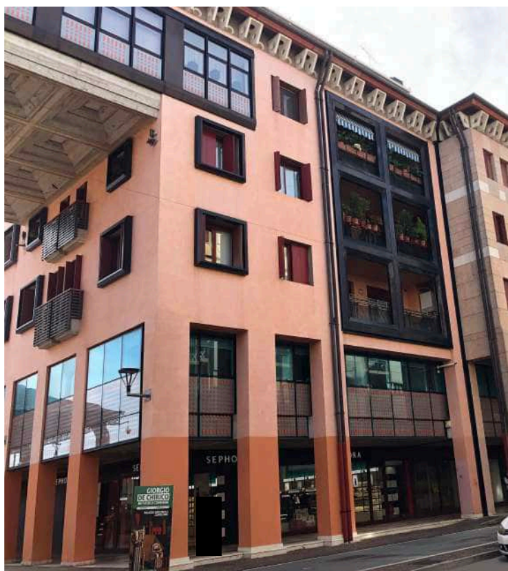
Foto n. 7 Shopping Center angolo Arco