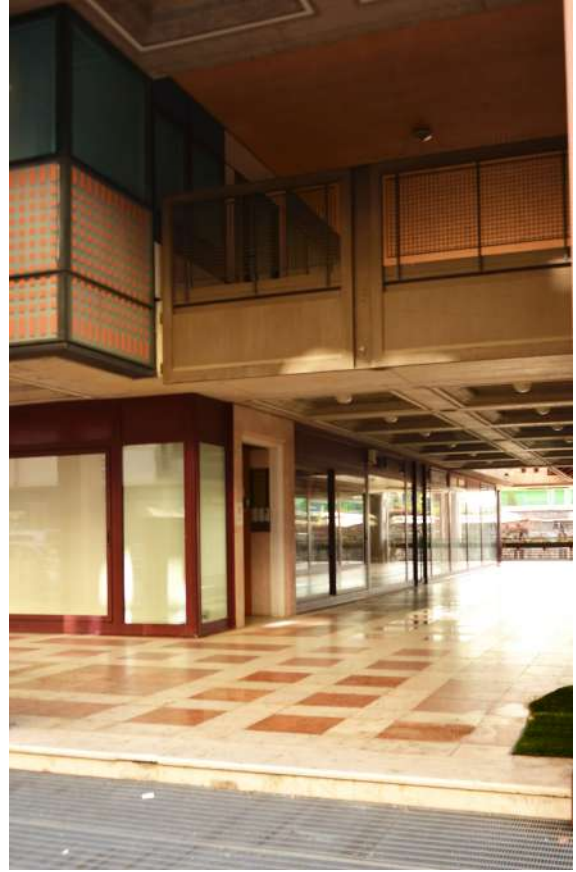
Foto n. 19-20 Shopping Center galleria interna ingresso n. 84