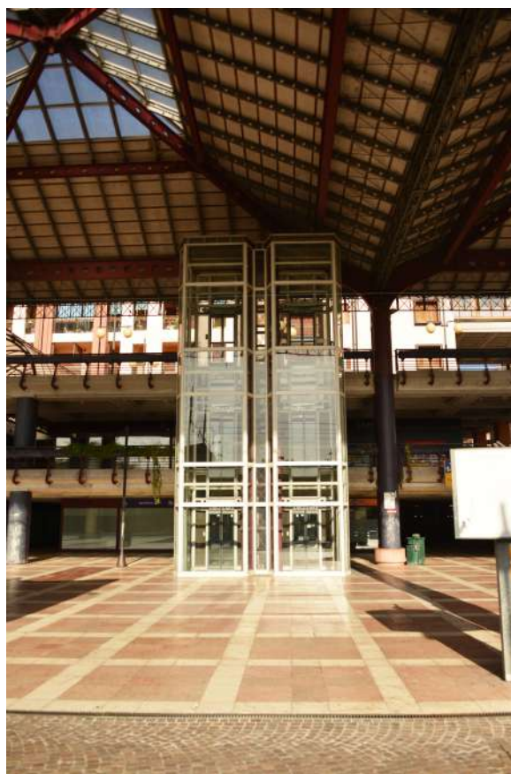
Foto 16 ascensori esterni