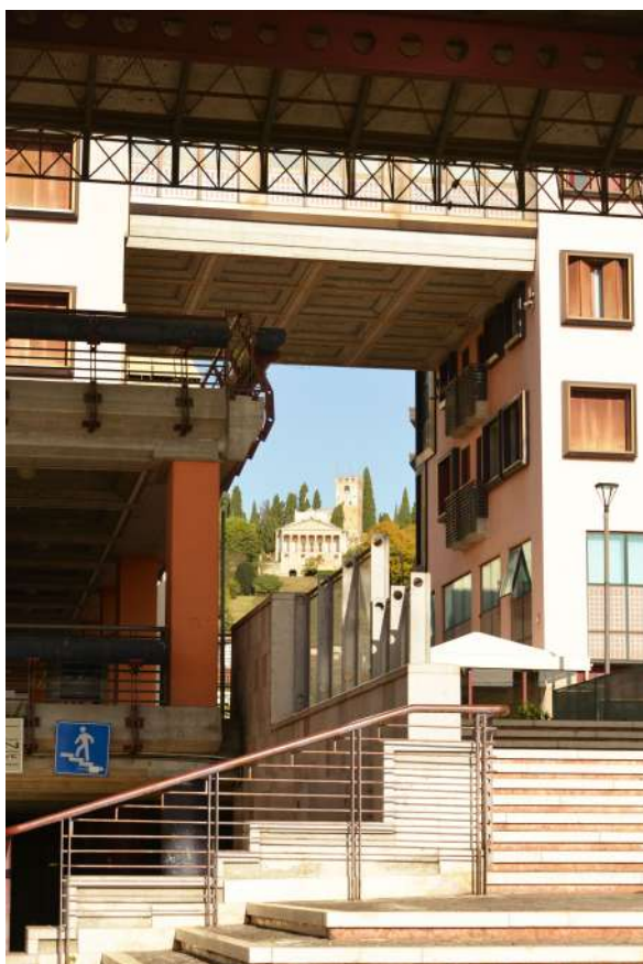
Foto 15 part. scalinata