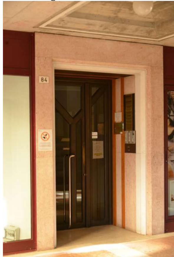
Foto n. 21- 22 Shopping Center – galleria piano terra ingresso n. 84