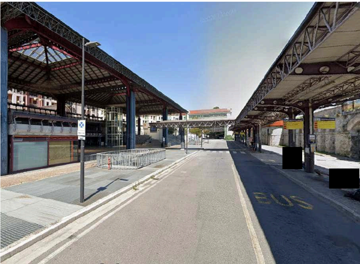
Foto n. 14 Shopping Center autostazione