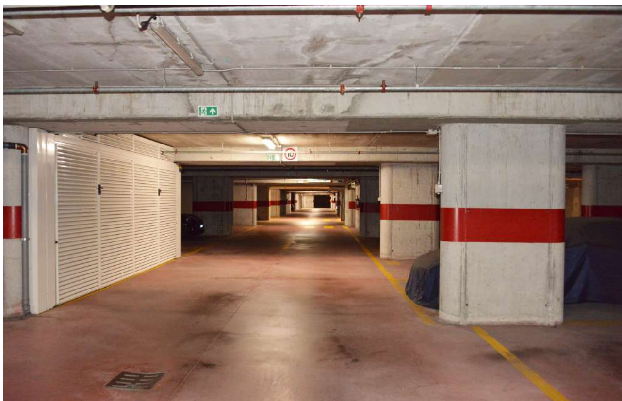
Foto n. 39 corsia di manovra garage interrato terzo piano sottostrada