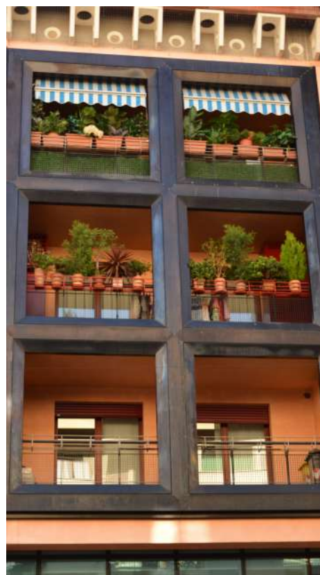
Foto n. 8 dettaglio terrazze