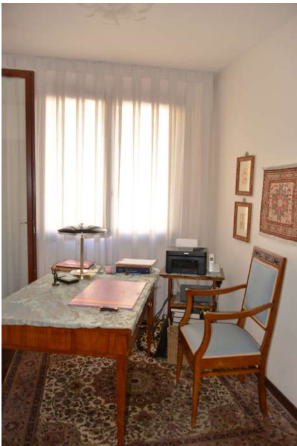
Foto n. 33 camera