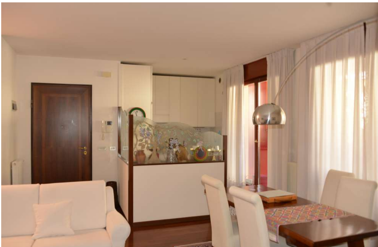
Foto n. 28 soggiorno-pranzo