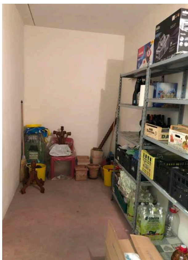
Foto n. 43 cantina sub 403