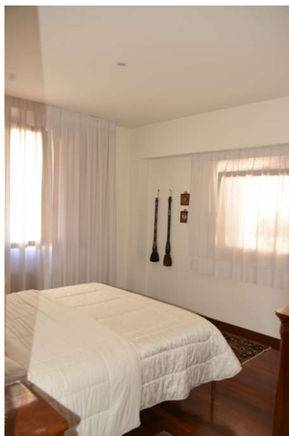
Foto n. 30 camera matrimoniale