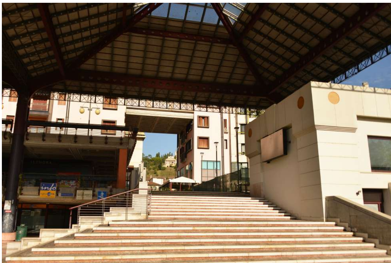
Foto n. 12 Shopping Center particolare Scalinata lato sud