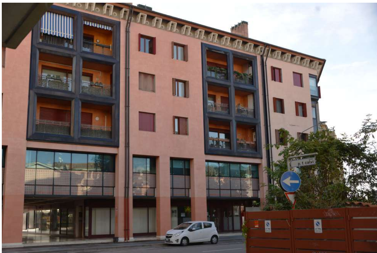
Foto n. 3 Via Cristoforo Colombo – particolare fronte Nord “Shopping Center”