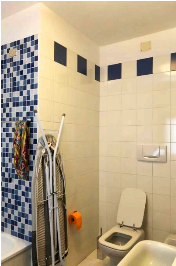
Foto n. 31 bagno