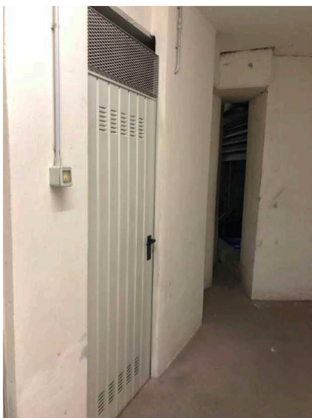
Foto n. 42 corridoio e ingr.cantina sub 403