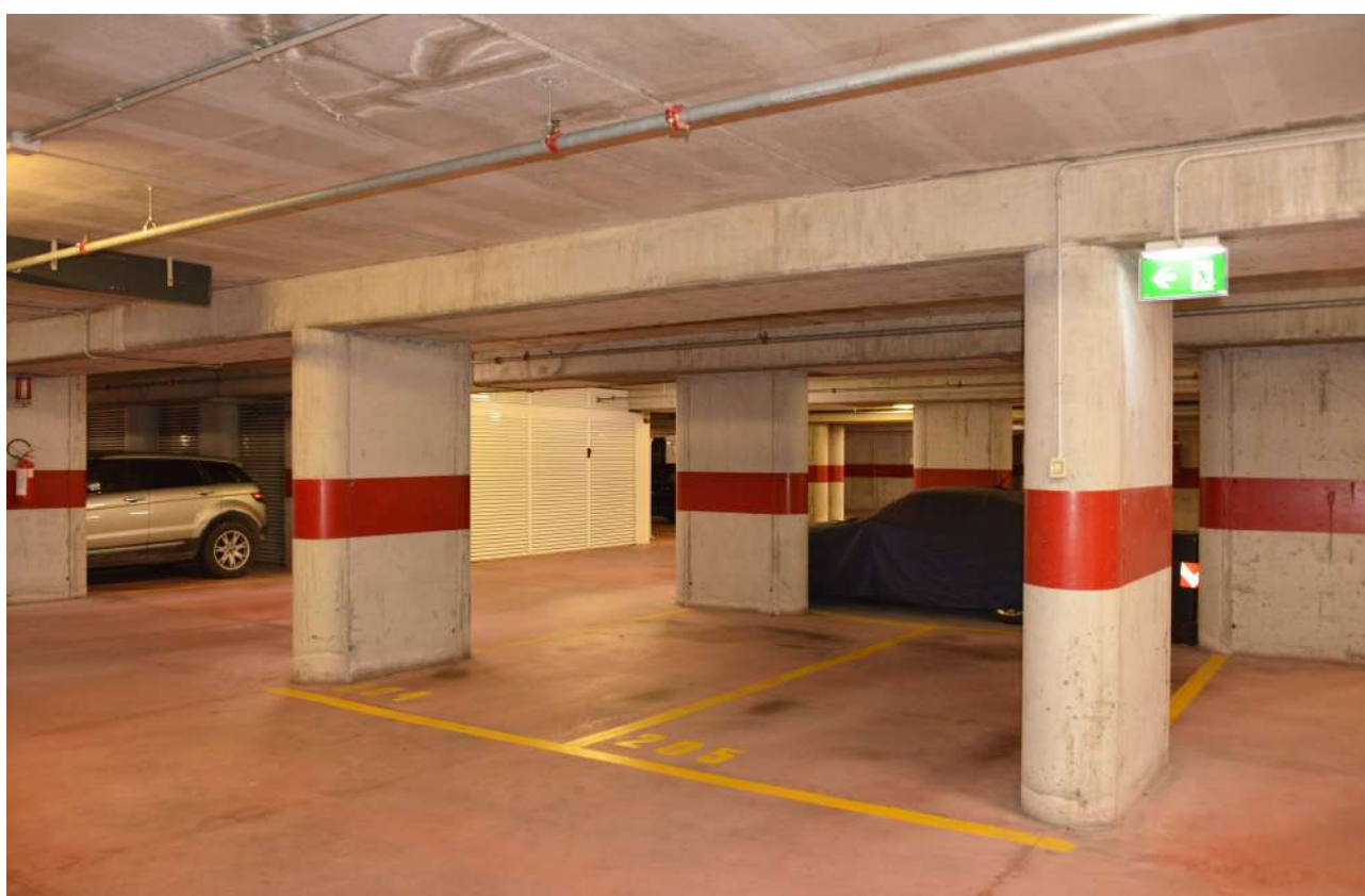
Foto n. 40 posti auto sub 171 e sub 193