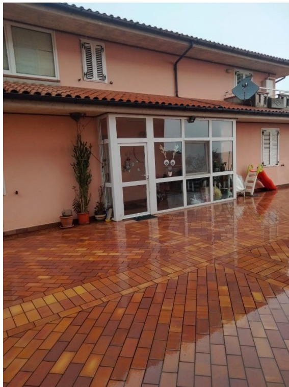
Foto n.16 – vista esterno fabbricato e parte di lastrico (struttura in metallo e vetro realizzata senza autorizzazione)