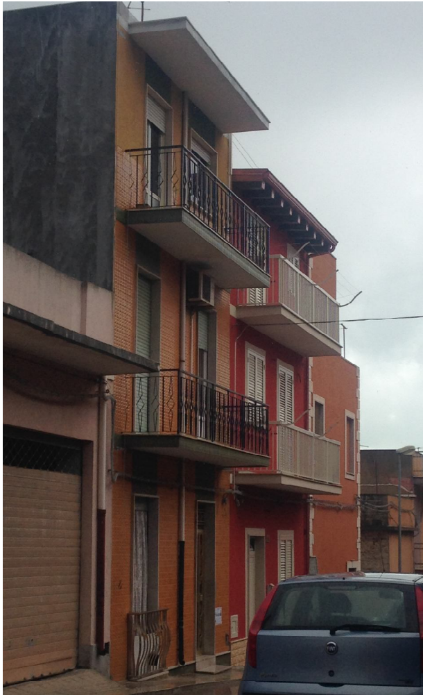
Foto 01: Vista prospetto Ovest prospiciente su Via Municipio n. 139, da dove avviene l'accesso all'abitazione posta a piano terra.