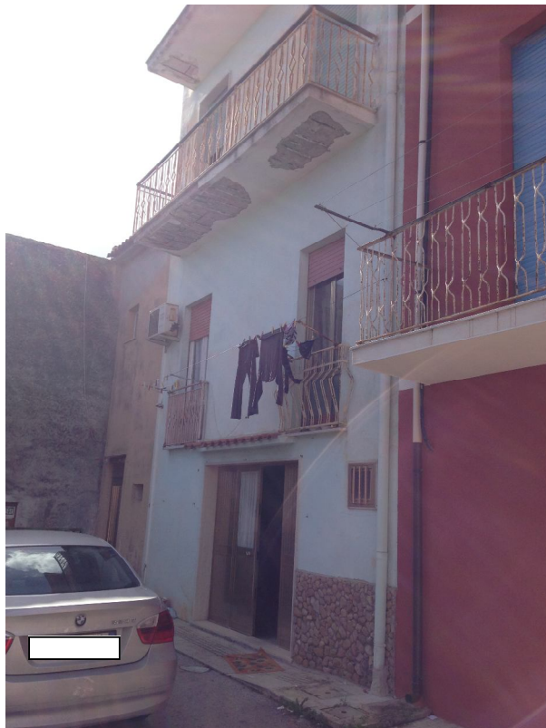
Foto 02: Vista prospetto Est prospiciente su Cortile di Via Vesuvio.