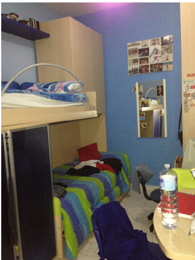
Foto 05: Vista camera singola da adibire a ripostiglio, poiché non gode di illuminazione e aereazione diretta, posta a piano primo