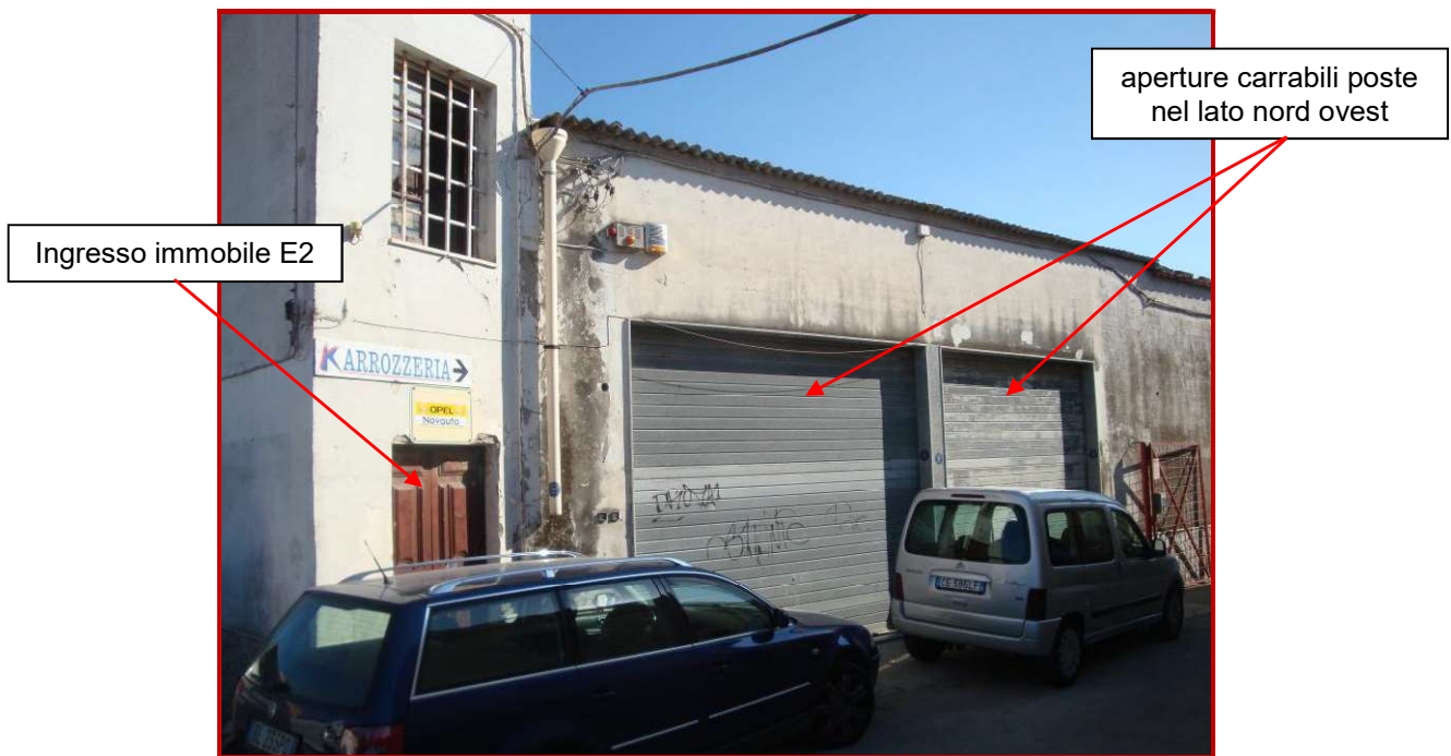
FOTO 2 - Prospetto nord ovest

Ermocrate, nella parte iniziale del tratto a nord ovest del capannone, si trovano due aperture carrabili di altezza m 3,30 e larghezza rispettivamente 3,90 m e 3,30.