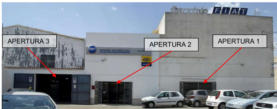
FOTO 1 - Prospetto nord est

A nord ovest e a sud ovest il capannone confina con una stradella e, procedendo da Viale