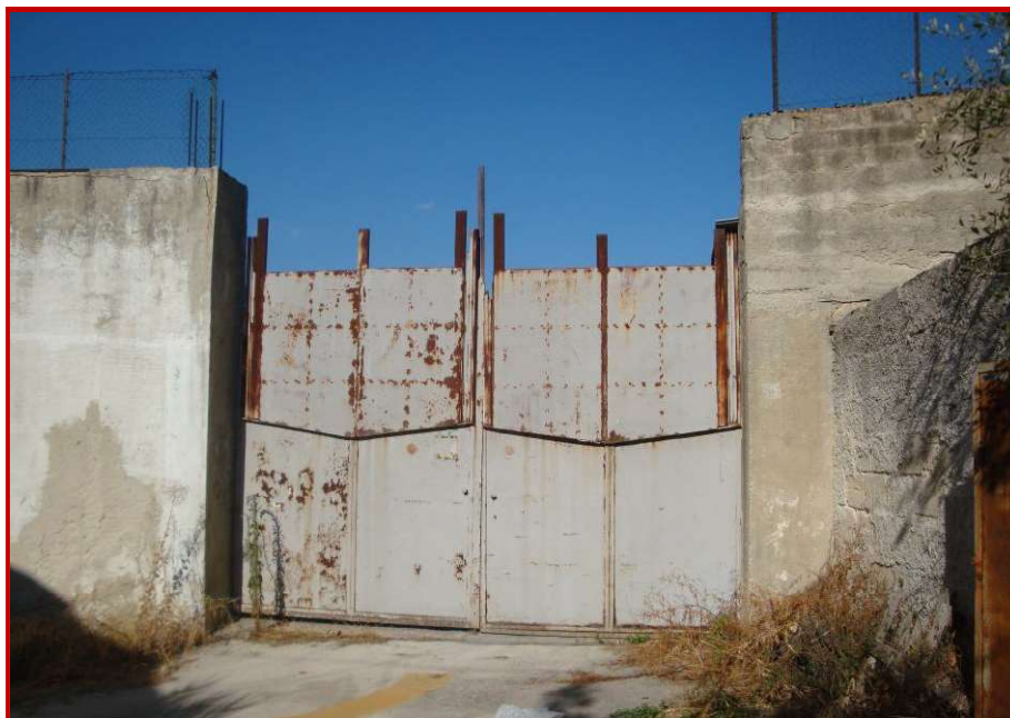
FOTO 3 - Prospetto sud ovest- apertura carrabile

Nel tratto di stradella posto a sud ovest si trova un'apertura carrabile di larghezza m 4.95 e altezza m 3,50.