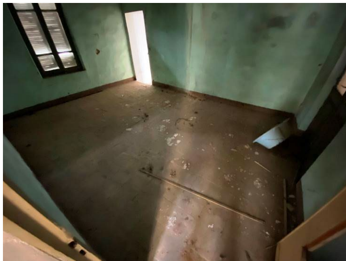
Immagine 22 – vista camera 2