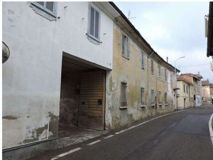
Immagine 04 – vista ingresso androne dalla Via Dottor Magnani