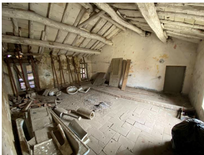
Immagine 25 – locale accessorio - ripostiglio