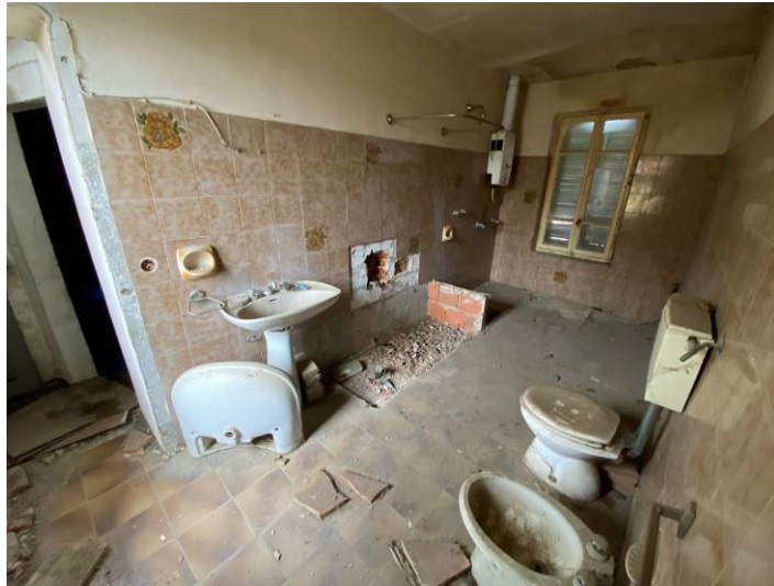
Immagine 20 – vista del bagno