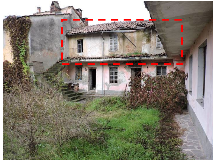
Immagine 06 – vista del prospetto Sud dal cortile comune