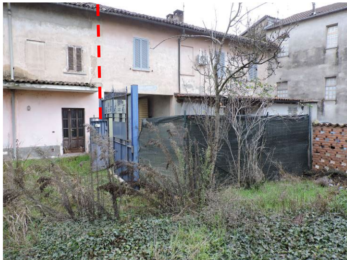
Immagine 09 – vista porzione prospetto Ovest dal cortile comune