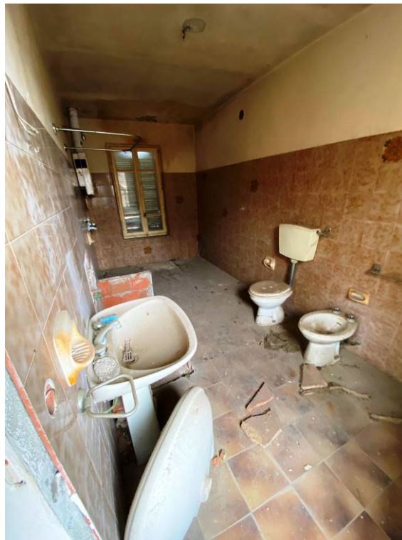
Immagine 19 – vista del bagno