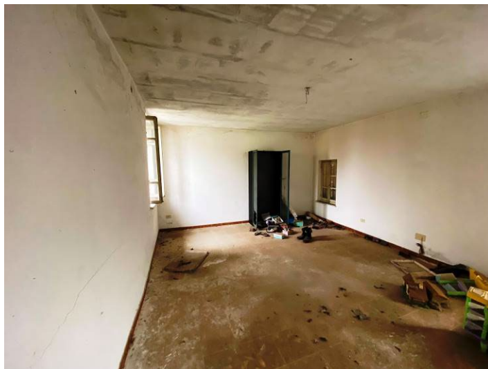
Immagine 23 – vista camera 3