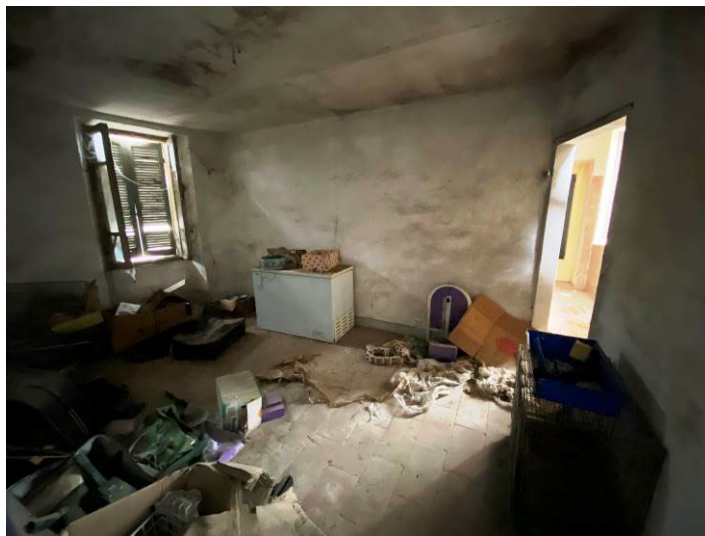
Immagine 17 – vista locale guardaroba