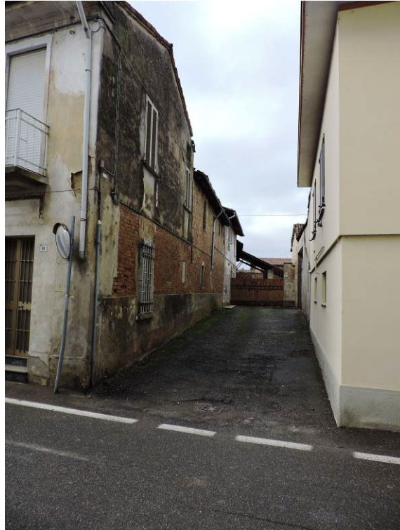
Immagine 03 – vista dalla Via Dottor Magnani (prospetto Nord)