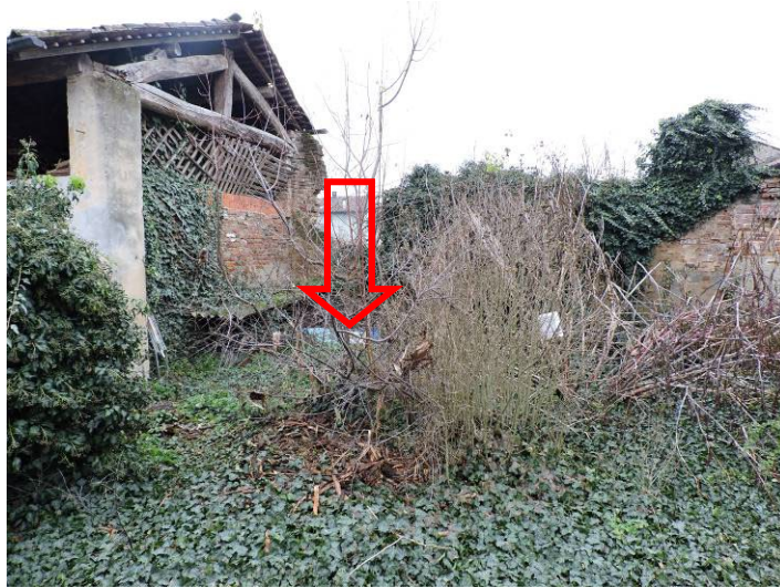
Immagine 11 – vista dal cortile comune (posizione area di pertinenza esclusiva)