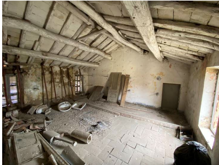
Immagine 26 – locale accessorio - ripostiglio