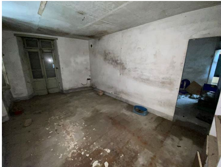
Immagine 16 – camera 1