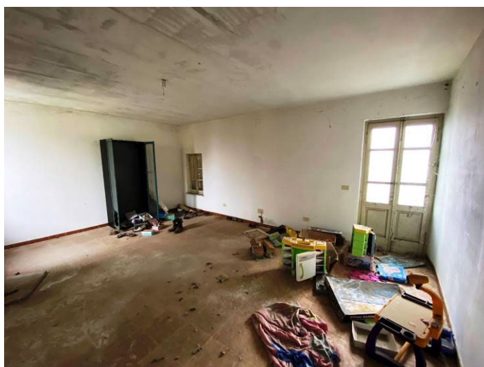
Immagine 24 – vista camera 3