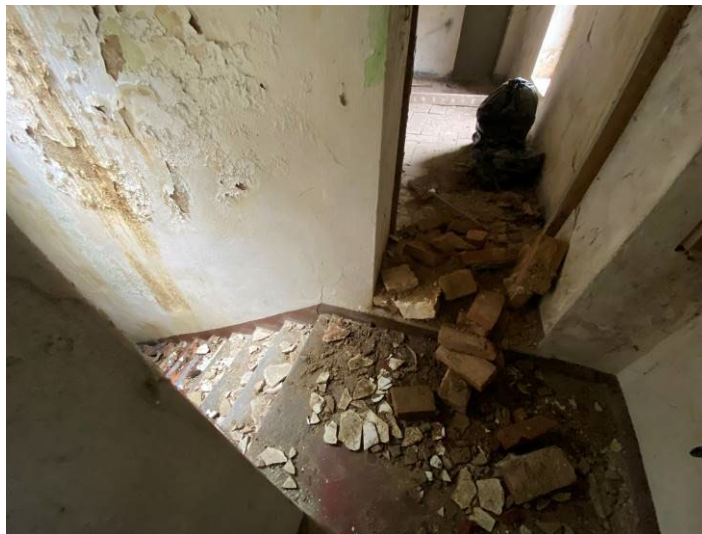
Immagine 13 – vista scala interna dal piano primo (collegamento P.T. – P.1°)