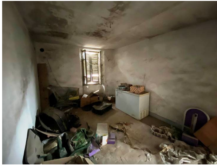
Immagine 18 – vista locale guardaroba