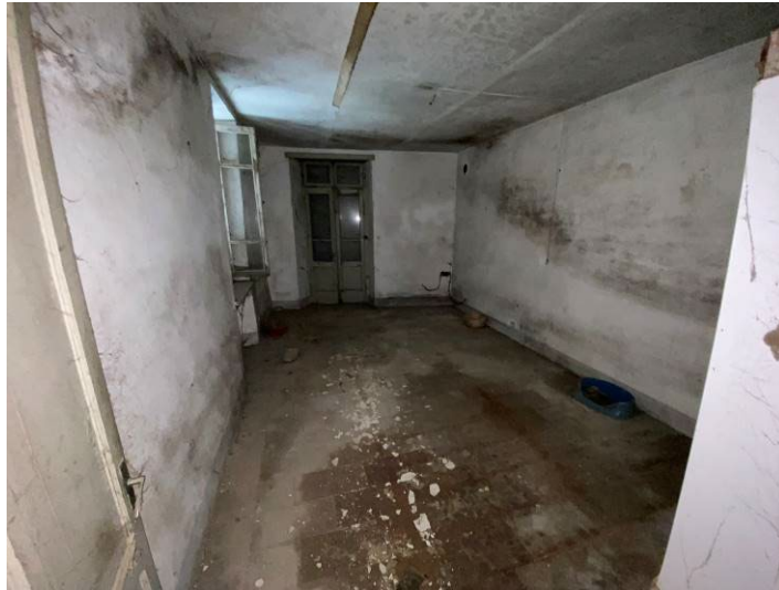
Immagine 15 – camera 1