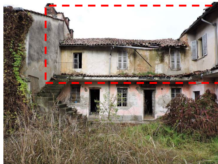
Immagine 07 – vista del prospetto Sud dal cortile comune