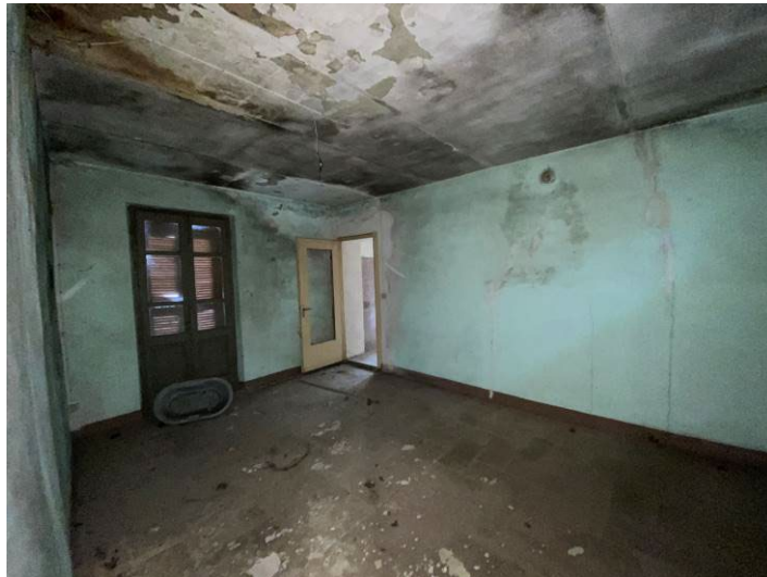
Immagine 21 – vista camera 2