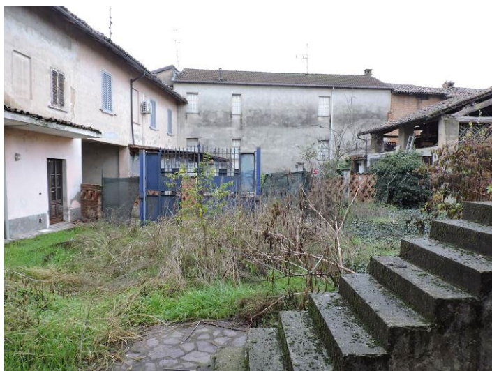
Immagine 10 – vista porzione cortile comune