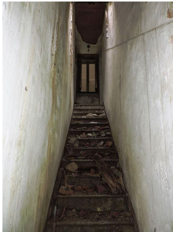
Immagine 12 – vista della scala interna con accesso da proprietà di terzi (collegamento P.T. – P.1°)