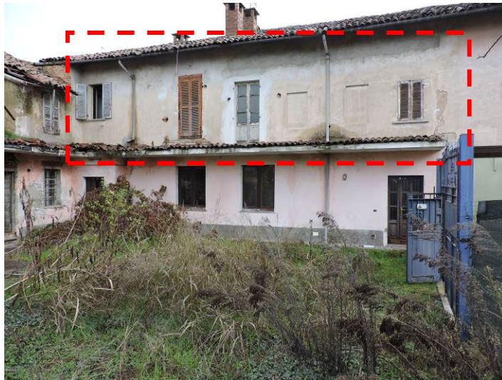
Immagine 08 – vista del prospetto Ovest dal cortile comune