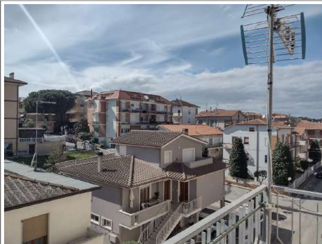
Vista panorama terzo piano