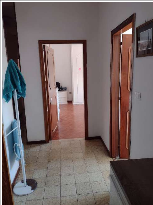
Interno corridoio notte