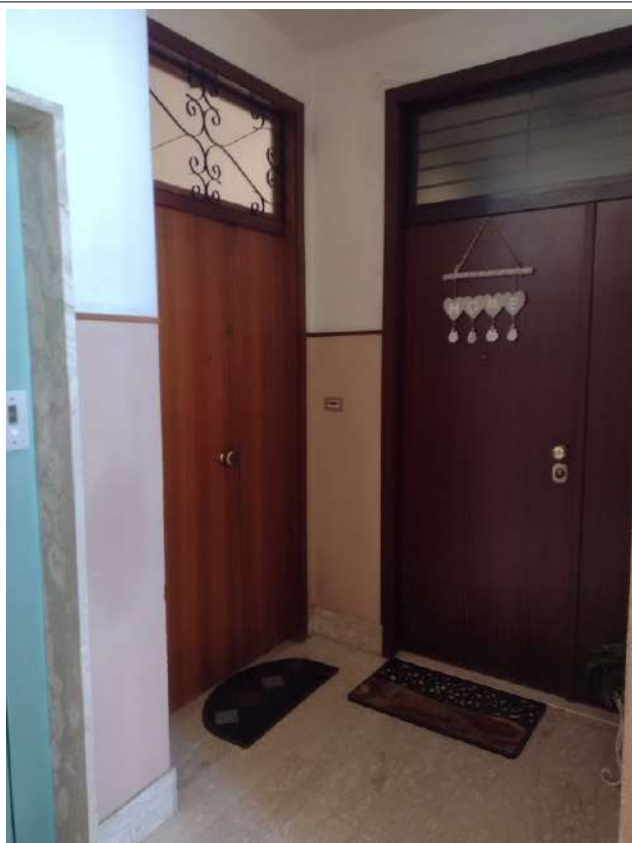
Pianerottolo terzo piano - Ingresso appartamento