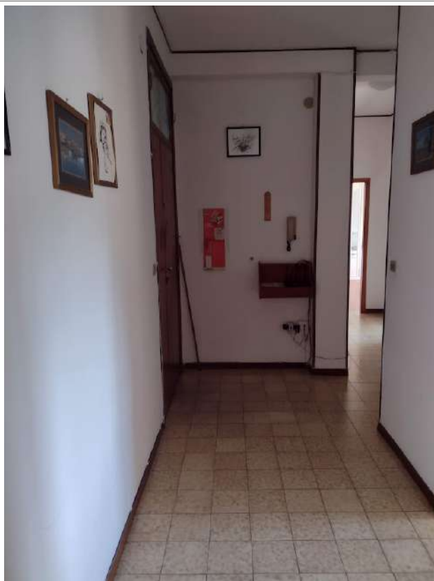
Interno corridoio giorno