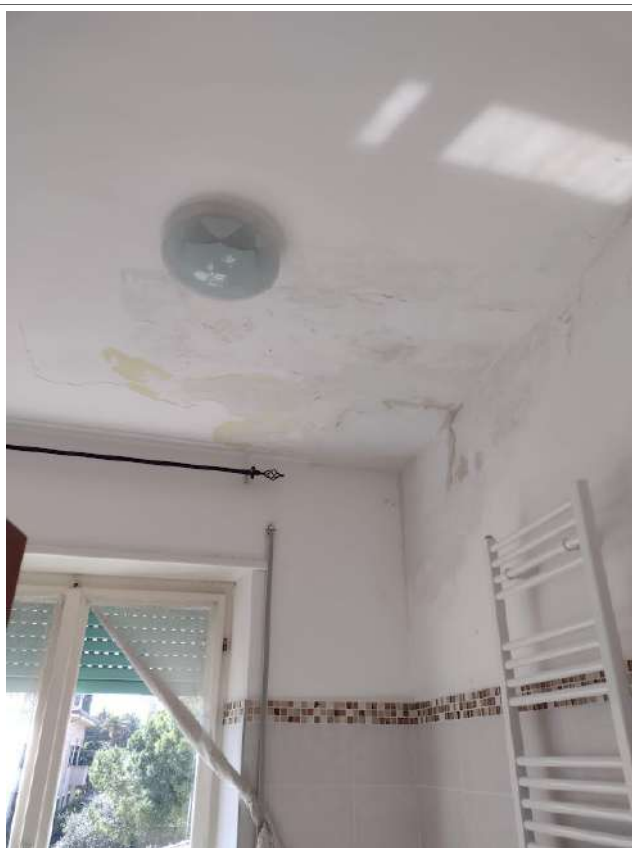
Part perdita acqua p4° bagno