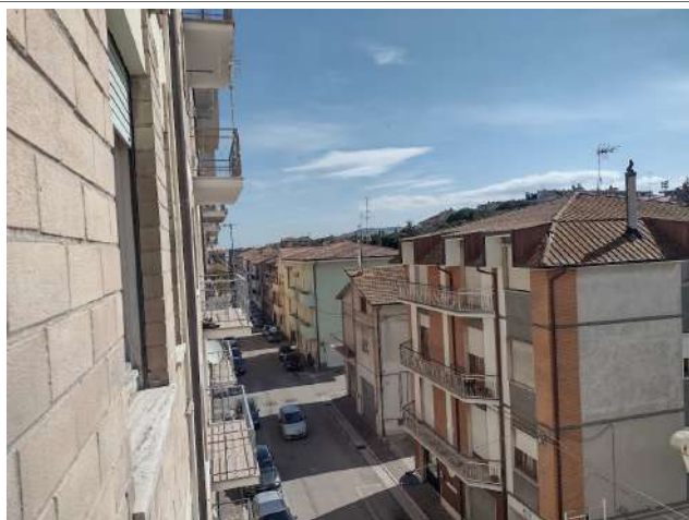
Vista panorama terzo piano