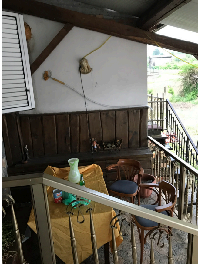
Unità piano primo - Terrazzino