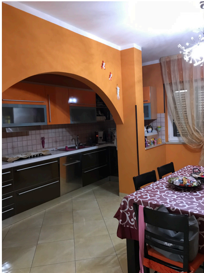
Unità piano terra - Cucina