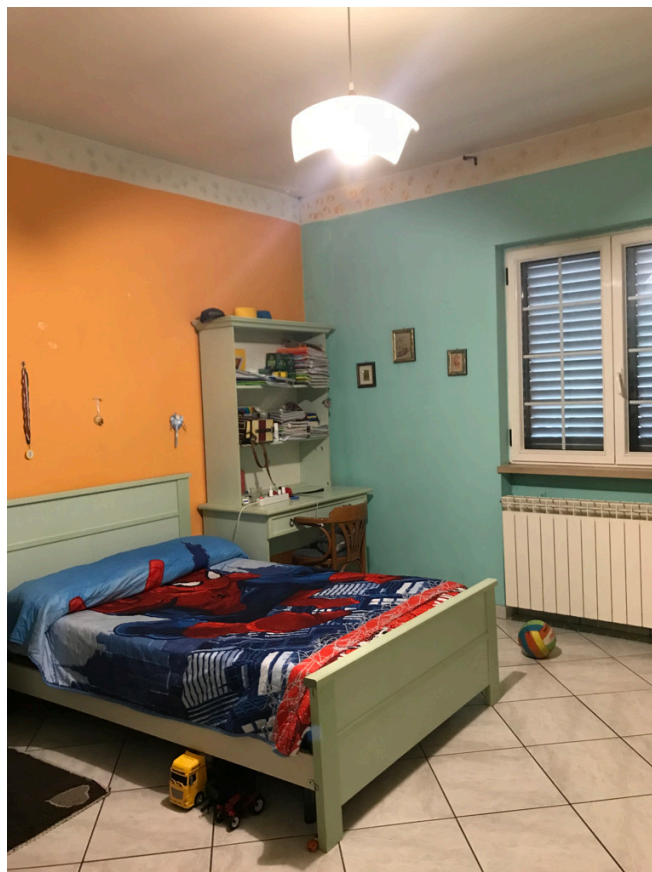
Unità piano primo - camera letto 2