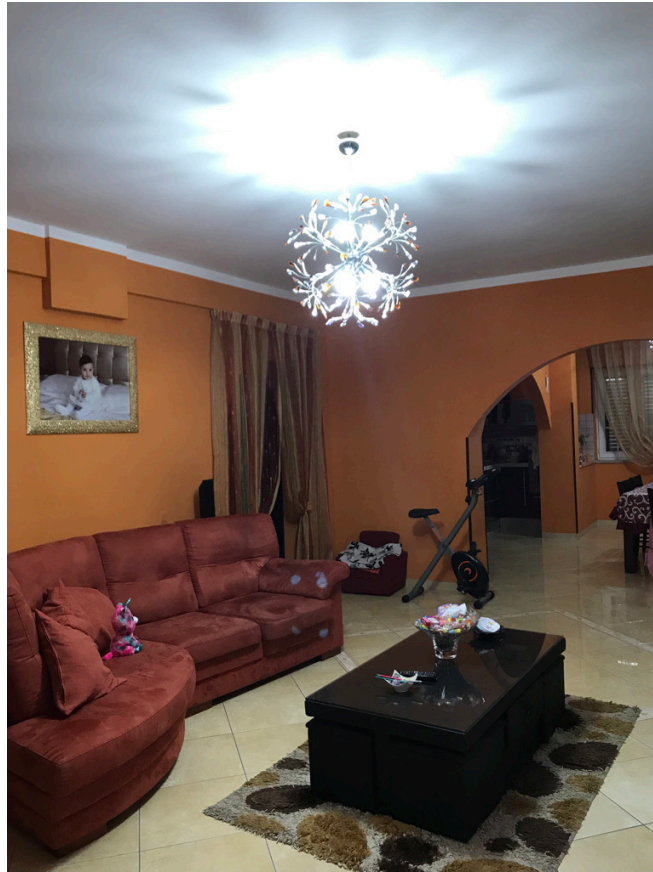
Unità piano terra - Soggiorno