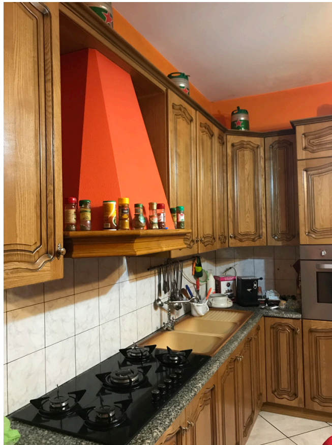
Unità piano primo - Cucina