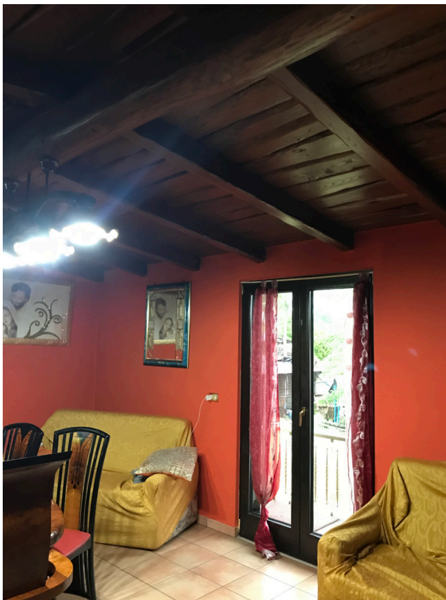
Unità piano primo - snr