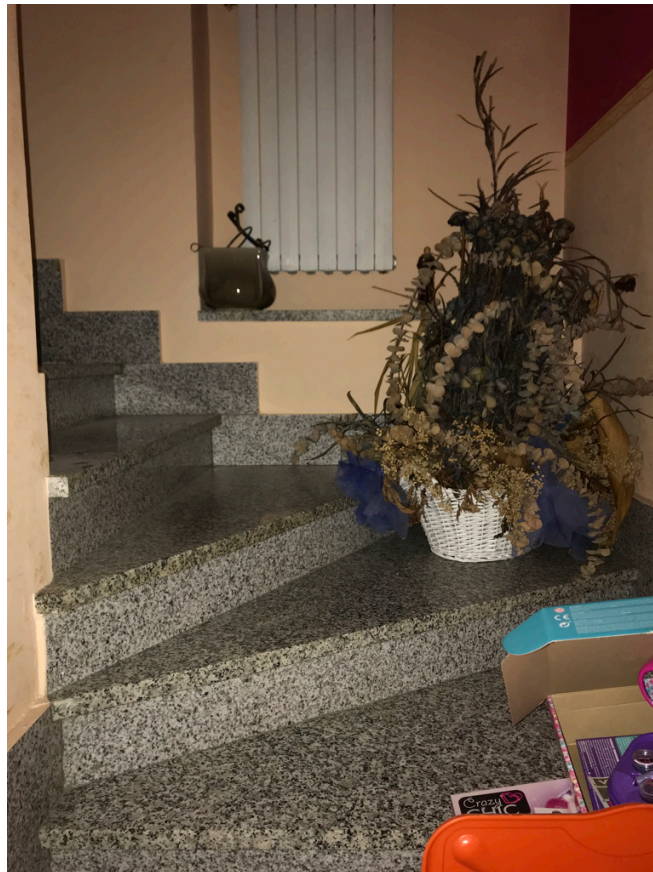
Scala di collegamento delle due unità