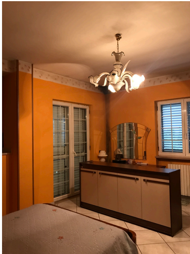
Unità piano primo - Camera letto 1