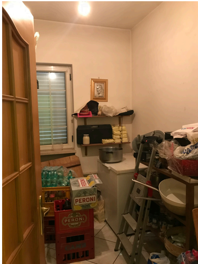
Unità piano primo - Camera