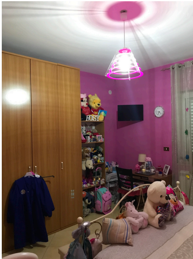
Unità piano terra - Camera letto 2