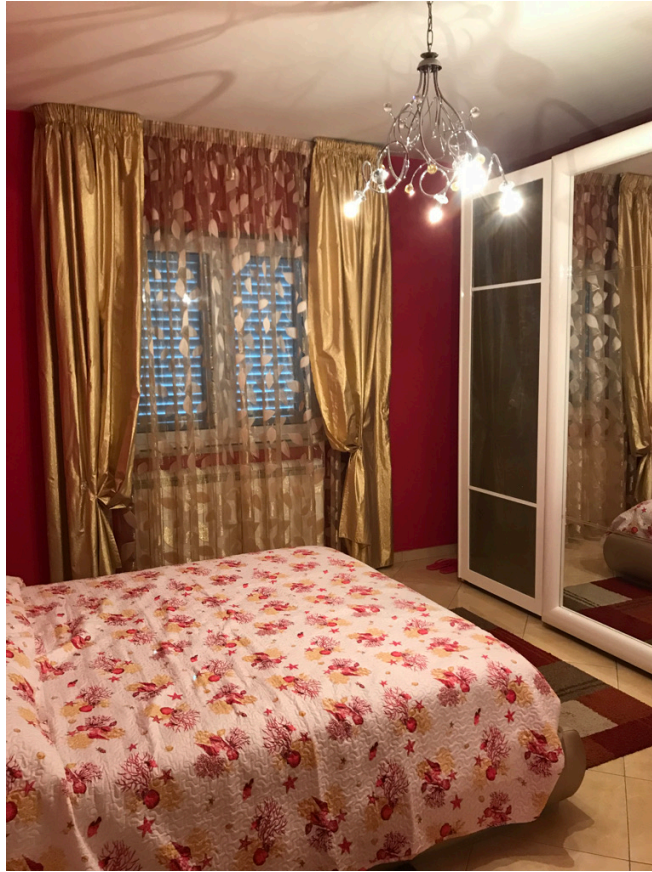
Unità piano terra - Camera letto 1