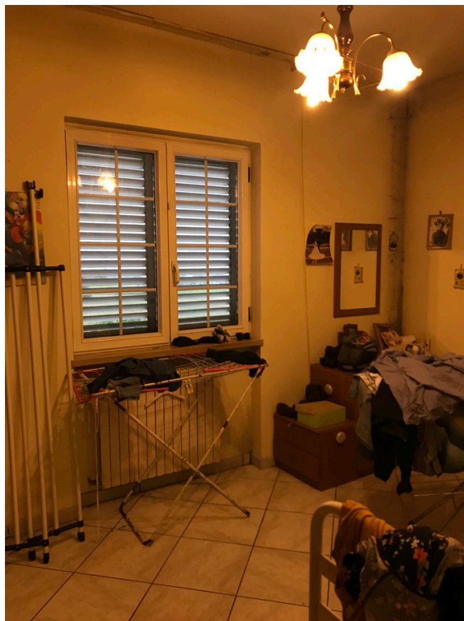
Unità piano primo - camera