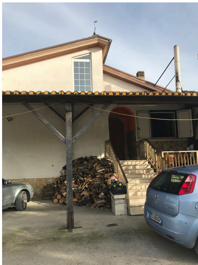
Accesso unità piano primo