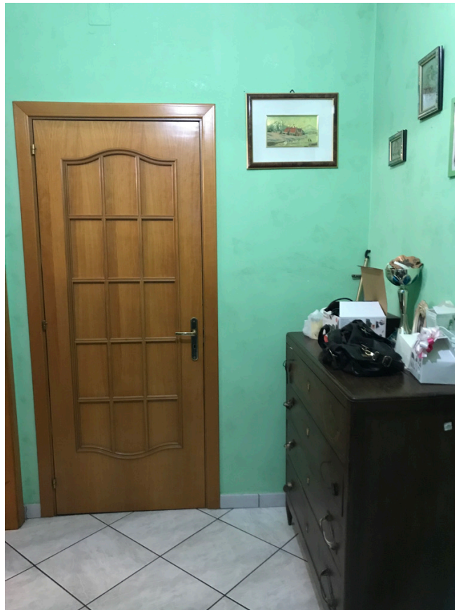
Unità piano primo - Disimpegno (accesso interno appartamento piano terra)