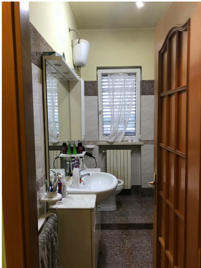
Unità piano primo - Bagno