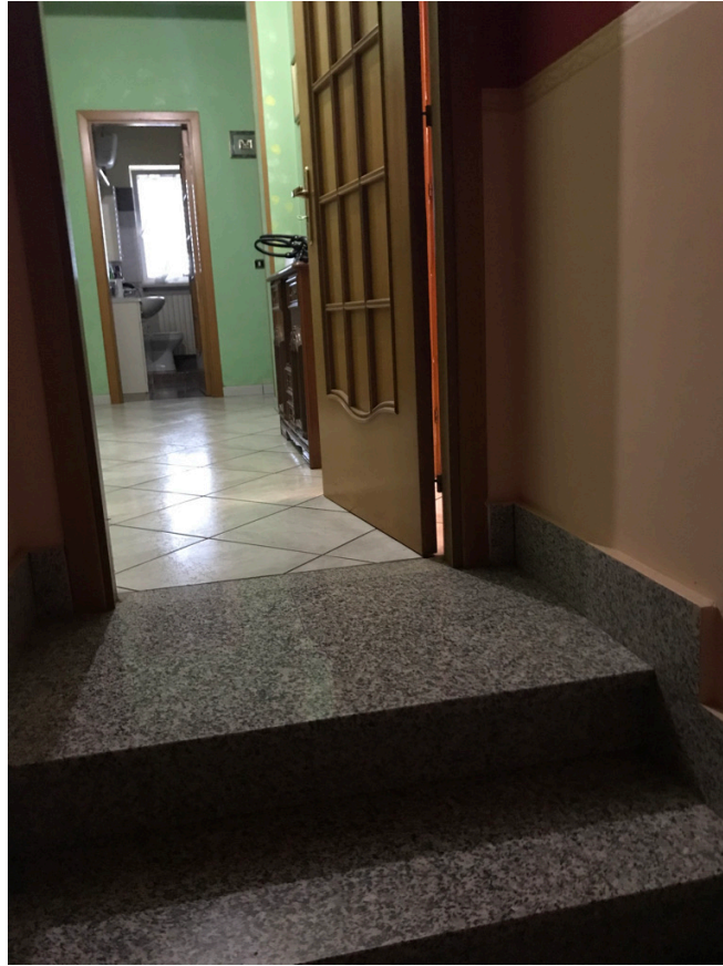
Scala di collegamento delle due unità