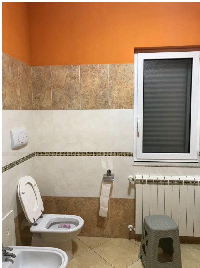
Unità piano terra - Bagno