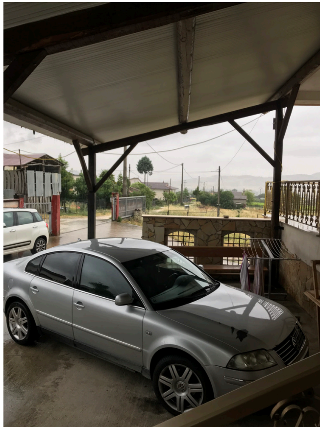
Tettoia prospetto principale