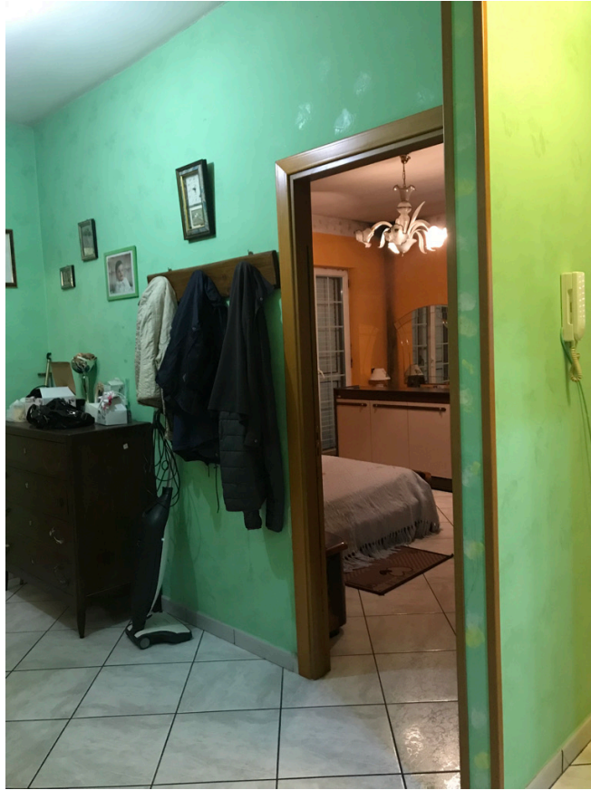
Unità piano primo - Disimpegno