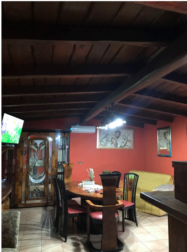
Unità piano primo - snr