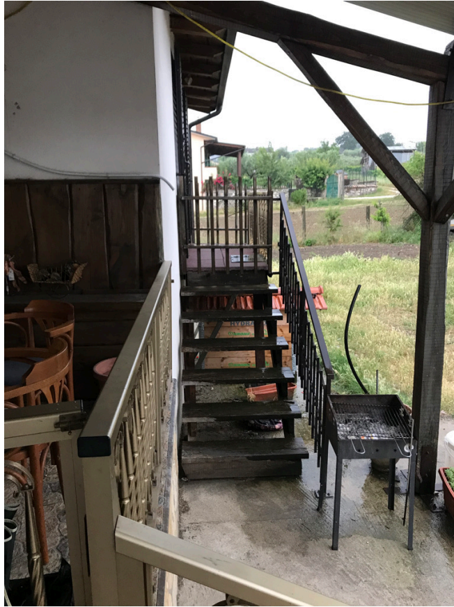
Unità piano primo - Scala accesso esterno snr