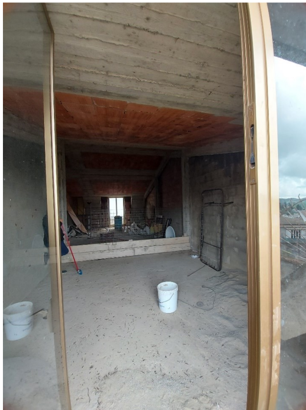
MAGAZZINO/LOCALE DI DEPOSITO