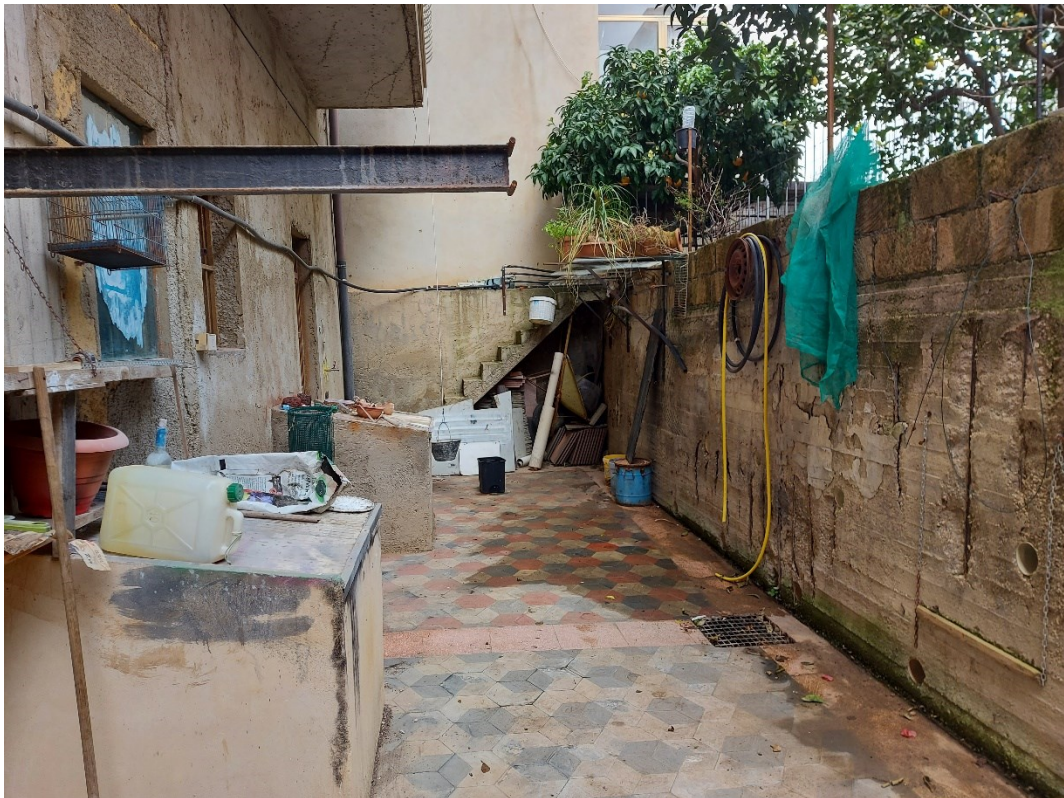
CORTILE RETRO GARAGE