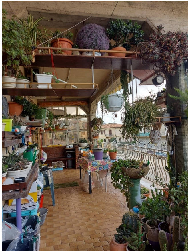
VERANDA LATO CUCINA