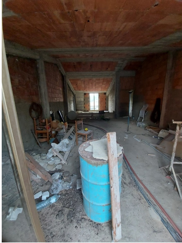
MAGAZZINO/LOCLE DI DEPOSITO