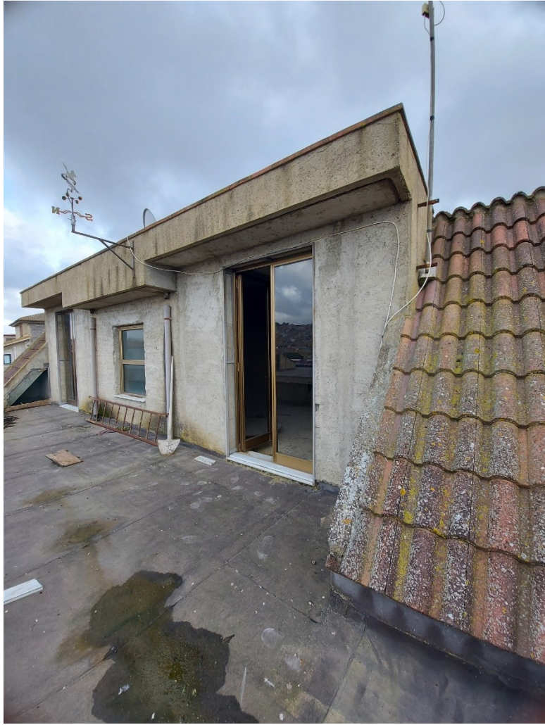
TERRAZZO MAGAZZINO/LOCALE DI DEPOSITO