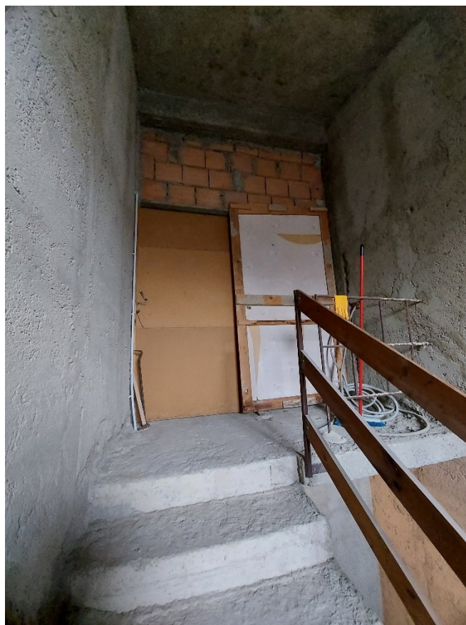
PORTA DI ACCESSO