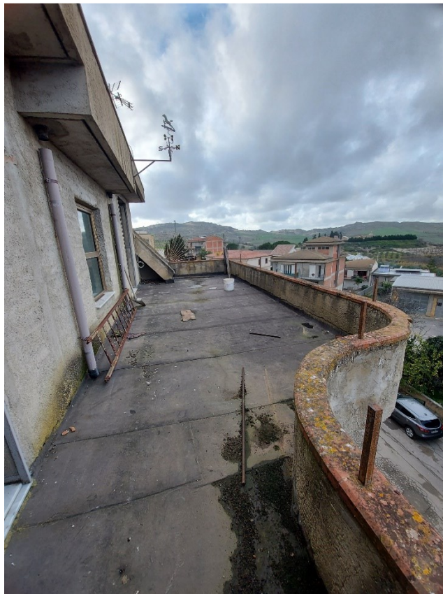
TERRAZZO MAGAZZINO/LOCALE DI DEPOSITO