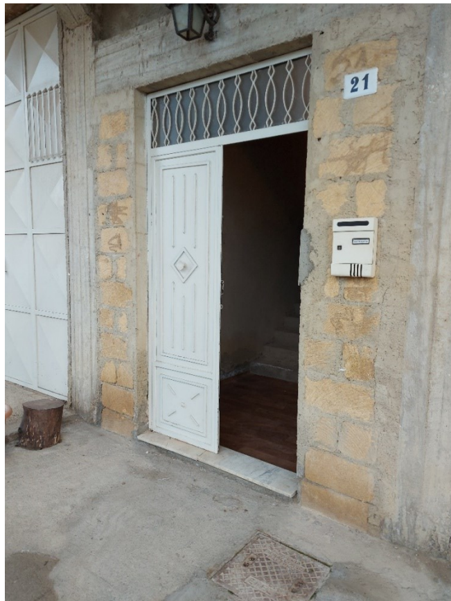
PORTA DI ACCESSO