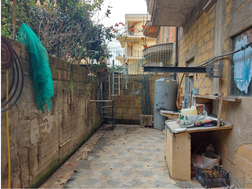
CORTILE RETRO GARAGE