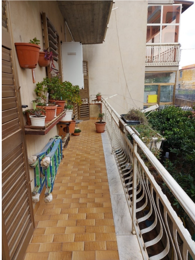
BALCONE LATO CAMERE