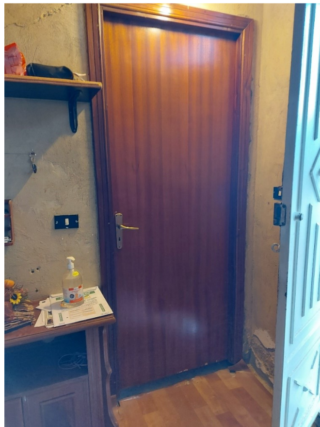
VANO PORTA CHE DAL GARAGE PORTA AI PIANI SUPERIORI