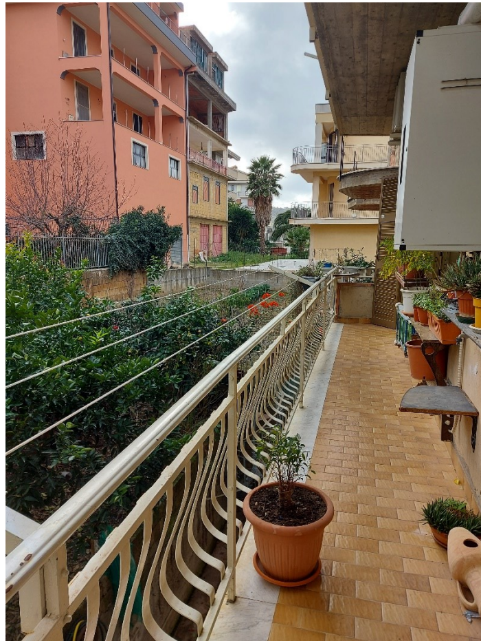
BALCONE LATO CAMERE