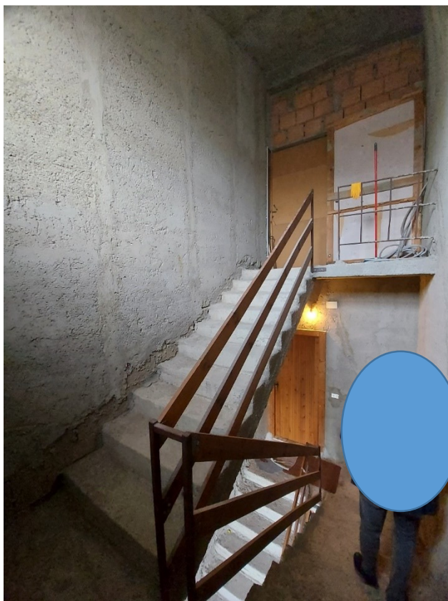
ACCESSO AL PIANO TERZO