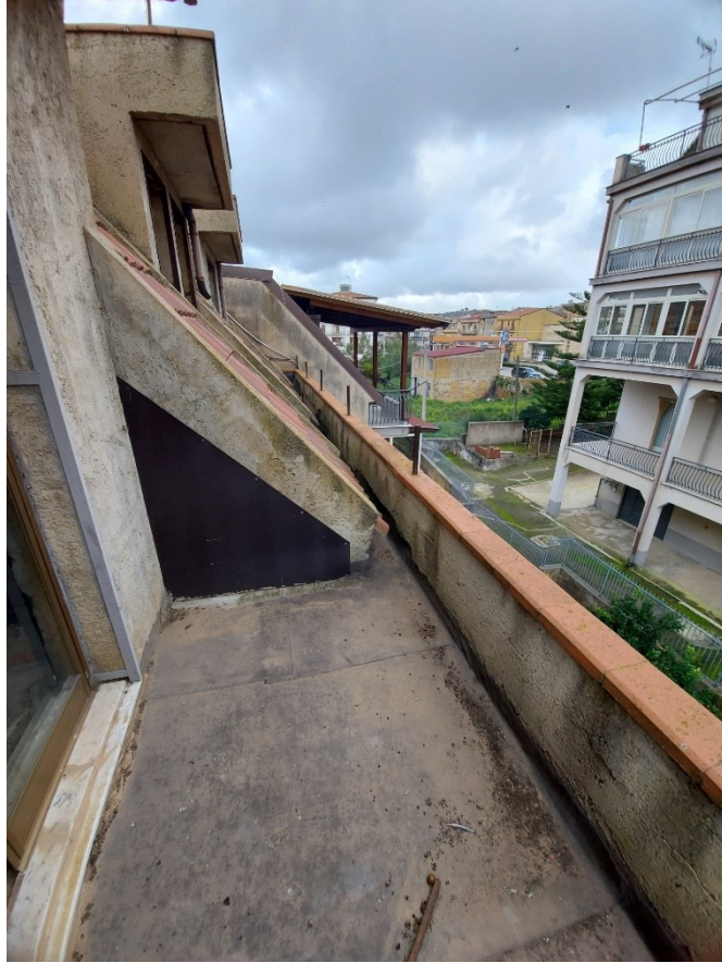
BALCONE MAGAZZINO/LOCALE DI DEPOSITO