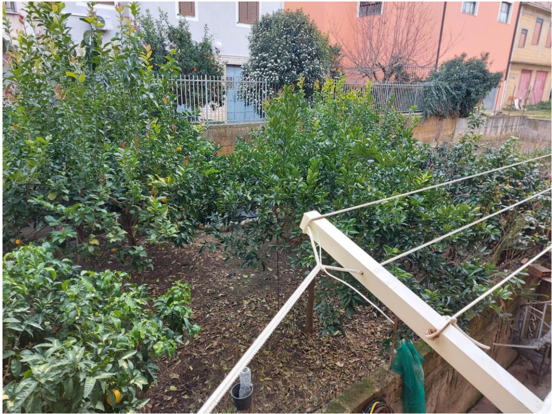
ORTO SUL CORTILE