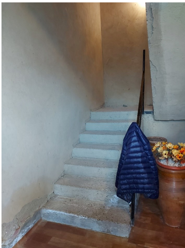
SCALA DI COLLEGAMENTO