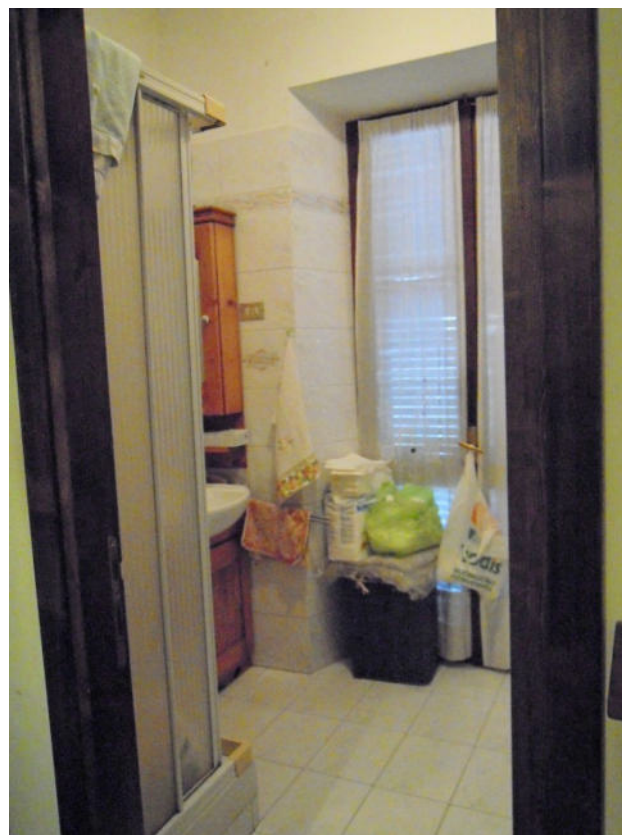
vista del servizio igienico