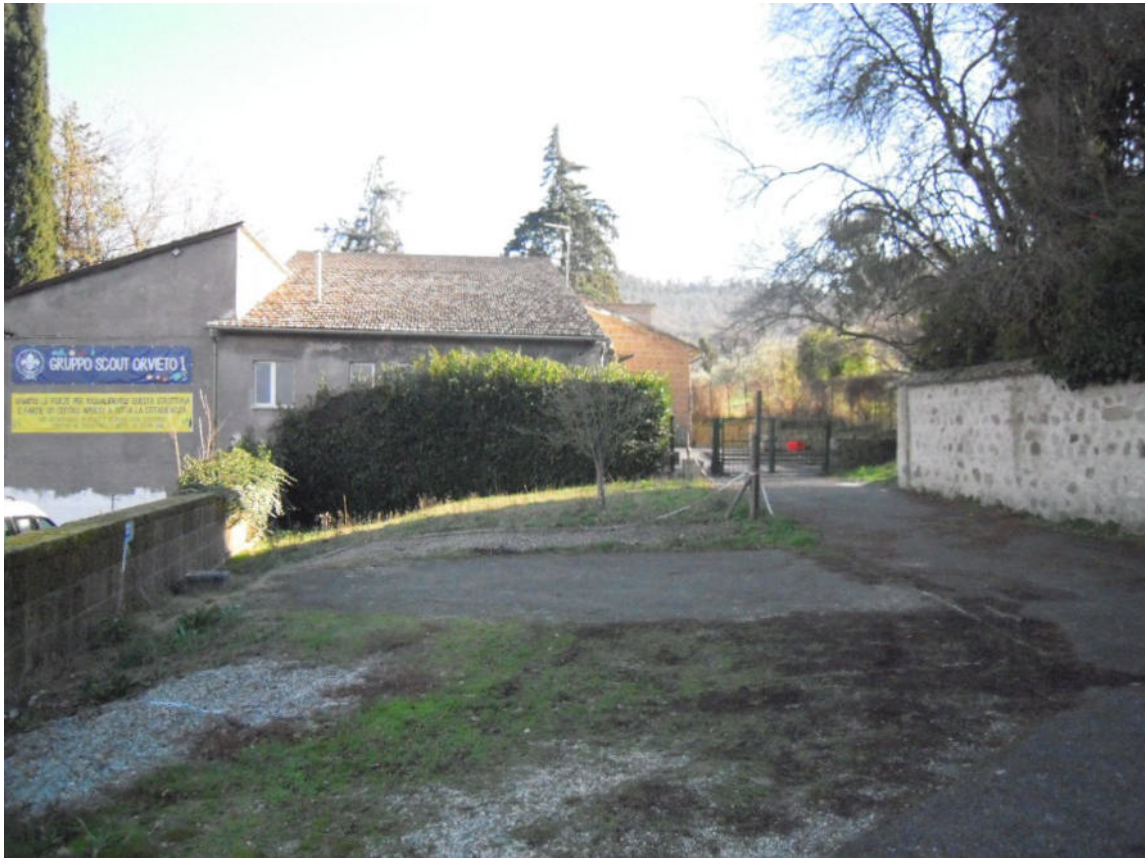
vista del terreni – ripresa da nord-ovest (dalla strada di accesso)