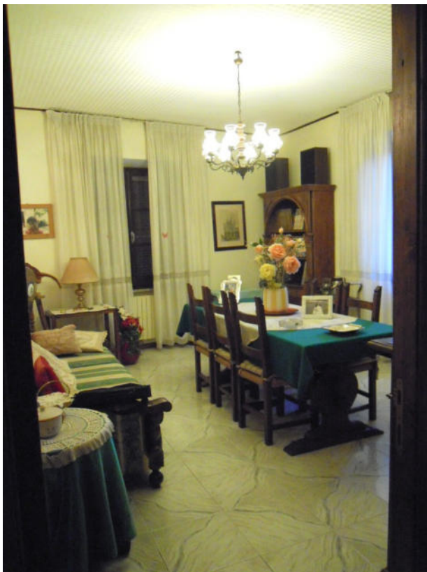
vista del soggiorno