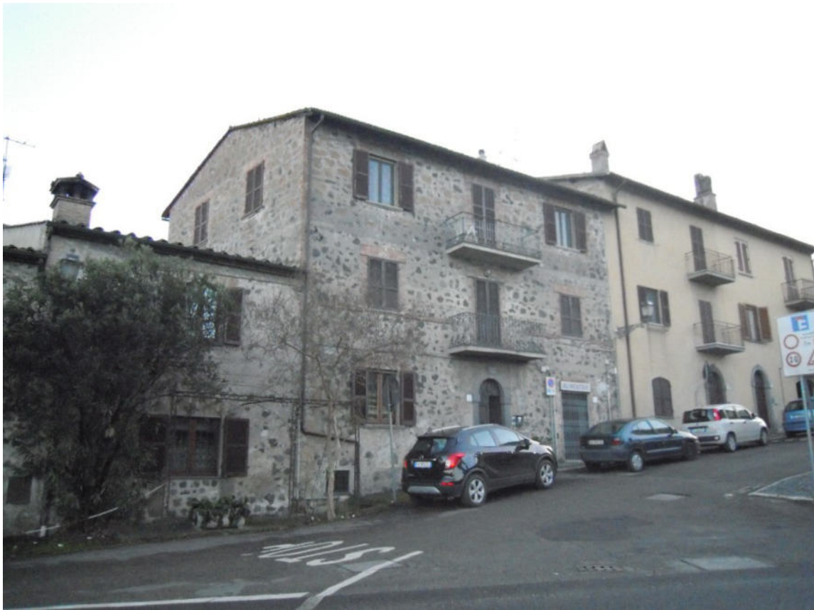
vista esterna dell'appartamento al piano 2° (ultimo)