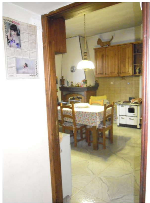
vista della cucina