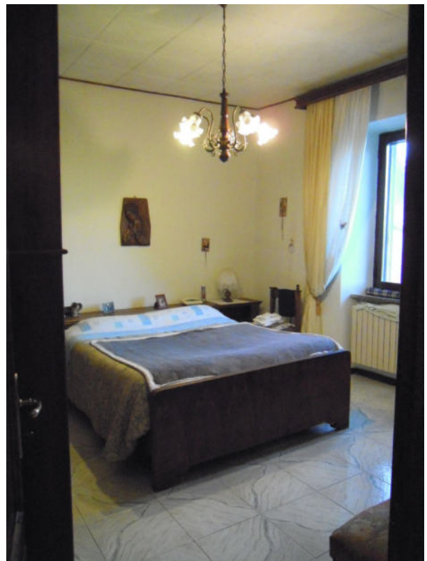
vista della camera 2