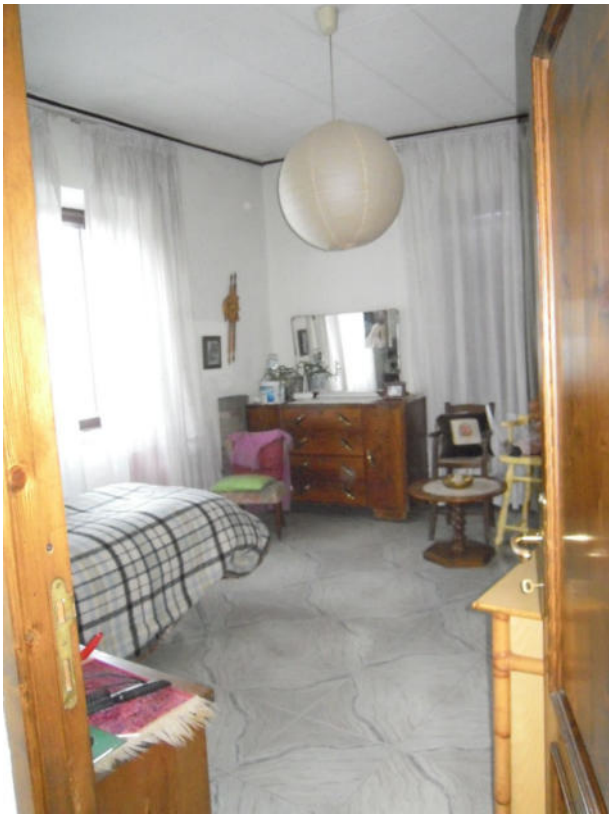
vista della camera 1