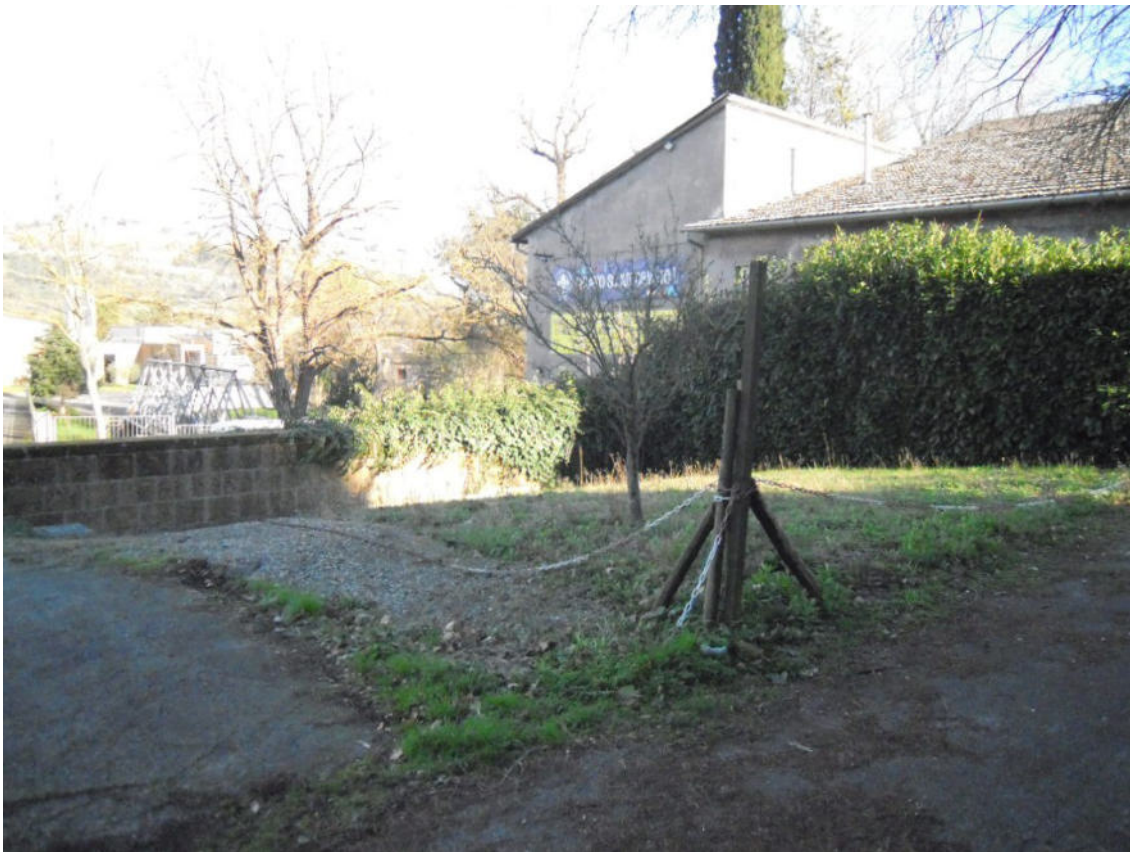
vista del terreni – ripresa da ovest