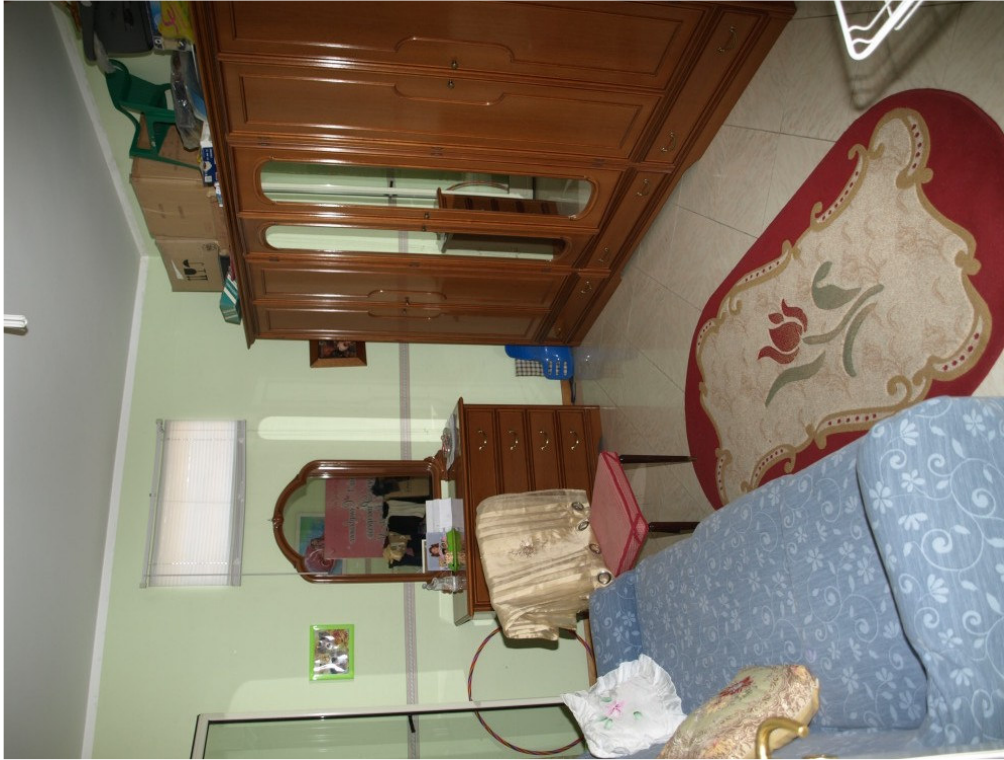
Foto n° 7 – Appartamento sito in Niscemi via G. Pitre n° 15, piano primo – Foglio 36, part. 879, sub 4 – Particolare degli interni dell'appartamento.