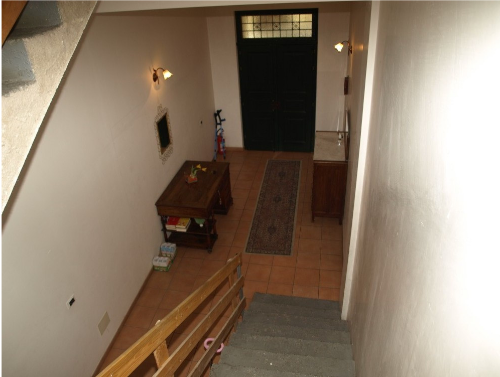
Foto n° 11 – Immobile sito in Niscemi via G. Pitre n° 15 – Foglio 36, part. 879 – Particolare dell'androne e della scala di accesso ai vari piani.