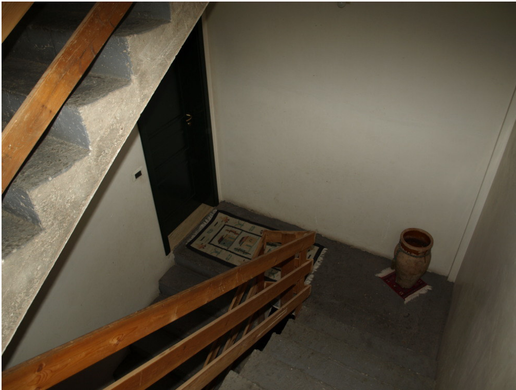
Foto n° 12 – Immobile sito in Niscemi via G. Pitre n° 15 – Foglio 36, part. 879 – Particolare della scala di accesso ai vari piani.