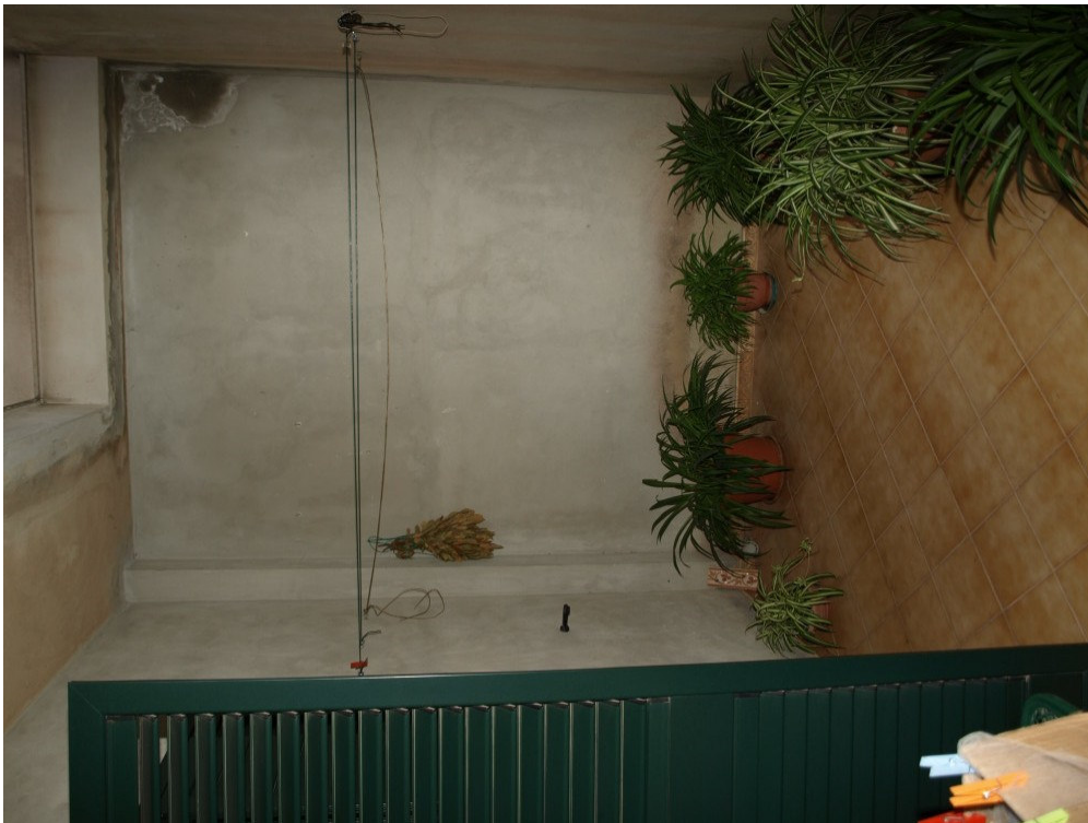
Foto n° 10 – Appartamento sito in Niscemi via G. Pitre n° 15, piano primo – Foglio 36, part. 879, sub 4 – Particolare del pozzo luce.