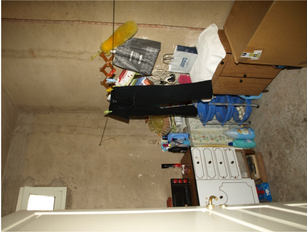
Foto n° 9 – Appartamento sito in Niscemi via G. Pitre n° 15, piano primo – Foglio 36, part. 879, sub 4 – Particolare degli interni dell'appartamento.