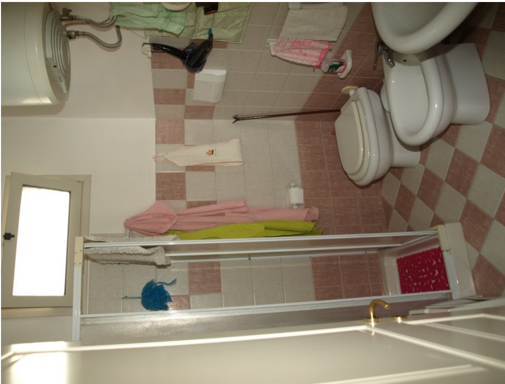
Foto n° 8 – Appartamento sito in Niscemi via G. Pitre n° 15, piano primo – Foglio 36, part. 879, sub 4 – Particolare degli interni dell'appartamento.