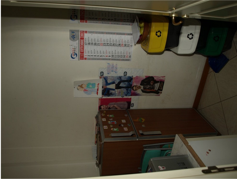
Foto n° 5 – Appartamento sito in Niscemi via G. Pitre n° 15, piano primo – Foglio 36, part. 879, sub 4 – Particolare degli interni dell'appartamento.