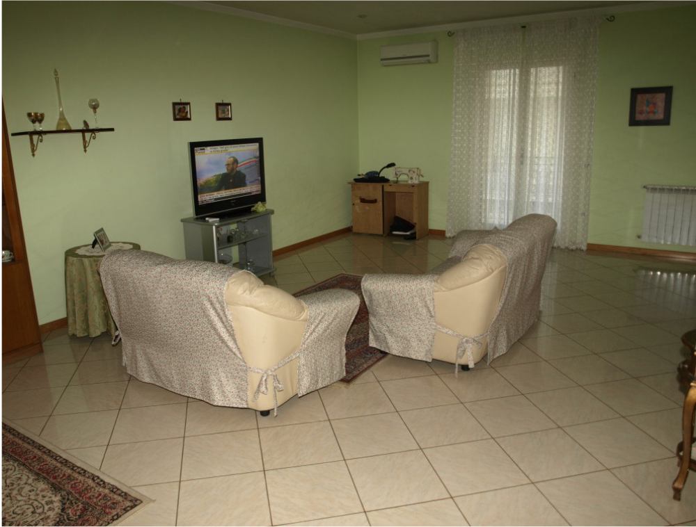
Foto n° 3 – Appartamento sito in Niscemi via G. Pitre n° 15, piano primo – Foglio 36, part. 879, sub 4 – Particolare degli interni dell'appartamento.