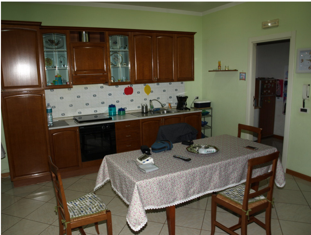
Foto n° 2 – Appartamento sito in Niscemi via G. Pitre n° 15, piano primo – Foglio 36, part. 879, sub 4 – Particolare degli interni dell'appartamento.