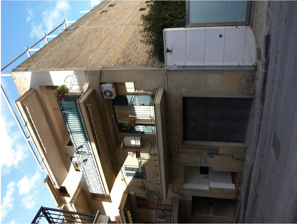
Foto n° 1 – Immobile sito in Niscemi via G. Pitre n° 15 – Foglio 36, part. 879 – Prospetto esterno su via G. Pitre.