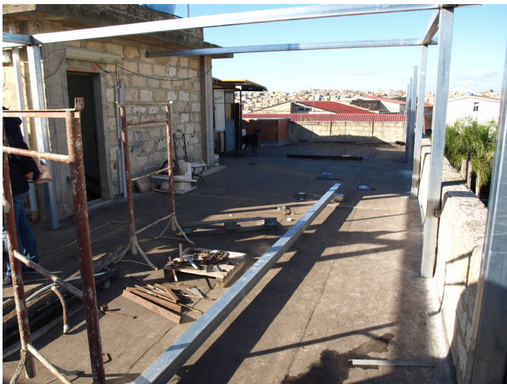
Foto n° 13 – Lastrico solare sito in Niscemi via G. Pitrè n° 15, piano terzo – Foglio 36, part. 879, sub 4 – Particolare del lastrico solare.