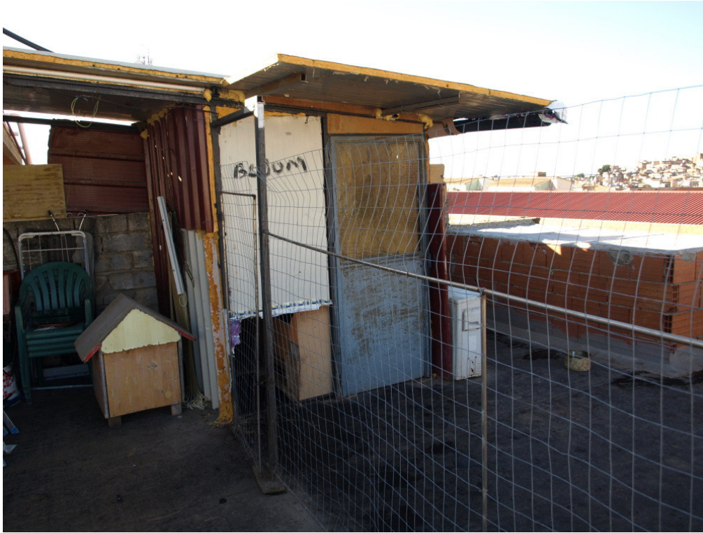
Foto n° 15 – Lastrico solare sito in Niscemi via G. Pitre n° 15, piano terzo – Foglio 36, part. 879, sub 4 – Particolare del lastrico solare.