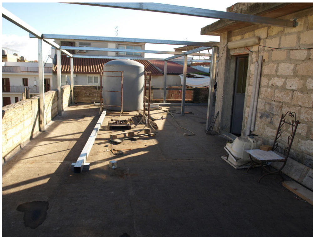
Foto n° 14 – Lastrico solare sito in Niscemi via G. Pitrè n° 15, piano terzo – Foglio 36, part. 879, sub 4 – Particolare del lastrico solare.