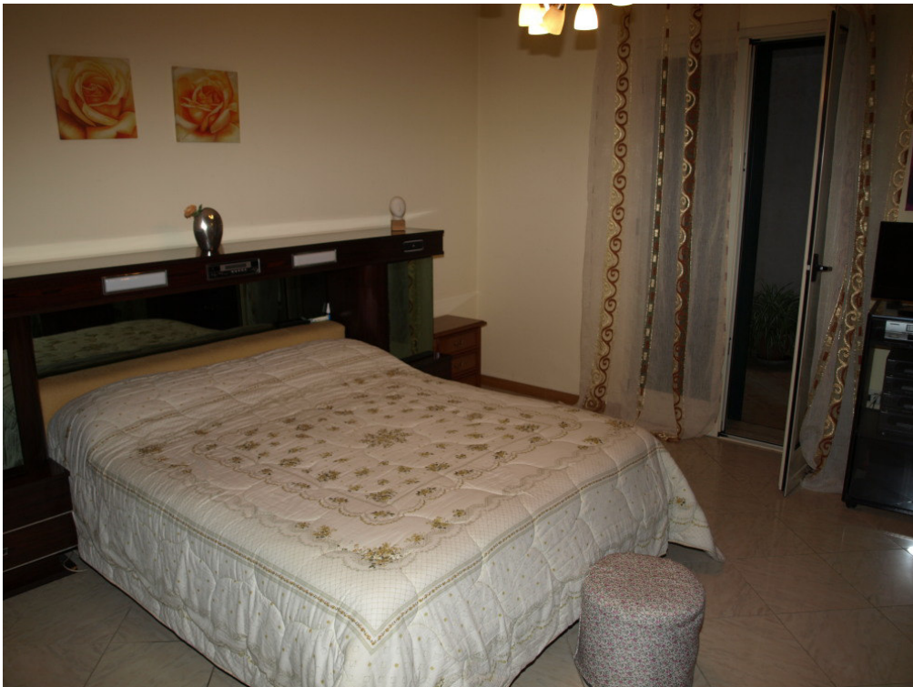
Foto n° 4 – Appartamento sito in Niscemi via G. Pitre n° 15, piano primo – Foglio 36, part. 879, sub 4 – Particolare degli interni dell'appartamento.