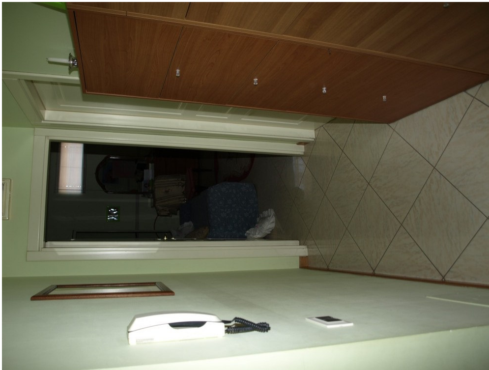
Foto n° 6 – Appartamento sito in Niscemi via G. Pitre n° 15, piano primo – Foglio 36, part. 879, sub 4 – Particolare degli interni dell'appartamento.