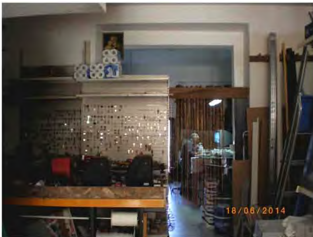
(FO) foto n. 5 – Vista interno tra vano adibito a negozio e vano adibito a magazzino del LOTTO 1: (u.n. 1.1) Negozio con pertinente scoperto – si evidenzia che tra i due vani per come da planimetria catastale doveva essere presente un muro divisorio;