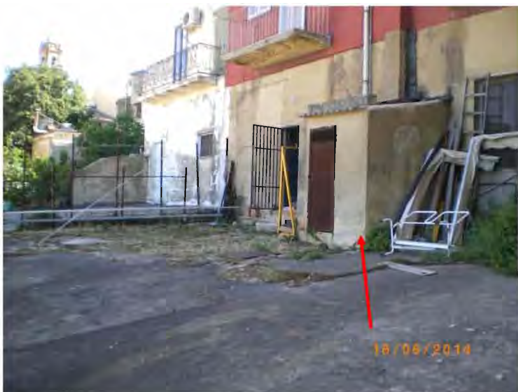
(FO) foto n. 3 – Vista prospetto retrostante prospiciente Via delle Francescane del LOTTO 1: (u.n. 1.1) Negozio con pertinente scoperto , particolare mostrante il cortile (pertinenza esclusiva, immobile in oggetto, sul quale esiste servitù passiva di posizionamento caldaie per riscaldamento domestico ad uso delle limitrofe proprietà);