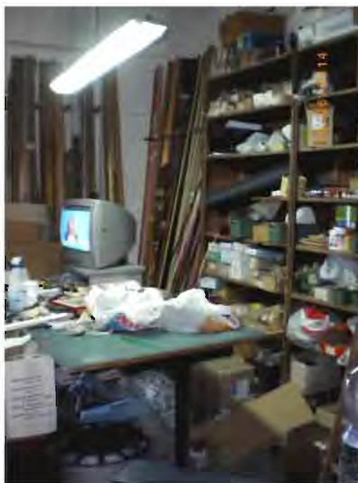
(FO) foto nn. 6 e 7 – Vista interno vano adibito a magazzino del LOTTO 1: (u.n. 1.1) Negozio con pertinente scoperto – si evidenzia l'assenza del locale antibagno adiacente a quello w.c. (indicato quest'ultimo dalla freccia rossa). Nella foto n. 6 (sinistra) si evince, in fondo, della presenza della porta che conduce al cortile di pertinenza;