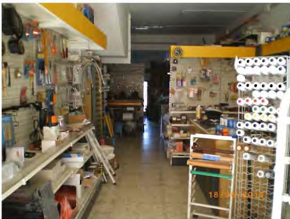
(FO) foto n. 4 – Vista interno vano adibito a negozio del LOTTO 1: (u.n. 1.1) Negozio con pertinente scoperto ;