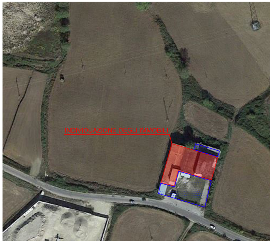
STRALCIO AEREOFOTOGRAMMETRICO scala 1:2000