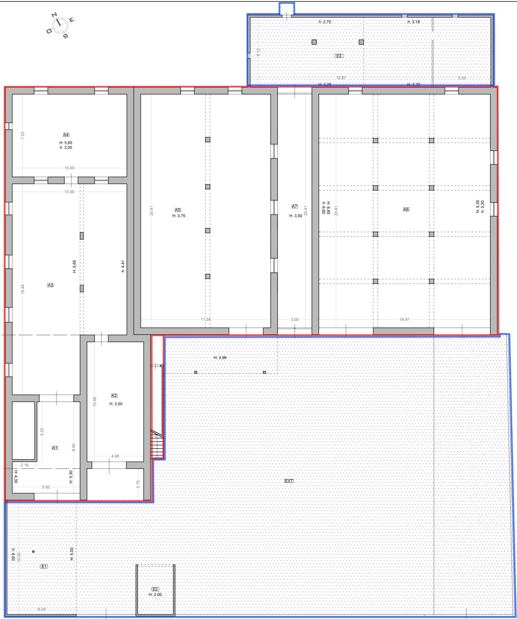
PIANTA PIANO TERRA - C.F. F25 P731 S1 scala 1:200